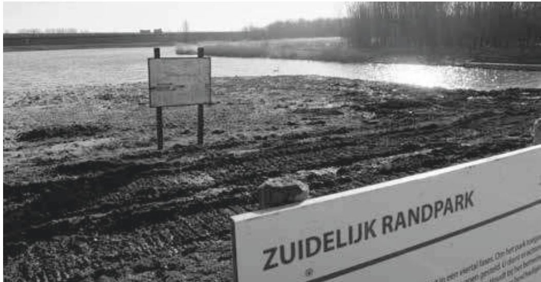
Het zuidelijk Randpark, onderdeel van de 'Blauwe verbinding', waar water van de Oude Maas en recreatie elkaar ontmoeten

is dan ook belangrijk om tussentijdse resultaten te behalen om toewijding bij stakeholders te ontwikkelen en te houden. Bovenal moeten projectmanagers zich realiseren dat grilligheid een gegeven is. Een gebalanceerde managementaanpak, inspeland op de specifieke eigenschappen van zowel project als omgeving en schakelend tussen complexiteitsreductie en absorptie, vormt de beste manier om met grilligheid om te gaan.