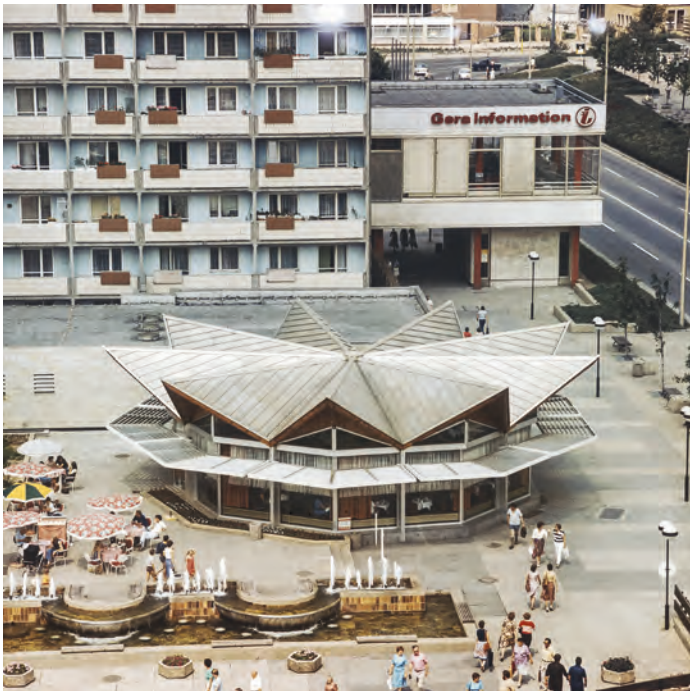
Abb. 1: Blick auf das Boulevardcafé und Gera-Information, Mitte der 1980er Jahre.