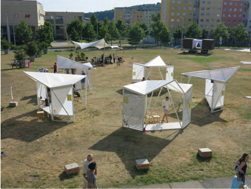
Abb. 4: Die Re-inszenierung der Zitronenpresse durch das Kollektiv Raumstation, Sommer 2017.