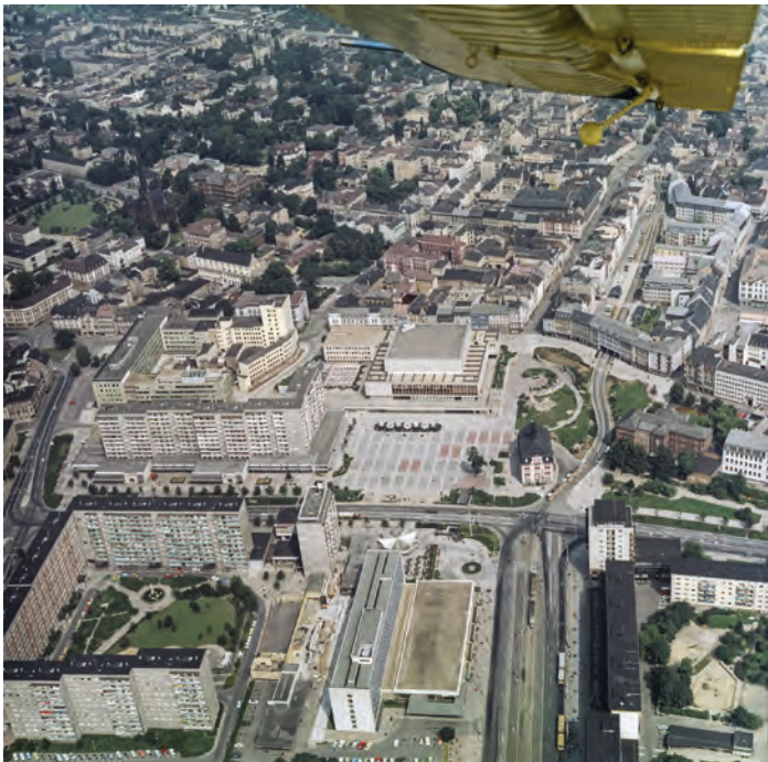
Abb. 3: Blick auf das Ensemble auf dem Zentralen Platz 1984.