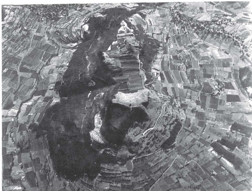
■ Luftaufnahme der Ehrenbürg von Norden.

Die Grube markieren somit Anfang und Ende der frühkeltischen Besiedlung der Ehrenbürg, einerseits mit einem Bauopfer,