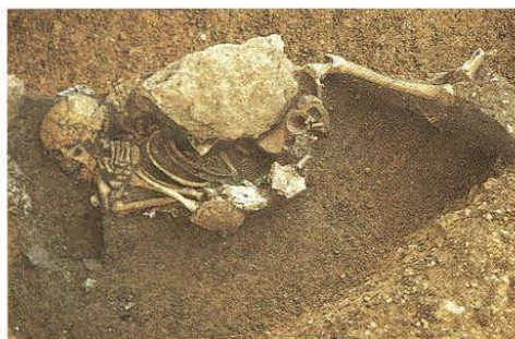
■ Grube 62, Grube 16 und Grube 19. Farbaufnahmen und Zeichnungen.

1993 untersuchten wir eine Grube, auf deren Boden das Skelett einer Frau mit unnatürlich umgebogenen Beinen lag, die offenbar eines gewaltsamen Todes gestorben war. Man hatte die Tote, wohl um sie in der Grube zu bannen, mit großen Steinen zugeeckt. Außerdem enthielt die Grube 62 ab-