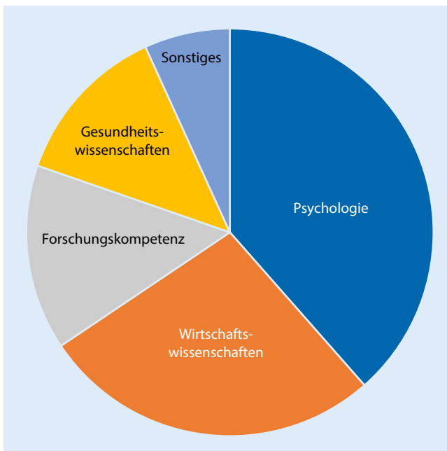
Abb. 1 ▲ Lerninhalte nach Wissenschaftsgebiet/Fach – Ausrichtung = Psychologie