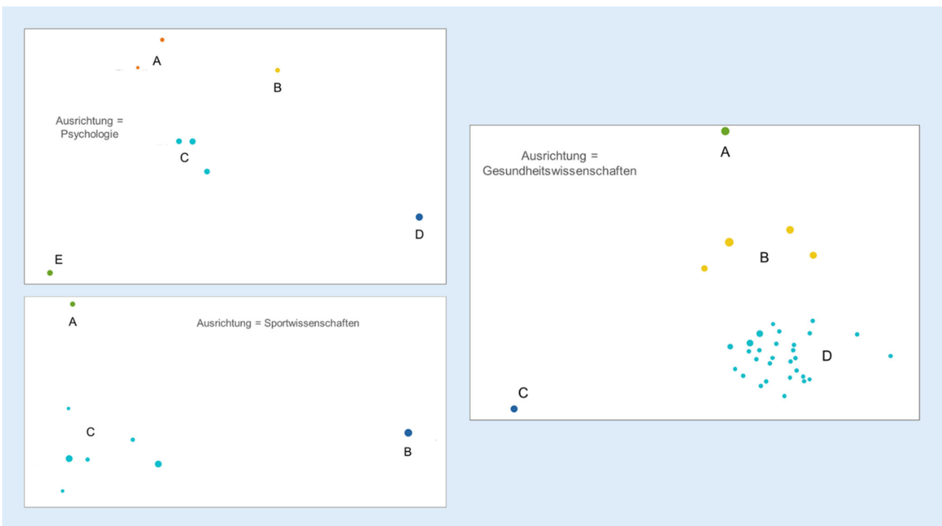
Abb. 4 ▲ Ergebnis von Clusteranalysen nach Ausrichtung