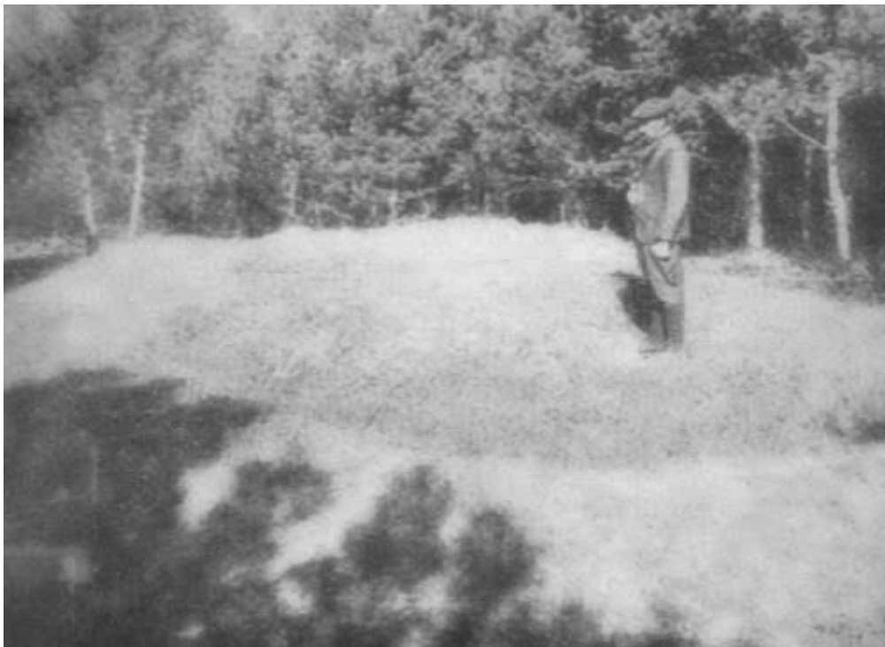
Батько читає Кадіш за своїм 8-річним сином

Гетто припинило свою роботу. Там було вбито 6000 євреїв. Живими залишилася тільки мізерна кількість євреїв у майстернях і таборах.