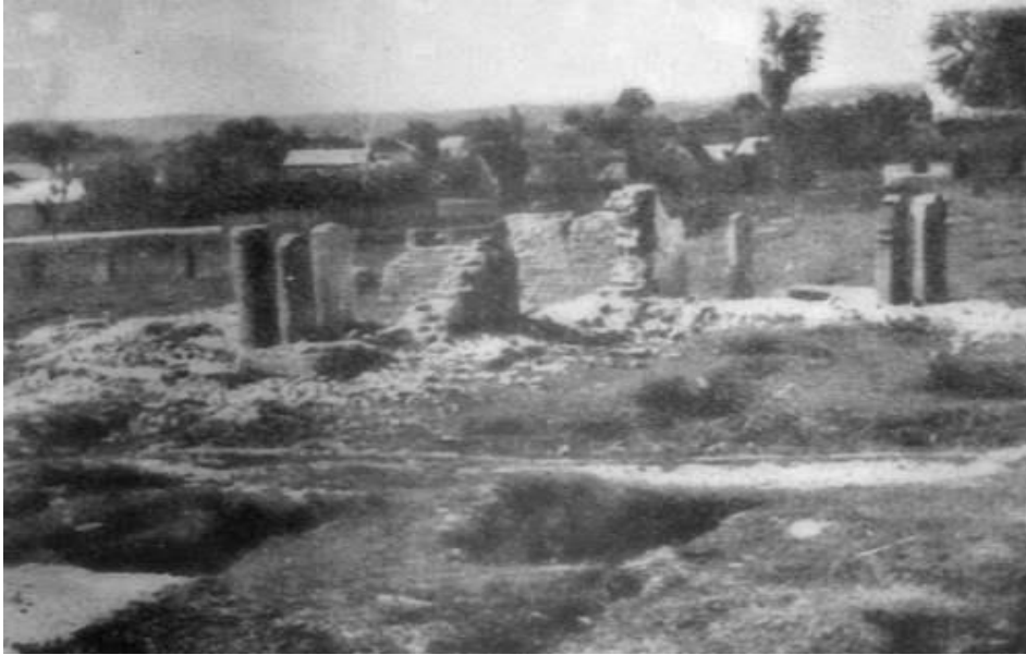
На цьому фото: руїни огеля та вцілілі надгробні плити золочівських праведників.