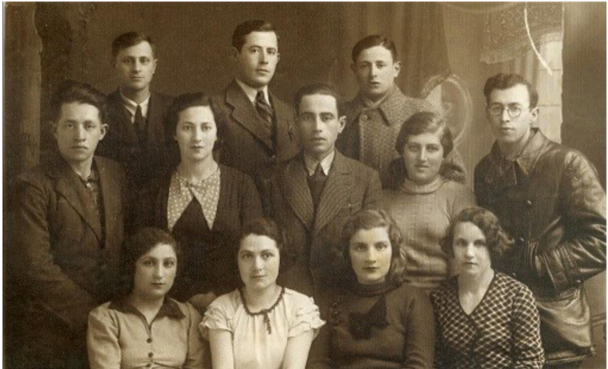
Сіоністська група євреїв Золочева, 28.05.1934.