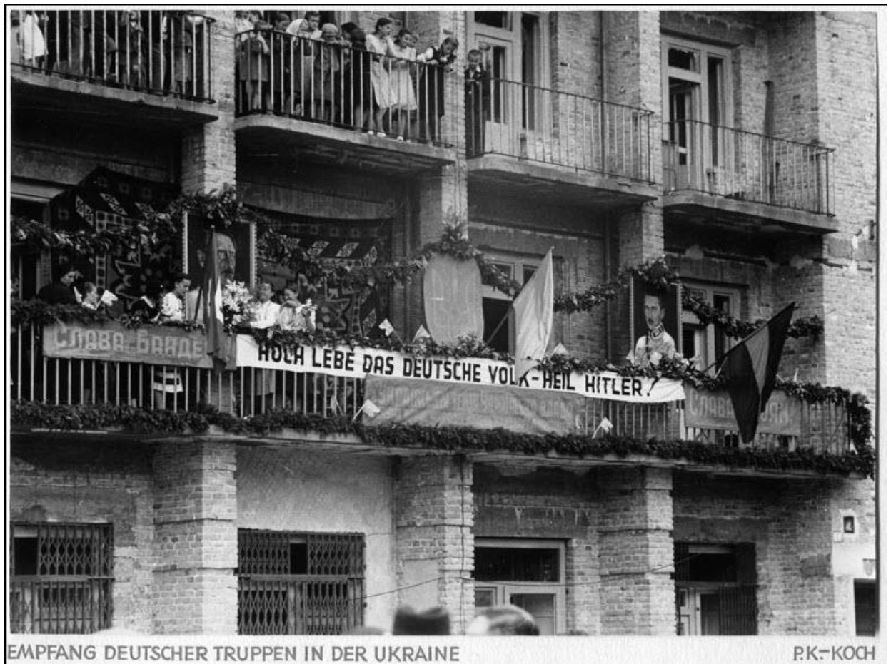
Німецьке пропагандистське фото "Приєм німецьких військ в Україні" – мітинг мешканців Золочева 6.07.1941., сучасна вул. Г.Сковороди.