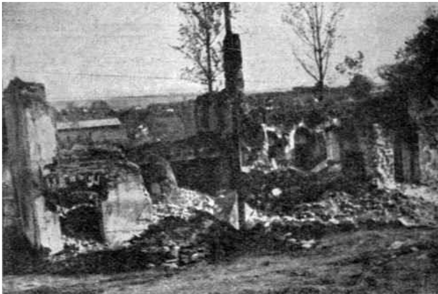
Велика синагога після розгрому, приблизно 1946-1947 рр.

English translation of this book is made available by JewishGen, Inc. and the Yizkor Book Project for the purpose of fulfilling our mission of disseminating information about the Holocaust and destroyed Jewish communities.