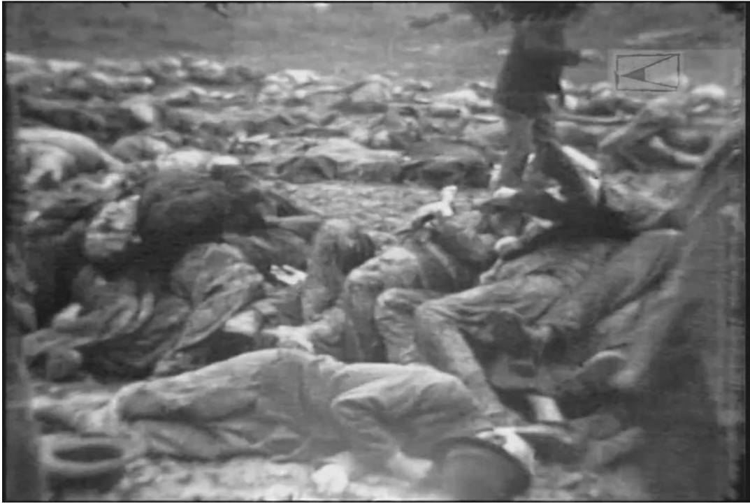
Тіла убитих євреїв Золочева біля Замку, 3-4.07. 1941 р. Стоп-кадр німецької кінохроніки.