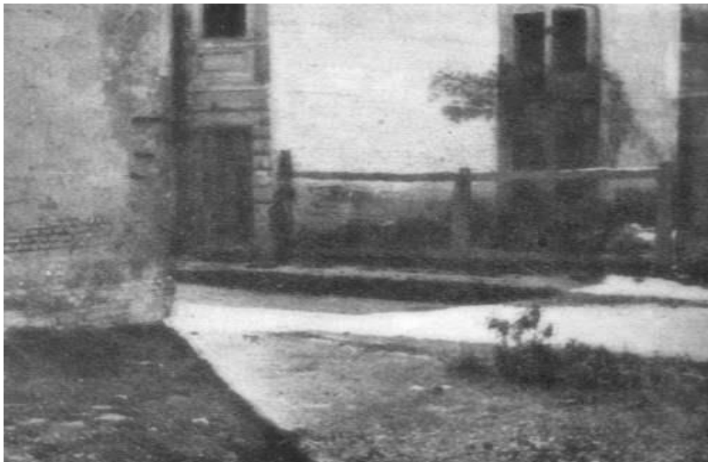
Стіна, біля якої відбувалися страти після ліквідації гетто Цей будинок належав Вольфу Розену та стояв між Зеленим ринком та вул. Ормянска.

Де б вони не знаходилися: у Європі чи Америці, у Ерец Ізраель чи в Санта-Домінго, їх необхідно притягнути до відповідальності. Винні мають бути покарані, а невинні – реабілітовані.