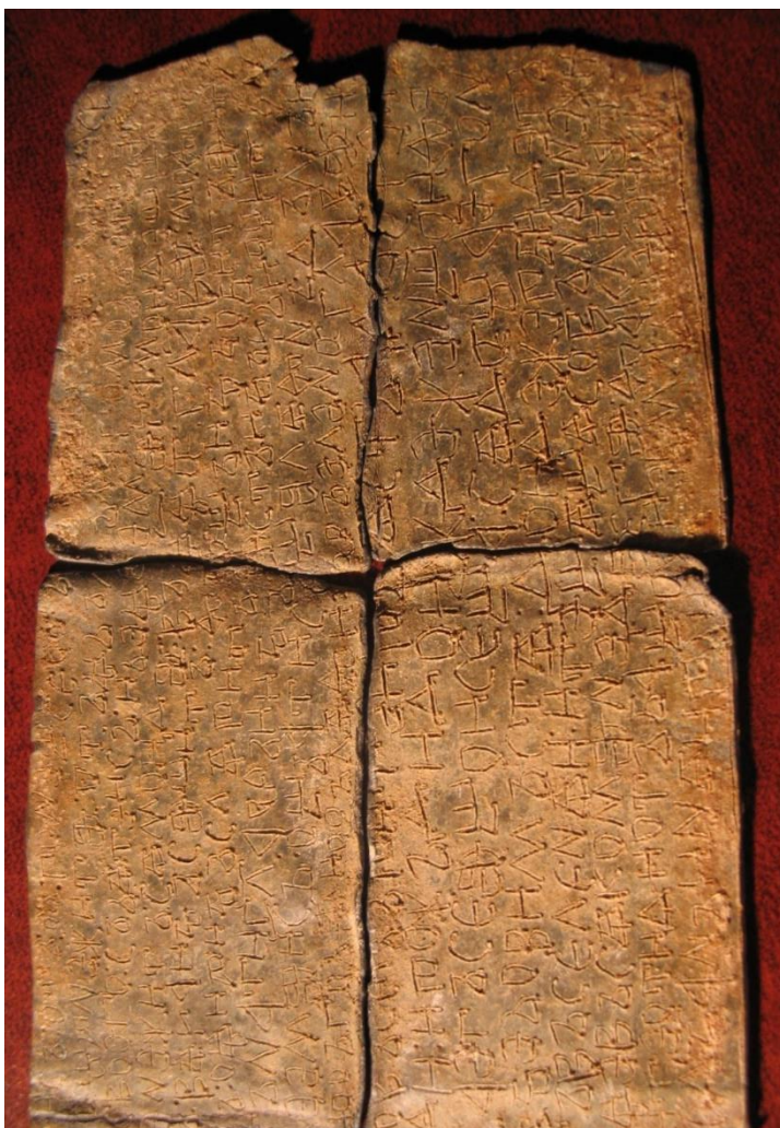
Abbildung 4: Rechte Seite