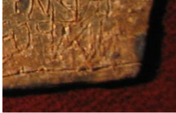
Abbildung 7: Ecke rechts unten

Textes , sondern an das Ende des ganzen Amuletts (die äußerste rechte untere Ecke)? Dann stünde es dort genau richtig (vgl. Abb. 7): 31