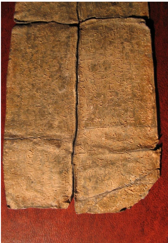
Abbildung 3: Linke Seite