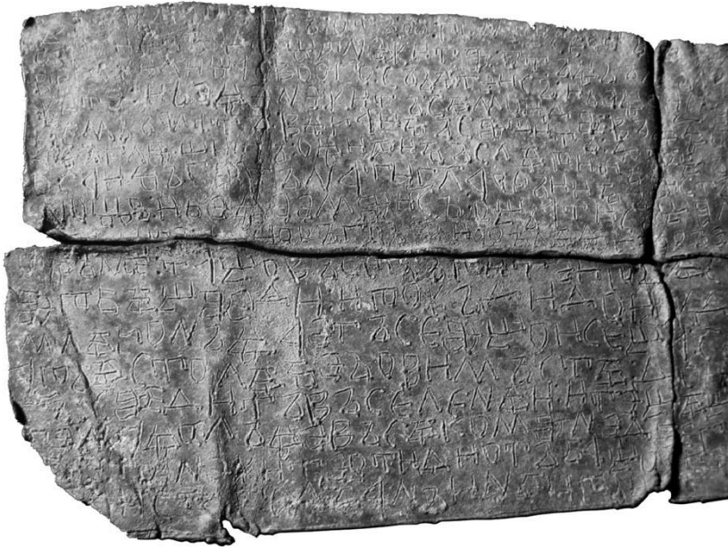
Abbildung 1: Das Kärđžali-Amulett nach Popkonstantinov (2009, 351)

Der Abdruck der Photographie war von mäßiger Schärfe und Auflösung, sie erlaubte jedoch eindeutig den Befund, dass es sich hier um eine Aufnahme des lang gesuchten Originals handelte, d. h. der Urgrundlage unserer Abschrift (1992) wie auch der Kärđžali-Abschrift (2002). Auffällig an der Photographie, die keineswegs amateurhaft, sondern eher wie eine einigermaßen professionelle Aufnahme etwa eines Museums wirkte, war