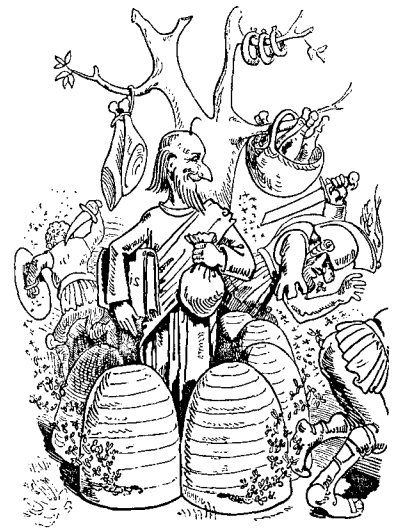
Freudlich lächelt Vergil, umhüllt von sumfenden Bienen; Über die nutzliche Schaar härtiger Krieger entseucht!

Dem Mittelalter galt Vergil nicht allein als der größte römische Dichter, sondern als der Dichter schlechthin. In den Klosterschulen war er der meistgelesene klassische Autor, der vor allem für den sprachlichen, grammatikalisch-rhetorischen Unterricht unentbehrlich war. Für die Dichter blieb er eines der einflußreichsten Vorbilder.