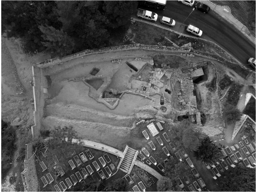
Abb. 4: Blick auf Areal I der Ausgrabungen des DEI Jerusalem auf dem Zionsberg in Jerusalem © DEI.

senzeitliche Wohnbebauung grundlegend. Man tut gut daran, die Spannung zwischen exegetischen Fragen und archäologisch gesicherten Aussagen auszuhalten und nicht durch einen vorschnellen Spagat in eine subjektiv wünschenswerte Richtung zu lenken.