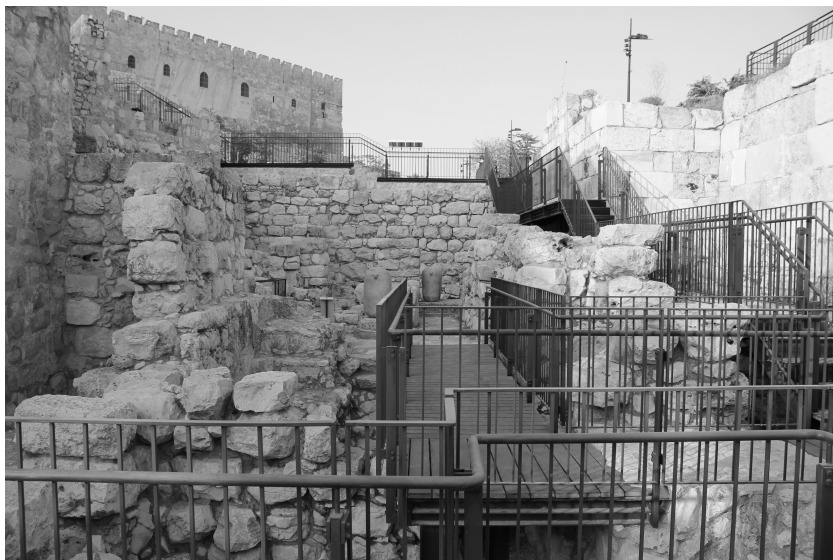
Abb. 3: Jerusalem, Ophel-Grabungsbereich © Katja Soennecken.

wird daher nicht von vornherein zum Gesamtkomplex gehört haben. Die Mauer IV (›gerade Mauer‹) verlief etwa 80 m entfernt von der Mauer des Haram esch-Scharif. Sie wurde an das ›königliche Gebäude‹ angebaut, wie vor Ort unschwer zu erkennen ist, und liegt in der gleichen Flucht wie das Torgebäude (III; ›Toranlage‹) – jedoch geringfügig nach außen versetzt. Offen bleibt, ob das Tor III als Eingang in die Stadt, in einen Stadtteil oder zu einem speziellen Gebäudekomplex diente.