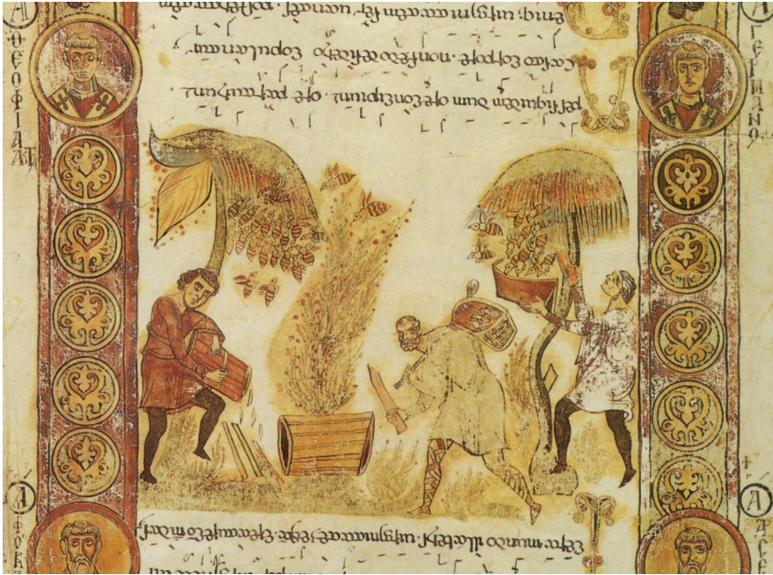
Abb. 1 | Bienenlob, Exultet Bari 1, nach 1025, Bari, 525 × 39,7 cm. Bari, Archivio del Capitolo Metropolitano, Museo Diocesano. In: Cavallo, Orofino u. Pecere 1994, S. 139.

vergegenwärtigten. 15 Des Weiteren besingt das beneventanische ‚Praeconium paschale‘ das Schöpfertum Gottes bzw. Christi und verweist damit auch auf das Wiedererwachen der Natur im Frühling. In der Präfation wird dieser göttliche Schöpfungsakt mit dem Fleiß der Bienen in eins gesetzt, da diese unermüdlich und mit höchster Kunstfertigkeit für das Wohl aller Artgenossen arbeiten würden. 16