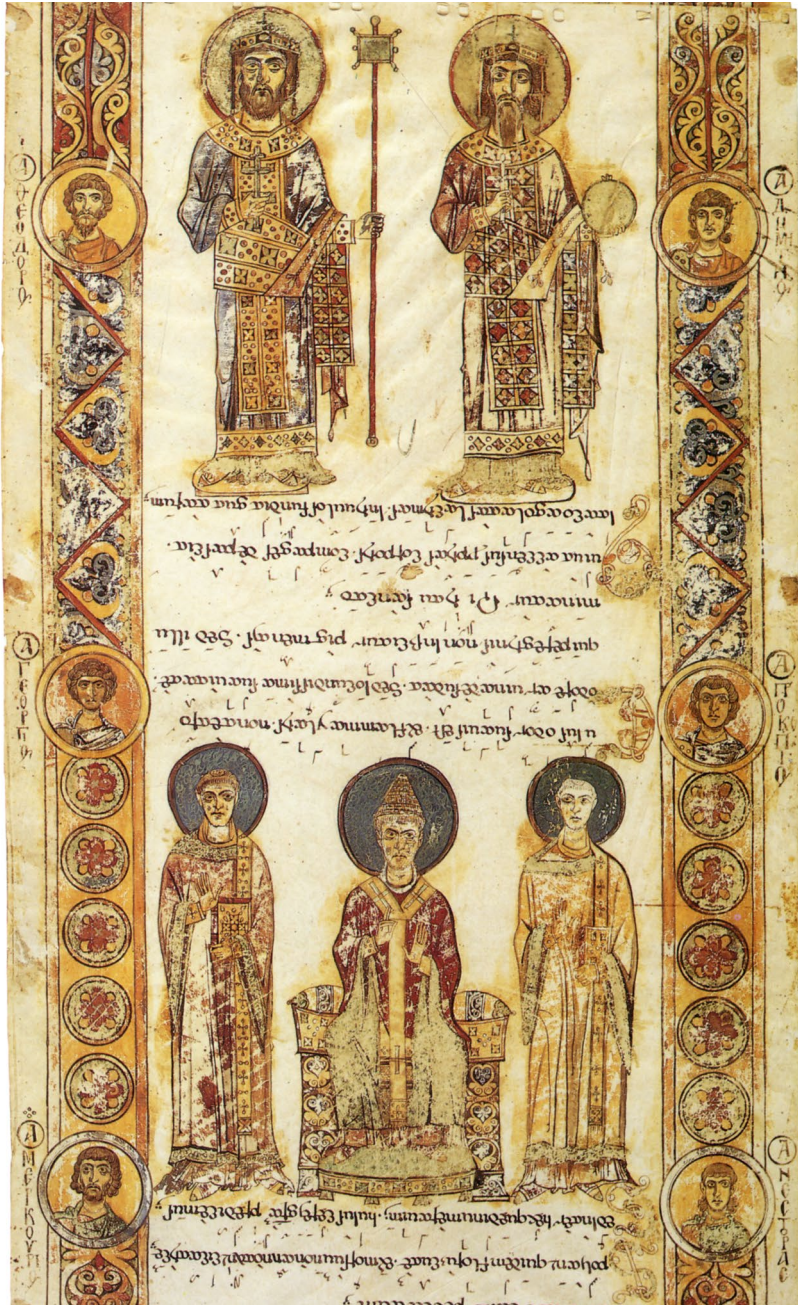
Abb. 2 | Weltliche und geistliche Herrscher, Exultet Bari 1, nach 1025, Bari, 525×39,7 cm. Bari, Archivio del Capitolo Metropolitano, Museo Diocesano. In: Cavallo, Orofino u. Pecere 1994, S. 140.