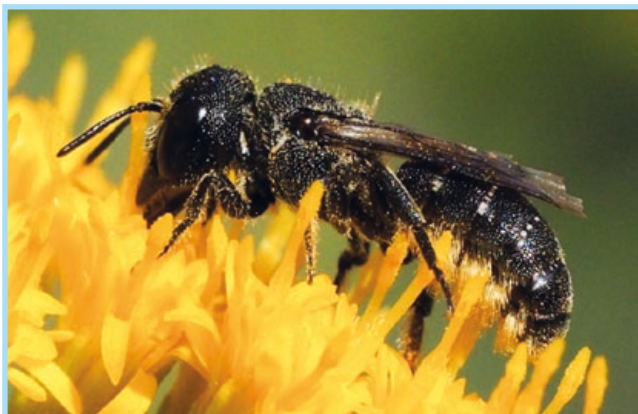
Abb. 1. Die spezialisierte Löcherbiene ( Heriades truncorum ). Ihre mittlere Flugentfernung beträgt nur 73 m (HOFMANN, FLEISCHMANN, & RENNER, 2020), d.h. alle Habitatsbedingungen (Korbblütler als Nahrungsquelle, Nistmaterial, Nistplatz) müssen in diesem Umkreis erfüllt sein.

Das globale Artensterben und der Klimawandel sind die großen Herausforderungen unserer Zeit. In der Bevölkerung erhält der Verlust der Artenvielfalt im Vergleich zu den Auswirkungen des Klimawandels recht wenig Aufmerksamkeit. So nannten in einer Befragung von Studierenden (N= 67, Lehramt Biologie, nicht veröffentlicht) nach den gesellschaftlichen Herausforderungen unserer Zeit beispielsweise 100% den Klimawandel und nur 23% den Verlust der Artenvielfalt. Unzählige Arten von Pilzen, Pflanzen und Tieren schaffen eine einmalige Biodiversität und tragen maßgeblich dazu bei, dass lebenswichtige natürliche Kreisläufe und Prozesse ablaufen können.