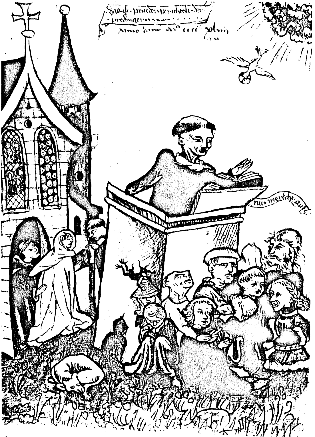
Spätmittelalterliche Predigtszene im Freien mit Darstellung des Berthold von Regensburg. Handschrift des 15. Jahrhunderts. Wien, Österreichische Nationalbibliothek.