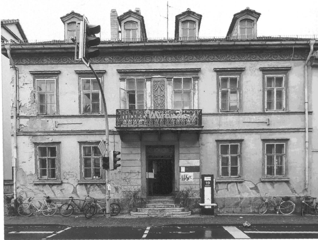
1 »Original«? Weimar, Marienstraße 10, klassizistisches Wohnhaus (Einzeldenkmal), Ostansicht vor der Sanierung (Aufn. 2011)

wordensein« 4 durch die Zeiten als Grundcharakteristikum von Denkmalobjekten. Ähnlich argumentiert Alfred Schmidt in seinen Reflexionen über »Echtheitsfetischismus« und verweist auf den Austausch von Substanz durch Instandhaltung, Reparatur und Umbau als Teil des Zeugnischarakters (Abb. 1 und 2). 5 Unmissverständlich stellt auch Hartwig Beseler klar, dass es einen Originalzustand nicht geben könne, denn es gebe nun einmal keine »unhistorische Substanz« 6 . Weitere Beispiele für die Relativierung der »Originalsubstanz« ließen sich anführen. Sie stelle jedoch den Wert, den die Denkmalpflege der Substanz einräumt, nicht grundsätzlich in Frage. Im Energieeinspardiskurs kommt nun der Substanz eine ambivalente Rolle zu: Einerseits stellt sie mit Blick auf die unter Laborbedingungen erzeugten Normwerte den energetischen