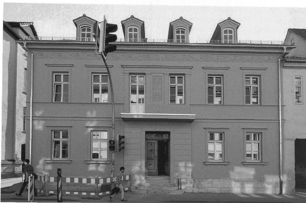
2 »Substanz«? Weimar, Marienstraße 10, klassi- zistisches Wohnhaus (Einzel- denkmal), Ostansicht nach der Sanierung (Aufn. 2015)

trächtigung des Denkmalwertes. 9 Vor dem Hintergrund der Stadtsanierung entwickelte sich mit dem Paradigma der erhaltenden Erneuerung aber auch ein über die restauratorische Praxis hinausreichendes Materialbewusstsein. Mit der Einrichtung der Bauarchive und Restaurierungswerkstätten begann die Denkmalpflege, sich bautechnisches und handwerkliches Wissen wieder anzueignen. 10 Am deutlichsten zeigt sich diese Aufwertung der Substanz in der Wiederentdeckung des selektiven Rückbaus, also der Bergung von Baumaterialien zur Wiederverwendung. Einem breiteren Publikum wieder bekannt machte diese Praxis Mila Schraders Fallstudie zum selektiven Rückbau des denkmalgeschützten Tabaklagers in Herbolzheim in den 1990er Jahren. 11 Auch wenn er nichts anders als den Abbruch und damit den Verlust des Denkmals in seiner geschlossenen, materiellen Präsenz bedeutet, lässt sich der selektive Rückbau in letzter Konsequenz doch als denkmalgerechte Alternative verstehen. So könnte man in ihm auch die ressourcenökonomische Fort-