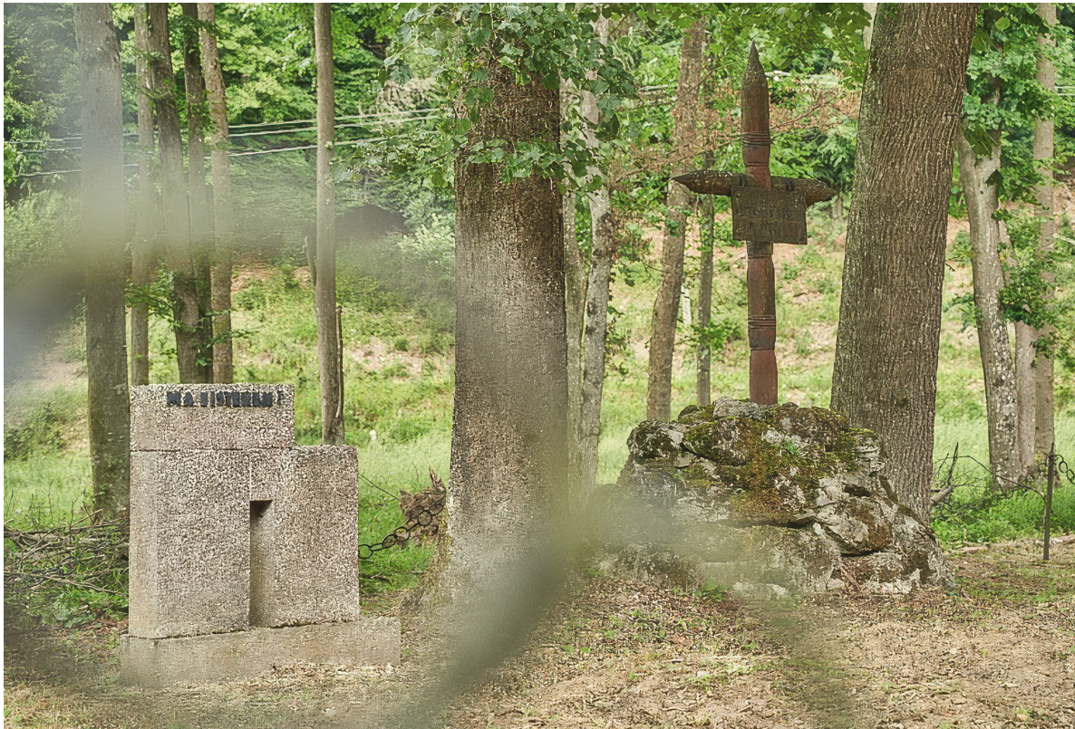
Abb. 3 Die Gedenkstätte in Dubnica nad Váhom erinnert an die Roma-Opfer, die hier im Februar 1945 ermordet wurden.

und Vydrovo bei Čierny Balog ermordet. 28 Die meisten Tötungen fanden in der Umgebung von Banská Bystrica statt, insbesondere in Kremnička, Nemecká und Zvolen. In allen diesen Orten wurden Roma ermordet. Kremnička war eine der größten Massenexekutionsstätten; von Anfang November 1944 bis März 1945 fanden hier Ermordungen statt. Mindestens 47 Roma aus der Umgebung von Banská Bystrica und Krupina wurden dort getötet, ebenso 109 Roma aus der Siedlung Ilija. 29