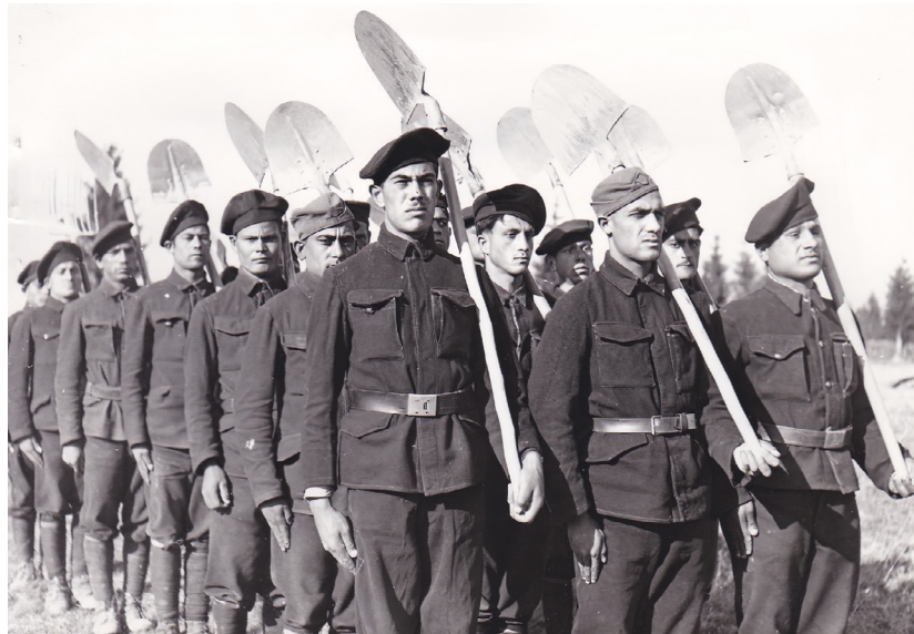
Abb. 2 Roma bei der Ausübung der Arbeitspflicht (1941).

und Juden festgelegt, um sie von der regulären Armee zu unterscheiden. In diesen Anweisungen hieß es: „Im Falle des Arbeitsdienstes der Juden und Zigeuner werden die Abzeichen auf jeden Fall entfernt, was bereits einen wesentlichen Unterschied zu den regulären Truppen darstellt“. 13 Schließlich wurde die Arbeitspflicht für Juden