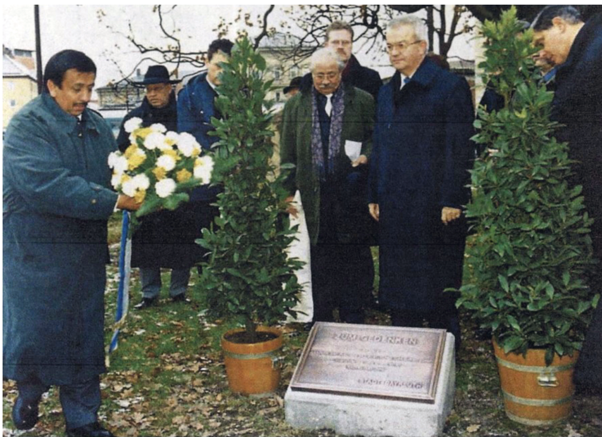
Enthüllung des Mahnmals am Bayreuther Hauptbahnhof am 16.12.1999:

„Meine sehr geehrten Damen und Herren, für uns, die wenigen Überlebenden des Holocaust, hat es eine wirkliche Befreiung niemals gegeben. Es gibt Erlebnisse und Erinnerungen an jene Zeit, die man nie wieder los wird – die immer wiederkehren in unseren nächtlichen Träumen. Für mich, der ich heute in Bayreuth lebe, ist es daher ein ganz besonderes Ereignis, wenn wir heute an diesem Ort eine Gedenktafel für die von den Nationalsozialisten deportierten und ermordeten Bayreuther Sinti enthüllen können.“ 3