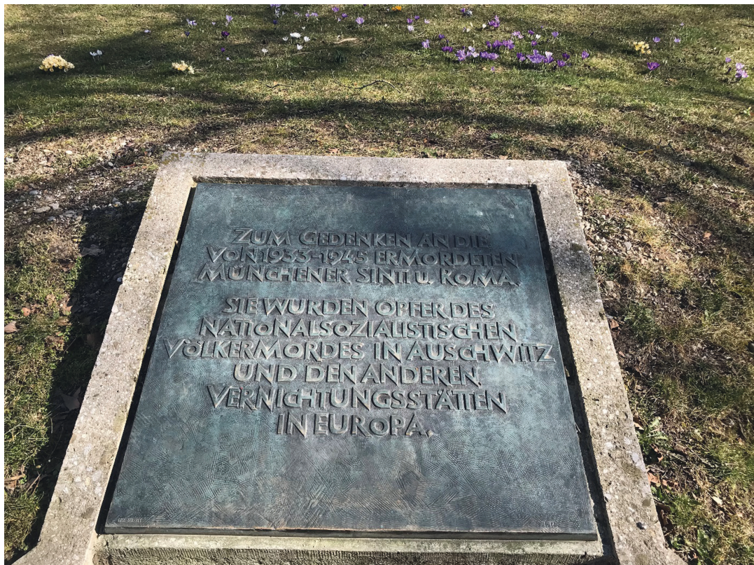
Abb.3: Gedenkort am Rand des Platzes der Opfer des Nationalsozialismus in München, private Fotografie

Der Standort an der Polizeiwache musste von den Initiatoren zugunsten einer Realisierung des Gedenkortes verworfen werden. Nach weiteren Diskussionen sowie Eingaben und politischem Druck des Zentralrats Deutscher Sinti und Roma wurde schließlich im Jahr 1995 ein Gedenkstein eingelassen, jedoch ziemlich unscheinbar und peripher am äußeren Rand des Platzes für die Opfer des Nationalsozialismus.