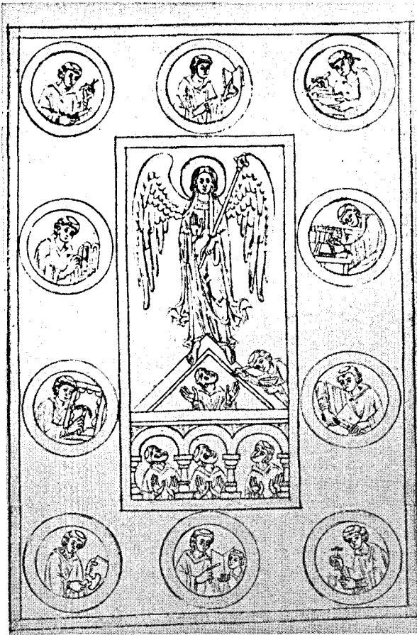
Bamberg. Federzeichnung einer Handschrift des 12. Jh.s aus dem Benediktinerkloster Michelsberg mit Darstellung der Buchherstellung.