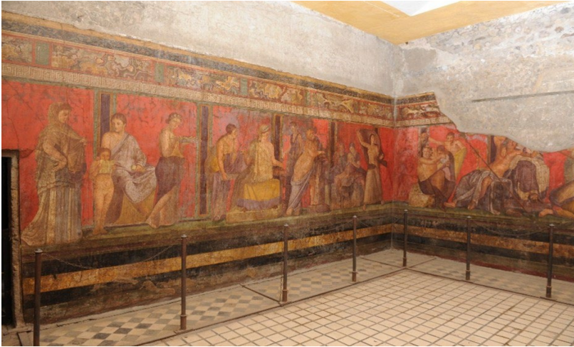
Abb. 2: Mysterienvilla, Pompeii, Großer Fries, Nordwand, Mitte des 1. Jahrhunderts v. Chr.

Schriftrolle. Es folgt eine Gruppe von vier Frauen. Die erste schreitet voran und bringt ein Tablett, auf dem eine Art Gebäck liegt, eine weitere hält einen Gegenstand. Neben ihr sitzt – in Rückansicht dargestellt – eine Frau auf einem Hocker und hebt mit der linken Hand aus einem Korb ein Tuch, das ihr eine andere Frau überreicht. Die Frau rechts besprengt einen kleinen Zweig oder ihre Hand mit einer hellen Flüssigkeit – ob es Wasser, Wein oder Milch ist, lässt sich nicht entscheiden. Eine weitere Gruppe führt Personen aus dem mythologischen Bereich vor: ein älterer Silen, ein Pan und eine Paniska (weiblicher Pan). Während der Silen seinen Gesang auf der Leier begleitet, sitzt das Pan-Paar auf einem Felsen in idyllischer Atmosphäre: Er hält seine Syrinx spielbereit in der Hand und die Paniska stillt eine Ziege. Konträr zu dieser friedlichen Szene wirkt eine nach links fliehende Frau, deren dynamische Bewegung durch die velificatio des Gewandes, das wie ein Segel gespannt ist, betont wird.