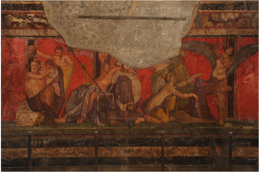
Abb. 3: Mysterienvilla, Pompeii, Großer Fries, Westwand, Mitte des 1. Jahrhunderts v. Chr.

Auf der dem Eingang gegenüberliegenden Westwand kann trotz der Zerstörung der Malerei im oberen Teil in der Mitte die Szenerie erschlossen werden (siehe Abb. 3). Auf der linken Seite sieht man eine weitere Gruppe, bestehend aus einem älteren Silen und zwei jungen Satyrn. Der Silen hält einen großen silbernen Becher, dessen Öffnung er einem jungen Satyr zugewandt hat. Der zweite Satyr im Hintergrund hält eine Theatermaske betont in die Höhe. Neben ihm sitzt der betrunkene Bacchus, der bereits eine Sandale verloren hat und seinen Kopf an die hinter ihm sitzende Frau, vermutlich Ariadne, lehnt. Rechts neben dem Götterpaar kniet eine Frau auf dem Boden und zieht das Tuch von dem liknon , einem Korb mit Opferfrüchten und einem riesigen Phallus. Hinter ihr stehen zwei Frauen, von denen eine ein Tablett mit kleinen Zweigen in der Hand hält. Daneben ist eine geflügelte Dämonin positioniert, die die Aufmerksamkeit auf sich zieht. Sie hat einen Stab in der Hand, mit dem sie nach