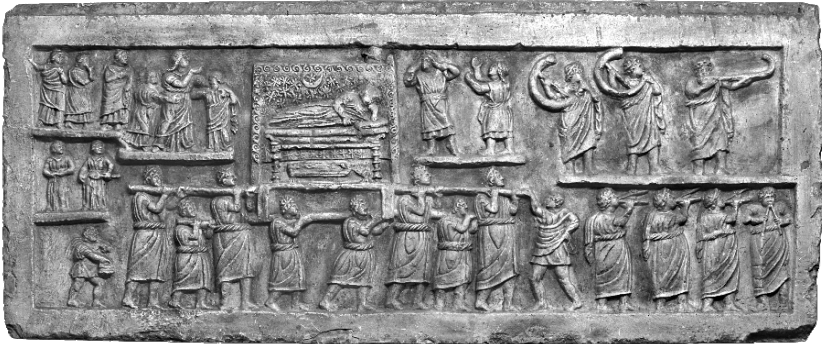
Abb. 1: Relief mit der Darstellung einer pompa funebris aus Amiternum, 1. Jahrhundert v. Chr.

Bei jeder Beschäftigung mit der Bedeutung von Klängen steht man vor dem methodischen Problem, dass sich die Klänge selbst nicht mehr verifizieren lassen, da diese bekanntlich an den Faktor Zeit geknüpft sind. Diesem Verlust gegenüber steht – wie gesehen – die reiche Überlieferung zu Klang und Musik und deren Kontexten, die hier als Klangräume verstanden werden. Bevor sich aber spezifische Klangräume systematisch rekonstruieren lassen, sollte man sich in einem ersten Schritt kritisch mit der medialen Transformation von Klängen als ‚gehörtem Schall‘, also der Umsetzung von sound in das Medium Bild oder Text auseinandersetzen. Diese Quellenkritik schließt auch den Kontext ein, der nicht mit dem Dargestellten identisch sein muss. 23