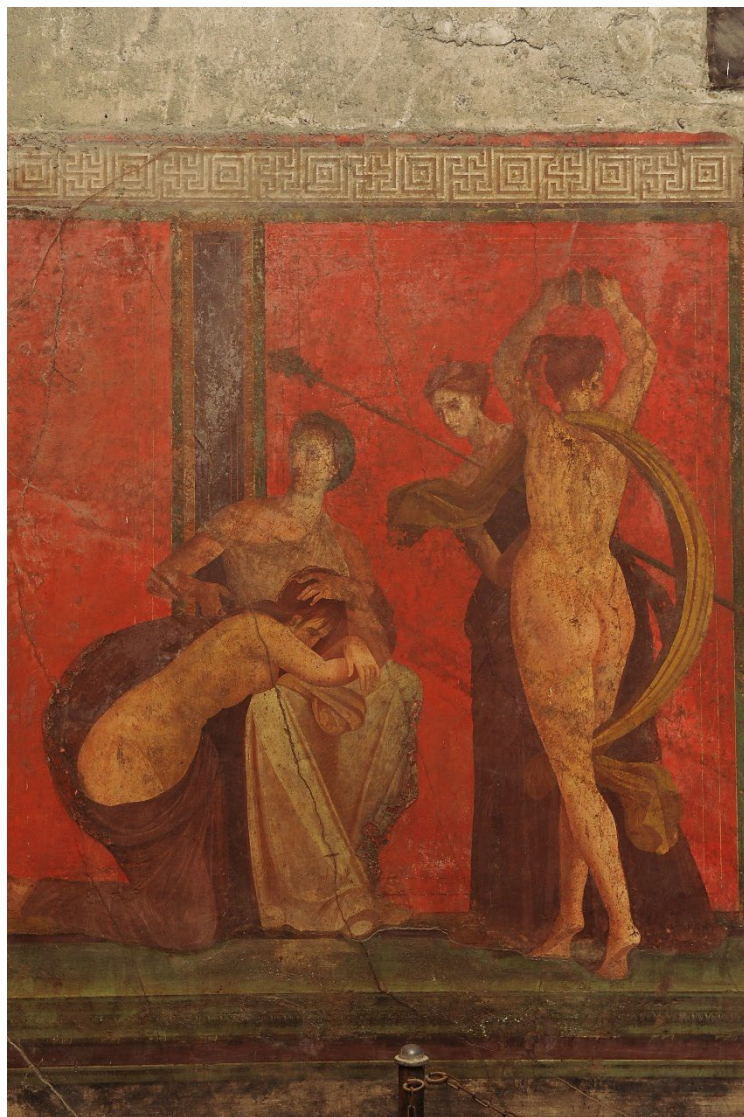
Abb. 4: Mysterienvilla, Pompeii, Großer Fries, Südwand, Mitte des 1. Jahrhunderts v. Chr.