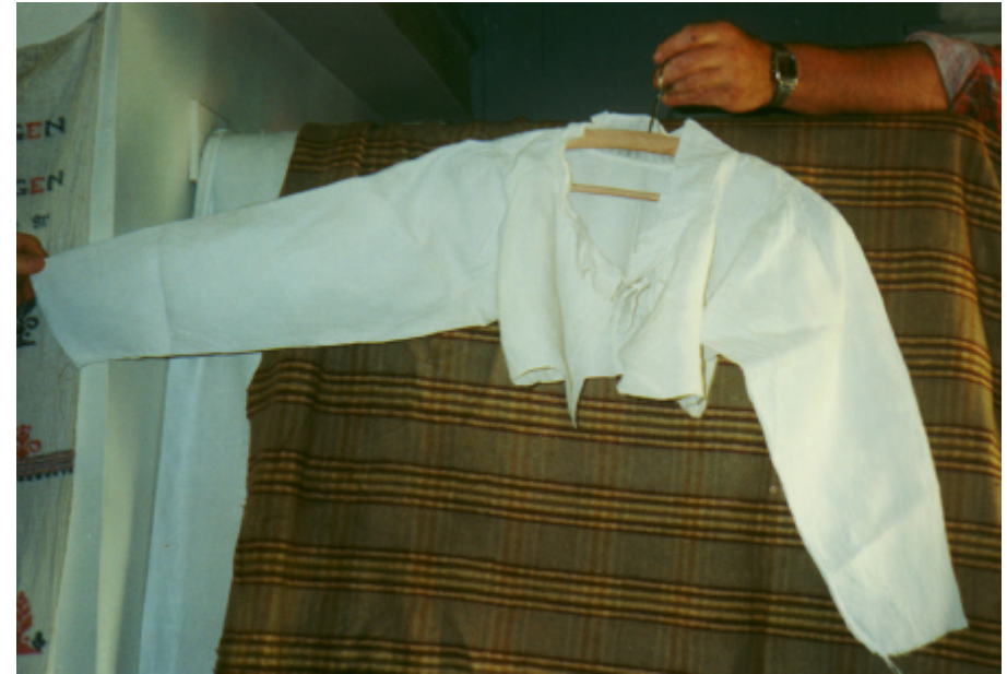
Ansicht des Ärmelmieders von vorn: