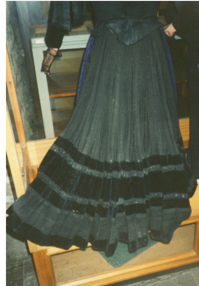
Ansicht des Rockes von hinten: