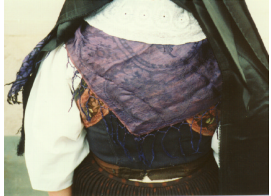
Ansicht des Miedertuches und des Mieders von hinten :