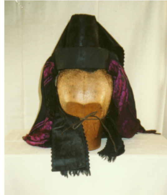
Ansicht der Haube von vorn und hinten: