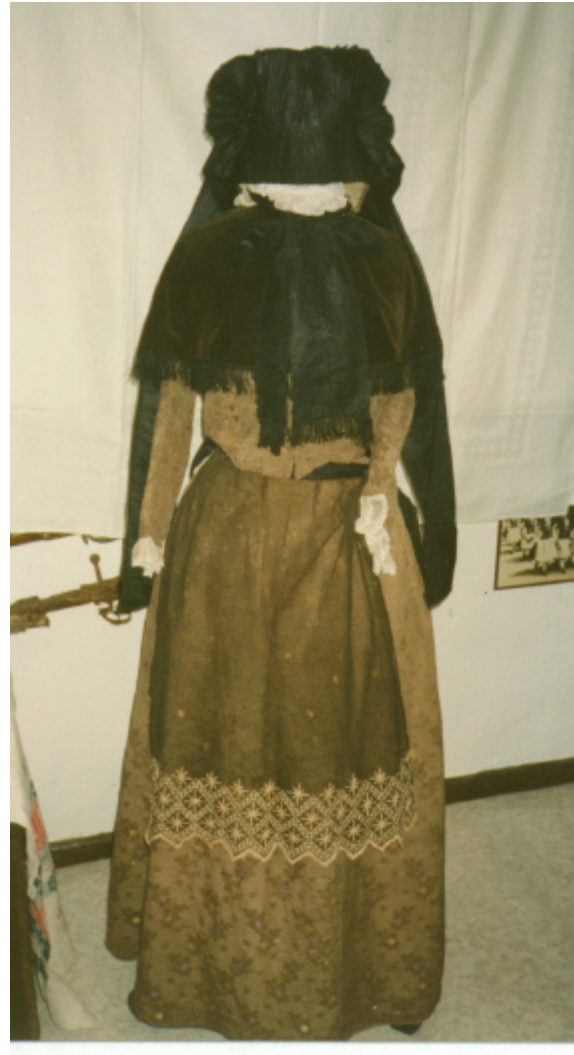
Gesamtansicht (Katalog Nr. 60)