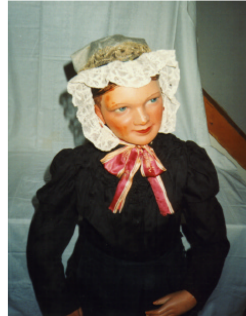
Ansicht der Haube von vorn, von hinten und von der Seite: