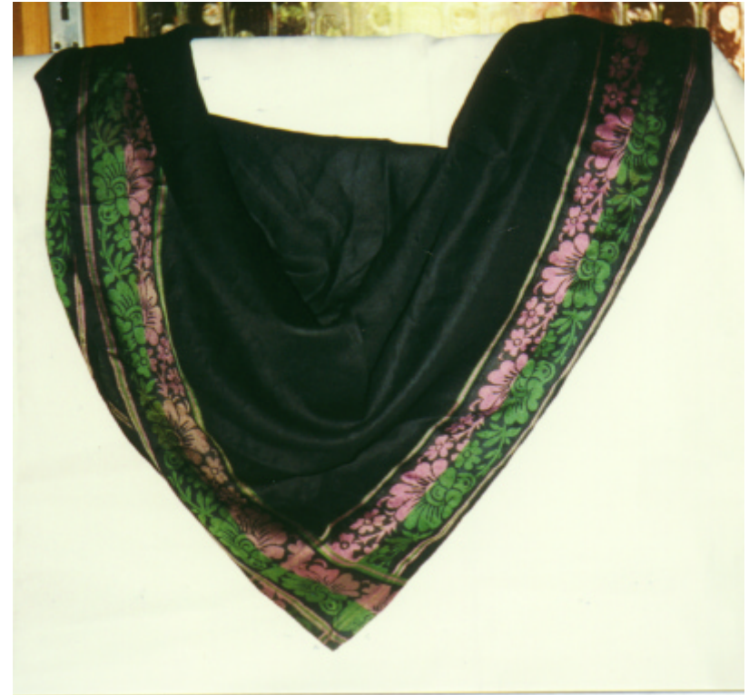
Ansicht des Miedertuches von vorn: