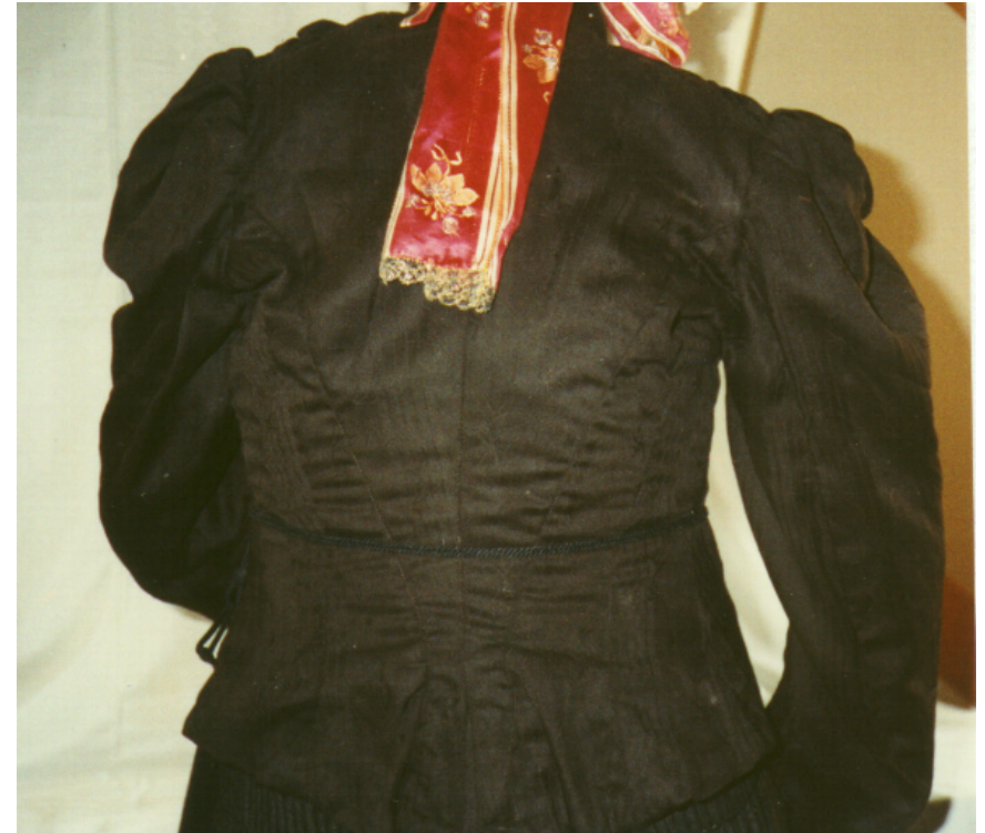
Ansicht des Mieders von hinten: