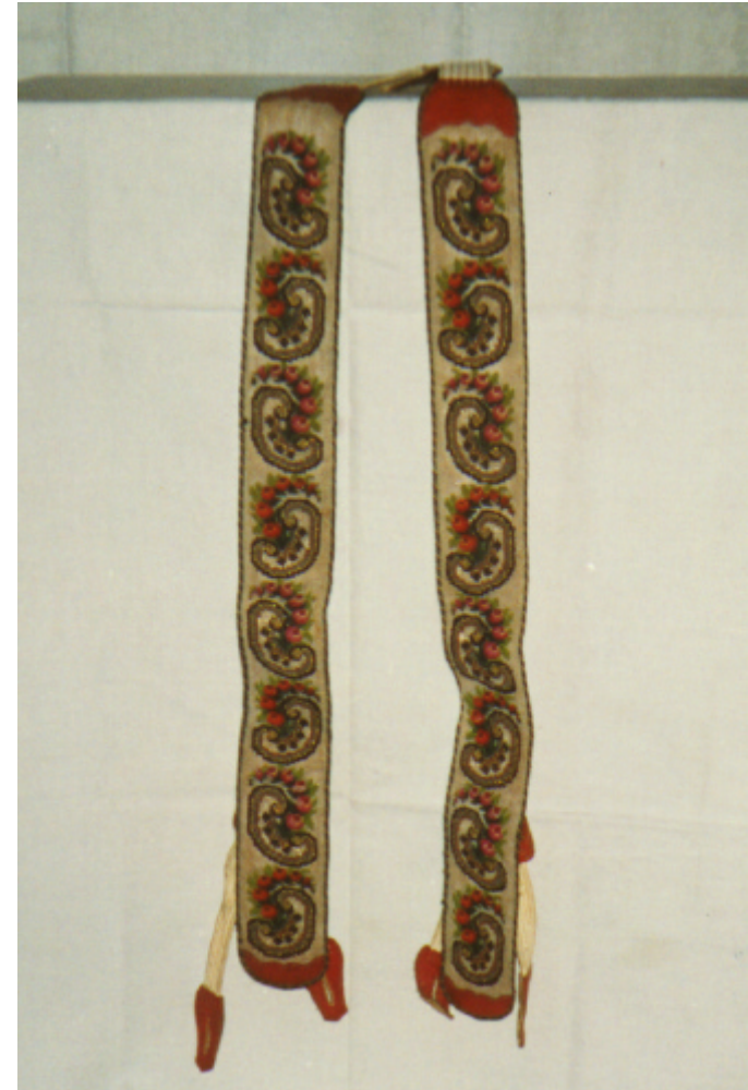
Ansicht der Hosenträger von vorn: