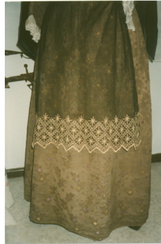
Ansicht der Schürze von vorn: