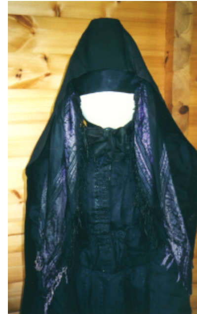
Ansicht der Haube von vorn und von hinten: