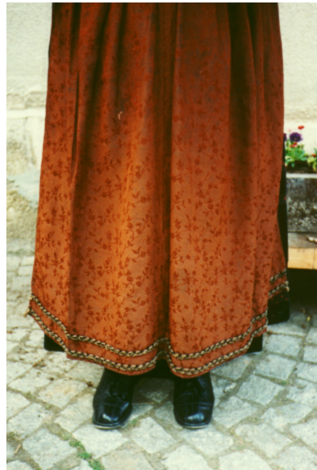
Ansicht der Schürze von vorn: