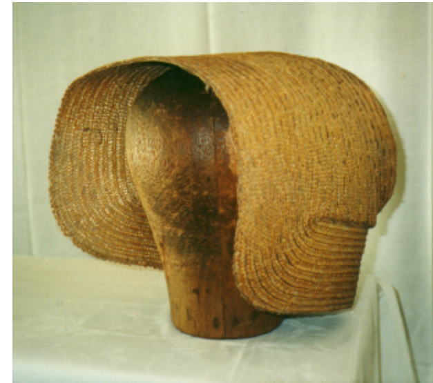
Seitenansicht der Haube und Ansicht von hinten: