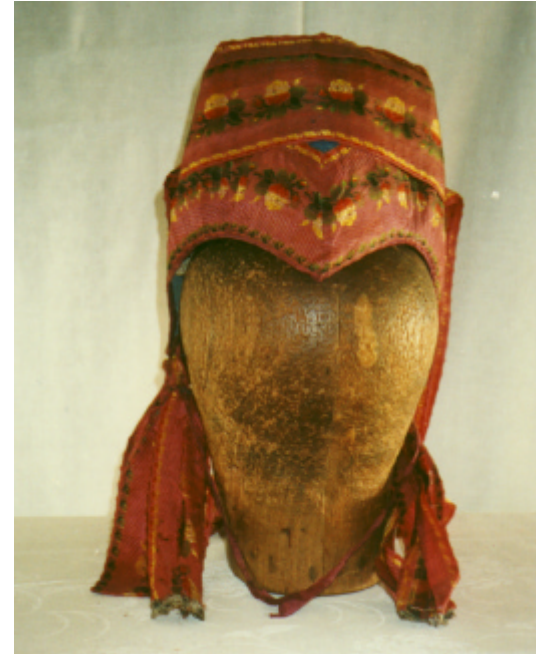
Ansicht der Haube von vorn und von hinten: