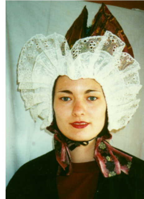
Ansicht der Haube von vorn und von der Seite: