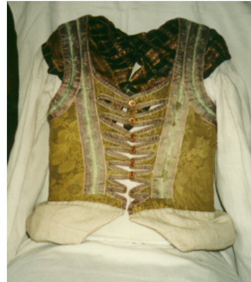
Ansicht des Mieders von vorn und hinten: