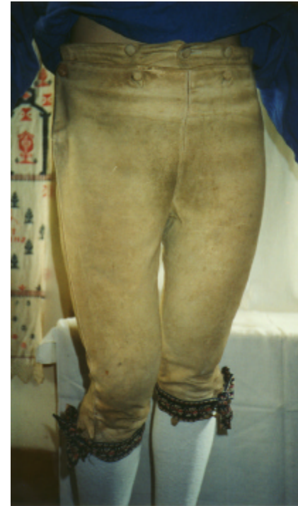
Ansicht der Kniebundhose von vorn und von hinten: