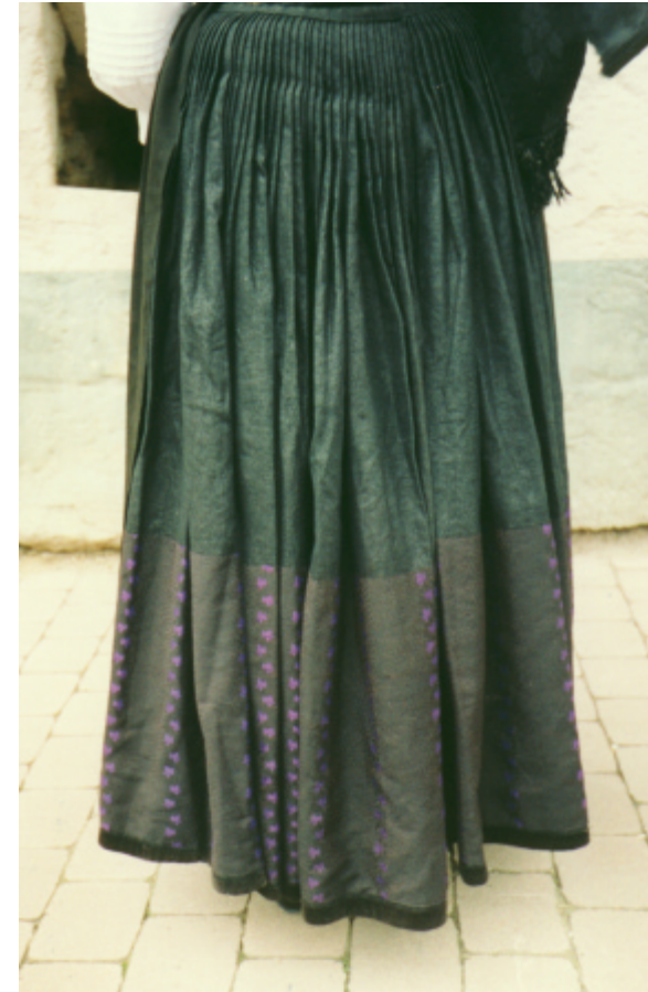
Ansicht des Rockes von hinten: