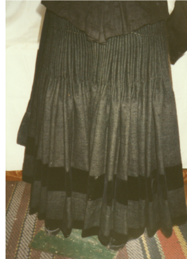
Ansicht des Rockes von hinten: