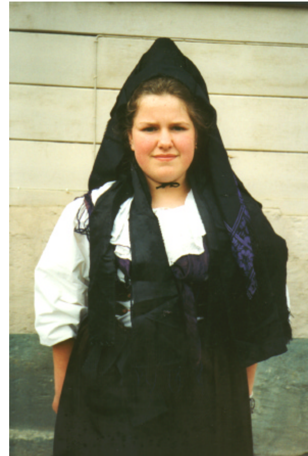
Ansicht der Haube von vorn: