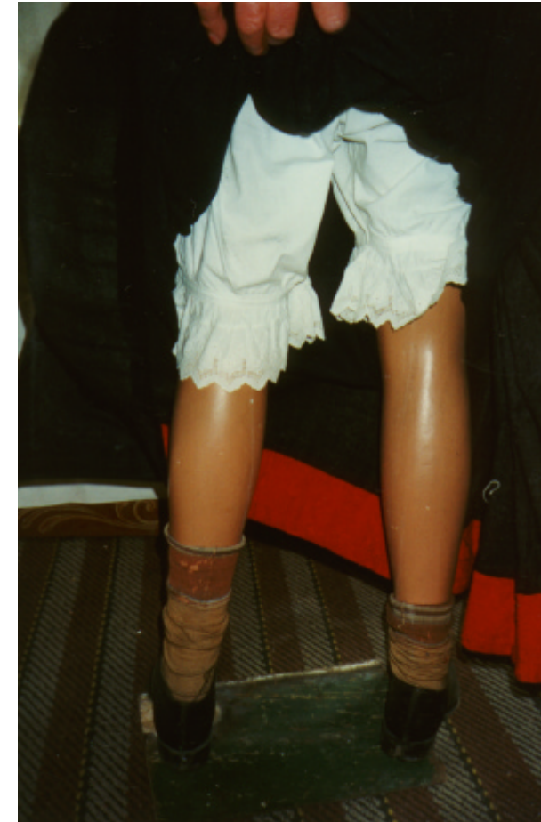
Ansicht der Pumphose von hinten: