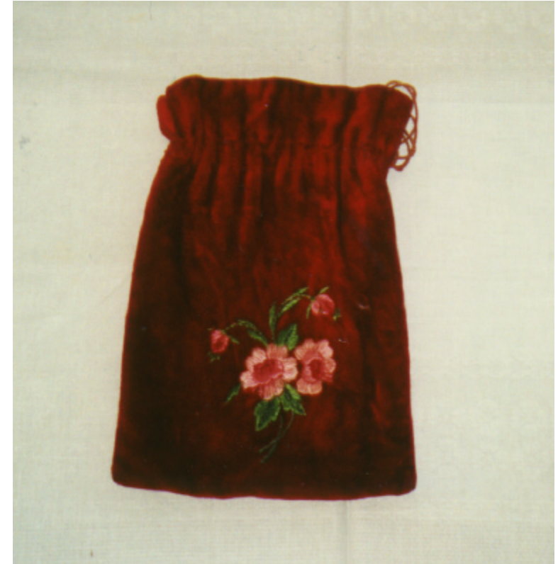
Ansicht des Samtbeutels von vorn :