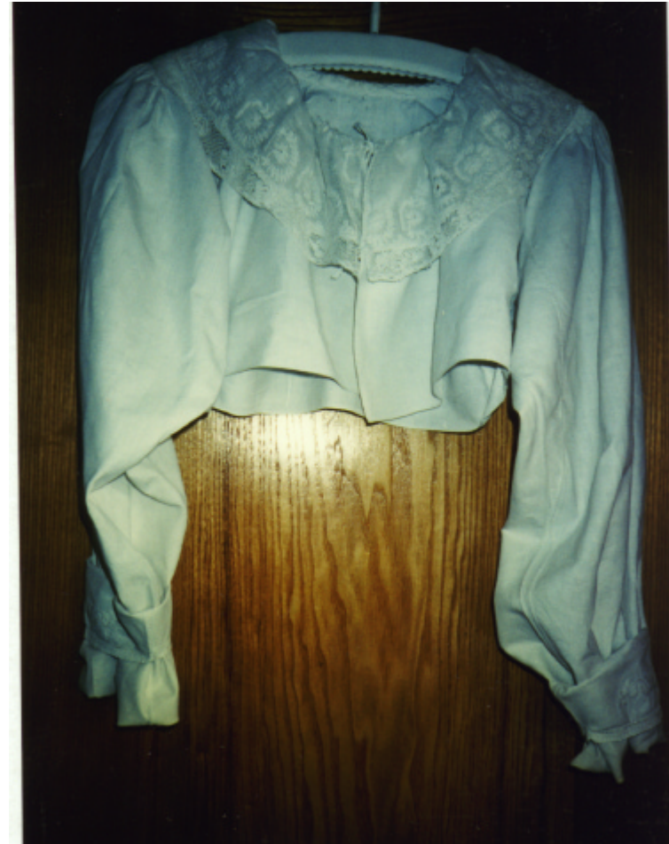
Ansicht des Ärmelmieders von vorn: