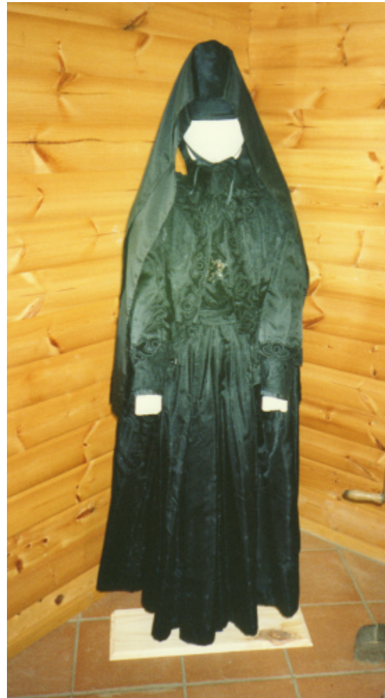
Gesamtansicht (Katalog Nr. 57)

Die Haube ist nachgestaltet und wird hier nicht genauer betrachtet.