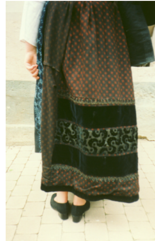
Ansicht des Rockes von hinten: