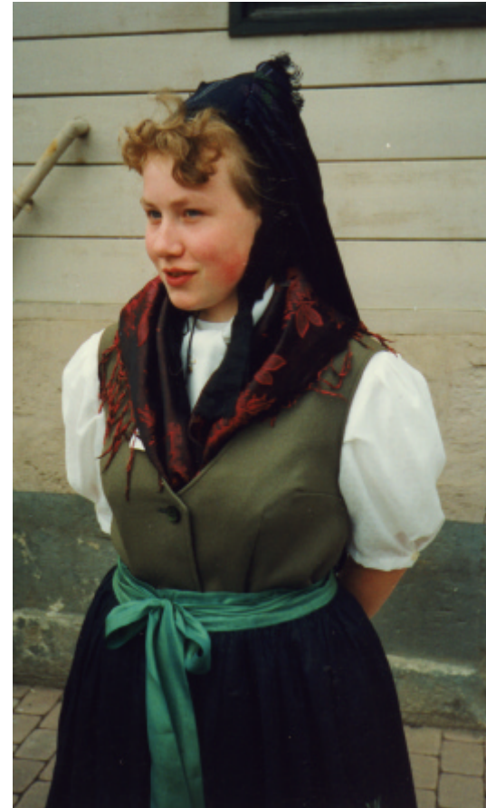
Ansicht des Miedertuches von vorn: