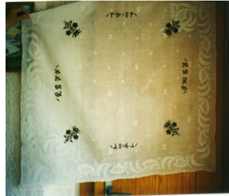
Detailaufnahme : eingesticktes Blumenmuster und Jahreszahl