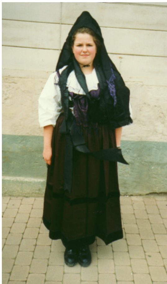
Gesamtansicht (Katalog Nr. 22)