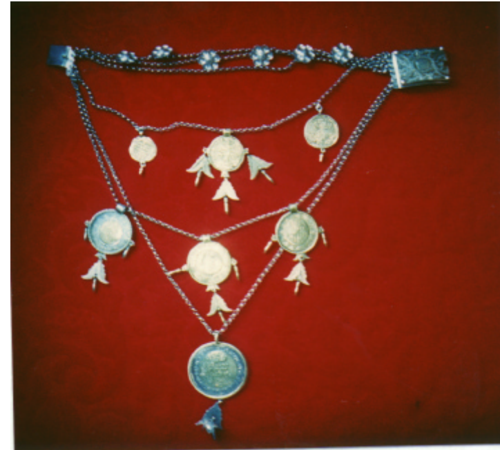
Gesamtansicht des Mahlschatzes: