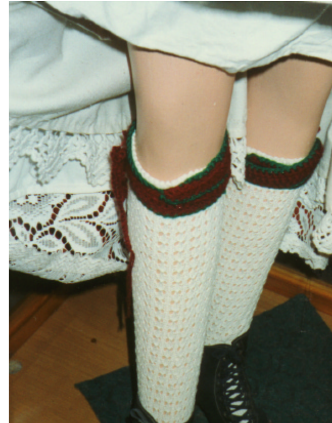
Ansicht der Strümpfe und Schuhe von vorn: (Katalog Nr. 54)