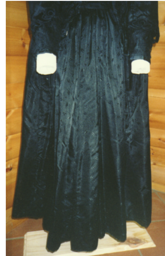
Ansicht des Rockes von vorn: