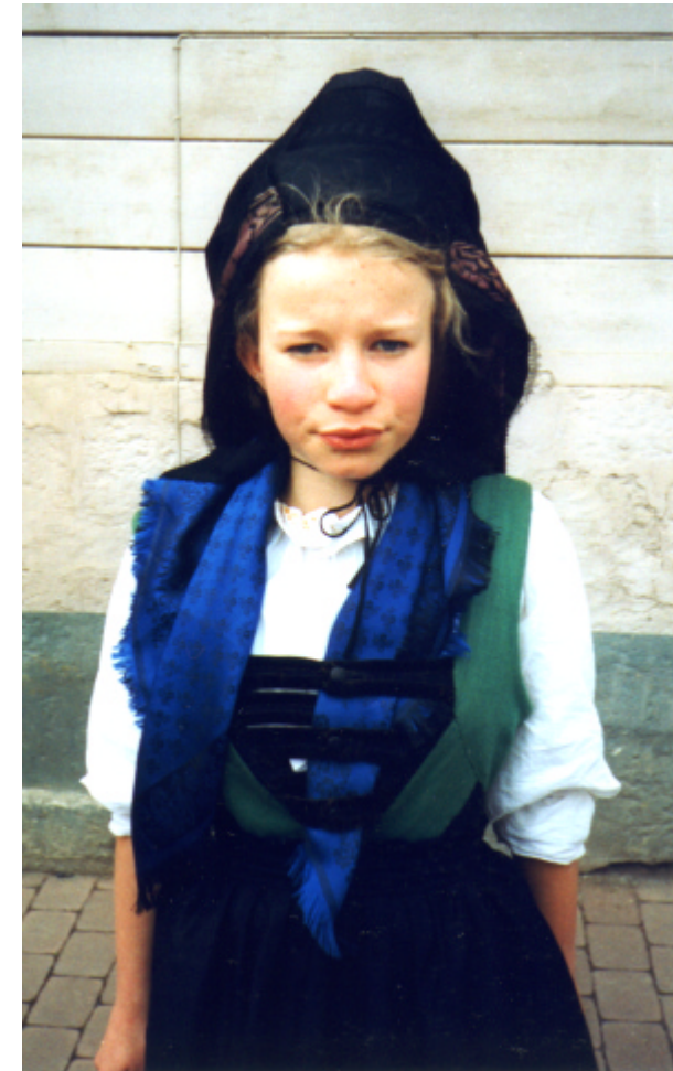
Ansicht des Miedertuches und des Mieders von vorn: