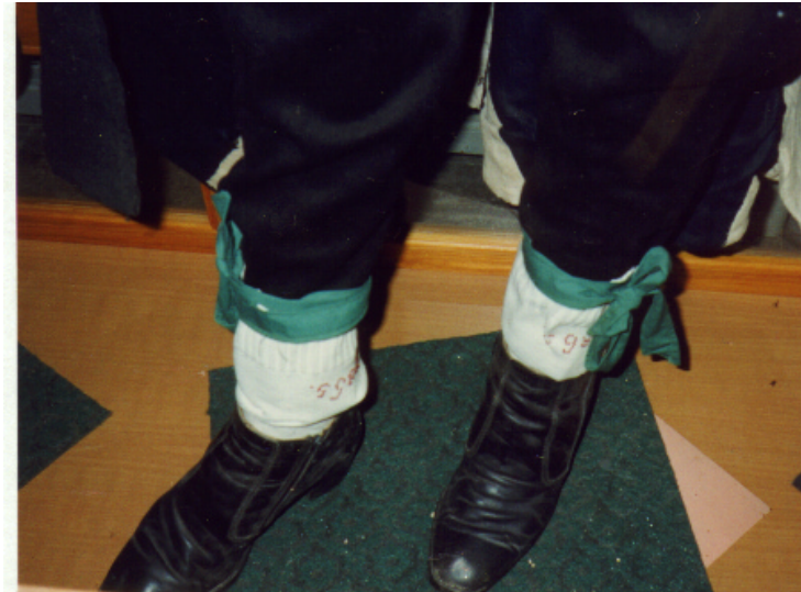
Ansicht der Schuhe von vorn: