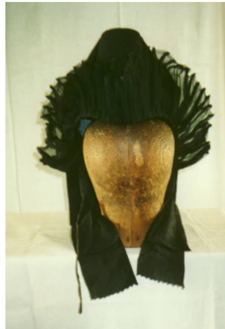
Ansicht von vorn und von hinten: