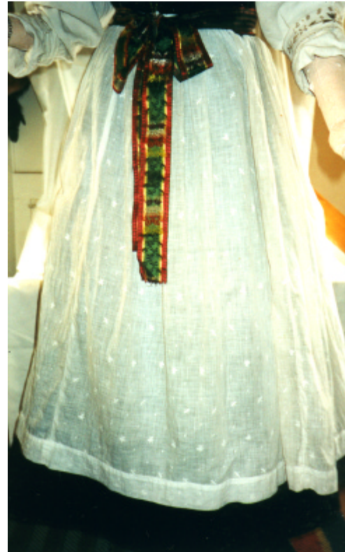
Ansicht der Schürze von vorn und Detailaufnahme des Schürzenbandes :