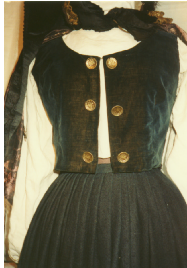
Ansicht des Samtmieders von vorn: