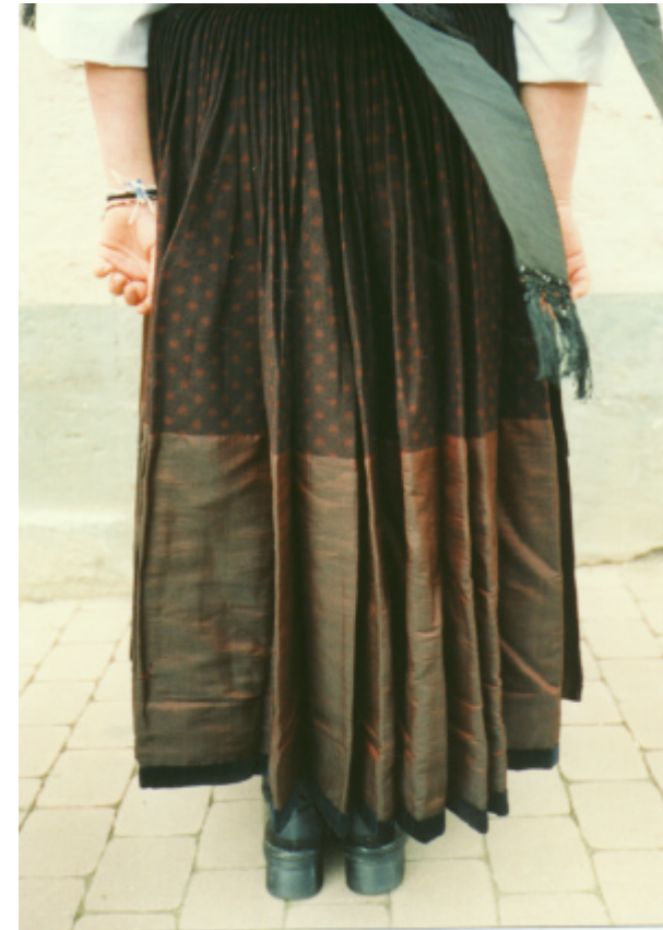
Ansicht des Rockes von hinten: