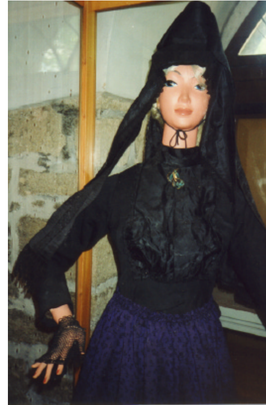
Ansicht der Haube von vorn: