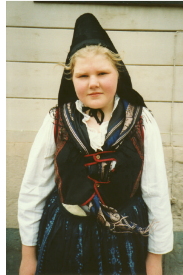
Ansicht der Haube, des Miedertuches und des Mieders von vorn: