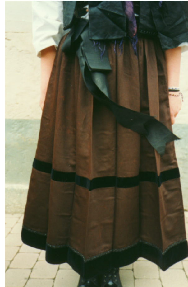
Ansicht der Schürze von vorn: