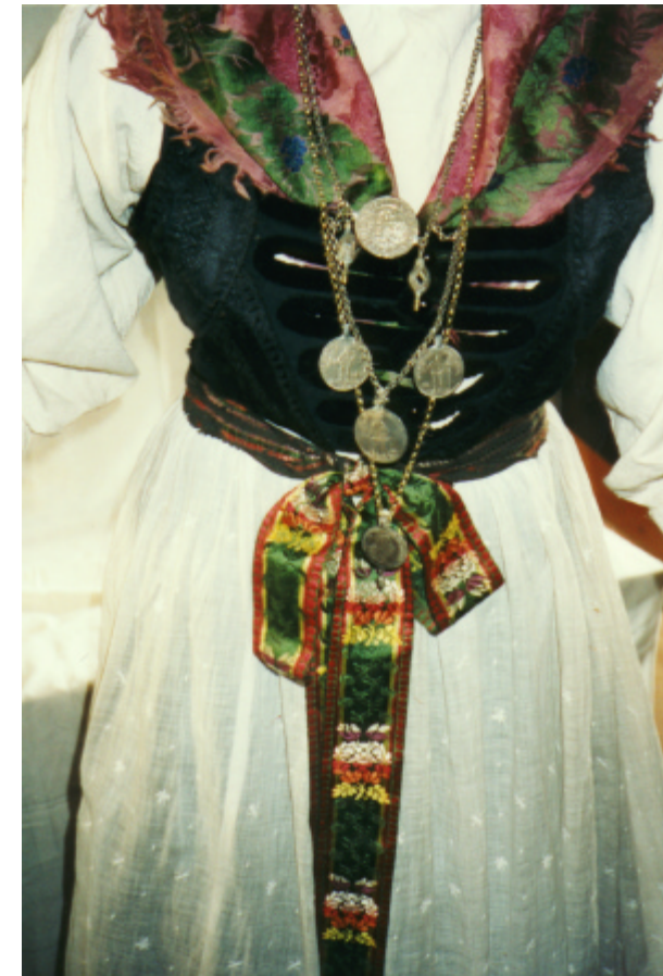
Ansicht des Wulstmieders von vorn: