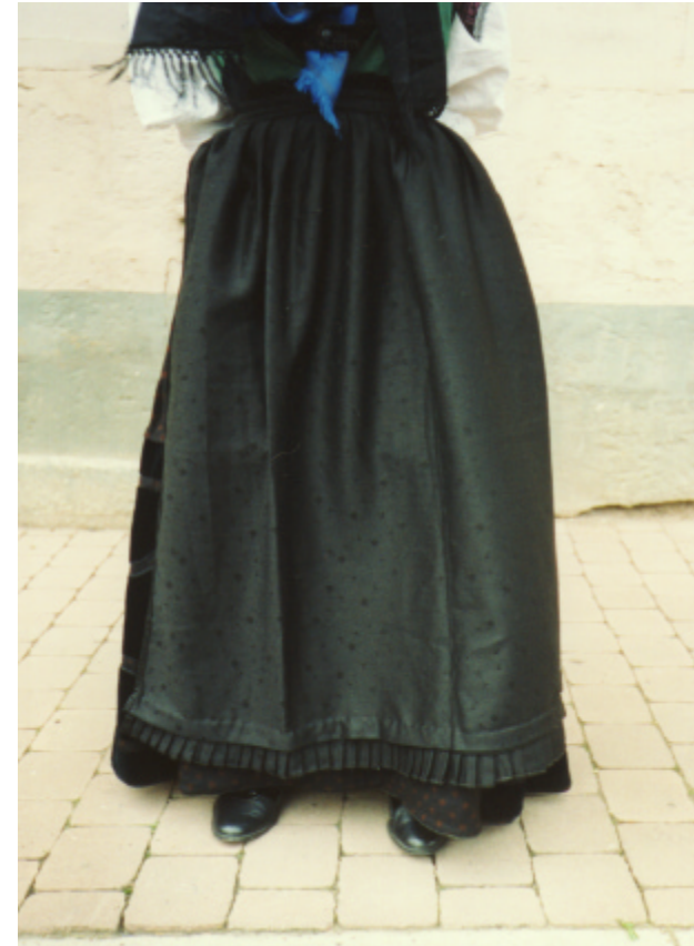
Ansicht der Schürze von vorn: