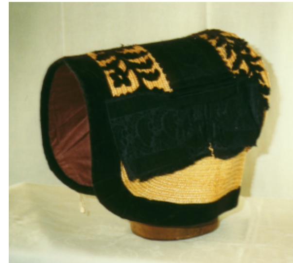
Seitenansicht der Haube und Ansicht von hinten: