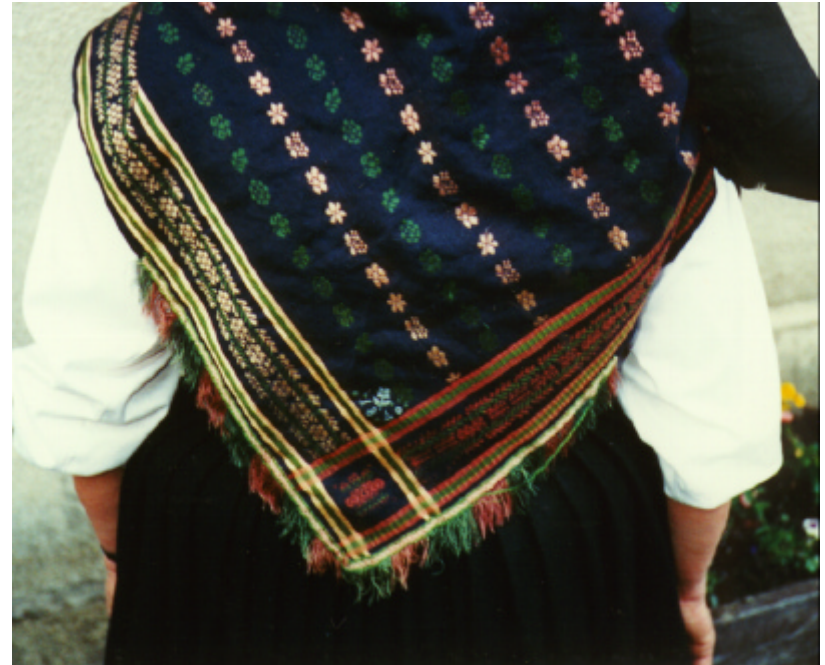
Ansicht des Miedertuches von hinten: