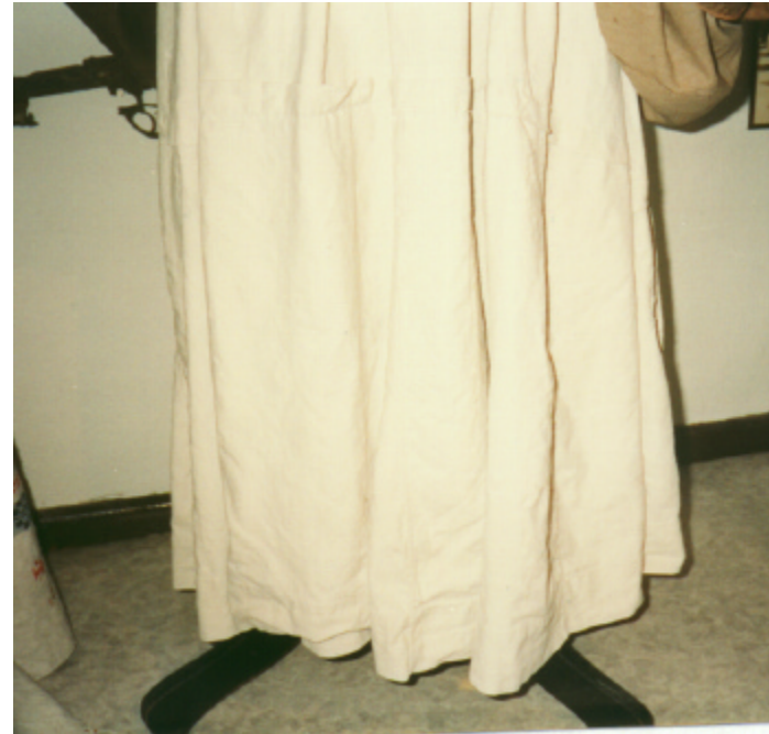
Ansicht des Unterrockes von vorn: