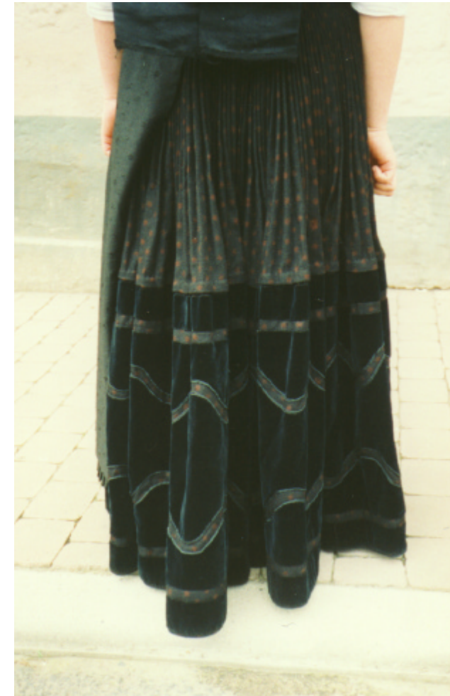
Ansicht des Rockes von hinten: