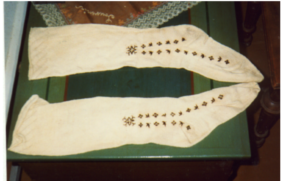
Ansicht der Strümpfe von vorn: