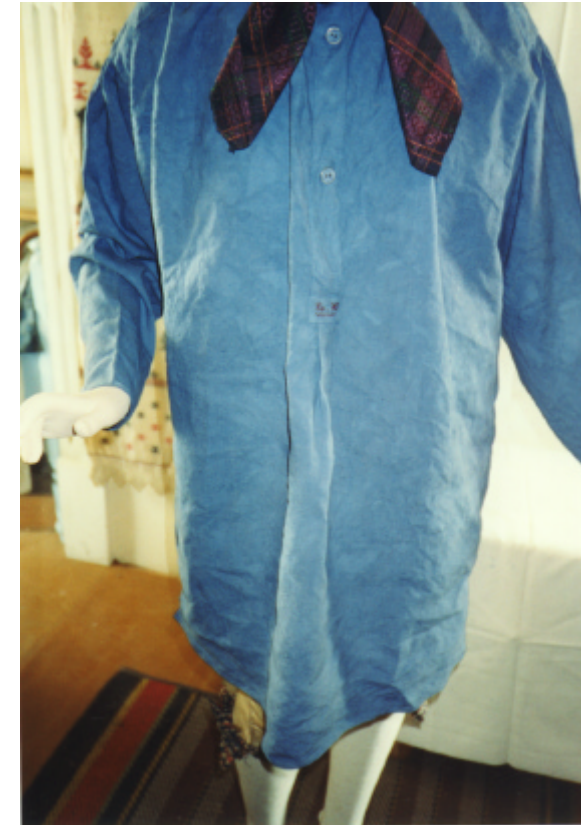
Ansicht des Kittels von vorn: