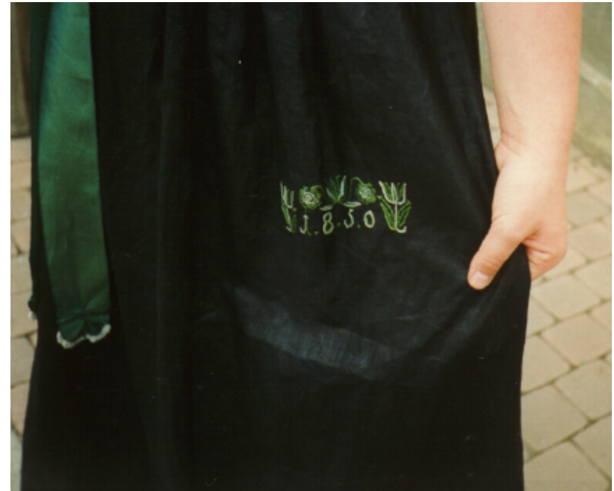
Detailaufnahme der Schürze: eingestickte Jahreszahl 1850