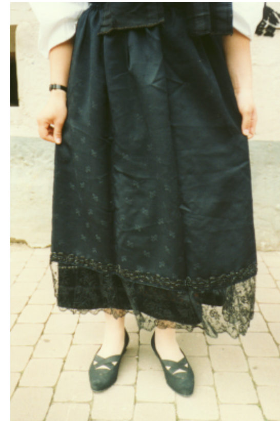
Ansicht der Schürze von vorn: