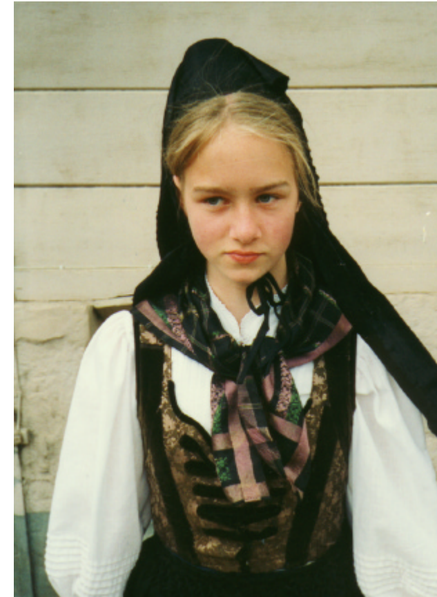
Ansicht der Haube und des Mieders von vorn: