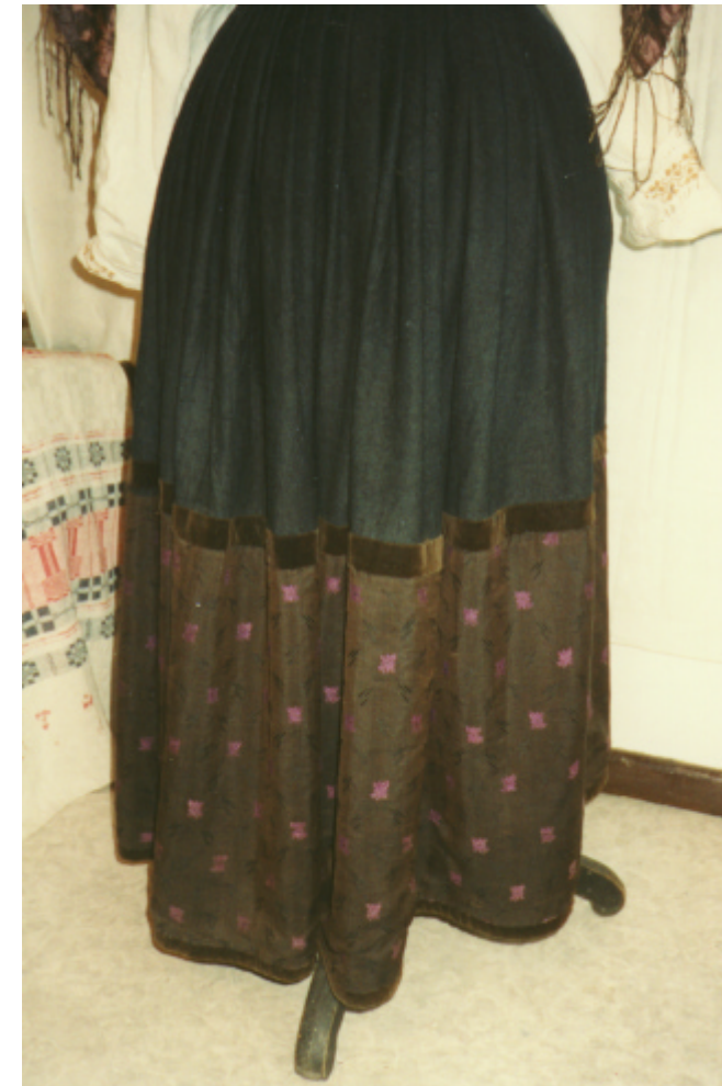
Ansicht des Rockes von vorn: