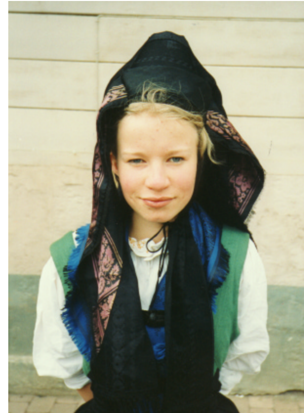
Ansicht der Haube von vorn: