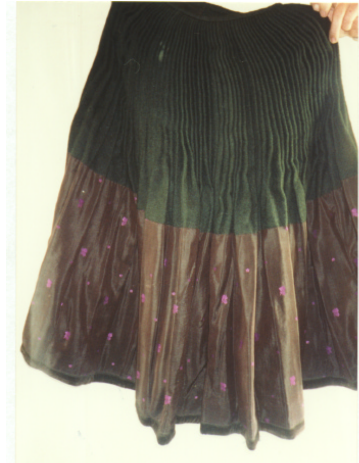
Ansicht des Rockes von hinten: