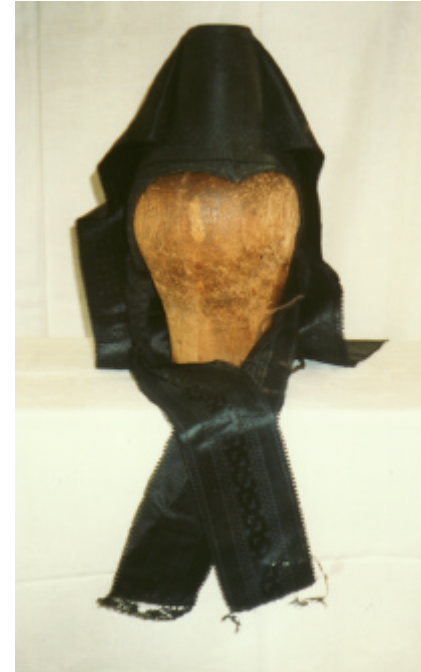
Ansicht der Haube von vorn und von hinten: