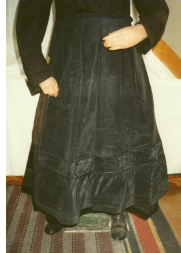
Ansicht der Schürze von vorn: