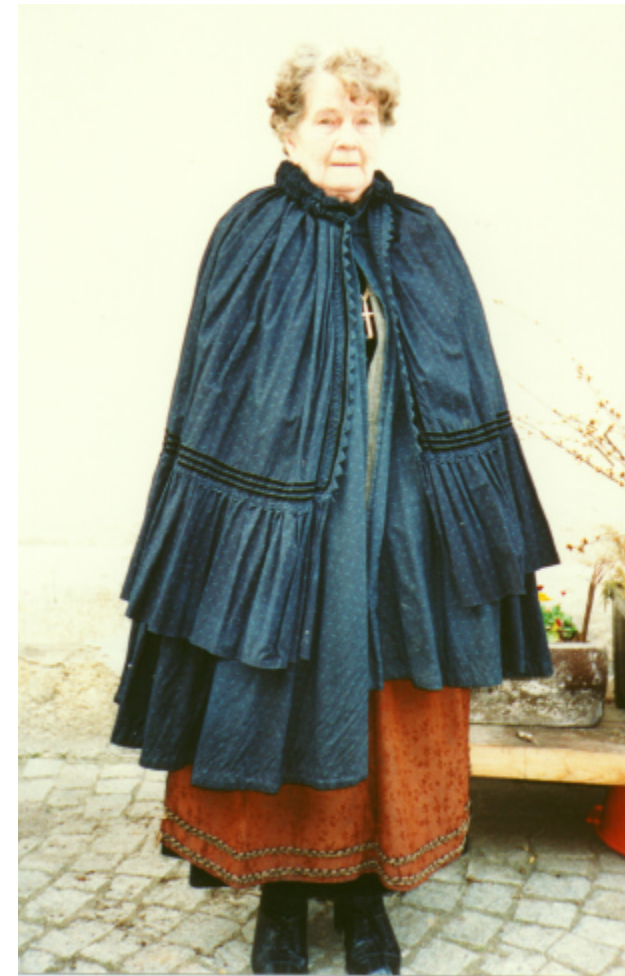
Ansicht des Kindermantels von vorn: