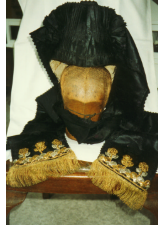
Detailaufnahme von oben : Verzierung der schwarzen Seidenbänder und des Mützenstücks