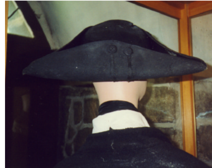
Ansicht des Dreispitz von hinten und von oben: