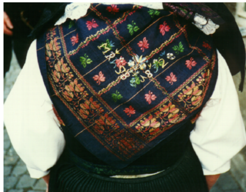
Detailaufnahme des Miedertuches (Ansicht von hinten)