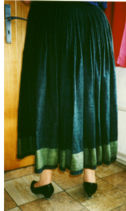
Ansicht des Rockes von hinten und von der Seite: