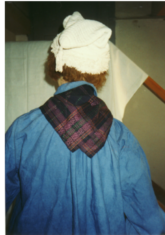
Ansicht des Halstuchs von hinten: