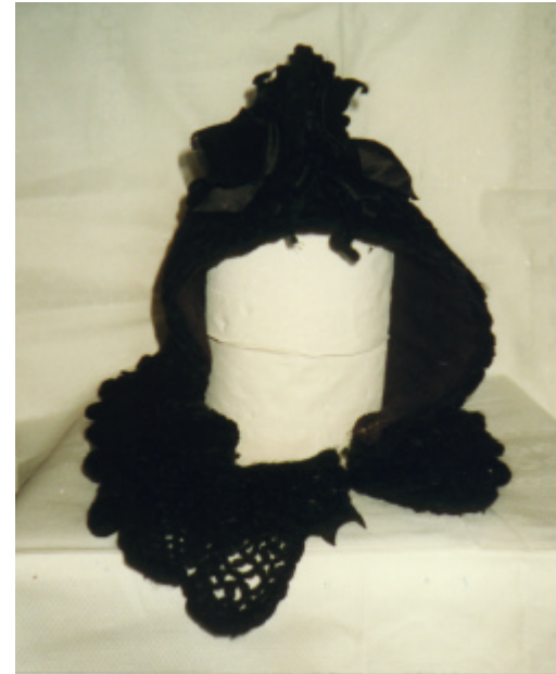
Ansicht der Haube von vorn und von oben: