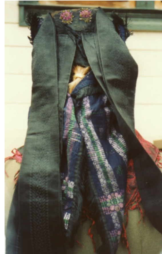
Ansicht der Haube von hinten: