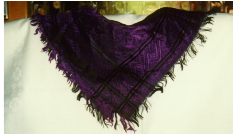
Ansicht des Halstuches von vorn: