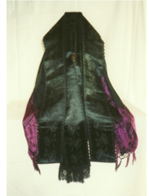
Detailaufnahme : Verzierung des Mützenstücks