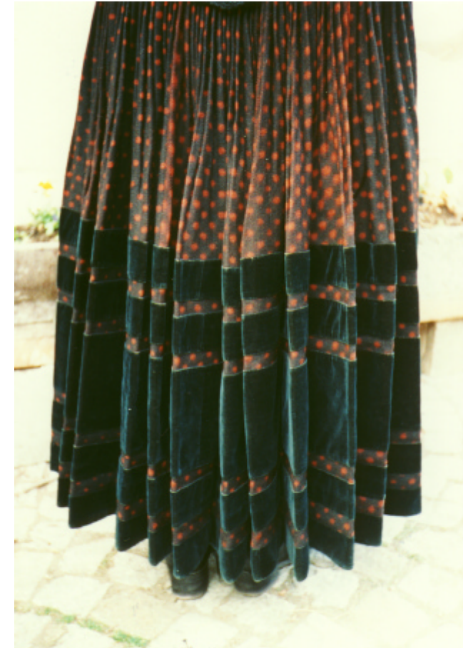
Ansicht des Rockes von hinten: