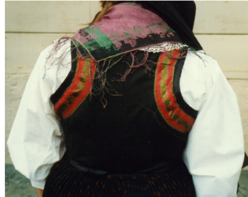
Ansicht des Mieders und des Miedertuches von hinten: