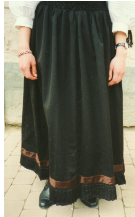
Ansicht der Schürze von vorn: