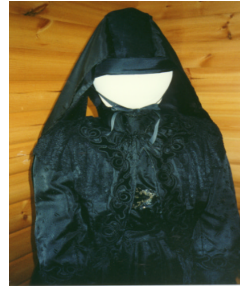
Ansicht der Jacke von vorn und hinten: