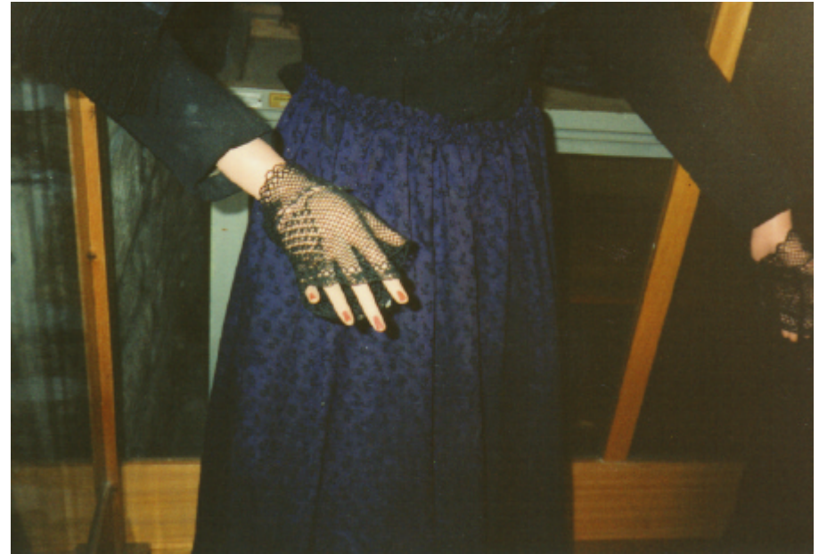
Ansicht eines Handschuhes von vorn: