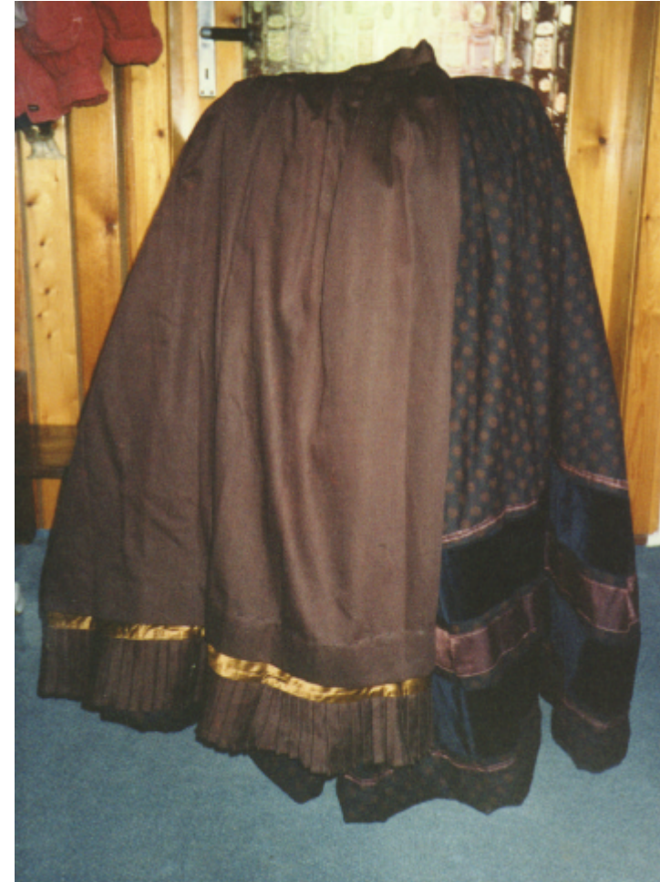
Ansicht der Schürze von vorn: