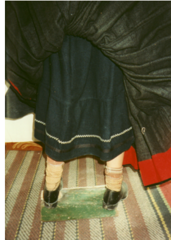
Ansicht des Unterrockes von hinten: