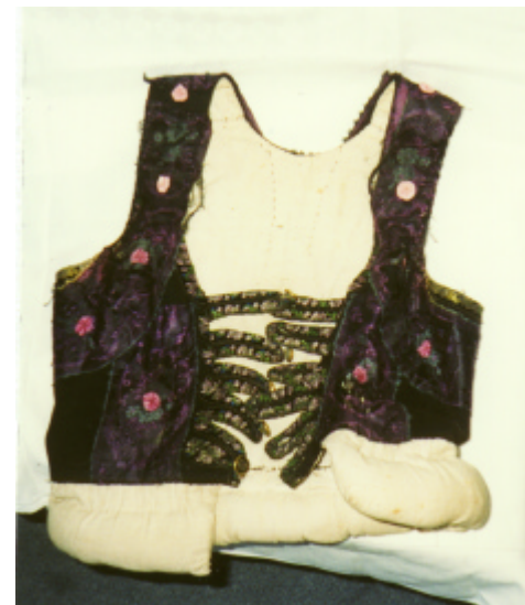
Ansicht des Mieders von vorn und hinten: