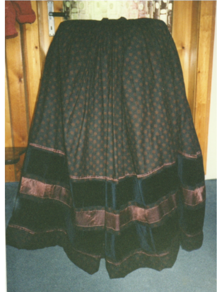
Ansicht des Rockes von hinten: