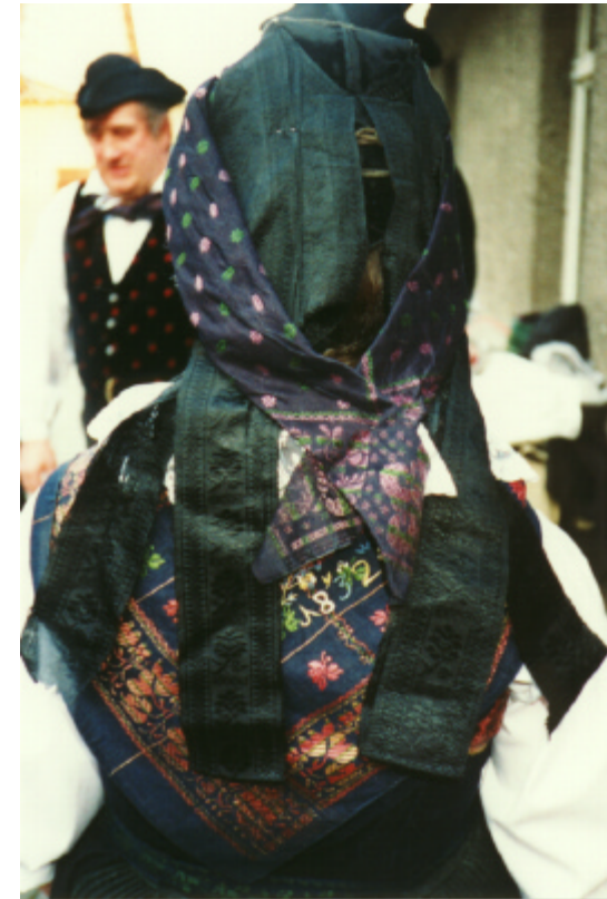
Detailaufnahme der Haube (Ansicht von hinten)