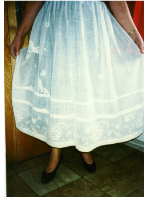
Detailaufnahmen: eingestickte Blumenmotive und Jahreszahl