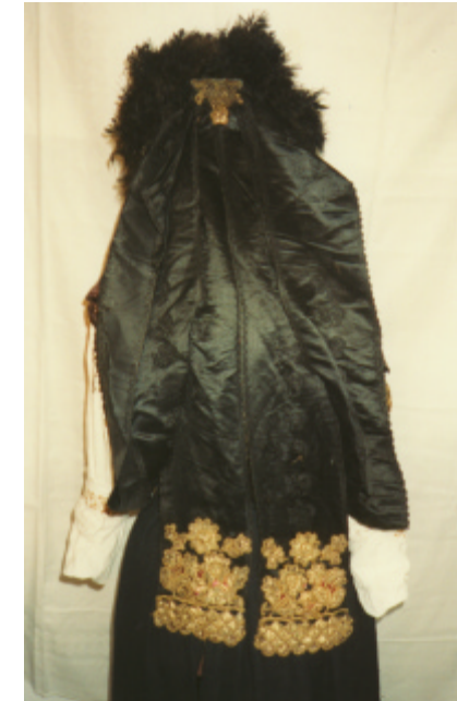
Detailaufnahmen des mit schwarzen Straußenfedern, kleinen Glaskugeln und Flitter in gold, blau und lila verzierten Stirnteils und der Verzierung des