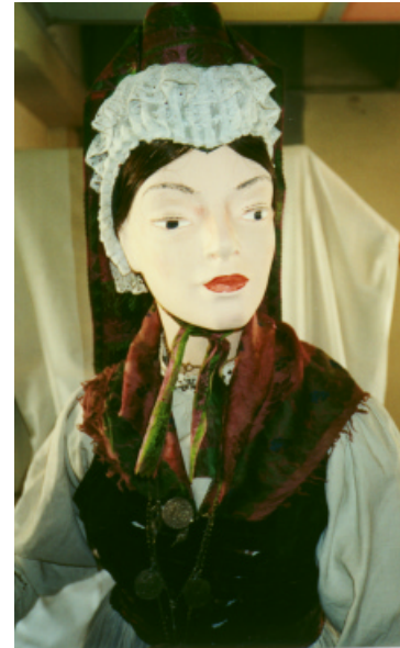
Ansicht der Haube von vorn, von hinten und von der Seite: