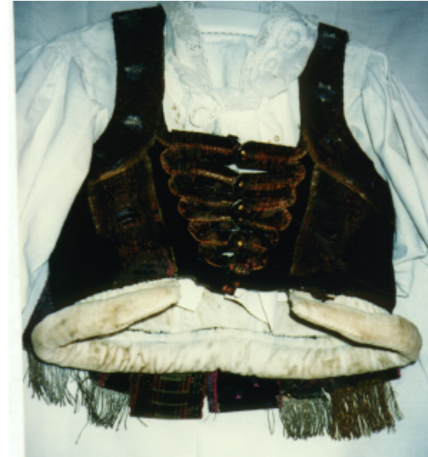
Ansicht des Wulstmieders von vorn und hinten: