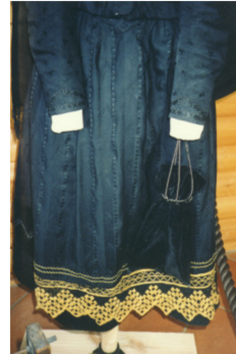
Ansicht der Schürze von vorn und Detailaufnahme: Verzierung der Schürze