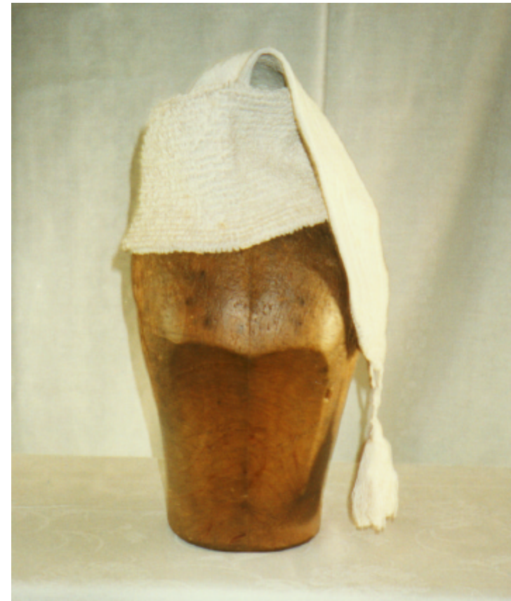
Ansicht der Zipfelmütze von vorn: