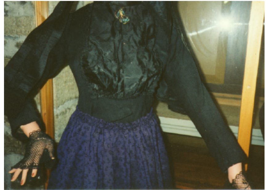
Ansicht des Mieders von vorn: