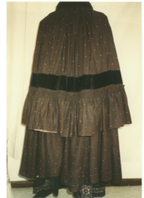
Detailaufnahme : Gerüschter Abschluß vorn und Halskrause