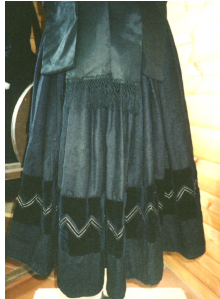
Ansicht des Rockes von hinten: