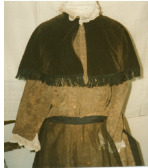
Ansicht des Mieders von vorn: