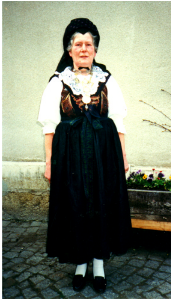
Gesamtansicht (Katalog. Nr. 1)

An dieser Stelle sollen nur die Teile der Festtagstracht vorgestellt werden, im Kapitel „Brauttrachten“ wird dann genauer auf die Bestandteile der Brauttracht eingegangen.