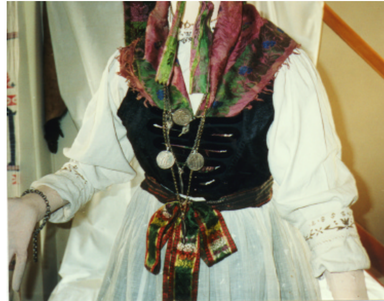
Ansicht des Miedertuches von vorn und hinten: