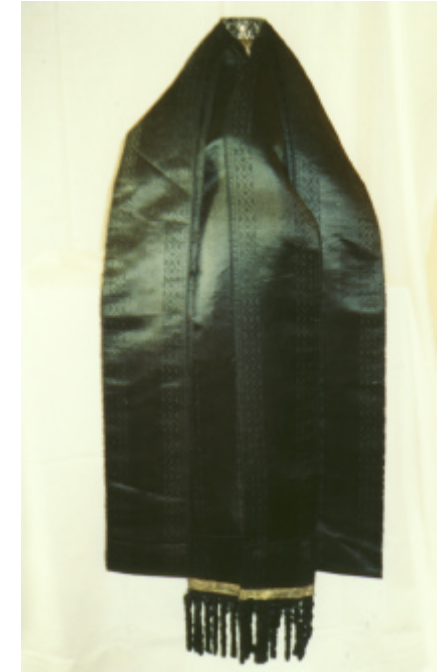
Detailaufnahmen : Verzierungen der Nackenbänder und des Mützenstücks