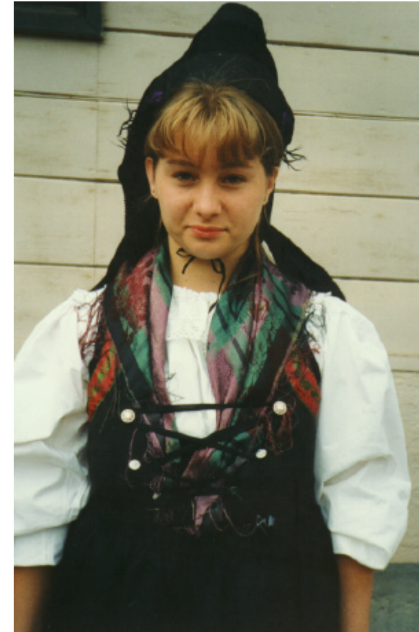
Ansicht der Haube und des Miedertuches von vorn: