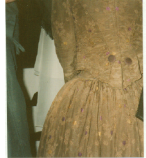
Detailaufnahme : Schößchen