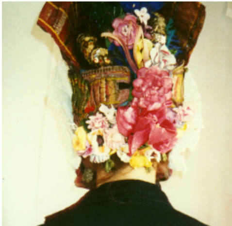
Ansicht der Haube von hinten: