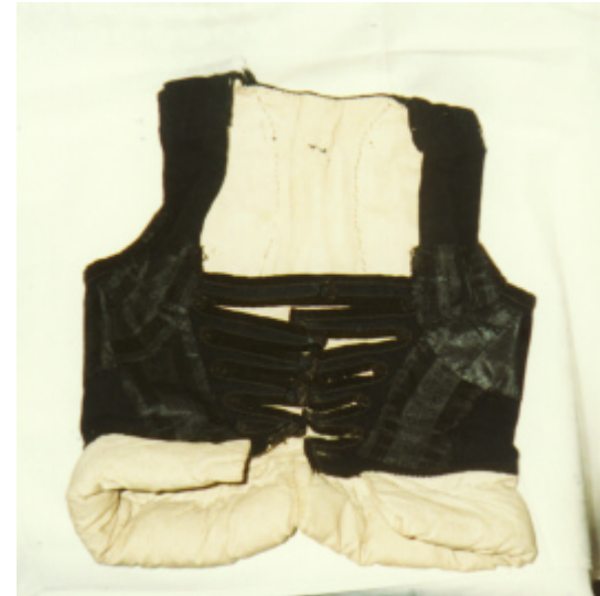
Ansicht des Mieders von vorn und hinten: