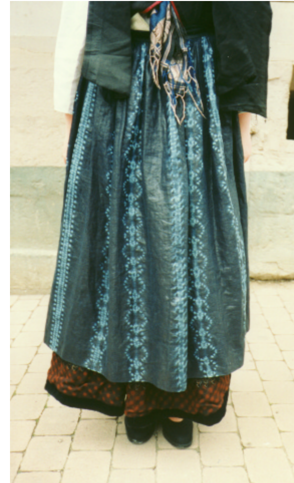
Ansicht der Schürze von vorn: