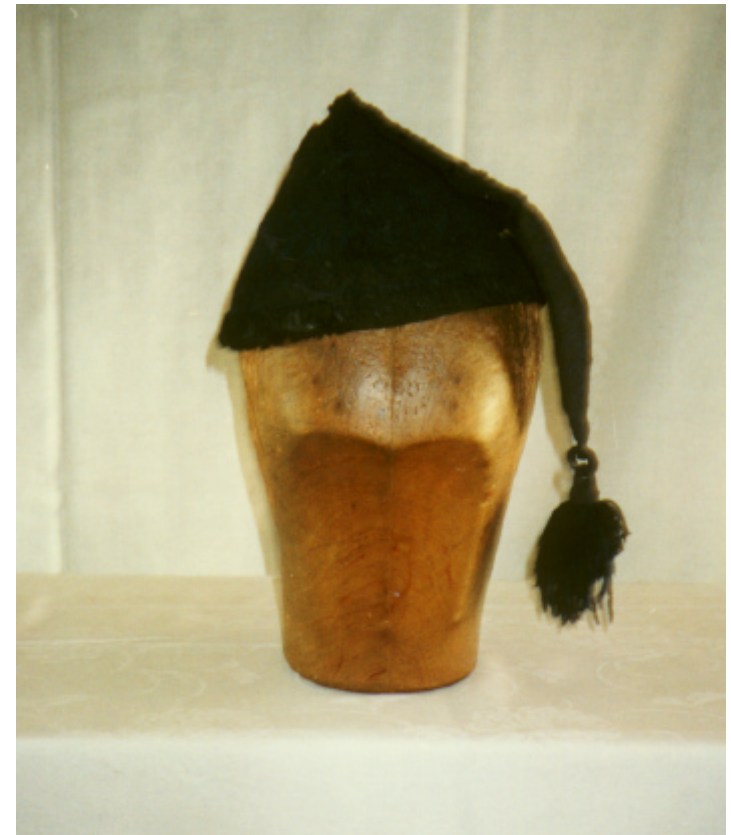
Ansicht der Zipfelmütze von vorn: