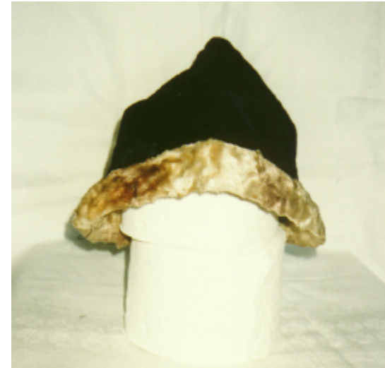
Ansicht des Mützchens von vorn und von der Seite: