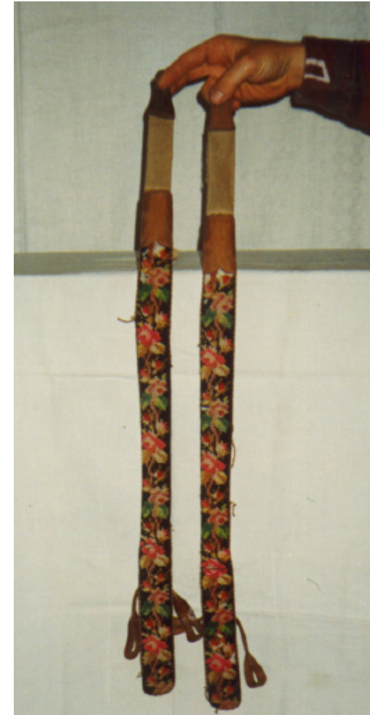
Ansicht der Hosenträger von vorn: