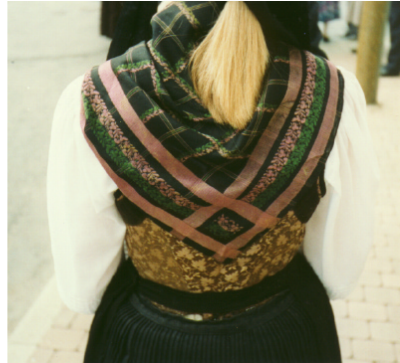
Ansicht des Miedertuches von hinten: