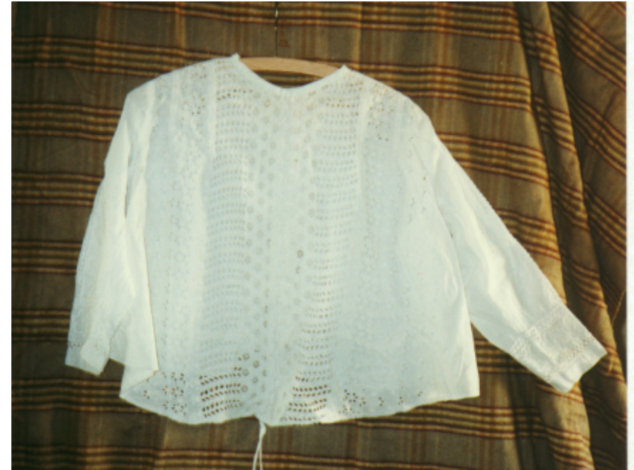
Ansicht des Ärmelmieders von vorn: