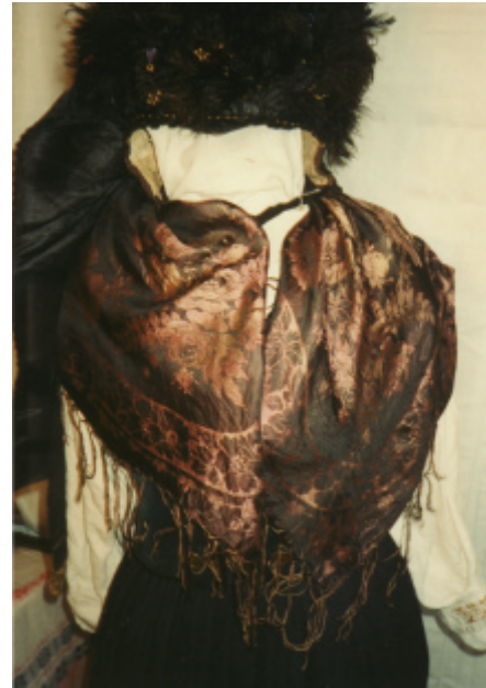
Ansicht des Vortuches von vorn und hinten: