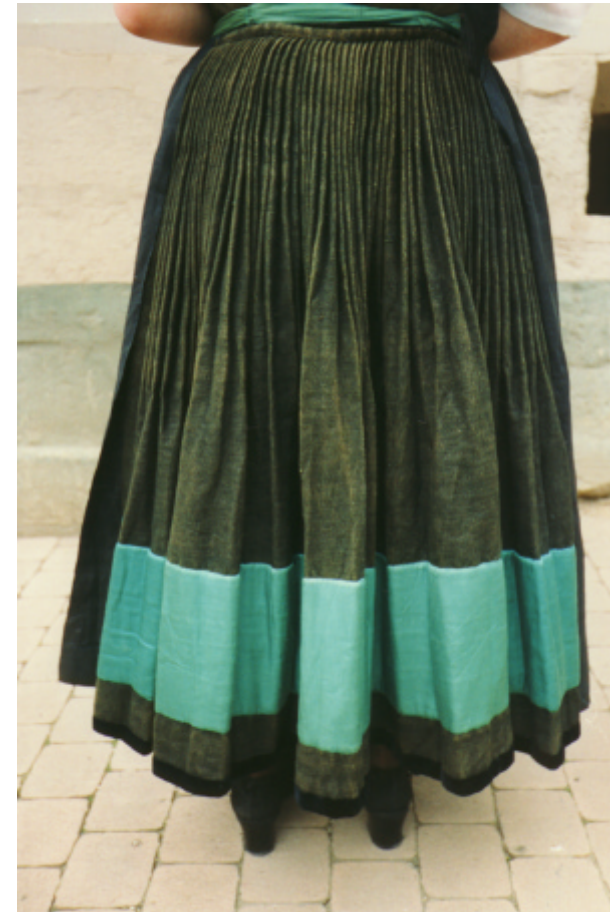
Ansicht des Rockes von hinten: