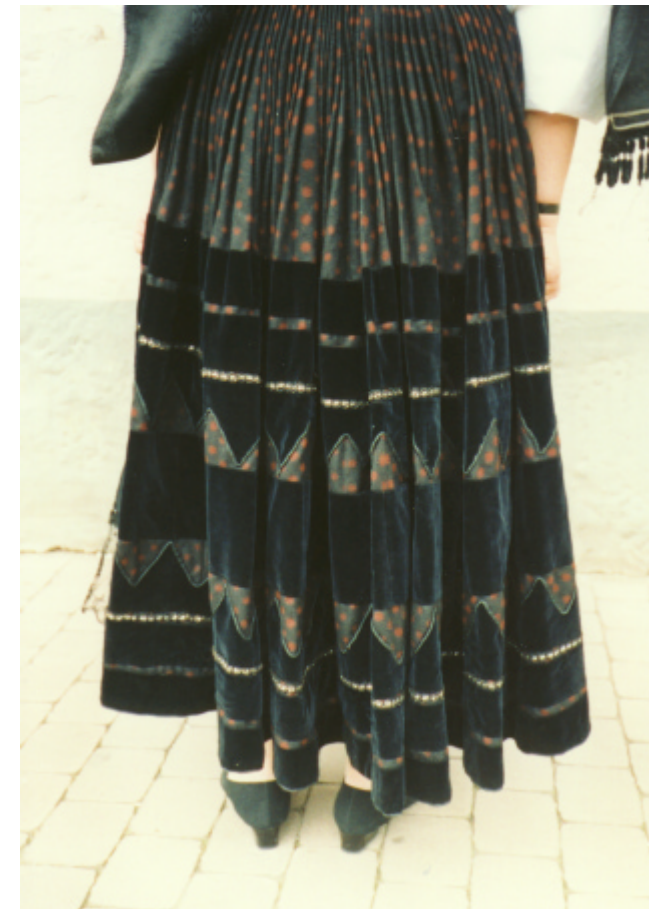
Ansicht des Rockes von hinten: