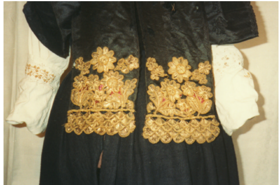
Detailaufnahme: Verzierung der Nackenbänder