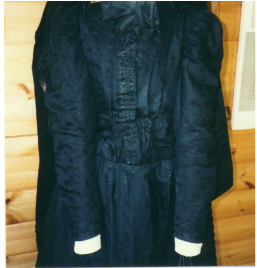
Ansicht des Mieders von vorn: