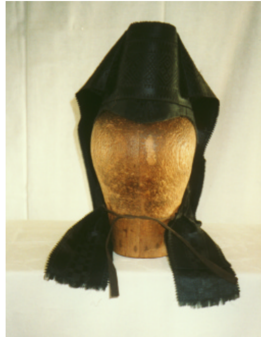
Ansicht der Haube von vorn und von hinten: