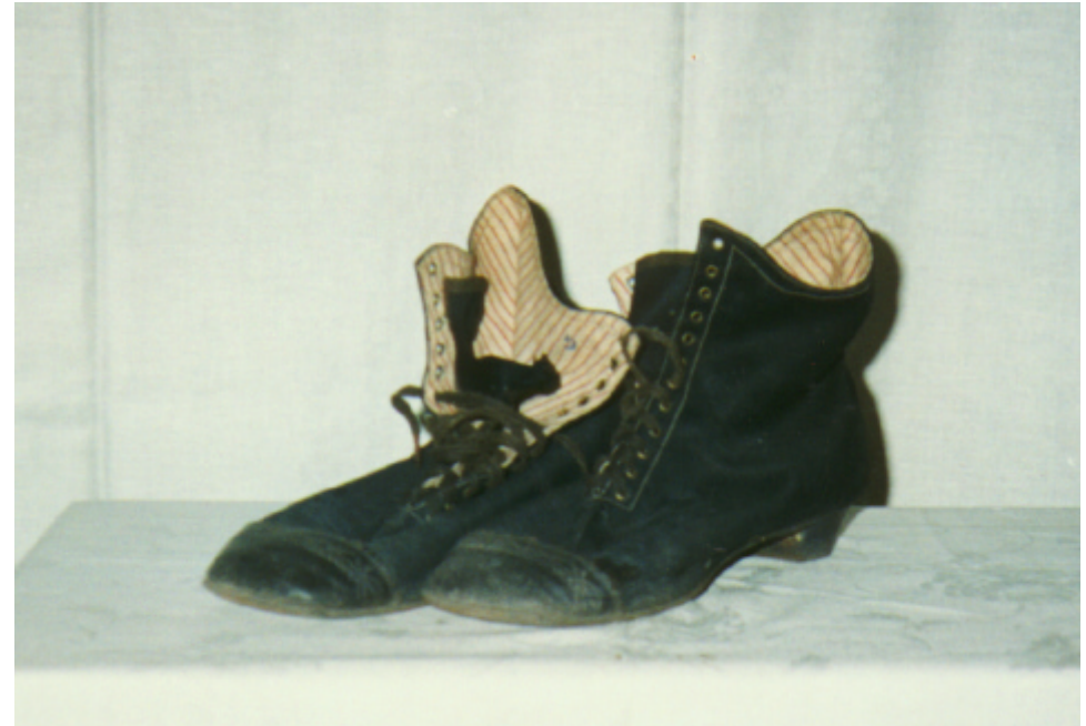
Seitenansicht der Schuhe: