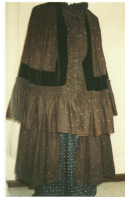
Ansicht des Kindermantels von vorn und hinten: