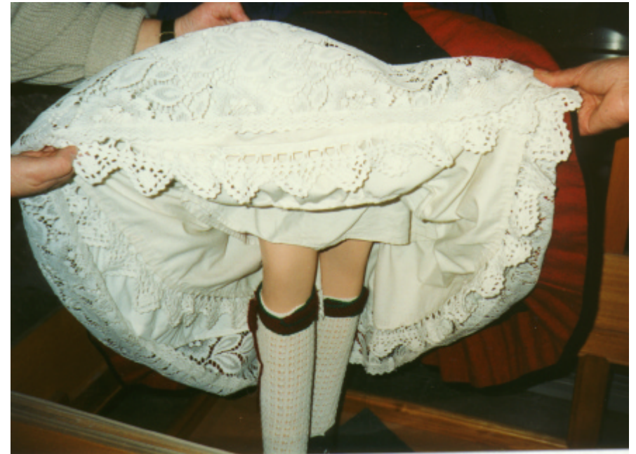
Detailaufnahme : Verzierung der Unterröcke (Katalog Nr. 51)