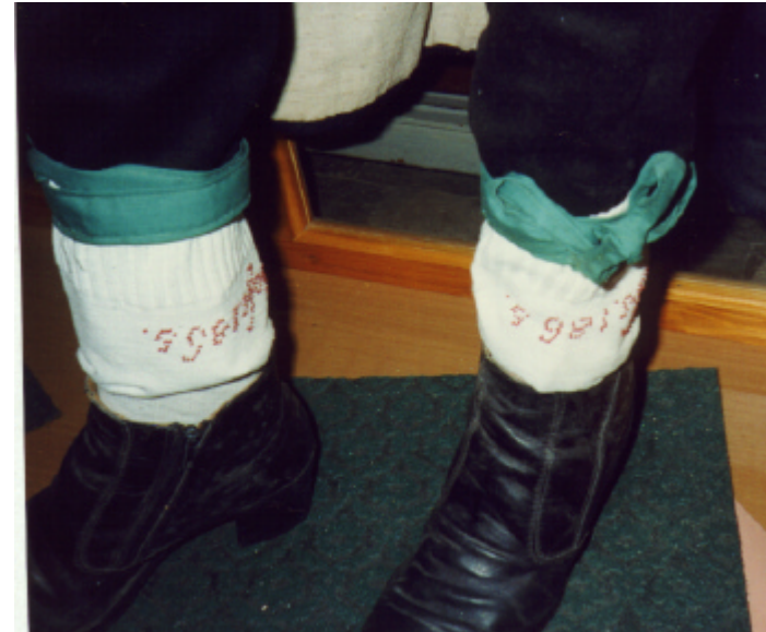
Ansicht der Strümpfe von vorn / rechts: