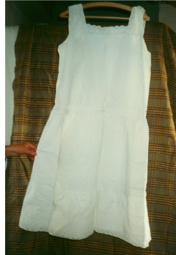
Ansicht des Unterkleides von vorn: