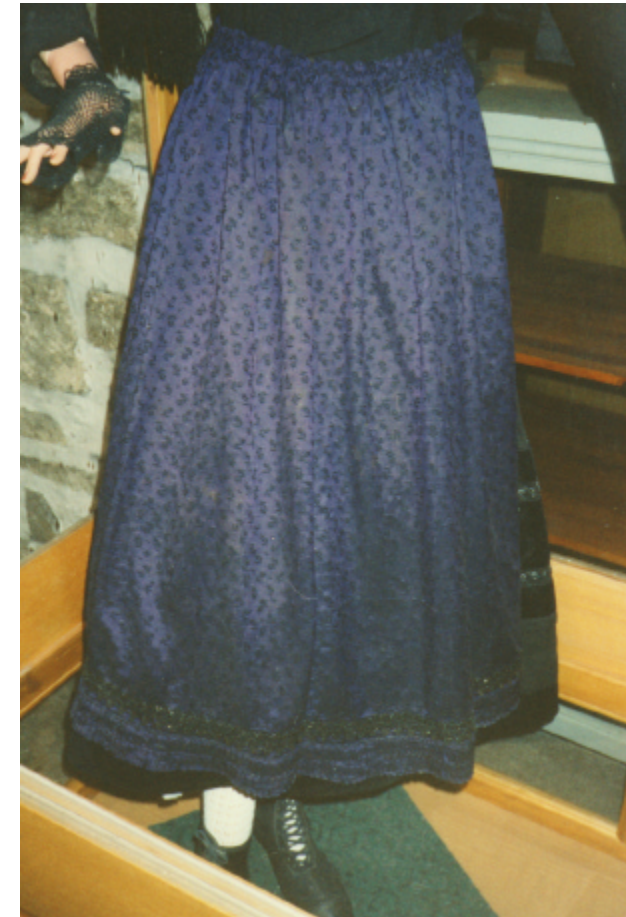
Ansicht der Schürze von vorn: