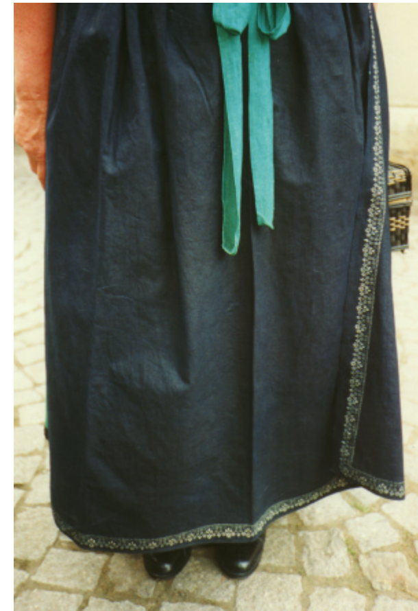
Ansicht der Schürze von vorn: