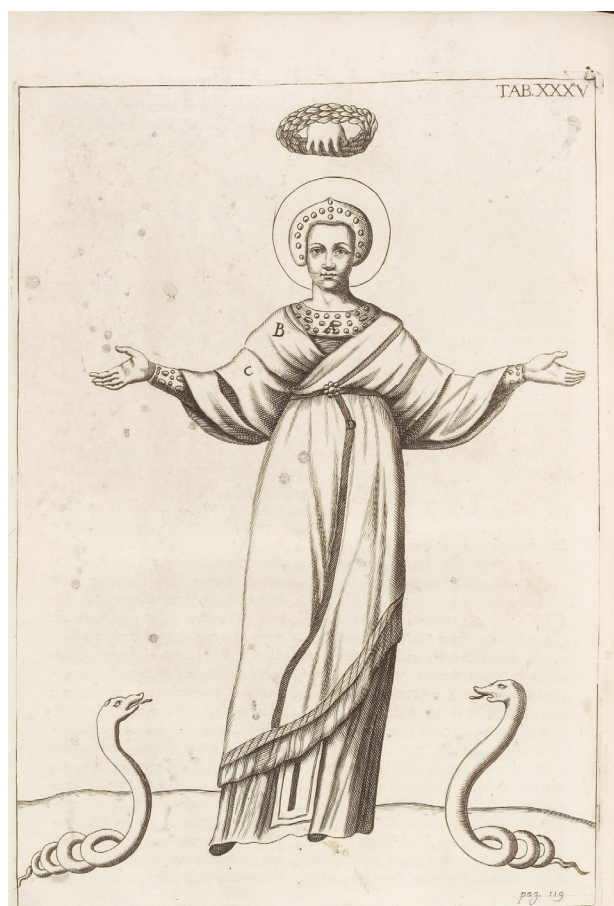
Abb. 5: Hl. Euphemia, Giovanni Ciampini, Vetera Monumenta , Bd. 2, Rom 1699, Tafel 35

Ob die Goldtesserae in Sant’Agnese (Abb. 6) wie diejenigen des Mosaiks der Cappella dei Santi Primo e Feliciano in Santo Stefano Rotondo (642–649) neu angefertigt wurden, was Elisabetta Neri anhand von