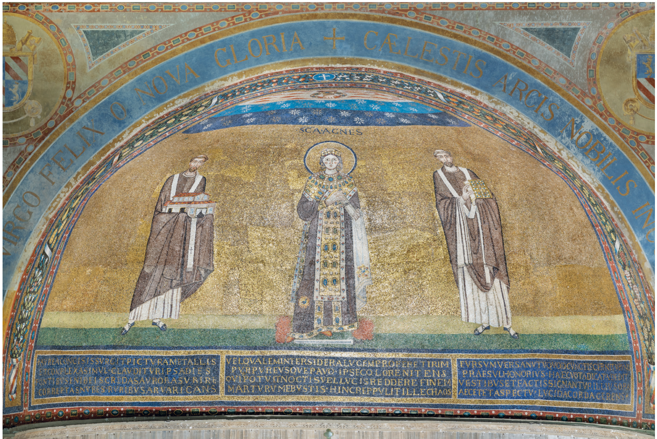
Abb. 1: Rom, Sant'Agnese fuori le mura, Apsismosaik

gesellschaftliche Bedeutungszuweisungen an Materialien 16 und deren Wahrnehmung in einem multisensorischen Kirchenraum, der Licht ebenso inszeniert wie Dunkelheit und für dessen Erfahrung der Prozess des Hinabsteigens in die Basilika ad corpus der Heiligen ein bedeutungsvoller Akt war. Gegenstand sind Gold, Marmor und Wolle ebenso wie die Materialität von Farbe – innerhalb des Mosaiks, aber auch mit Blick auf über das Mosaik hinausweisende Material- und Objekttopographien. Einbezogen werden Feuer als Manifestation von Licht und Wärme und das in der Inschrift entworfene Bild des Regenbogens. Die lokale Kontextualisierung des Mosaiks erfolgt innerhalb der kleinen Gruppe frühmittelalterlicher römischer Apsiskonzeptionen mit weiblicher Protagonistin: Sant'Eufemia, Santa Felicitas und mit einiger Wahrscheinlichkeit auch Santa Martina al foro romano.