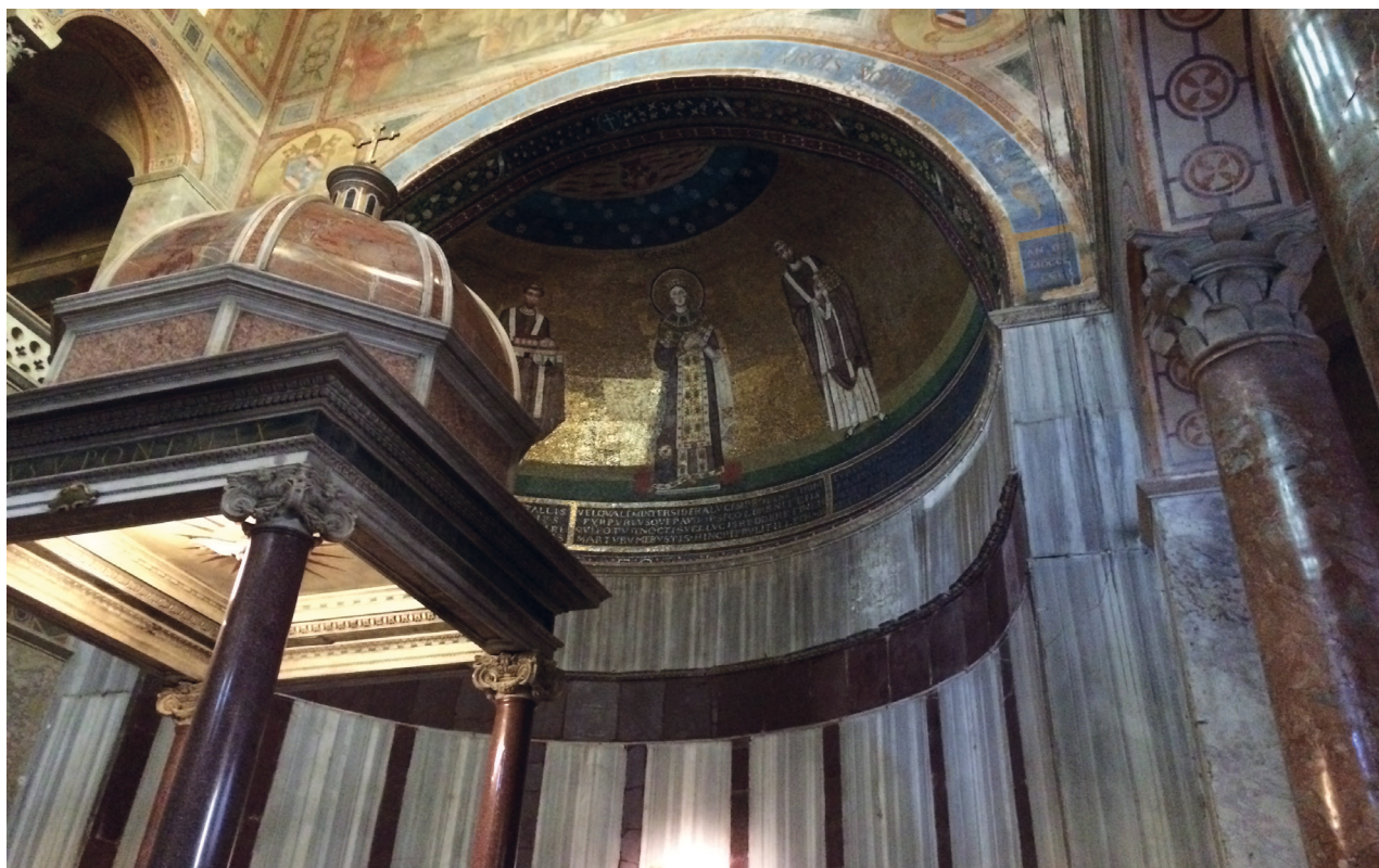
Abb. 8: Rom, Sant'Agnese fuori le mura, Apsiswand

Wahrnehmung von Purpur als hell und leuchtend. In Spätantike und Mittelalter war die Leuchtkraft einer Farbe von größerer Bedeutung als der Farbton. 94 Wie Dominic Janes betont: „Purple was associated with the white (bright) end of the spectrum“. 95