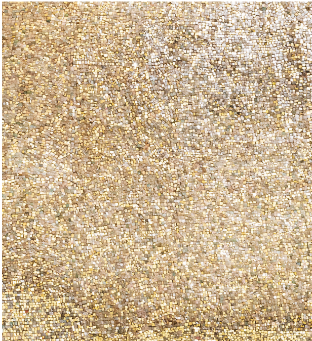
Abb. 6: Rom, Sant’Agnese fuori le mura, Apsismosaik, Goldgrund

Agnes ist Protagonistin eines ganzen Sets hagiographischer Texte des 4. bis 6. Jahrhunderts. 62 In diesen verkörpert sie ein in der Spätantike verbreitetes Rollenmodell weiblicher Heiligkeit: das der jungfräulichen Heiligen, der Braut Christi. 63 In den oftmals romanhaften Erzählungen mischen sich, darauf weist Cécile Lanéry hin, klassische Varianten weiblicher Heldinnen und christliche Modelle, „aussi la martyre chrétienne apparaît-elle comme l’émule romaine des vierges païennes, dans un contexte précisément marqué par la rivalité culturelle et littéraire entre païens et chrétiens.“ 64