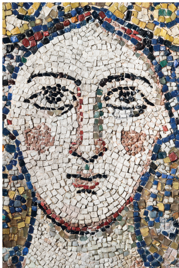
Abb. 7: Rom, Sant'Agnese fuori le mura, Apsismosaik, Hl. Agnes, © Domenico Ventura

Nicht allein Gold, auch der weiße Marmor, aus dem ungewöhnlicherweise das Gesicht der Heiligen geformt wurde (Abb. 7), ist ein Verweis auf die mit Agnes assoziierte Reinheit. 76 Per Jonas Nordhagen beschreibt grobe weiße Steintesserae, unterbrochen von orangefarbenen gläsernen Tesserae im Bereich der Wangen und gerahmt von Konturen aus dunklen Glastesserae, die sich deutlich von den weitaus feineren Marmortesserae unterscheiden, die sich im 8. Jahrhundert für die Gesichter der Figuren beispielsweise in der Kapelle Johannes VII. in Alt-St. Peter nachweisen lassen. 77 Diese Materialwahl entspricht spätantiken