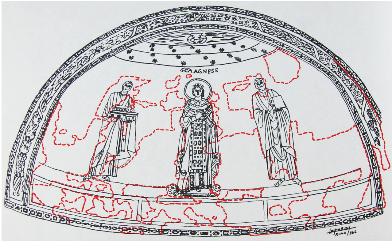
Abb. 4: Rom, Sant'Agnese fuori le mura, Apsismosaik, Oberflächenkartierung (Matthiae 1967)

erneut gereinigt, gelöster Putz gefestigt und lose Tesserae neu justiert. Eine anlässlich der Arbeiten erstellte Kartierung lokalisiert diese und die früheren Restaurierungen. Sie zeigt, dass im 19. Jahrhundert auch weite Teile des Goldgrundes und der Inschrift überarbeitet wurden. 44 Ziel der aktuellen Untersuchung durch das Dipartimento di Geoscienze der Universität Padua ist eine umfassende archäometrische Analyse, die es ermöglichen soll, das Mosaik anhand seines Materials, d.h. der gläsernen Tesserae, aus denen es gefertigt ist, in der Glas- und Mosaikproduktion Roms, Italiens und des Mittelmeerraums zu verorten. Auf der Basis der gewonnenen Daten sollen Materialströme entschlüsselt und ein tieferes Verständnis für die technische Ausführung des Mosaiks entwickelt werden. 45