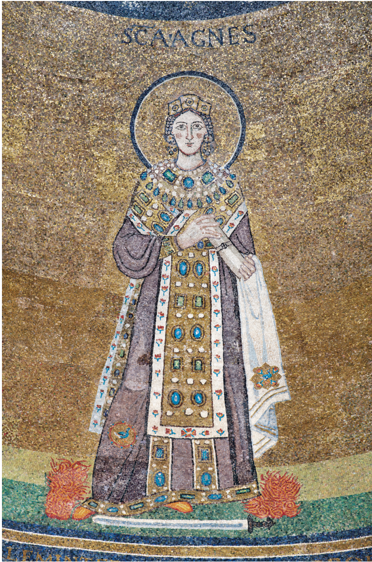
Abb. 3: Rom, Sant'Agnese fuori le mura, Apsismosaik, Hl. Agnes, © Domenico Ventura

vielfachen Restaurierungen und die Schwierigkeit, alle handelnden Personen mit Exaktheit zu bestimmen. 29