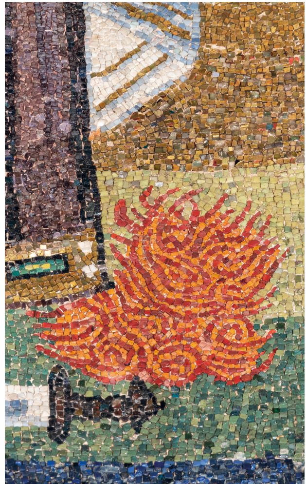
Abb. 9: Rom, Sant’Agnese fuori le mura, Apsismosaik, Flammen

In der bereits zitierten, noch heute existierenden Inschrift im Apsisrund, direkt unterhalb des Mosaiks, spielen Lichtmanifestationen eine hervorgehobene Rolle. 115 Die Inschrift wurde in goldenen Buchstaben auf blauem Grund ausgeführt und in drei Tabulae eingestellt. 116 Eine Besonderheit besteht darin, dass sie – neben weiteren hoch symbolischen Lichtphänomenen, wie zum Beispiel der Morgenröte – das Bild des Regenbogens evoziert. Wie das bereits diskutierte Feuer ist der Regenbogen ein ephemeres Phänomen.