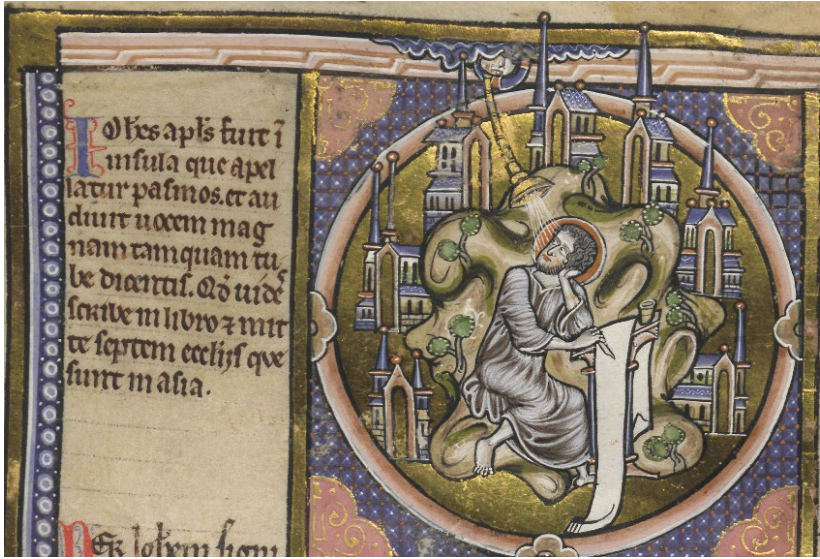
Abb. 1: Johannes auf Patmos. Bible moralisée , ca. 1225–1249, Deckfarben und Gold auf Pergament, 430 x 295 cm (Seite). Wien, ÖNB, Cod. 1179, fol. 223v.

Besonders viel Wert wurde auf die Visualisierung der Räumlichkeit der Kommunikation gelegt: Zu sehen sind das irdische Dort, also die sieben, sich in alle Richtungen verteilenden Gemeinden, das himmlische Anderswo, das sich außerhalb des Bildfeldes, jenseits des die Grenze bildenden Rahmens befindet, und natürlich die Insel Patmos als Ort des Geschehens, das als Schnittstelle zwischen Jenseitigem und Dortigem fungierende Hier. Neben den Orten sind auch alle in die Kommunikation involvierten Akteure dargestellt, die in dieser Komposition deutlich als raumdurchquerend und grenzüberwindend in Erscheinung treten: Gott, seine trompetengleiche Stimme, der sehende und lauschende Johannes, die Feder in seiner Hand, das Tintenfass und schließlich der Streifen Pergament, der sich zu uns Betrachter:innen hin entrollt und uns damit zu den Nächsten in dieser Reihe macht. Kettengleich sind Sender, Empfän-