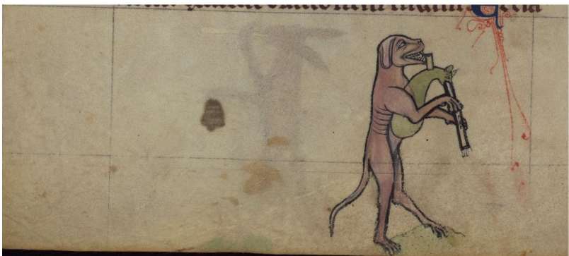
Abb. 7-9: Renarts Begräbnisprozession: Elefant, Esel und Hund. Baltimore, Walters Art Museum, W.102, fol. 73v, 75r und 75v.