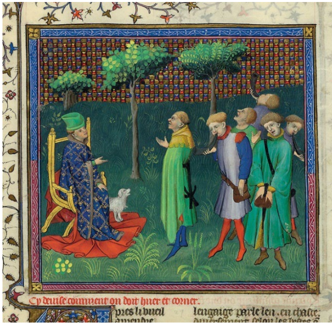
Abb. 3: „Etwas darüber, wie man die Hunde rufen und das Jagdhorn blasen soll.“ Livre de la chasse , 1406/07, Deckfarben und Gold auf Pergament, ca. 38 x 29 cm (Seite). New York, Pierpont Morgan Library, M.1044, fol. 45v.

es auf fol. 45v heißt, die verwendet werden, um „die Hunde zu rufen, sie zu schelten oder sie abzuliebeln, kurz alle Arten, mit ihnen zu kommunizieren“. 36 Zudem geht es um toutes manieirs de corner [alle Arten des Hornblasens] (fol. 45v), die etwa zum Anfrischen der Hunde eingesetzt werden oder mit denen zur Anjagd geblasen wird. Die Buchmalerei gibt alle Varianten wieder, sowohl die Versuche mit dem Horn, bei denen die geblähten und geröteten Wangen der Eleven die damit einhergehenden Mühen und Anstrengungen zeigen, als auch das Einüben der Rufe, ver-