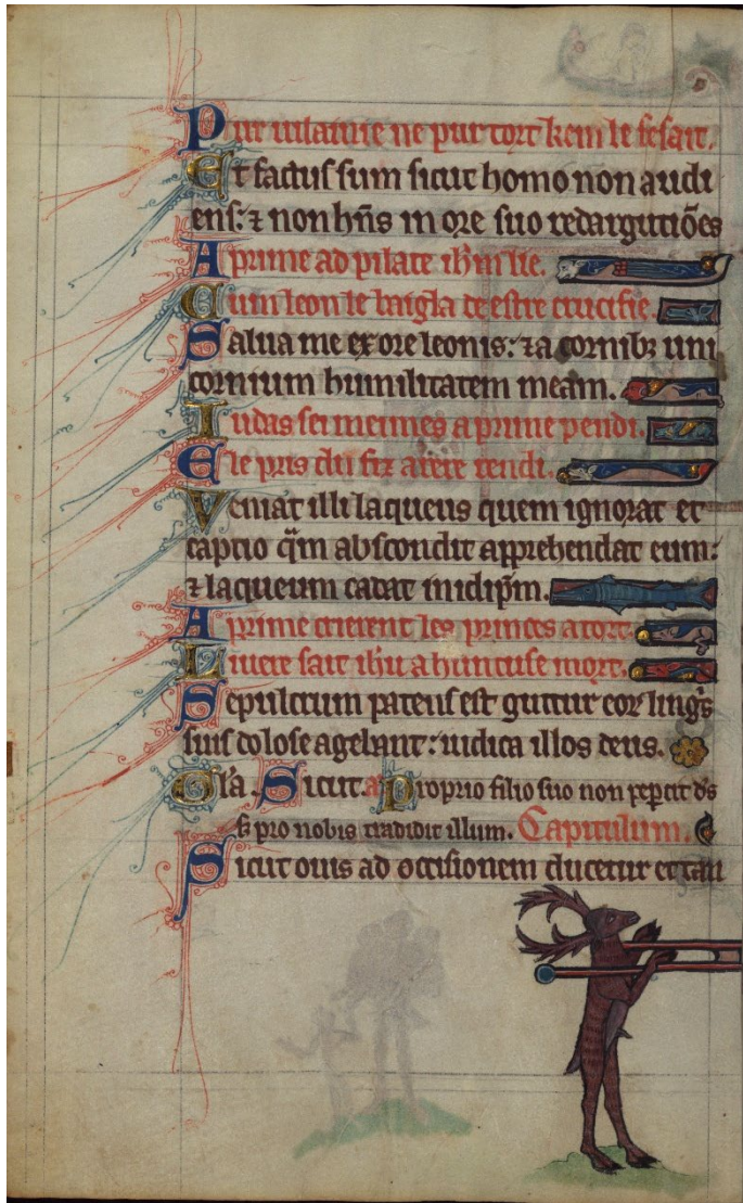
Abb. 10–11: Hirsch und Katze tragen die Bahre mit dem Fuchs. Walters Art Museum, W.102, fol. 78v/79r.