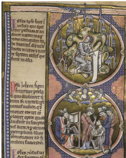
Abb. 12: Johannes auf Patmos und die Prälaten. Wien, ÖNB, Cod. 1179, fol. 223v (Detail).

zentraler Faktor mitgedacht. Klang ermöglicht es einerseits, wie insbesondere am Portal von San Leonardo al Frigido deutlich wurde, komplexe Beziehungsgeflechte zwischen Raum, Zeit und Handlung zu eröffnen, und andererseits, wie der Blick in das Jagdbuch gezeigt hat, Raum neu zu definieren, sowohl hinsichtlich der sich verändernden Beziehungen im von bestimmten Klangeindrücken dominierten Raum als auch in Bezug auf die Qualität des Raumes, etwa wenn die natürlichen Geräusche des Waldes von den artifiziellen Klängen der Jagd überlagert werden. Wie Auditivität im Bild räumliche Verbindungen schaffen und zum Memorieren und Abrufen von klanglichem Wissen anregen kann, zeigt die Prozession, die nicht von erhabenen Klängen begleitet wird, sondern in der Karikatur eines religiösen Rituals die klangbezogene Vorstellungskraft der Betrachter:innen vor eine besondere Herausforderung stellt.