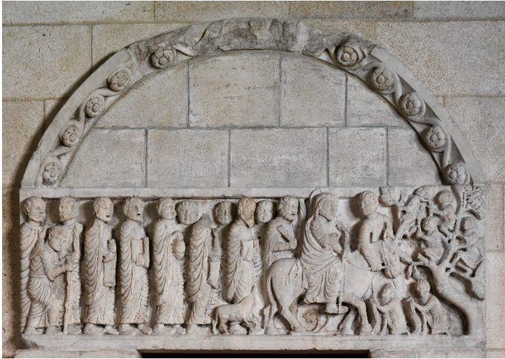
Abb. 2: Türsturz von San Leonardo al Frigido, ca. 1175, Marmor, 401,3 x 193 cm (Portal). New York, Metropolitan Museum of Art, Inv.-Nr. 62.189.