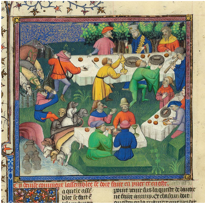
Abb. 5: „Wie man im Sommer und im Winter die Jagdversammlung abhalten soll.“ Livre de la chasse , 1406/07, Deckfarben und Gold auf Pergament, ca. 38 x 29 cm (Seite). New York, Pierpont Morgan Library, M.1044, fol. 58r.