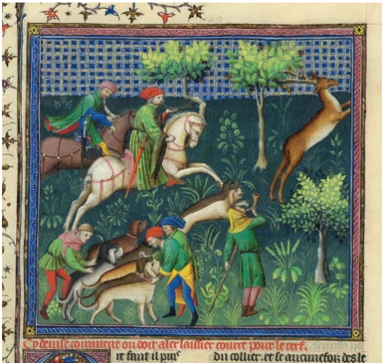
Abb. 4: „Wie man anjagen und den Hirsch hetzen soll.“ Livre de la chasse , 1406/07, Deckfarben und Gold auf Pergament, ca. 38 x 29 cm (Seite). New York, Pierpont Morgan Library, M.1044, fol. 59r.

einfache Kleidung, also kurze Röcke und Kapuzen, tragen. An der Darstellung des linken Jägers lässt sich erneut ein besonderes klangliches Detail finden: Er greift mit Hand in die Schallöffnung seines Horns, moduliert so den Ton und erweitert damit die tonalen Möglichkeiten der Signalgebung. Diese Praxis findet auch heute noch beim Spielen auf ventillosen Hörnern Anwendung.