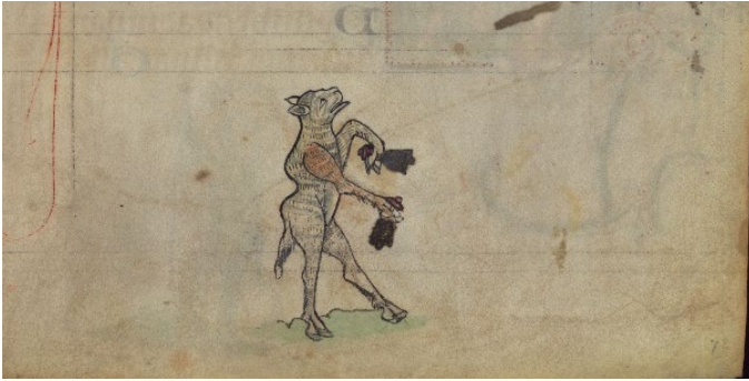
Abb. 6: Renarts Begräbnisprozession: Schaf. Stundenbuch, gegen 1300, Deckfarben auf Pergament, 26,7 x 18,7 cm (Seite). Baltimore, Walters Art Museum, W.102, fol. 73r.

73v/74r, die links einen als Pilger ausgestaffierten Elefanten (Abb. 7) und rechts einen das Horn blasenden Stier zeigt. Im Detail spiegelt das Figurenpar der Doppelseite den sarkastisch-derben Humor der Renart-Erzählungen und greift dabei auf mit Klang verbundene Elemente zurück: Das vom Stier geblasene Instrument erinnert in seiner Form stark an einen Olifant, also ein aus dem Stoßzahn eines Elefanten gefertigtes Horn, und zugleich an den Rüssel des gegenüberstehenden Exemplars. Wie das Schaf schreiten auch diese beiden Tiere nach rechts gewandt aus, alle drei eint also eine gleichgerichtete Bewegungsdynamik, die den meisten der folgenden Charaktere ebenfalls innewohnt und die für die visuelle Vermittlung der Reihe als Prozession entscheidend ist. 47 Der von der Prozession durchschrittene Raum ist hier jedoch keine Landschaft, keine Stadt. Das räumliche Umfeld der Figuren bleibt weitgehend ungestaltet, von einem in ein oder zwei Linien mit ein wenig grüner Wasserfarbe angedeutetem Boden einmal abgesehen. So ist es in erster Linie der Buchraum, der hier durchschritten wird.