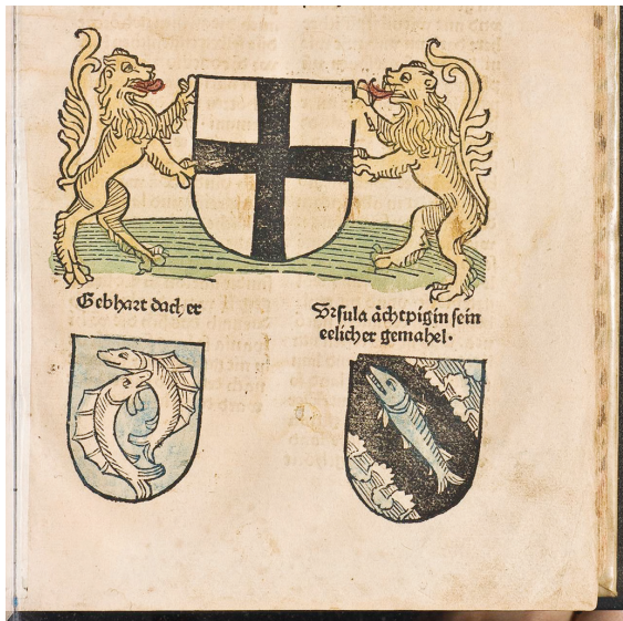
Abb. 7: Konstanzer Stadtwappen im Erstdruck der Richental-Chronik (D1, fol. 111, Detail).

Zieht man also die Schildform zur Datierung heran, könnte die älteste Konstanzer Kleinmünze mit dem neuen Wappen in der Tat der von Cahn hervorgehobene Pfennig sein (Cahn Nr. 89; Abbildung 5), der einen Wappenschild mit geradem Rand zeigt. Auch ein Zweier mit Perlrund, den Nau gegen Cahn auf 1505 datiert (Cahn Nr. 89 = Nau Nr. 49) zeigt einen geraden Schild zwischen zwei Punkten, darüber ein »C« und ähnelt darin am ehesten dem Pfennig Nau Nr. 12, der allerdings einen stark geschwungenen Schild zeigt und einen