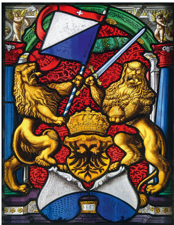
Abb. 2: Wappen und Banner (mit rotem Schwenkel) der Stadt Zürich auf einem Glasfenster im Kloster Muri (1557).

Damit folgte Sigismund der siebten von insgesamt acht Bitten, die der Konstanzer Rat formuliert hatte. 8 Für die Zeitgenossen war klar, dass Wappen und Banner nicht das gleiche waren, denn so wie Konstanz nur eine Besserung des Banners erhielt, erbeten und erhielten andere Städte Besserungen nur ihres Wappens, während wieder andere beides bessern ließen. 9 Dass Städte ihre Wappen in Anlehnung an ihr Banner gestalteten, ist nicht ungewöhnlich und wird zum Beispiel auch für Baden im Aargau vermutet, dessen Wappen dem (heutigen) Konstanzer Wappen sehr ähnlich ist: ein schwarzer Pfahl auf weißem Grund unter einem roten Schildhaupt. 10 Dennoch musste ein Schwenkel (in den Quellen auch schwanz oder zagel genannt) auf einem Banner auch