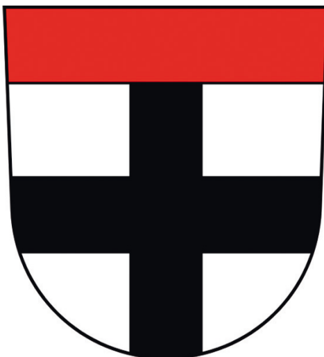
Abb. 1: Das Wappen der Stadt Konstanz: Ein schwarzes Kreuz auf weißem (silbernen) Grund unter einem rotem Schildhaupt.

Die Erinnerung an das Konstanzer Konzil hat sich, von der Konzilszeit bis zum derzeitigen Jubiläum, in vielfältigen Formen in vielen Medien niedergeschlagen. »Chroniken, Briefe, Lieder und Sprüche« erinnerten an das große Ereignis und sind in der Forschung seit langem gut untersucht. 1 Weit weniger erforscht sind Wappen, auch wenn die Wappensammlung der Richental-Chronik allmählich mehr Beachtung findet. 2 Sie steht keineswegs allein, in Ravensburg z. B. erinnerte das Wappenprogramm des sogenannten Mohrenfreskos an das Konzil. 3 Auch einzelne Konzilsteilnehmer nahmen vom Konzil heraldische Erinnerungen mit, konkret in Form von Wappenbriefen, die ihnen neu verliehene oder »gebesserte« Wappen bestätigten. 4 König Sigismund selbst, der diese Wappenbriefe ausstellte, entwarf in Konstanz das Wappenprogramm für sein kaiserliches Majestätssiegel, das er erst viele Jahre später nutzen sollte. 5