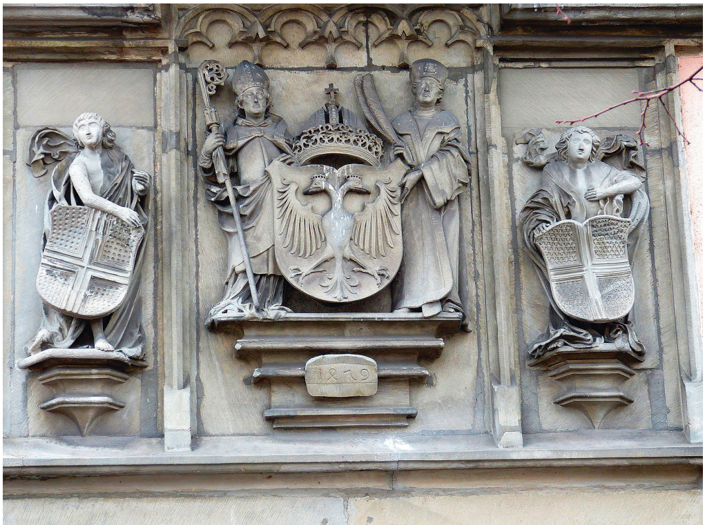
Abb. 8: Wappentafel am Rathaus.

Man sollte allerdings vorsichtig sein, aus diesem Befund auf einen allgemeinen Wechsel in der heraldischen Selbstdarstellung des Rates zu schließen. In anderen Quellen ist davon jedenfalls nichts zu bemerken, insbesondere auch nicht in den ratsnah produzierten städtischen Chroniken. In diesen spielt Sigismunds Privileg durchaus eine Rolle – unter anderem taucht es als Textinsert in mehreren Handschriften und allen Drucken der Richental-Chronik auf. 34 Es handelt sich um einen späten Zweig der Überlieferung, der eine Verbindung zwischen der Werkstatt Gebhard Dachers und den Drucken herstellt. 35 Allerdings wird das Privileg in diesen Handschriften und Drucken in keiner Weise mit dem städtischen Wappen in Verbindung gebracht. Auch in seiner eigenen