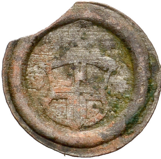
Abb. 3: Nau Nr. 12. Siehe künftig REINHART (wie Anm. 16).

enfeld infolge der Verpfändung des Thurgauer Landgerichts, und mit der Ausdehnung des Vogteigerichts auf Petershausen erhielt Konstanz auch den dortigen Blutbann verliehen. 14 Die Verbindung zwischen Blutbann und rotem Schwenkel ist allerdings keineswegs zwingend; das schon erwähnte Zürich, dessen Banner einen solchen Schwenkel zeigte, übte jedenfalls keinen Blutbann aus. Die rote Farbe kann grundsätzlich auch mit dem »königlichen« Purpur in Verbindung gebracht werden, mit dem Status als Reichsstadt 15 sowie, im Fall von Konstanz, auch mit dem Wunsch, mit dem bischöflichen Stadtherren hinsichtlich des Banners gleichziehen zu wollen.