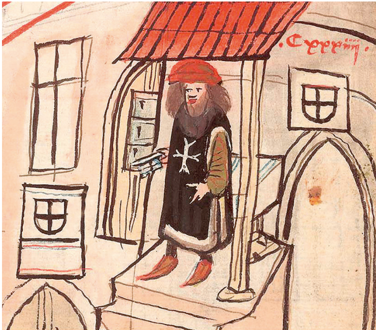
Abb. 12: Die Prager Richental-Handschrift zeigt meist das alte, vereinzelt aber auch das neue Wappen und einmal auch beide Formen auf der gleichen Seite: Pr, fol. 133r (Detail).

Der Unterschied scheint also nicht so sehr auf Seiten der Produzenten zu liegen (denn auch die Dacher-Handschriften, das Rathausportal und die Selbstdarstellung der Katz sind ratsnah entstanden), und auch nur teilweise der Rezipienten. Als Trägerme-