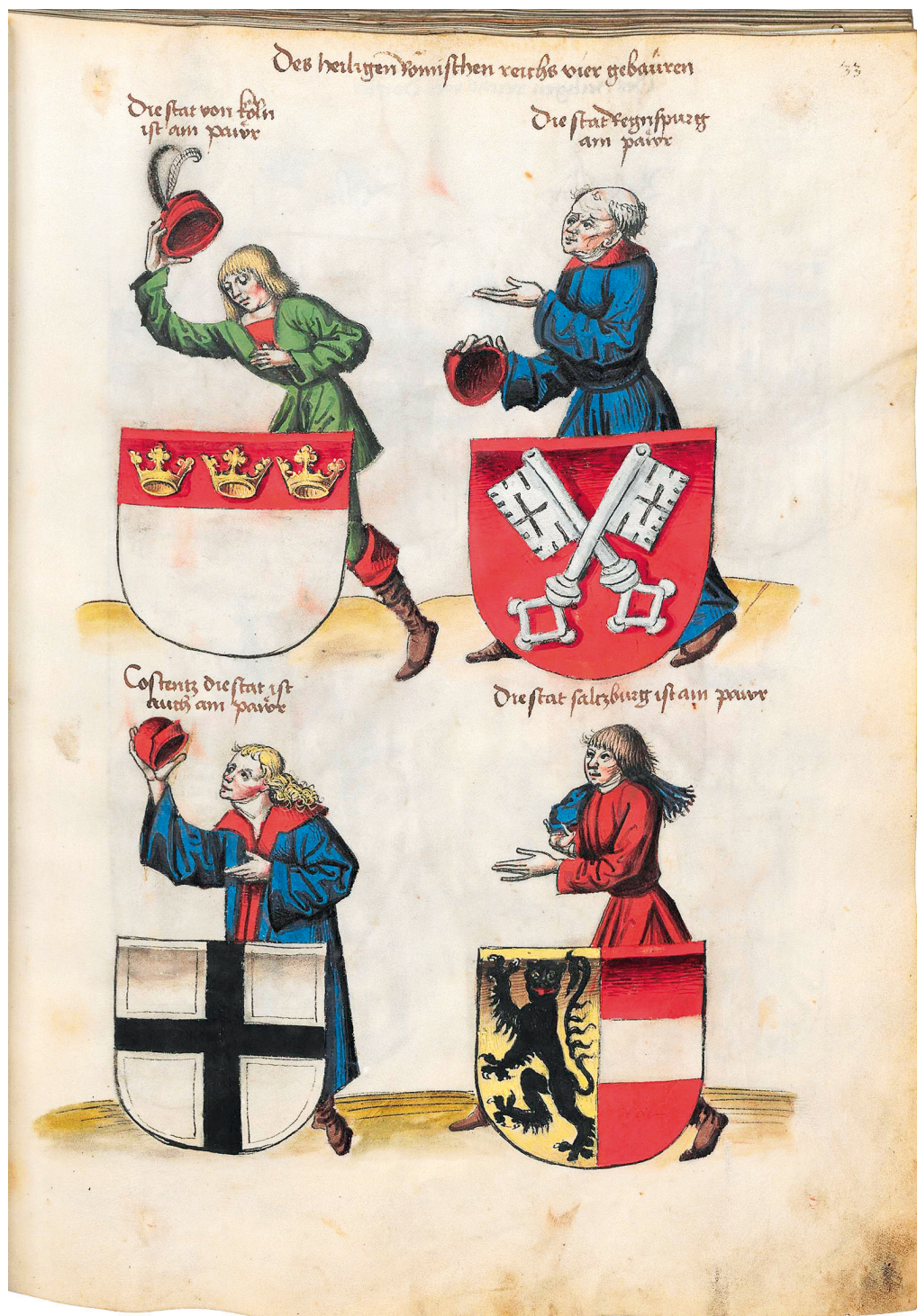
Abb. 9: Die »Vier Bauern« in Grünenbergs Wappenbuch: München, Bayerische Staatsbibliothek Cgm 145, S. 33.