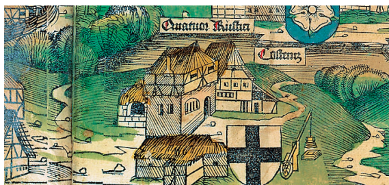
Abb. 10: Konstanz unter den »Vier Bauern« in der Schedel'schen Weltchronik.

Die weit ins 16. Jahrhundert anhaltende Verbreitung des alten Wappens ausgerechnet im Süden des Reichs (wo die meisten der hier angeführten Wappenbücher entstanden) dürfte paradoxerweise mit der Bedeutung der Konstanzer Wappenbücher zusammenhängen: Sowohl die Wappensammlung Richentals als auch Grünenbergs Wappenbuch gehörten zu den einflussreichsten Vertretern dieses Genres, aber da beide (je nach Fassung) auch oder sogar nur das alte Wappen enthielten, trugen sie erheblich zu