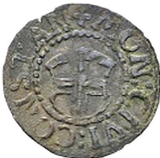
Abb. 6: Nau Nr. 93. Siehe künftig REINHART (wie Anm. 16).