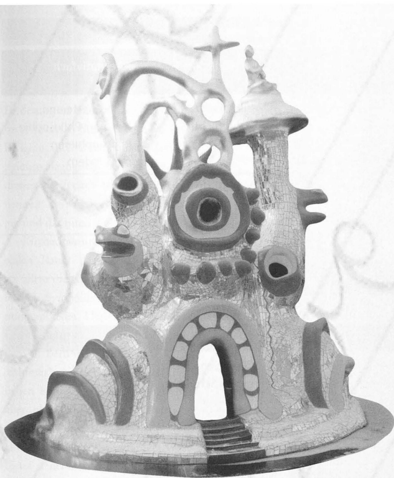
Wie Kunst der „Religion Raum gibt“: Niki de Saint Phalle's „Le temple idéal“ (1991)

auf Schritt und Tritt begegnen würden, die es gelte, im Lernraum Schule zu erschließen und zu deuten.