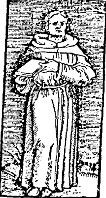
Veritatem meditabitur guttur meum.