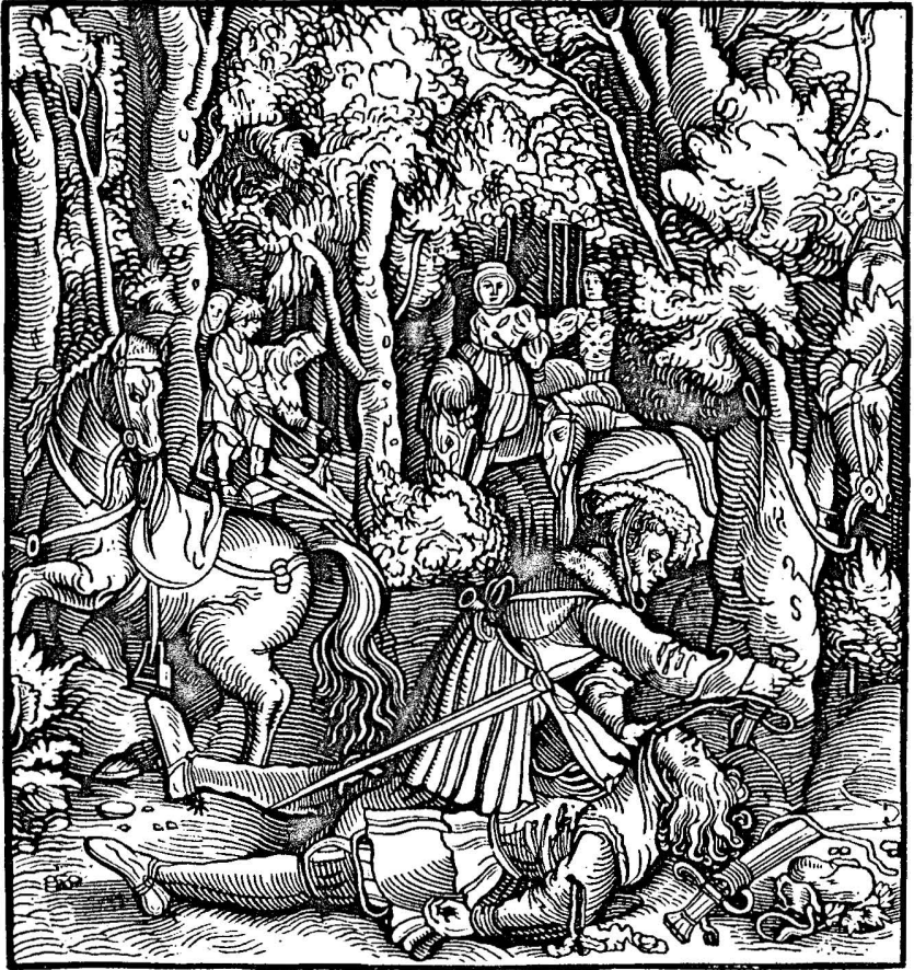
Ermordung des Hans von Hutten durch Herzog Ulrich von Württemberg. Illustration aus Huttens Invektiven gegen den Herzog (Kat.Nr. 32).