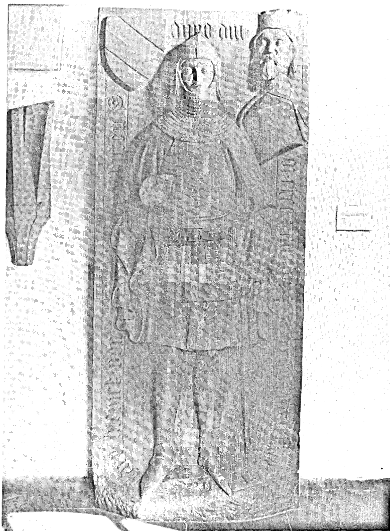
Grabmal des Ludwig von Hutten (gest. 1414) im Kloster Himmelsforten, Würzburg.