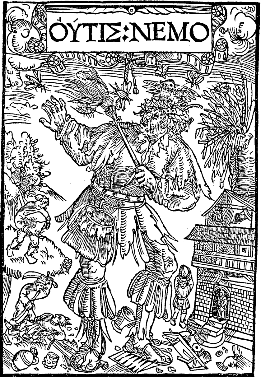
Titelblatt zu Huttens "Outis: Nemo" (Kat.Nr. 43).