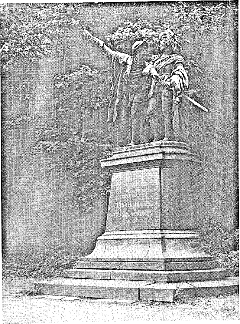
Denkmal für Ulrich von Hutten und Franz von Sickingen unterhalb der Ebernburg