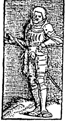
Perrumpendum est tan- dem, perrumpendum est.