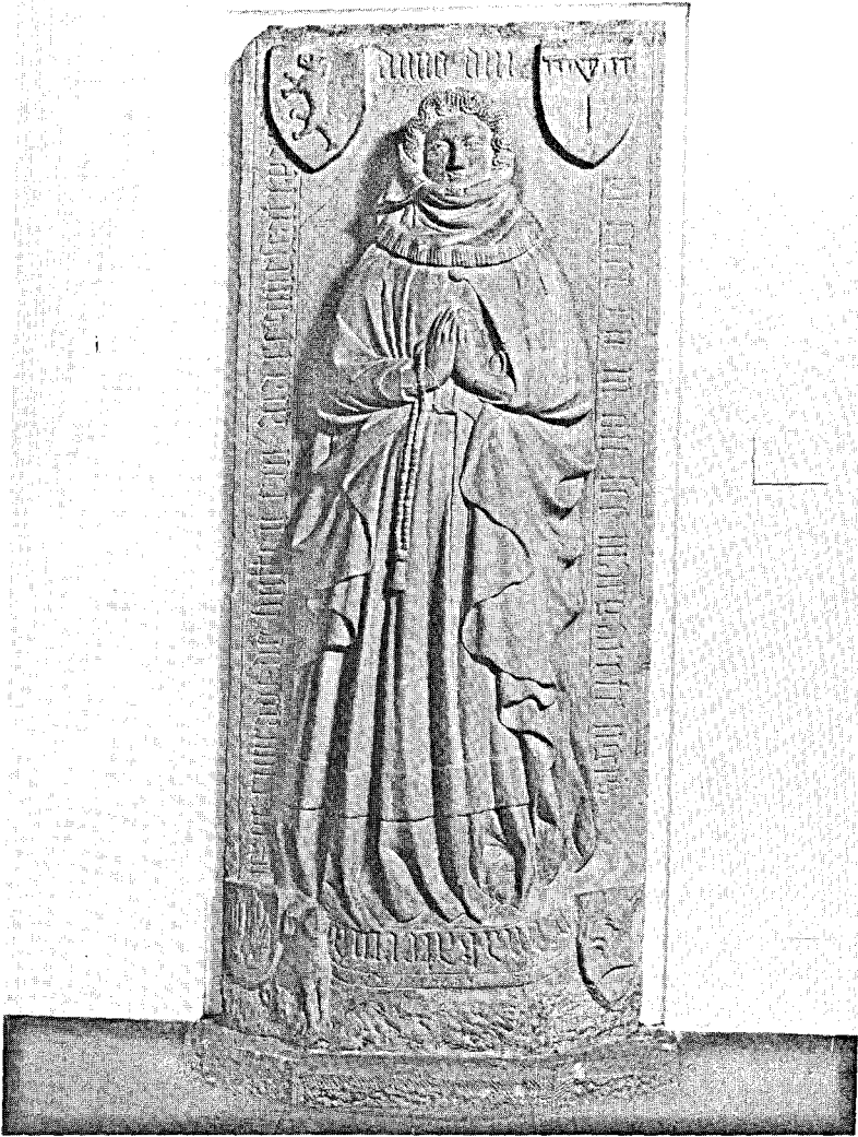
Grabmal der Katharina von Hutten (gest. 1415) im Kloster Himmelspforten, Würzburg.