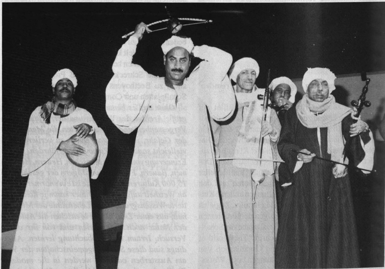
Schamandi-Ensemble, Ägypten: Volksmusik und Tanz aus Oberägypten

Wir wollen klar machen, daß Musik geeigneter ist als jedes andere Medium, Vorurteile zwischen den Menschen unterschiedlicher Kulturen abzubauen und Toleranz und gegenseitiges Verständnis wachzuhalten, und wir wollen mit diesem Projekt einen