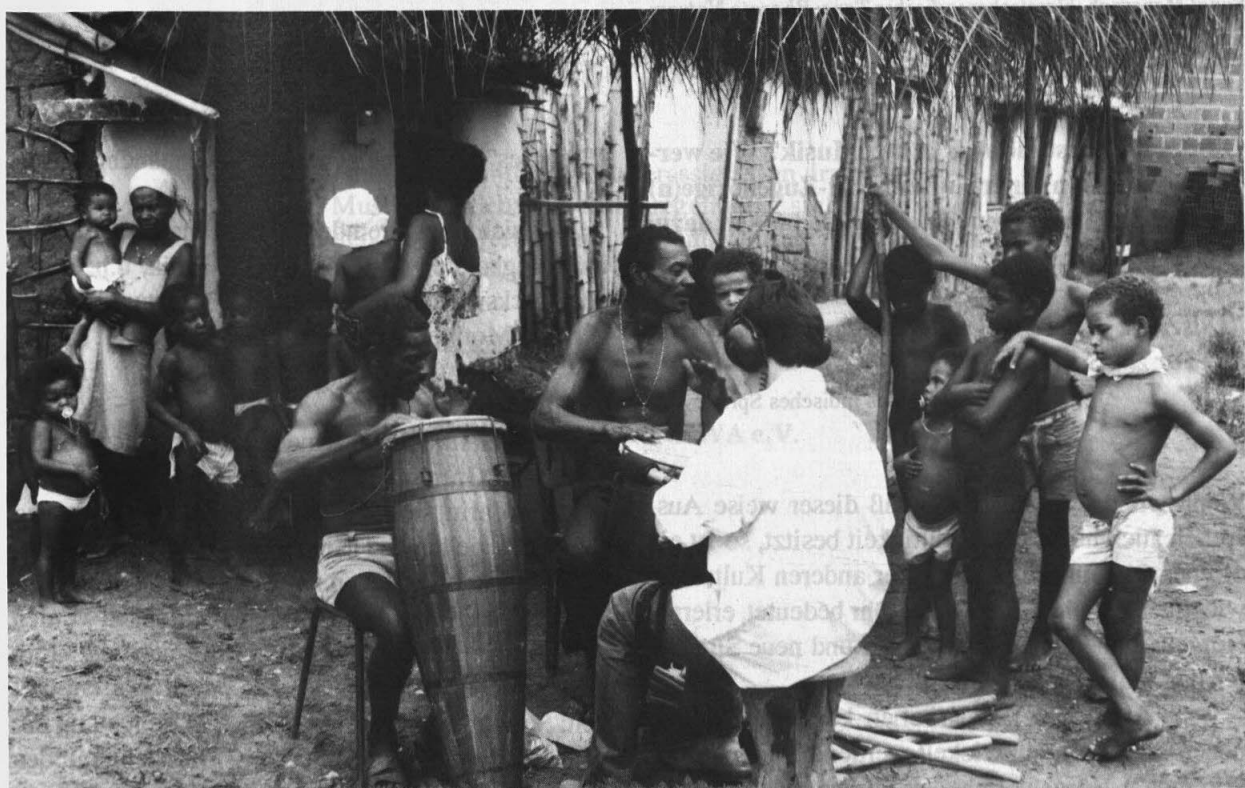
Partnerschaft mit Institutionen in Brasilien: Feldforschung in Bahia