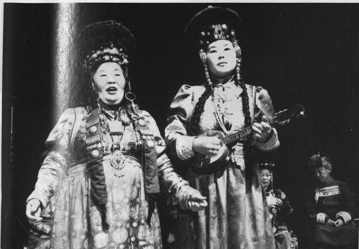
Sängerin und Musikerin der Bursiaten aus Sibirien