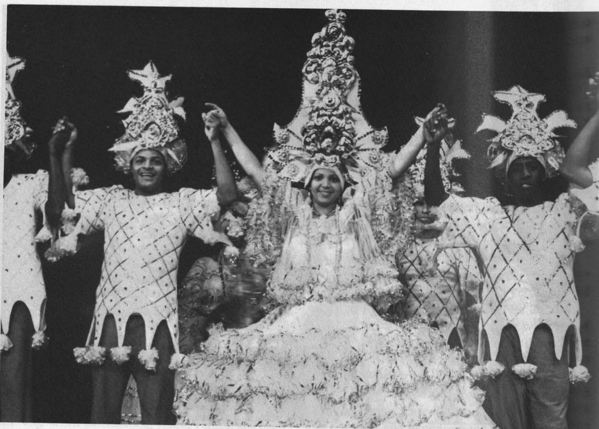
Musiker und Tänzer der "Escola de Samba Gigante", Brasilien

und Imagination durch einen "erweiterten Kulturbegriff" zu seinem Recht kommen lassen.