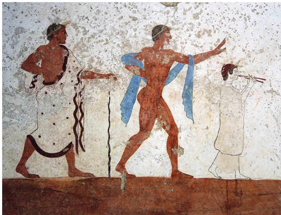
Fig. 5: Paestum, Tomba del tuffatore, particolare della parete ovest, 480–470 a.C. circa