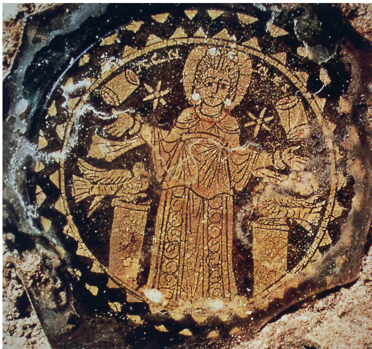
Fig. 4: Roma, Catacomba di Panfilo, Vetro dorato raffigurante Sant'Agnese incastonato nella malta di chiusura di un loculo, seconda metà IV secolo

Vergine, come sostenuto da Eileen Rubery (Fig. 4). 14 Quel che è degno di nota in questo contesto è che, a differenza di quanto accadrà nel mosaico di Onorio, sui vetri paleocristiani Agnese è spesso affiancata da colombe che le offrono la corona, come a insistere sul ruolo della purezza nell'avvenuto martirio. 15 Un concetto esplicitato nella pittura posta a lato dell'arcosolio di fondo del cubicolo dell'ufficiale dell'annona Leone nella catacomba di Commodilla (400 circa), dove ai piedi di Agnese è raffigurato l'attributo 'didascalico' dell'agnello, che la distinguerà anche nella più tarda processione di vergini di Sant'Apollinare Nuovo (seconda metà VI secolo). 16