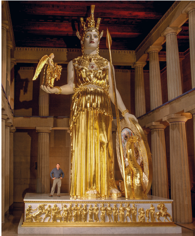
Fig. 6: Nashville's Centennial Park, Ricostruzione ipotetica della Statua Criselefantina dell'Athena del Partenone, realizzata da Alan LeQuire

mosaicisti non sarebbe mancata la possibilità di dare al volto della santa un'analogia colorazione bianco latte anche usando tessere vitree. L'introduzione di un materiale che si presenta come palombino permetteva di ottenere un colore bianco-beige in qualche modo diverso da quello dato dalle paste vitree, ma soprattutto di produrre un diverso effetto materico, una diversa texture . Il volto della santa emergeva così chiaro e opaco nello spazio del santuario, caratterizzato dal vibrante riverbero generato dal dialogo orchestrato tra il mosaico dorato del catino, il rivestimento marmoreo dell'emiciclo e il ciborio, pure dorato.