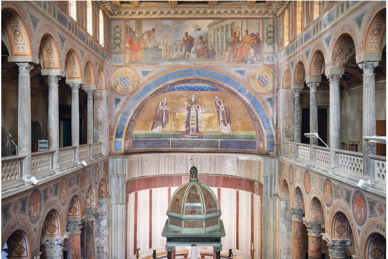
Fig. 1: Roma, Sant'Agnese fuori le mura (625–638), © Domenico Ventura

Santo Stefano Rotondo, il mosaico di Sant'Agnese si distingue radicalmente da quella pratica, non soltanto per l'uso del materiale litico limitato al volto, ma soprattutto per il tipo di tessere scelte e la conseguente ricerca formale. 8 A differenza di quanto sperimentato nei mosaici 'bizantini' e di quel che sarà messo in opera pochi decenni più tardi a Santo Stefano Rotondo, dove con tessere in pietra naturale, diverse per tonalità cromatica, grandezza e forma, si ricerca un effetto di plasticità e naturalezza fisionomica ed espressiva, il volto di Agnese è formato da tessere di uguale forma e colore che, in assenza di qualsiasi sfumatura, compongono un viso piatto sul quale i tratti fisionomici sono come disegnati da filari di tessere nere, rosse e verdi; l'unica parvenza di un soffio vitale è suggerita da due gruppi di tessere rosso pastello sulle gote (Fig. 2–3).