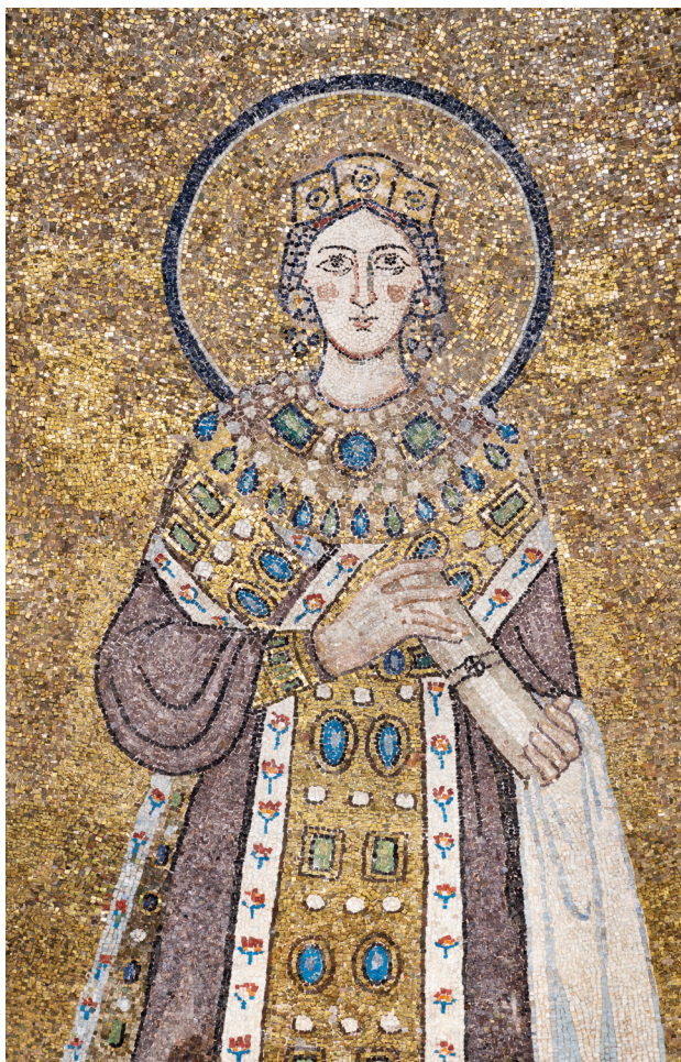
Fig. 2: Roma, Sant'Agnese fuori le mura (625–638), particolare della figura di Agnese

eventualmente estesa, per conformità, anche ai volti dei pontefici. Con Manuela Gianandrea abbiamo evidenziato l'impatto dalla scelta di tessere litiche, uguali per forma e colore, sull'aspetto ieratico della figura: le conferiscono un senso di distanza rispetto all'osservatore, contribuendo ad esprimere un tratto precipuo della biografia, e quindi del culto, di Agnese, ovvero la purezza. 11 Topos della santità femminile, la difesa della verginità fu il fattore scatenante del martirio della santa, sul quale convergono tutte le fonti note, che insistono sulla prontezza della giovane nel subire qualsiasi supplizio pur di mantenersi per il suo sposo celeste. 12 Prima di approfondire in che modo la scelta materiale, e quindi cromatica, adottata per il volto di Agnese si inserisca in una ricerca legata all'espressione delle sue virtù, è importante soffermarsi su alcuni particolari iconografici. Rispetto alla tradizione precedente, infatti, nel mosaico onorario il martirio è suggerito dalla spada e dalle fiamme poste ai suoi piedi, come a sintetizzare la morte per decapitazione o al rogo, variamente attestata nelle fonti, grazie alla quale ottiene, dalla mano