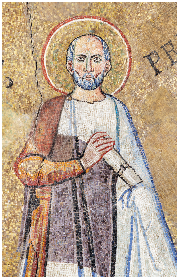
Fig. 3: Roma, Santo Stefano Rotondo, Cappella dei Santi Primo e Feliciano (642–649), particolare della figura di Primo, © Domenico Ventura

eventualmente estesa, per conformità, anche ai volti dei pontefici. Con Manuela Gianandrea abbiamo evidenziato l'impatto dalla scelta di tessere litiche, uguali per forma e colore, sull'aspetto ieratico della figura: le conferiscono un senso di distanza rispetto all'osservatore, contribuendo ad esprimere un tratto precipuo della biografia, e quindi del culto, di Agnese, ovvero la purezza. 11 Topos della santità femminile, la difesa della verginità fu il fattore scatenante del martirio della santa, sul quale convergono tutte le fonti note, che insistono sulla prontezza della giovane nel subire qualsiasi supplizio pur di mantenersi per il suo sposo celeste. 12 Prima di approfondire in che modo la scelta materiale, e quindi cromatica, adottata per il volto di Agnese si inserisca in una ricerca legata all'espressione delle sue virtù, è importante soffermarsi su alcuni particolari iconografici. Rispetto alla tradizione precedente, infatti, nel mosaico onorario il martirio è suggerito dalla spada e dalle fiamme poste ai suoi piedi, come a sintetizzare la morte per decapitazione o al rogo, variamente attestata nelle fonti, grazie alla quale ottiene, dalla mano