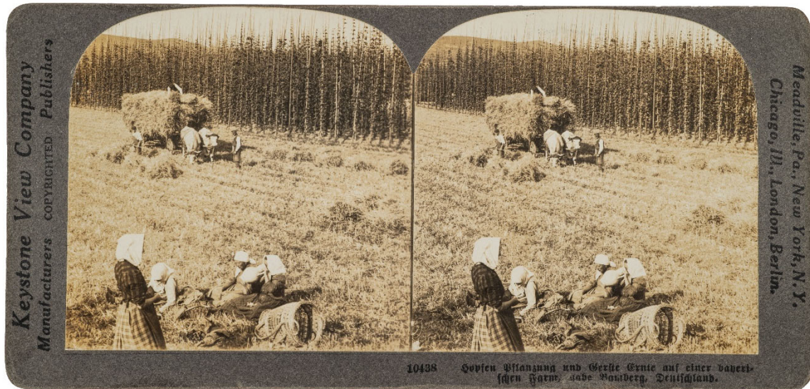
Abb. 2: „Hopfen Pflanzung und Gerste Ernte auf einer bayerischen Farm nahe Bamberg, Deutschland.“

Bildnr. 10438, undatiert.