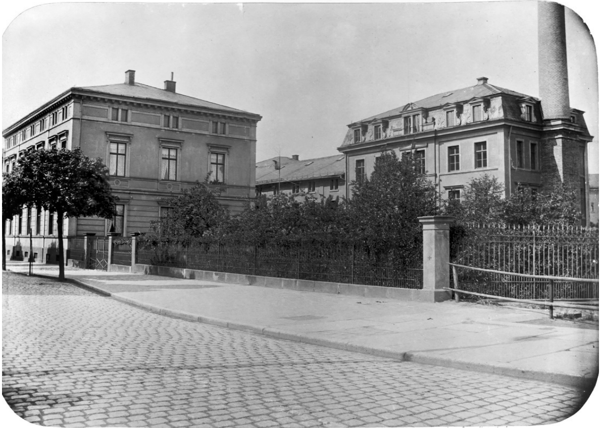
Abb. 3: Die Sophienstraße als Allee vor dem Erreichen der Sophienbrücke über den rechten Regnitzarm mit Blick auf die Treumann'sche Hopfenhandlung, Nr. 13.

konnten die Darren, von denen auch Feuergefahr ausging, mit behördlicher Genehmigung ihren Platz finden (Abb. 3-4). Es entstand eine städtebaulich einzigartige Struktur durch die Kombination von Villen mit parkartigen Gärten und Emissionen verursachenden Gewerbeanlagen, saisonal begleitet von regem Frachtfuhrverkehr (vgl. Eidloth).