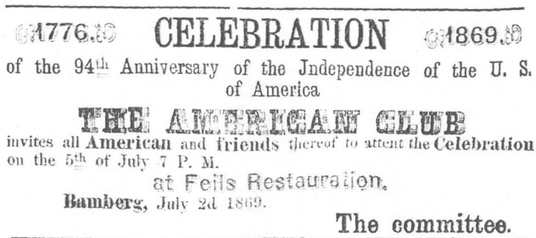
Abb. 6: Einladung zur Feier des Fourth of July (BNN 03.07.1869).

Im Juli 1869 wurde zur Feier der Unabhängigkeitserklärung in den Feilschen Garten eingeladen (BNN 04.07.1869; Abb. 6).