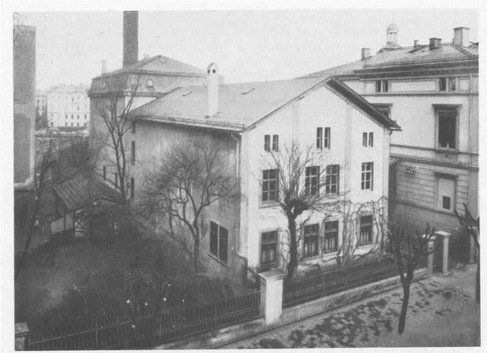
Abb. 4: Rückwärtige Ansicht der ursprünglich Treumann'schen Hopfenhandlung, vorn die Brückenstraße, die rechts in die Sophienstraße mündet. Letzter Nutzer war die jüdische Fa. Gebrüder Heßberg. Sie erlosch Ende 1938.

Bildunterschrift: „Dieses Hopfenlager mit Trockenanlage und Schornstein stand neben der Reichsbank [Nebenstelle Bamberg, re. angeschnitten, Sophienstr. 13]. Das Gebäude samt Schlot wurde 1934 eingelegt.“ (Schneidmadl 164).