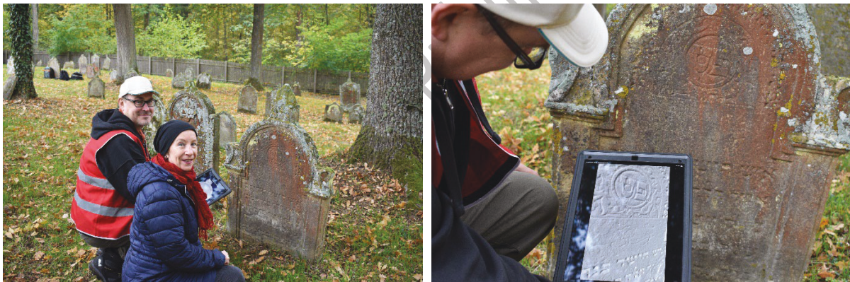
Arbeit auf den Friedhöfen, hier Friedhof Walsdorf: Abgleich Digitalisierung durch Photogrammetrie auf Tablet und realer Stein ermöglicht bessere Lesbarkeit.

Im ersten Schritt wird eine digitale Erfassung und Erschließung der ausgewählten Friedhöfe durch die Digitalen Denkmaltechnologien vorgenommen. Sie dient als Grundlage für weitere Bearbeitung und Analyse durch Bauforschung und Epigraphik. Die Lage der Friedhöfe in Franken in Cluster 1 ist vorteilhaft für die digitale Erfassung vor Ort und die Nachbearbeitung. Alle Arbeitsabläufe sollen hier zunächst in Bayern erprobt und konsolidiert werden, bevor sie auf alle beforschten Friedhöfe übertragen werden.