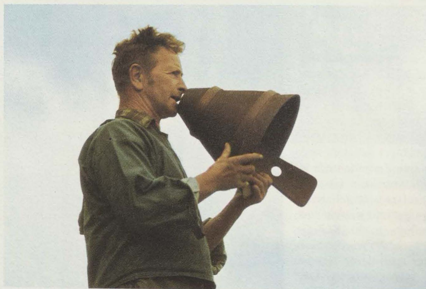
Oben rechts: Alphorntrio bei einem Alphorntreffen in Schleching in den Chiemgauer Alpen.

Verschiedene Arten von Hirtenhörnern (Kuhhorn, Ziegenhorn), aber auch das von weither eingeführte Tritonmuschelhorn wurden und werden zum Teil noch verwendet, um das Vieh ein- und auszutreiben, oder sie dienen als gewöhnliche Signalinstrumente oder Wetterhörner. Schellen, Glocken und Peitschenknallen, ganz allgemein das Fahrgekläute einer Herde, wie es schon seit dem 15. Jh. nachweisbar ist, sind der Stolz eines jeden Sennen bei der Almauffahrt und beim Almabtrieb.