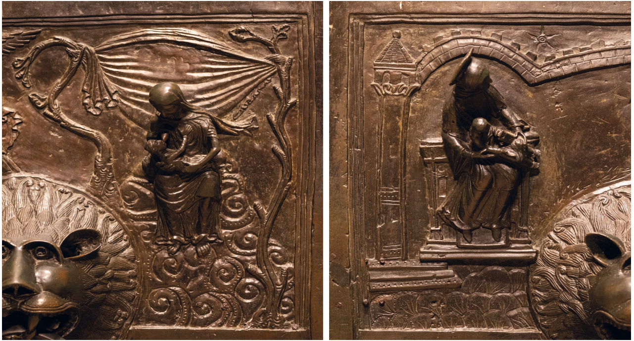
Abb. 3: Hildesheim, Bernwardstafel – Eva und Maria, 1015

der Darstellung dieses fruchtbaren grünen Grunds zum Ausdruck kommen.