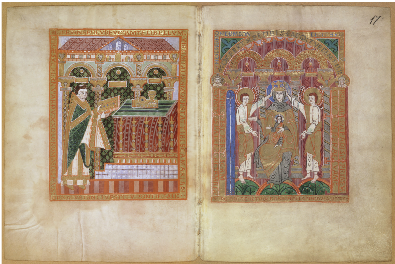
Abb. 4: Hildesheim, Kostbares Evangeliar, um 1015, Widmungsbild und Marienkrönung, fol. 18v und 17r AA

Landschaft um Hildesheim. Die heidnische Wildnis wird missioniert und durch die Bistums- beziehungsweise Klostergründung zu einem lokal verorteten Vorschein des versprochenen Paradieses. In dieser Überblendung bekommt die grüne Bodenplatte der Madonna eine weitere Bedeutungsschicht: Sie bezieht das lokale Erdreich in das Gnadenbild ein.