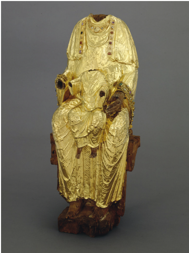
Abb. 1: Große Goldene Madonna, Dommuseum Hildesheim, zwischen 1010 und 1015. Weichholz, Goldblech, vergoldetes Silberblech, Filigran, Edelsteine, Gemmen, H: 56,6 cm \bar{A}\bar{A}

andererseits mit der Maria aus dem Widmungsbild im Kostbaren Evangeliar (Dommuseum Hildesheim, DS 18, fol. 18v; Abb. 4). 16 Doch auch über ihre formalen Ähnlichkeiten hinaus sind die drei Bildwerke eng miteinander verschränkt. Zunächst sind die drei Mariendarstellungen räumlich aufeinander bezogen. In der Forschung zeichnet sich ein Konsens ab, laut dem die Bernwardstür ursprünglich nicht am Dom, sondern wahrscheinlich in der der Stadt zugewandten Südflanke des Klosters St. Michael verbaut war. 17 Dort kam der vom Dom kommende Prozessionsweg an. 18 Es ist also nicht unwahrscheinlich, dass die Madonna bei solchen Prozessionen St. Michael durch die Bernwardstür betrat. 19 Das Kostbare Evangeliar wiederum wurde von Bernward wahrscheinlich für den 1015 geweihten Marienaltar in der Krypta von St. Michael gestiftet. 20