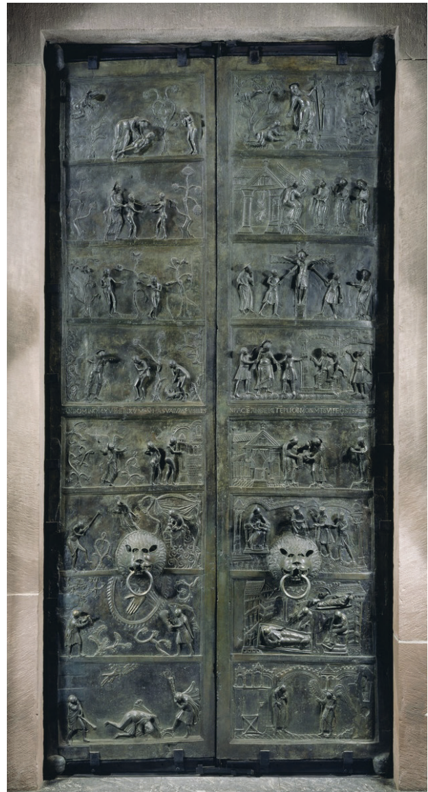
Abb. 2: Hildesheim, Dom, Bernwardstür 1015

die Skulptur auch in der botanischen Mariologie der bernwardinischen Stiftungen. Denn die Madonnen aus dem Evangeliar und von der Tür sitzen beide auf grünen Wiesen, die durch rundliche Erdschollen mit jeweils drei Halmen angegeben sind – eine Verheißung des wieder geöffneten Paradieses. 29