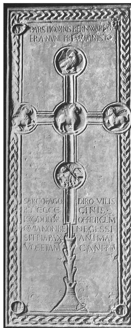
Abb. 6: Hildesheim, St. Michael, Deckplatte vom Grab Bernwards, um 1022

In seiner Grabplatte könnte man – neben der Betonung der lebensspendenden Kraft des Holzes – eine Art kunsttheoretischen Kommentar zu den Werken sehen, die Bernward schaffen ließ: Aus ungestaltetem Material – dem Holz – fertigt der Künstler Zeichen, die einen Dialog mit dem Göttlichen ermöglichen. 59 Dieselbe lebensspendende Macht des materiellen Kunstwerks spricht Bernward auch in der Stiftungsurkunde für St. Michael (1019) an. Er hoffte, dass ihm die von ihm gestifteten Objekte, seine „Baukunst an Verdiensten“, das Himmelreich verdienen würden. 60 Die Große Goldene Madonna von Hildesheim, aus lebensspendendem Holz geschnitzt, gehört selbstverständlich zu dieser Baukunst an Verdiensten, an der Bernward zu seinen Lebzeiten arbeitete. Erneut wird in einer solchen Deutung der heilsgeschichtliche Baum zu einem realen Baum aus der Region um Hildesheim – etwa zu jener Linde, Weide oder Pappel von gut 30 cm Stammdurchmesser, 61 aus der die Goldene Madonna geschnitzt wurde. Das berührt wiederum Fragen, die auch auf der Bernwardstür eine Rolle spielen, verdichtet hier im ackernden Adam: die Fähigkeit des Menschen, sich