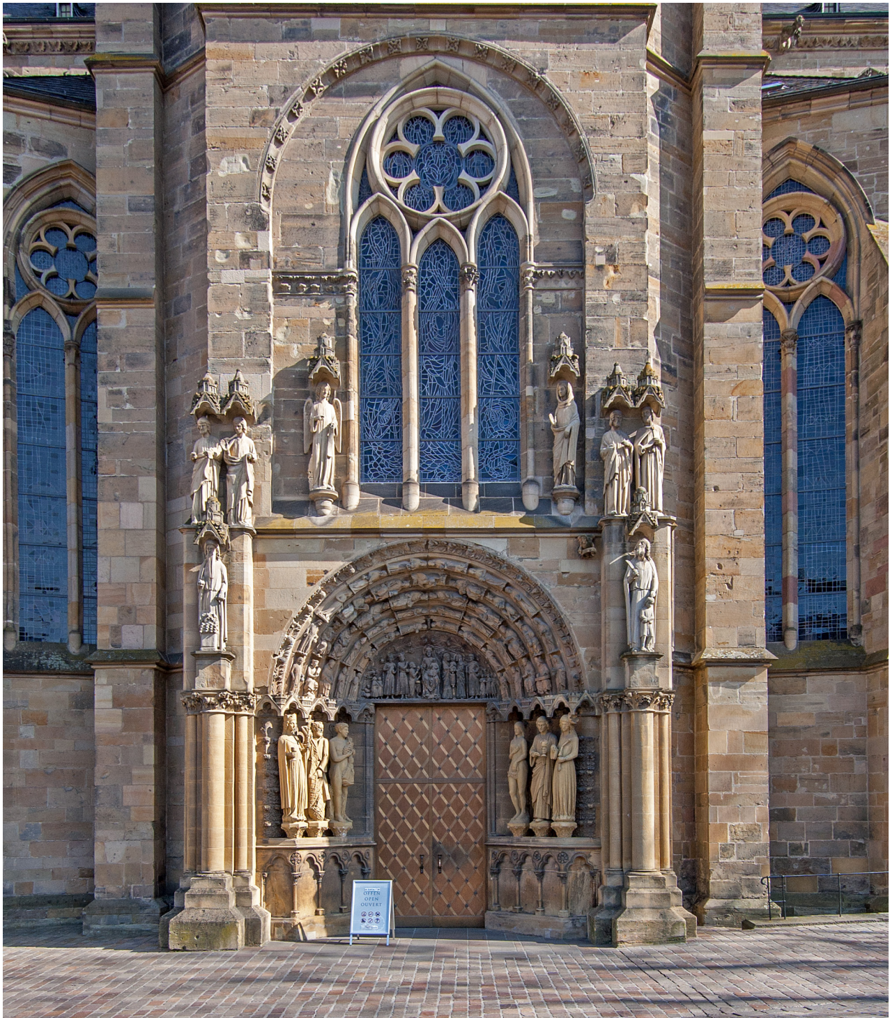
Abb. 10 Trier, Liebfrauenkirche, Westportal

Trichterportal mit en délit -Säulen an den Gewänden und filigranerem Blattdekor an den Kapitellen ist es reicher geschmückt als das Ostportal. Zudem weist das Nordportal im Tympanon figürlichen Schmuck auf und sämtliche Archivolten sind mit Laubwerkdekor ausgestattet. Den unzweifelhaft höchsten Rang nimmt das Westportal ein. Nicht nur Portaltyp und