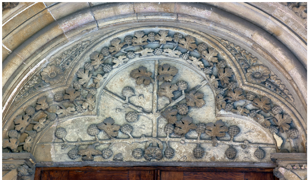
Abb. 15 Trier, Liebfrauenkirche, Ostportal, Tympanon

gehalten wurde. Hier wurden offenbar diejenigen Angelegenheiten verhandelt, bei denen ein Domkapitular als Bevollmächtigter des Erzbischofs – meist der Domscholaster – Streit zwischen den Stiften oder Klöstern der Stadt Trier und Laien – hauptsächlich in Besitzangelegenheiten – schlichtete. Auch der sog. Krummelstuhl, der noch heute in der Pauluskapelle (Abb. 14) aufgestellt ist, die sich im Westflügel des Kreuzgangs und damit in unmittelbarer Nähe zum Liebfrauen-Ostportal befindet, muss als Hinweis auf die Tradition der Rechtsprechung an diesem Ort verstanden werden. Nach Ronig reicht er typologisch gesehen, nicht jedoch in seinem materiellen Bestand, in gotische oder sogar romanische Zeit zurück. 37 Spä-