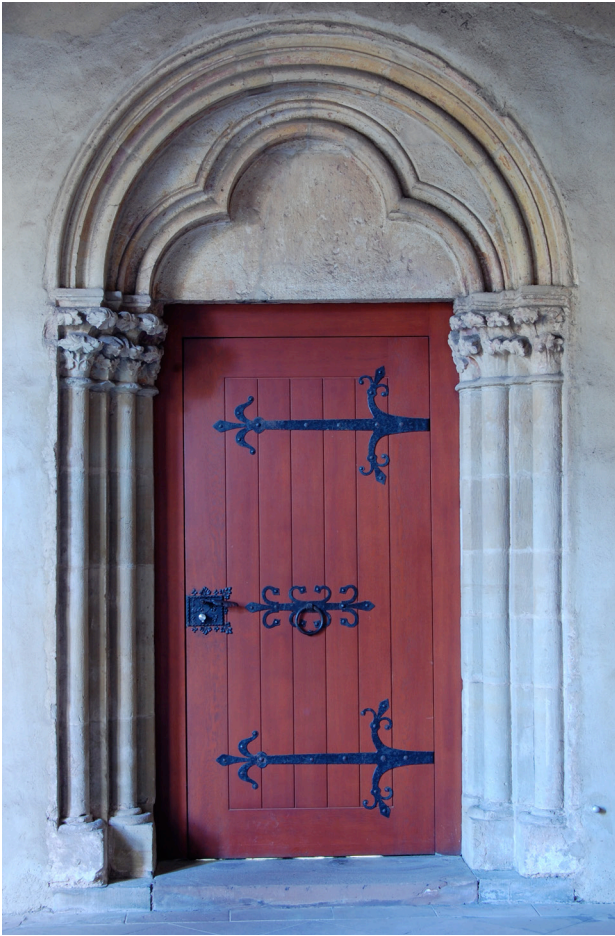
Abb. 8 Trier, Dom St. Peter, Kreuzgang, Südflügel, Portal

krieg wieder entdeckt und freigelegt und von seinem ursprünglichen, weiter östlich gelegenen Standort in den westlichen Teil des Kreuzgang-Südflügels versetzt, wo es heute als Verbindung zum Bischofshof dient. 16 Ursprünglich diente es wohl als Zugang zum Refektorium im Südtrakt des Domkreuzgangs. Die entscheidenden Merkmale des beschriebenen Portaltyps werden in reduzierter Form aufgegriffen, in den Detailformen ist jedoch eine Bereicherung zu beobachten.