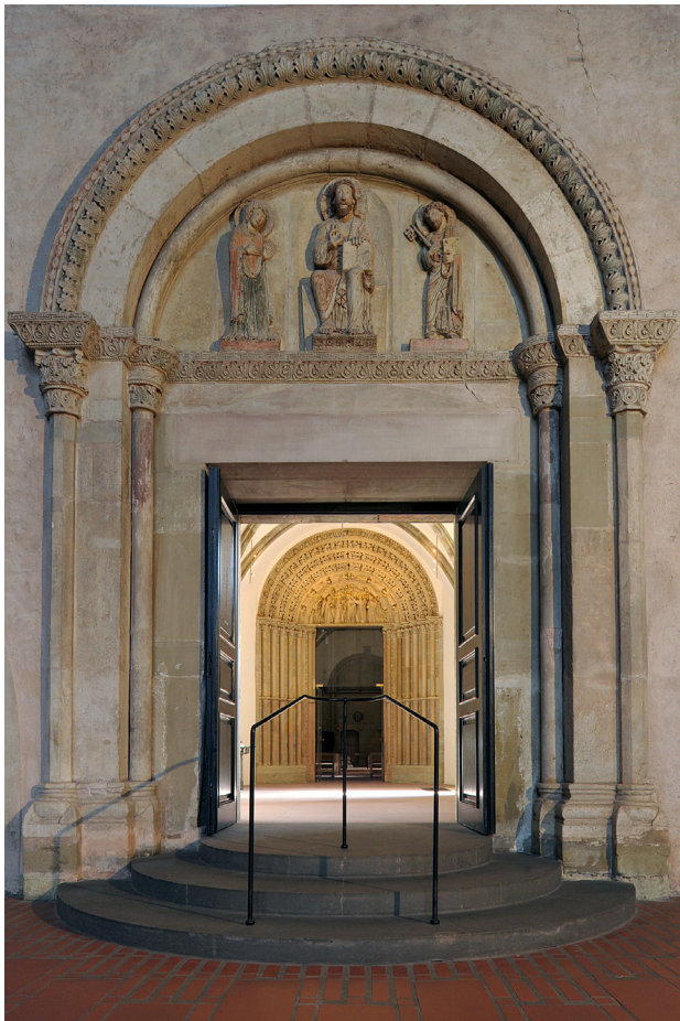
Abb. 12 Trier, Dom St. Peter, Blick durch das Petersportal und das Paradies auf das Nordportal der Liebfrauenkirche