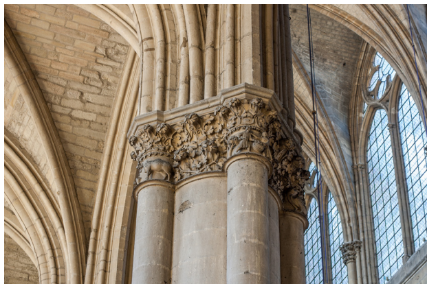
Abb. 5 Reims, Kathedrale Notre-Dame, Langhauspfeiler auf der Südseite (w4s), Kapitell