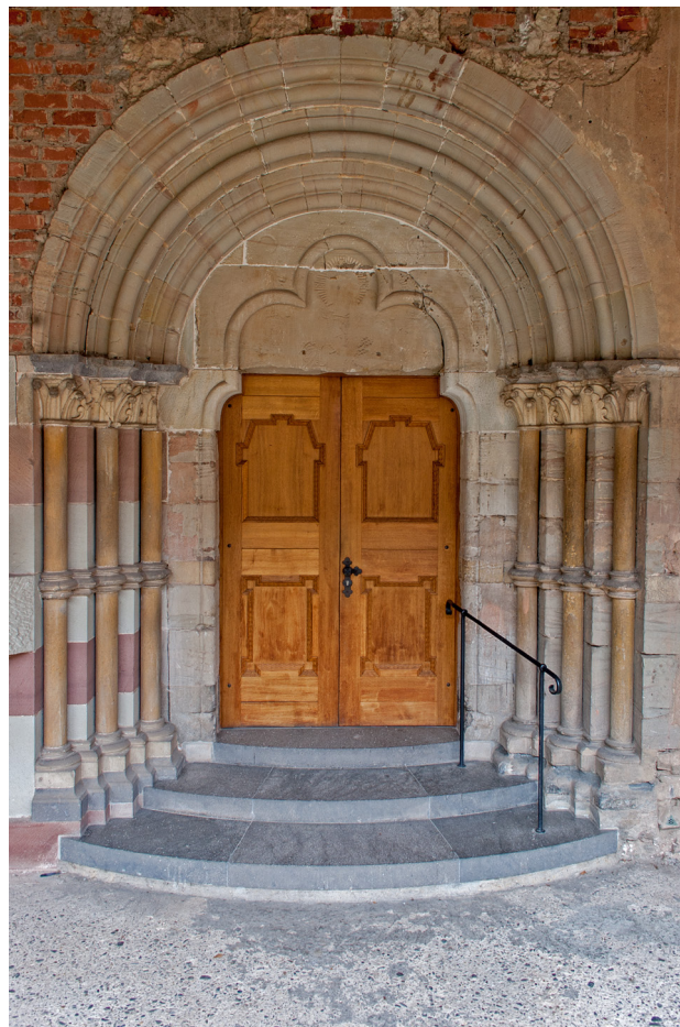
Abb. 7 Trier, Benediktinerabtei St. Matthias und St. Eucharius, Kreuzgang, Nordflügel, Portal zum Südquerhaus der Kirche

Chartres haben sich vergleichbare Ornamentmotive an einem Profanbau der Zeit um 1200 erhalten. 8