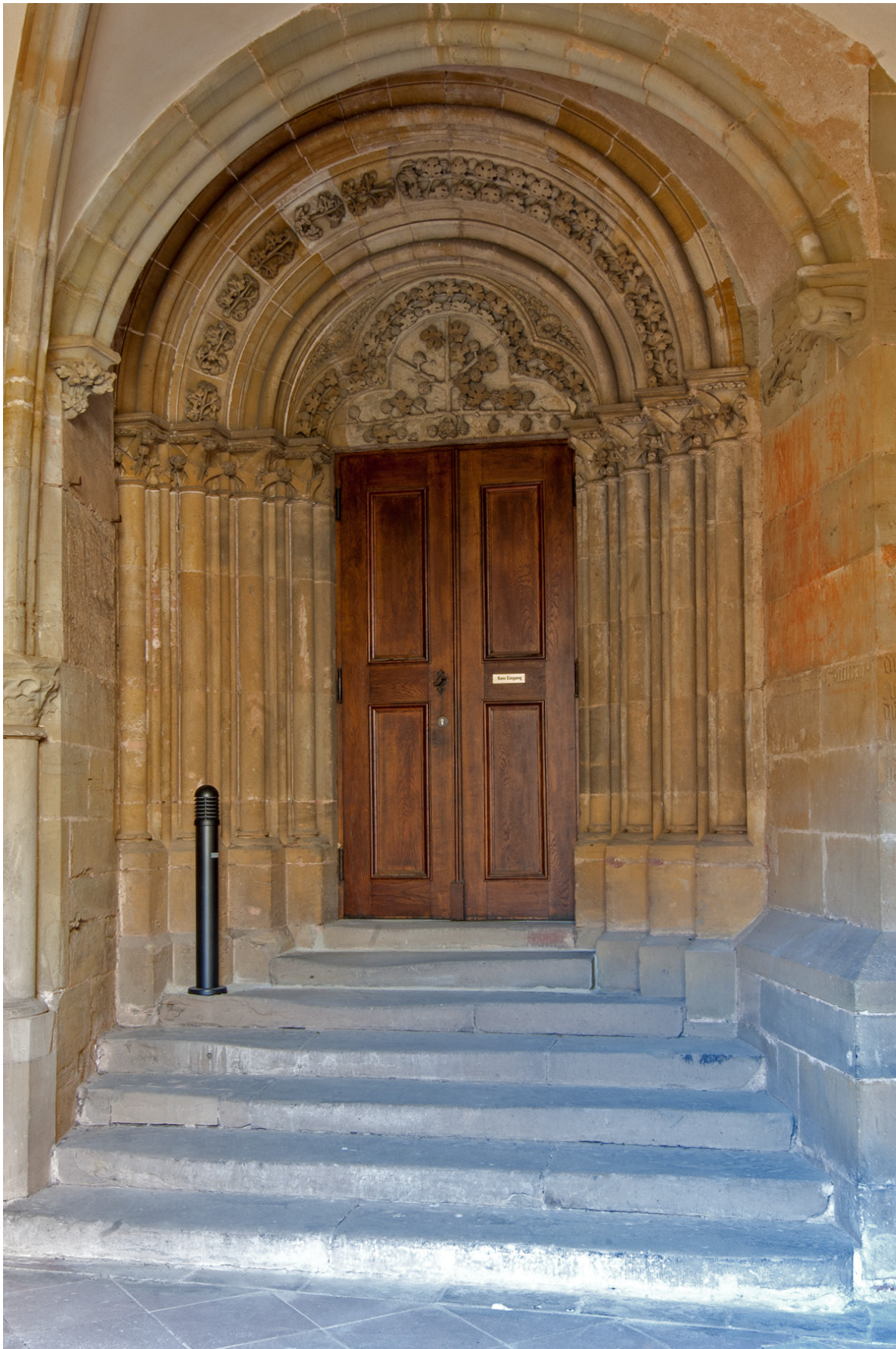
Abb. 1 Trier, Liebfrauenkirche, Ostportal, Gesamtansicht