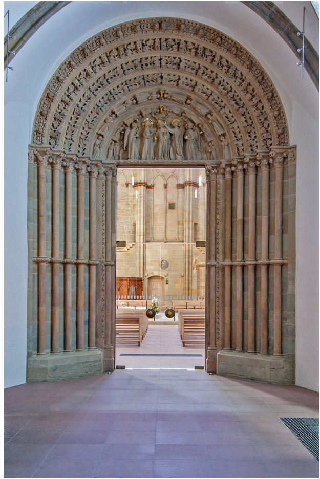
Abb. 9 Trier, Liebfrauenkirche, Nordportal

Das Ostportal der Trierer Liebfrauenkirche erweist sich aufgrund der vorgenommenen Einordnung folglich keineswegs als Solitär oder Sonderfall. Der Portalbau kann auf einen verbreiteten Typus zurückgeführt werden. Die konstituierenden Merkmale dieses Portaltyps sind in Trier schon am Kreuzgangportal von St. Matthias aufgegriffen, das wenige Jahre vor dem Liebfrauen-Ostportal entstanden ist. Doch die ornamentale Ausgestaltung des Tympanons in Liebfrauen legt eine Kenntnis weiterer Portale nahe, so dass von einer Verbindung mehrerer Vorbilder ausgegangen werden kann. Wichtig ist jedoch festzuhalten, dass