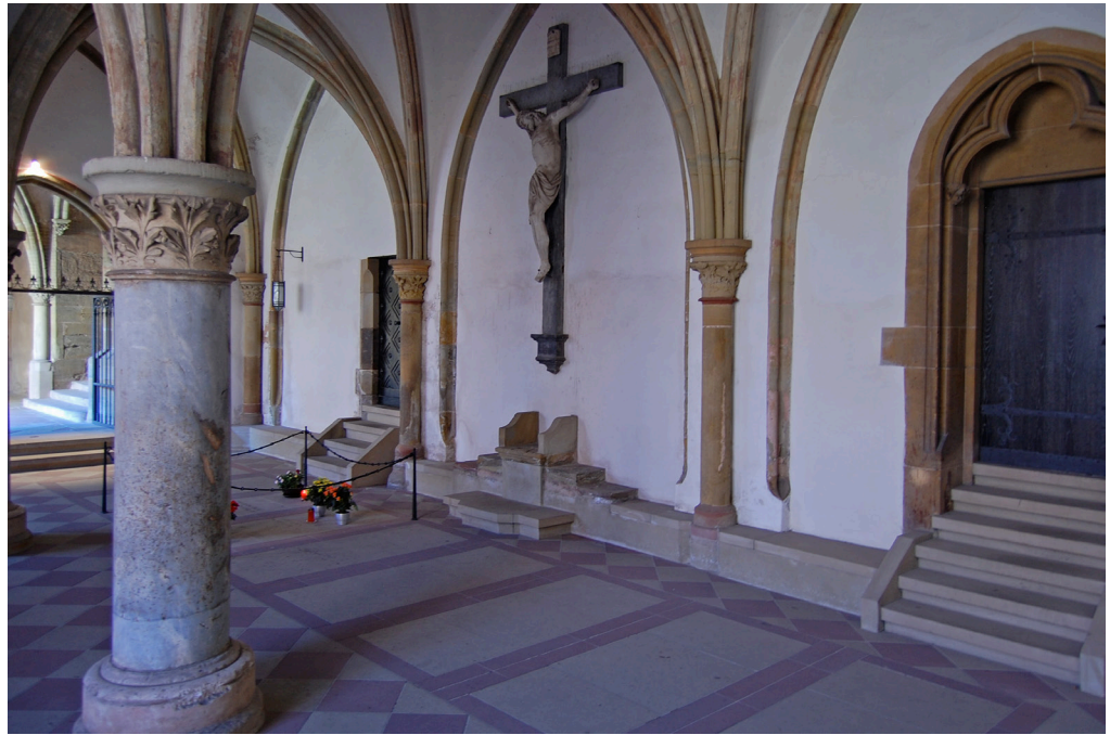
Abb. 14 Trier, Dom St. Peter, Kreuzgang, Pauluskapelle im Westflügel mit „Krummelstuhl“, Ansicht nach SW (im Hintergrund: Stufen zum Liebfrauen-Ostportal)