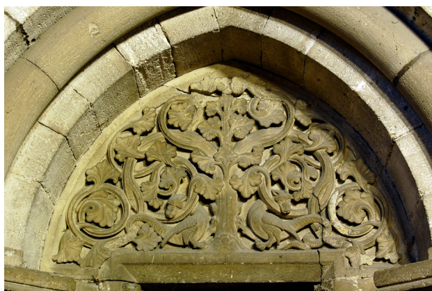
Abb. 6 Halberstadt, Dom St. Stephanus und St. Sixtus, Portal in der Nordwand des westlichen Zwischenturmjochs, Tympanon