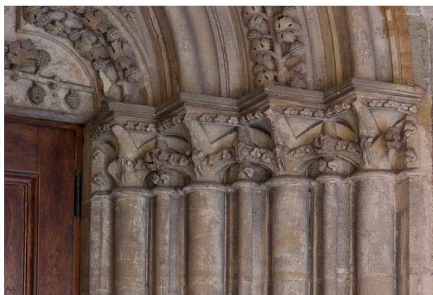
Abb. 3 Trier, Liebfrauenkirche, Ostportal, rechte Kapitellzone