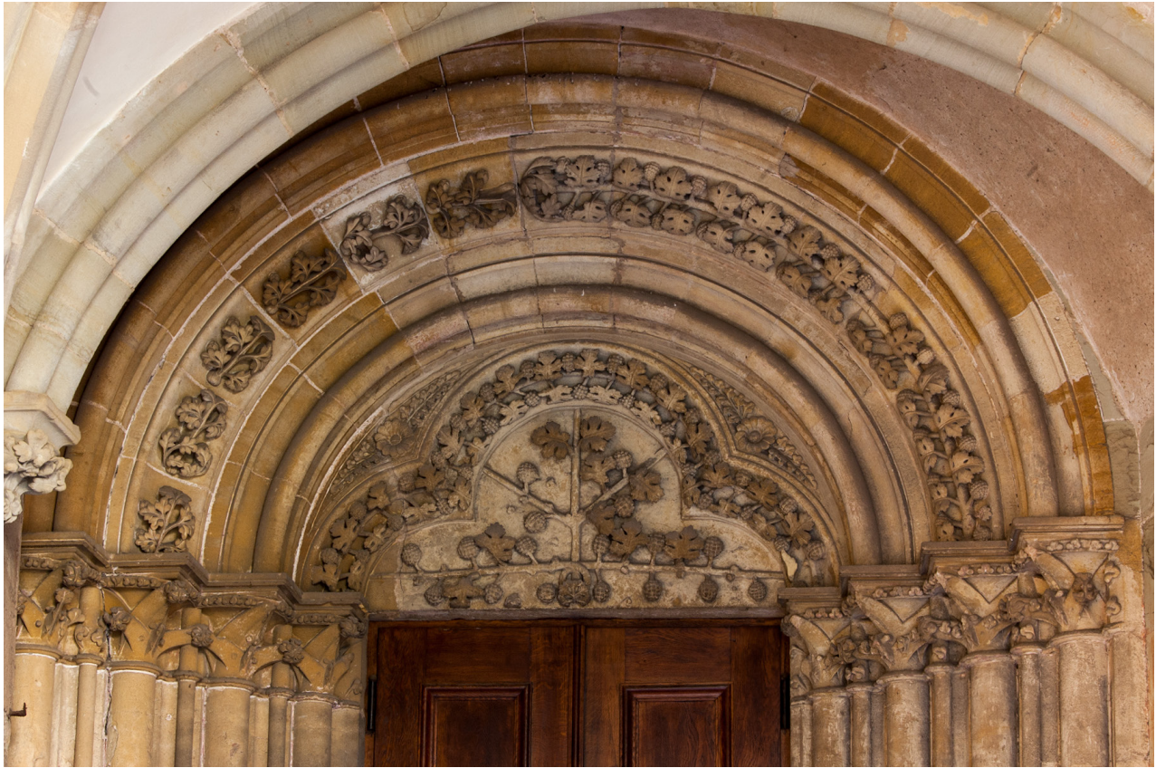
Abb. 4 Trier, Liebfrauenkirche, Ostportal, Tympanon und Archivolten

entspringen die drei Äste des Weinstocks. Je einer verläuft waagrecht in die beiden seitlichen Ecken. Der dritte wächst senkrecht nach oben, wobei er sich etwa im Mittelpunkt des zentralen Passes in zwei weitere Äste teilt, die in einem 45°-Winkel bis zum Rand des Passes reichen. In unsystematischer Verteilung, wobei auch hier die rechte (nördliche) Seite stärker gewichtet wird, trägt der Stock Weinblätter und -reben. Die Ornamentik des gesamten Portals ist sehr fein ausdifferenziert. Vor allem das à jour gearbeitete Blattwerk in Tympanon, Rahmung und Archivolte ist von hoher bildhauerischer Qualität.