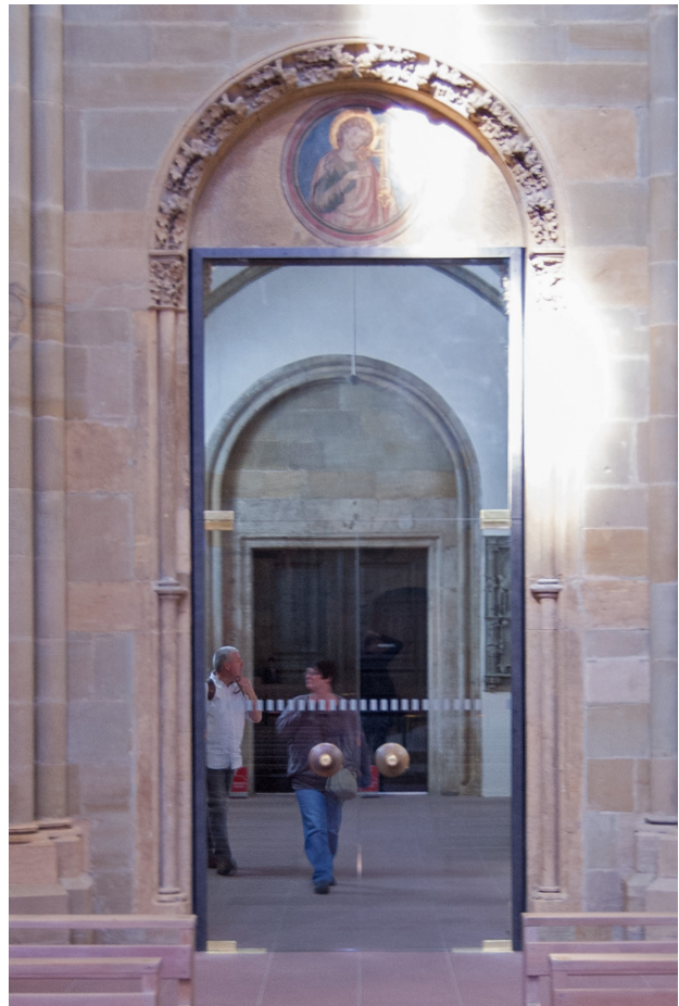
Abb. 13 Trier, Liebfrauenkirche, Blick durch das Nordportal und das Paradies auf das Petersportal des Domes

der umgekehrte Weg (vgl. Abb. 12 und 13). Denn nur in dieser Richtung durchschritten die Prozessionen zwei figürlich ausgestaltete Tympana: der thronende Christus zwischen Petrus und Maria im Petersportal des Doms und die Marienkrönung im Nordportal der Liebfrauenkirche. 30