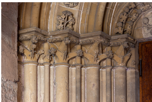
Abb. 2 Trier, Liebfrauenkirche, Ostportal, linke Kapitellzone

Die rundgeführten Bogenläufe sind ebenfalls reich profiliert, aber nur der zweite von außen ist auch skulptural ausgeschmückt (Abb. 4). Auf der linken Seite des dekorierten Bogenlaufs findet sich pro Keilstein ein separat behandelter Akanthuszweig, während sich auf der rechten Seite ein Weinstock zu einer durchgehenden Ranke zusammenschließt. Die rechte Seite ist also – ähnlich wie in den Kapitellbändern – weitaus reicher ausgeschmückt. In das rundbogige Tympanon ist ein Dreipassbogen eingeschrieben, in dessen Rahmung eine Weinranke gelegt ist. Die Zwickelfelder sind durch blütenartige Medaillons in der Mitte ausgefüllt, von denen je zwei spitz zulaufende Blütenranken in die Zwickelcken auslaufen. 4 Im Inneren des Dreipasses findet sich ein symmetrisch angelegter, kreuzförmiger Weinstock. Aus einem nach oben gebogenen Laubblatt am Fuß des Tympanons