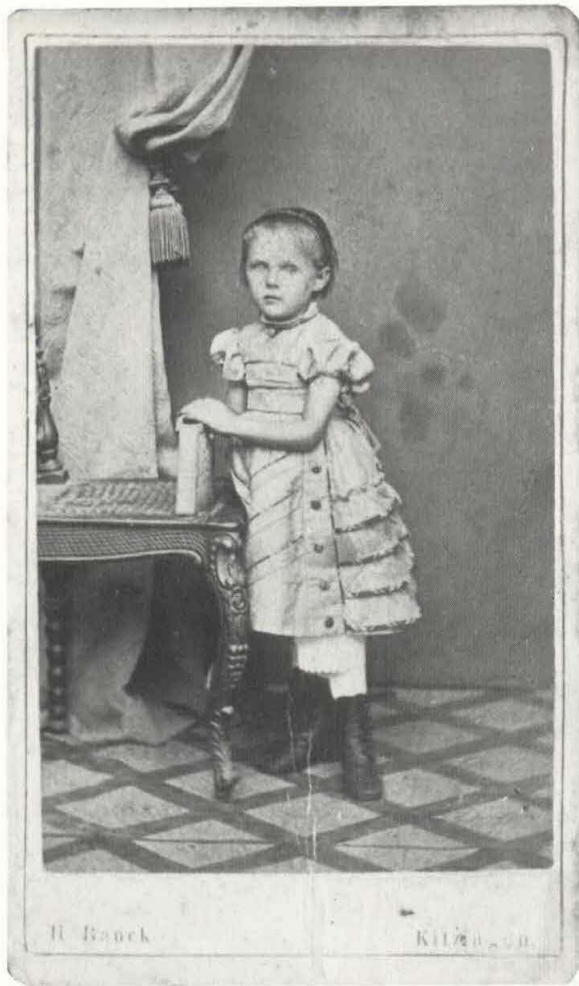
Abb. 86 Um ein Wackeln zu vermeiden, stützt sich das Kind mit Hilfe eines Buches auf einen Stuhl. Das aufwendig gearbeitete Rüschenkleid kopiert die von 1869–1875 aktuelle Turnüren-Mode der Damen. Visit, um 1875.