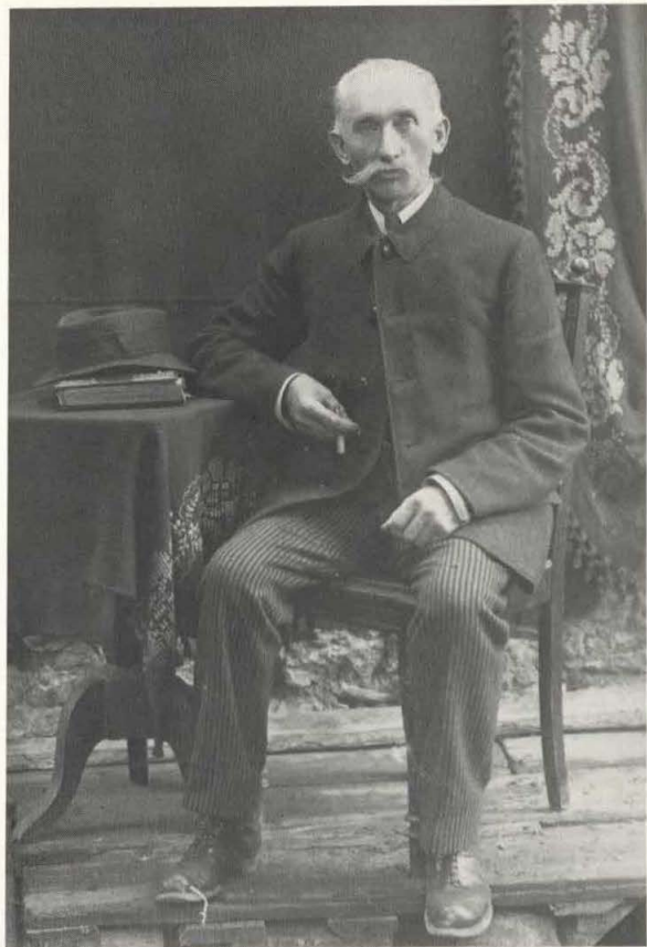
Abb. 93 Einfache Bretterbühne als »Atelierboden«. damals Mainstockheim, nach 1920, Postkarten-Format.