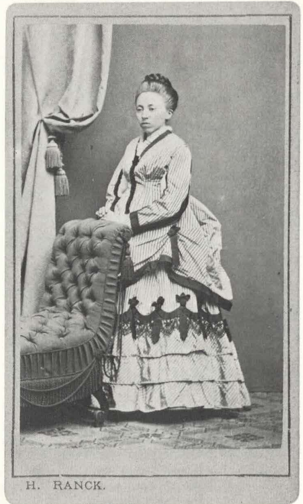
Abb. 87 Charles Frederick Worth schaffte 1867 die Krinoline ab und leitete zur Turnüre über, wobei der Kleiderrock durch ein halbkreisförmiges, langes Gestell aus Stahl- oder Fischbeinstäbchen hochgebauscht wurde. F.: H. Ran(c)k, Kitzingen, Visit, um 1875.

Ähnliches gilt für den aus Naila stammenden Heinrich Ran(c)k (1831–1887), der den Unterhalt