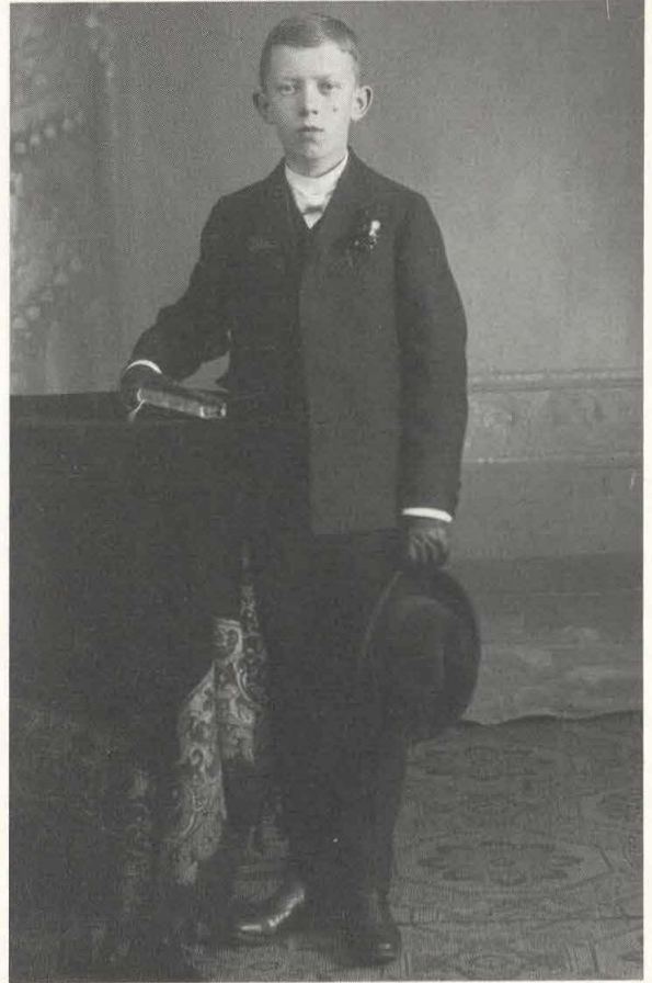
Abb. 90/91 Mädchen im Kommunionkleid, angezogen wie eine kleine Braut. F.: H. Ran(c)k, Kitzingen, Visit, 2. H. 70er Jahre. – Der Erstkommunikant trägt Hut und Lederhandschuhe, alles Attribute des Erwachsenenstatus. F.: H. Ran(c)k, Kitzingen, Visit, nach 1882.

Geschäft so gut, daß er zum 1. Mai 1870 – so jedenfalls steht es in den Einwohnermeldelisten – seine Familie nachkommen ließ. Spätestens jetzt begann die eigentliche Ge-