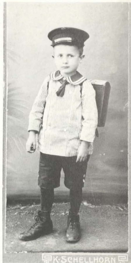
Abb. 88/89 Bereits in den 80er Jahren ließen begüterte Eltern Schulanfänger fotografieren, seit den 90er Jahren auch mit Schultüte. Allgemein in Mode kamen Erstkläßler-Fotos erst nach dem Ersten Weltkrieg.