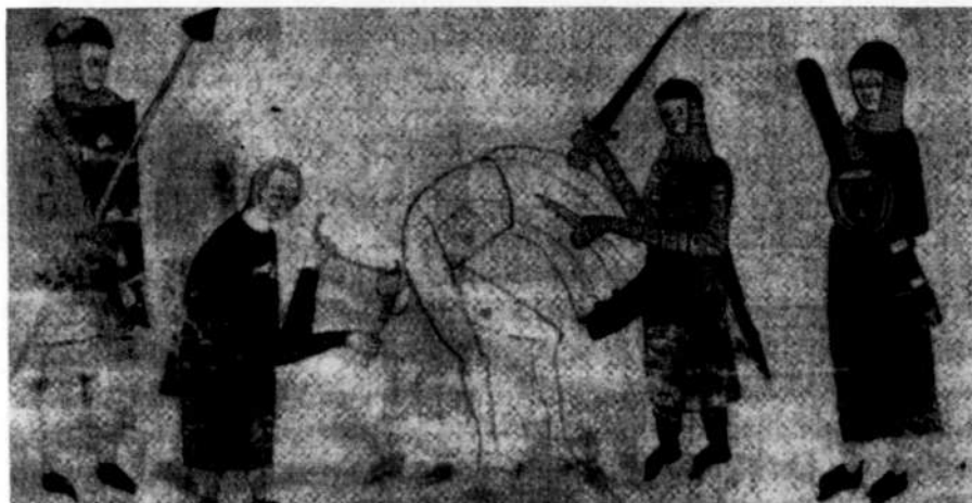
Abb. 2: Entmannung, Toulouser Rechtsbuch (1296), BN Paris, Ms. lat. 9187, S. 64

len wesentlich weiter gehende Ausdrücke wie „das männliche Glied nehmen“ ( ementulare ) und „die unteren Teile abschneiden“ ( abscidere partes inferiores ) gebrauchten, so ist zu vermuten, dass diese als drastische Synonyme für „die Hoden abschneiden“ ( abscidere testiculos ) zu verstehen sind. 48 Wollte man diese Wendungen wörtlich nehmen, wäre die Entmannung aufgrund der Gefahr des Verblutens wahrscheinlich in der Mehrzahl der Fälle keine Körperstrafe, sondern eher eine verkappte Form der Todesstrafe gewesen. Dies aber war ganz offensichtlich nicht intendiert. Der Bestrafte sollte weiterleben und für Jahre oder vielleicht sogar Jahrzehnte als lebendes Zeichen für die Strafgewalt des Herrschers dienen.