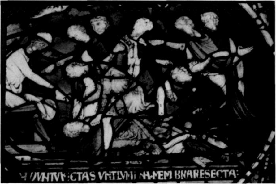
Abb. 3: Blendung und Entmannung Ailwards von Westoning, Glasfenster der Kathedrale von Canterbury, um 1215/1220

ten. Sie konnten daher ohne weiteres gedanklich zwischen dem lustvollen, potenziell sündhaften Gebrauch der Zeugungsorgane einerseits und ihrer von Gott gewollten naturgemäßen Bestimmung andererseits differenzieren. 49 Zwar konnte der Zeugungsakt selbst nicht ohne geschlechtliche Lust geschehen, außerhalb des Geschlechtsaktes aber waren beide Aspekte sehr wohl voneinander zu trennen. Dass der Gebrauch der Zeugungsorgane mit geschlechtlicher Lust einherging, wurde nicht als Bestandteil der Schöpfungsordnung begriffen, sondern als Folge der Erbsünde. Vor dem Sündenfall, so die von Augustinus an das Mittelalter weitergegebene Vorstellung, seien die Geschlechtsorgane wie alle anderen Körperteile der Kontrolle durch Willen und Vernunft unterworfen gewesen. 50 Die Unversehrtheit der genitalen Ausstattung eines Mannes konnte daher unbelastet von sexuellen Konnotationen zum Attribut voller Männlichkeit werden und so ihren Platz in dem sozialen Kode finden, der die Ehre jedes Mannes, insbesondere aber die Ehre des Adligen, definierte. 51 Damit aber wur-