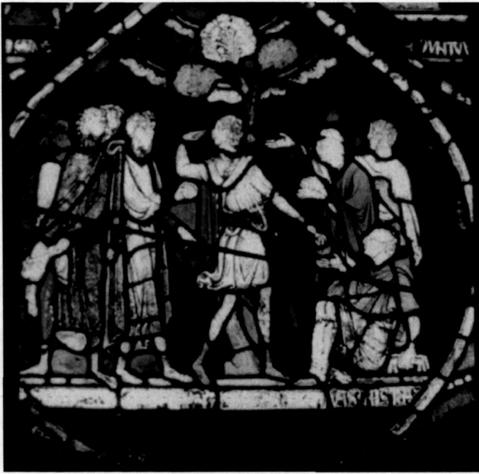
Abb. 4: Heilung Ailwards von Westoning auf Fürsprache des Hl. Thomas Becket

den die Zeugungsorgane des Mannes zu einem sozial akzeptablen Angriffspunkt königlicher Strafgewalt gegenüber all denjenigen, die sich dem Herrschaftsanspruch des Königtums widersetzen.