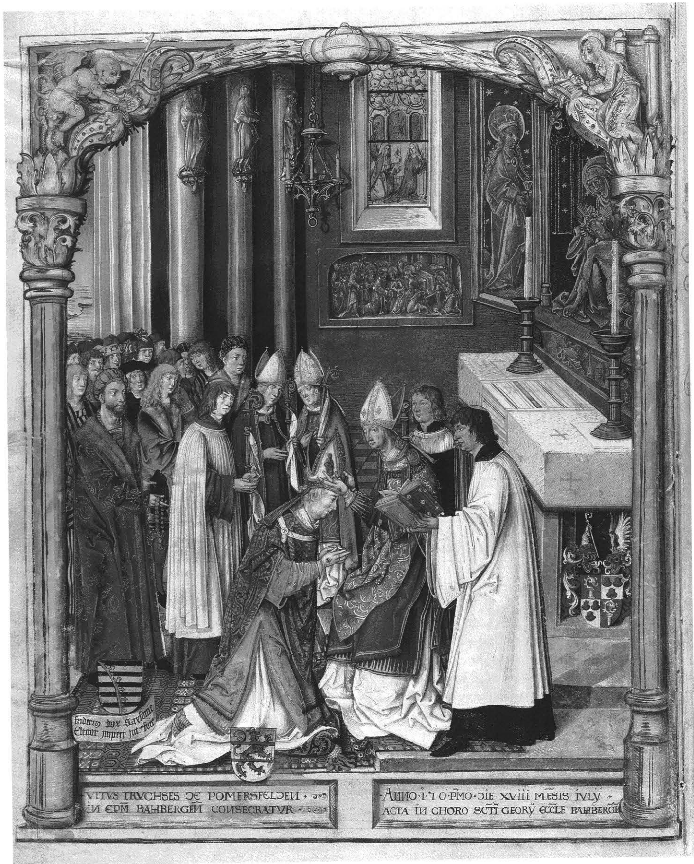
Weibe des Bamberger Bischofs Veit Truchseß von Pommersfelden durch den Eichstätter Bischof Gabriel von Eyb im Jahr 1501, Pontificale Gundecarianum, Diözesanarchiv Eichstätt