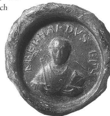
Siegel des ersten Bischofs Eberhard

In modernen Wahlsystemen wird dies durch die von allen anerkannte Fiktion gewährleistet, dass die Entscheidung der Mehrheit eines Gremiums als Entscheidung seiner Gesamtheit zu gelten hat und auch diejenigen bindet, die mit „Nein“ gestimmt haben. Auch diejenigen Abgeordneten, die bei der Wahl des Bundeskanzlers oder des Ministerpräsidenten für ei-