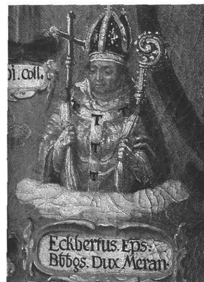
Bischof Ekbert von Andechs, Ausschnitt aus dem Stammbaum des hl. Otto, Kloster Michelsberg, 1628

ihm 1268 zusätzlich Brotbänke und Getreidemühlen in Bamberg. Für die Jahre 1328, 1398, 1421 und 1431 sind Wahlkapitulationen erhalten. Insbesondere das ausgehende 14. und das beginnende 15. Jahrhundert boten dem Domkapitel weit reichende Handlungsmöglichkeiten, als das große Schisma und die großen Konzilien die Handlungsmöglichkeiten des Papsttums einschränkten, während in den Jahrzehnten zuvor vielfach auswärtige Bischöfe nach Bamberg transferiert worden waren.