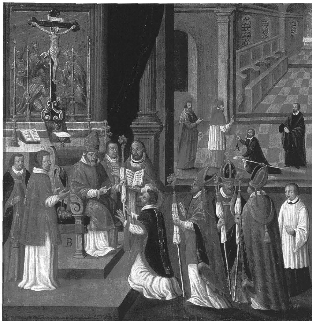
Otto empfängt von Papst Paschal II. das Pallium, Otto-Zyklus, Kloster Michelsberg, 17. Jh.

spruch, die Wahl eines Domkapitels zu kassieren, wenn kirchenrechtliche Hindernisse vorlagen, die den Gewählten vom Bischofsamt ausschlossen, und zwar auch dann, wenn dieses Weihehindernis durch päpstlichen Dispens aufgehoben werden konnte. Sie erhoben ferner den Anspruch, Bistümer wie andere Pfründen durch Provision (d. h. durch eigene Entscheidung ohne erneute Wahl) zu besetzen, wenn die Erledigung des Bistums durch Rücktritt (Resignation) des Bischofs oder seinen Tod an der Kurie eingetreten war. Dabei war es keineswegs ausgeschlossen, dass sie einen Gewählten durch Verweigerung der confirmatio zur Resignation zwangen, ihm dann Dispens gewährten und es ihm erlaubten, das Bistum aus der Hand des Papstes zu empfangen. Dies hatte für den Papst den Vorteil, dass er die entsprechenden Abgaben einziehen konnte; für das Domkapitel den Nachteil, dass es an Einfluss auf den Bischof verlor. Dabei ist in der Regel davon auszugehen, dass die Kurie in erster Linie fiskalische Interessen verfolgte, im Übrigen aber in den Angelegenheiten einzelner Bistümer nördlich der Alpen nicht aus eigener Initiative tätig wurde, sondern auf Antrag eines Kandidaten, der um Bestätigung seiner Wahl oder um die Kassierung der Wahl seines Gegners nachsuchte.