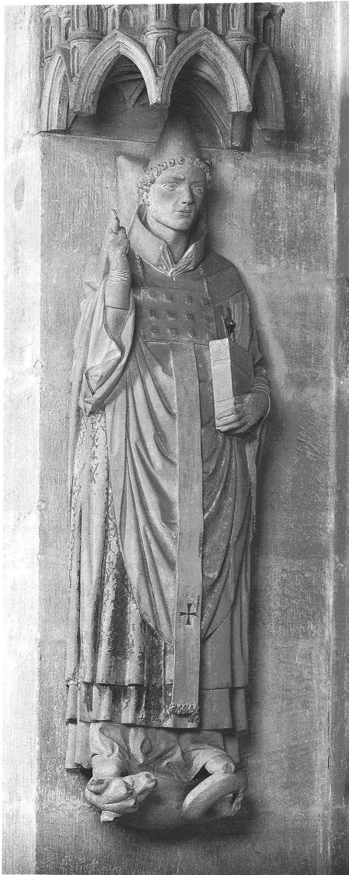
Bamberger Dom, Papst Clemens II.

Vermutung ergibt sich, wenn der Kandidat unmittelbar vor seiner Erhebung zum Bischof als Kapellan zur Hofkapelle gehörte, jener Gruppe von Geistlichen, die den Gottesdienst für den König und sein Gefolge sicherstellten, den Herrscher berieten und auch das Personal für die Kanzlei stellten, die die im Namen des Königs ergehenden Briefe und Urkunden ausfertigte.