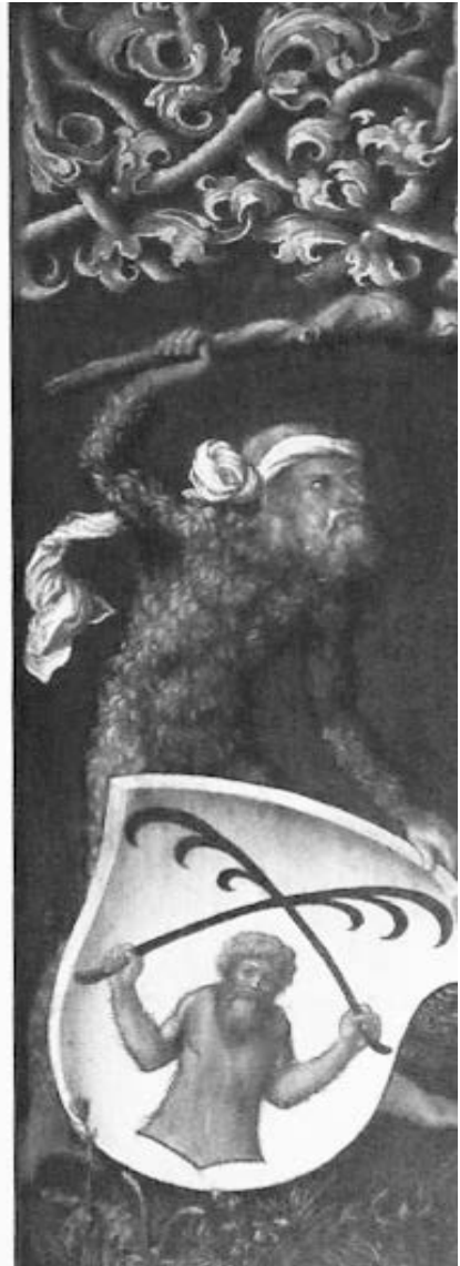
Albrecht Dürer?, Wappenhaltende Wildleute von den Flügeln des Porträts des Oswolt Krel (dat. 1499), München, Alte Pinakothek.