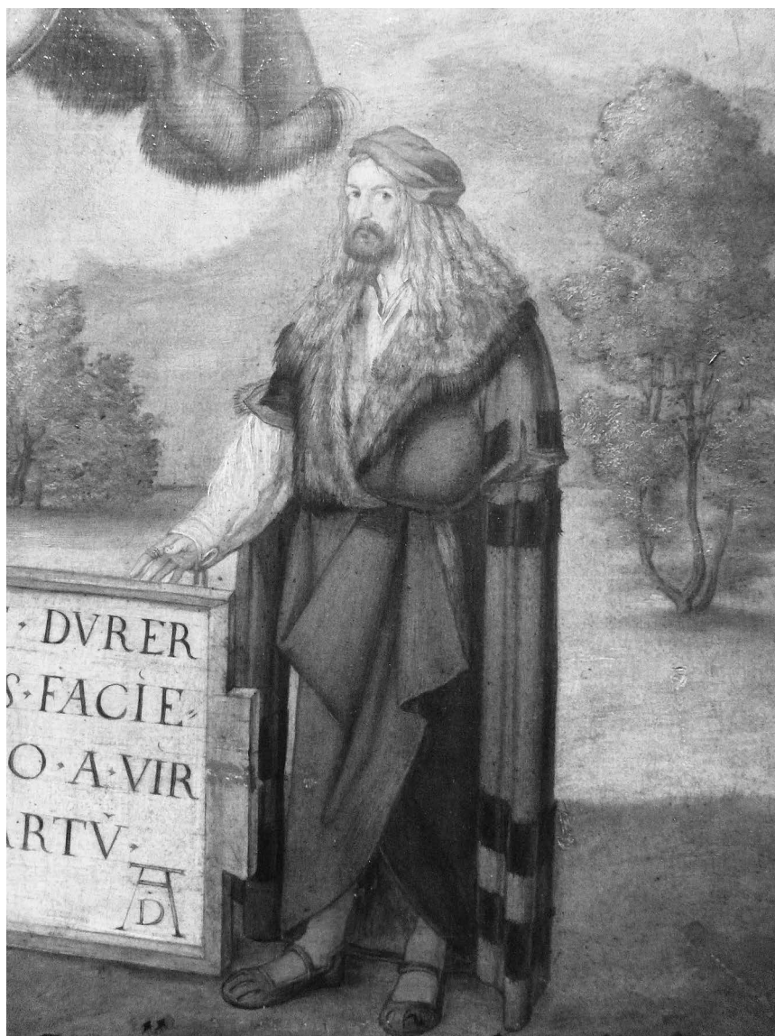
Albrecht Dürer, Selbstbildnis aus dem „Allerheiligenaltar“ (dat. 1511), Kopie 19. Jh., Nürnberg, Germanisches Nationalmuseum (Det.).