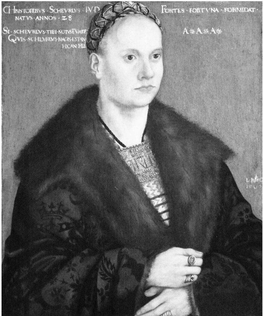
Lukas Cranach, Porträt des Christoph Scheurl im Alter von 28 Jahren (dat. 1509), Nürnberg, Germanisches Nationalmuseum.