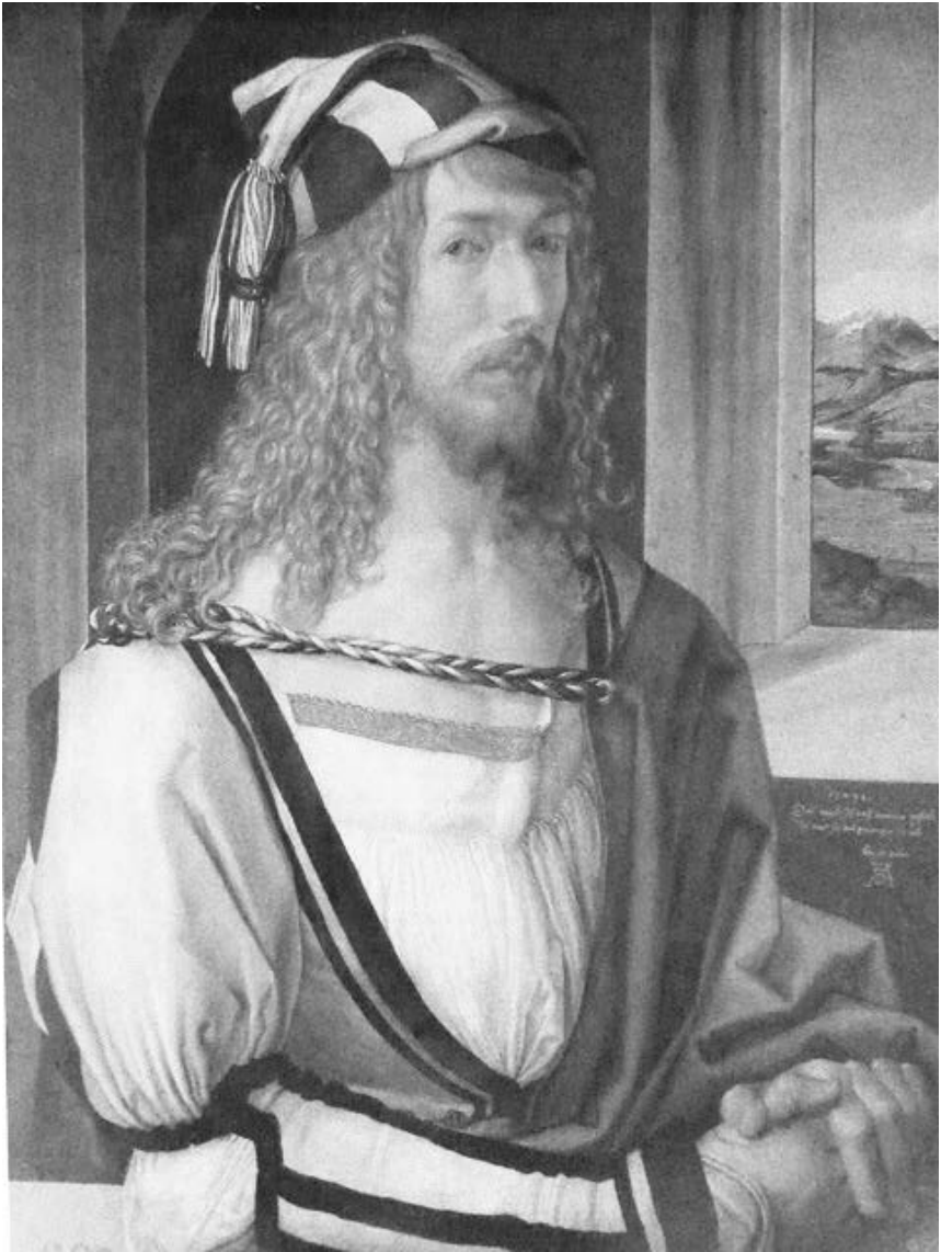
Albrecht Dürer, Selbstbildnis am Fenster (dat. 1498), Madrid, Prado.