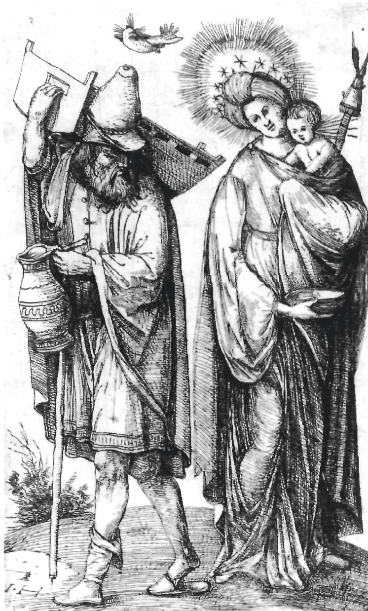
Abb. 1 Hieronymus Hopfer, Flucht nach Ägypten , 1. Drittel 16. Jahrhundert, nach Iacopo da Barbari (gest. 1516 in Mecheln). Die Jüdin Maria wird mit einem christlichen Strahlenkranz und mit dem Kleidungsstück einer Sintizza (flacher Turban) dargestellt, was keine negativen Assoziationen auslöste.

Unter den so gegebenen Bedingungen bildete sich in der Frühen Neuzeit im Abschreibverfahren eine affirmative obrigkeitlich ausgerichtete „Tradition einer fortwährenden Reproduktion desselben Quellenmaterials und derselben Sätze“ 6 aus. Sich auf die Exegese dieser Quellen zu beschränken, ergibt eine Geschichte der