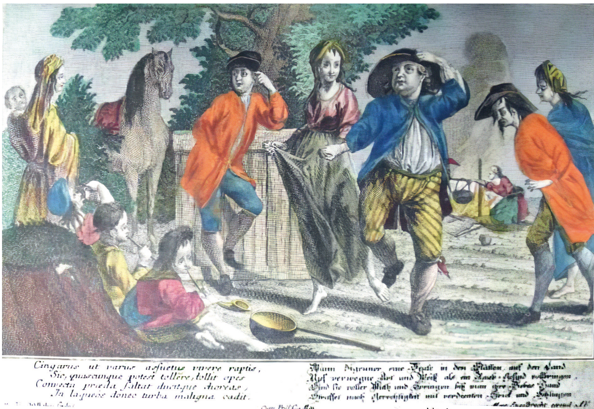
Abb. 2 Martin Engelbrecht (1684–1756), aus dem Zyklus Der Tanz , ca. 1725; Zeitabschnitt der aggressivsten Verfolgung; die Bildunterschrift droht den sorglos feiernden „Ziegeunern“ „Strick und Schlingen“ an.

sondern vielmehr solchen gefährlichen bösen leuthen unterschleiff geben lassen“ (1717). 33 Ein Amtmann beschwerte sich, noch vor dem Beginn der Verfolgung sei klar gewesen, „daß dieser Aufzug, ohnerachtet solcher sehr geheim gehalten, albereits verrathen, folglich von diesem herrnlosen und diebischen Gesindel die Retirade [...] genommen“ (1725). 34 Eine Regierung ging davon aus, dass jede „concer- tirte allgemeine Landstreiffung“ erfolglos bleiben werde, da „denen Ziegeunern das Vorhaben der vorzunehmenden Perquisition gemeiniglich bekannt gemacht“ werde (1741). 35 Ein mit der Organisation von Streifungen Beauftragter erklärte, dergleichen würde so oder so scheitern, weil „die Schelmen und Diebsrotten [von „Ziegeunern“] doch zum wenigsten einen Bauern in jedem Dorff haben, der mit ihnen unter der Decke lieget und ihnen die nöthigen Nachrichten mittheilt“ (1748). 36