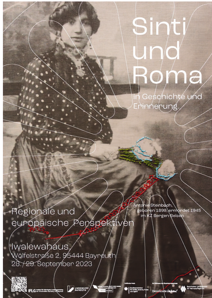
Abb. 1 Tagungsplakat, gestaltet v. Hannah Feldmeier

Gerade weil mit dem Völkermord die zentrale Zäsur in der Geschichte der Sinti und Roma auf der Ebene des Lehrplans verankert ist und zahlreiche Unterstützungsangebote für Lehrkräfte gesammelt zur Verfügung stehen, eröffnen sich aus fachdidaktischer Sicht weitere Perspektiven auf die Geschichte der Sinti und Roma. Die folgenden fünf Anregungen knüpfen jeweils an das Plakat an, mit dem die Tagung „Sinti und Roma in Geschichte und Erinnerung“ beworben wurde.