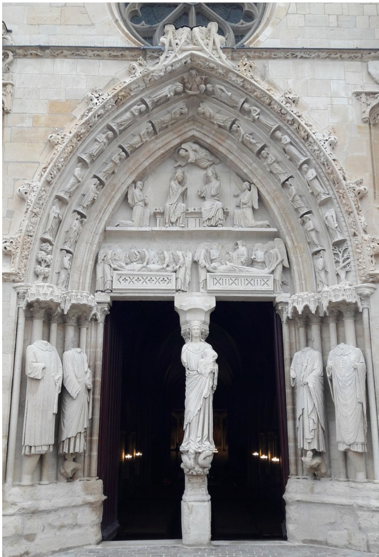
Fig. 1 Longpont, le portail de l'église après restauration en 2022