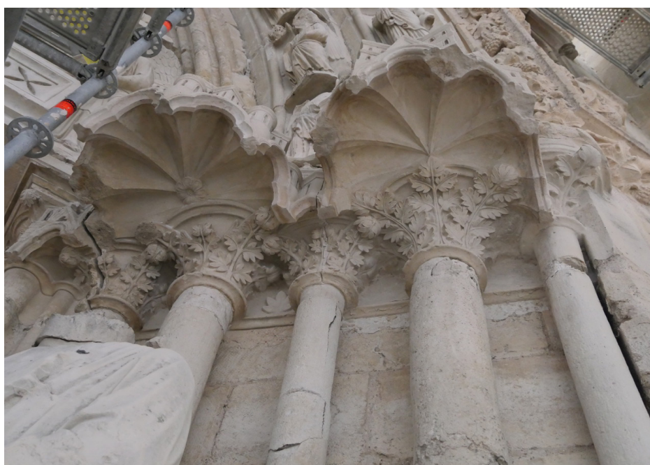
Fig. 4 Longpont, portail, dais et chapiteaux de l'ébrasement