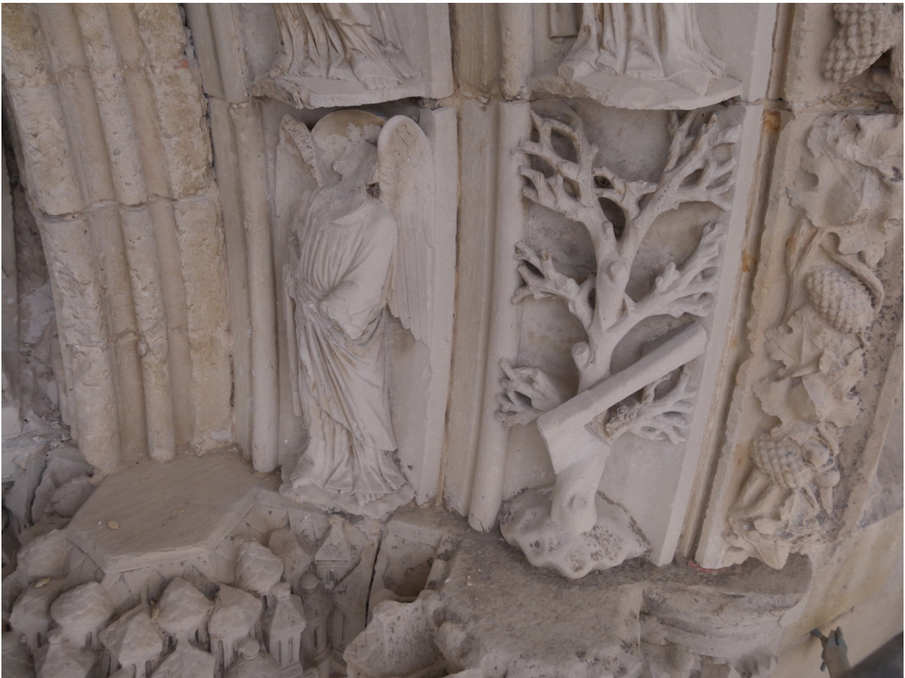
Fig. 7 Longpont, portail, jonction des dais et des voussures

pas reçus pas une base à leur taille. Normalement, le sommet du dais devrait jouer le rôle de base pour les statues du départ des voussures. Enfin la troisième voussure à partir de l'intérieur retombe parfaitement sur le deuxième dais d'ébrasement. Le tailloir de ce dais couvre aussi le chapiteau de la colonnette en délit à l'extrémité extérieure du portail. Cela permet aussi de recevoir parfaitement l'archivolte. Il s'agit d'un dais du XIII e siècle taillé pour être en position extérieure et recevoir une voussure et une archivoltte. Probablement, l'archivolte du XV e siècle que l'on observe actuellement a simplement pris la place de celle qui était présente à l'origine. Il existe un décalage dans le sens de la profondeur entre les voussures. À l'intrados des deux voussures figurées, une surface portant des traces d'outils – donc destinée à être cachée – est restée visible lors du remontage. Au XV e siècle, une partie de ces traces d'outils ont été estompées par un léger polissage. Les traces d'outils ne sont pas effacées complètement, ce qui signifie probablement que le polissage a été fait sur place, une fois le remontage accompli. Nous proposons