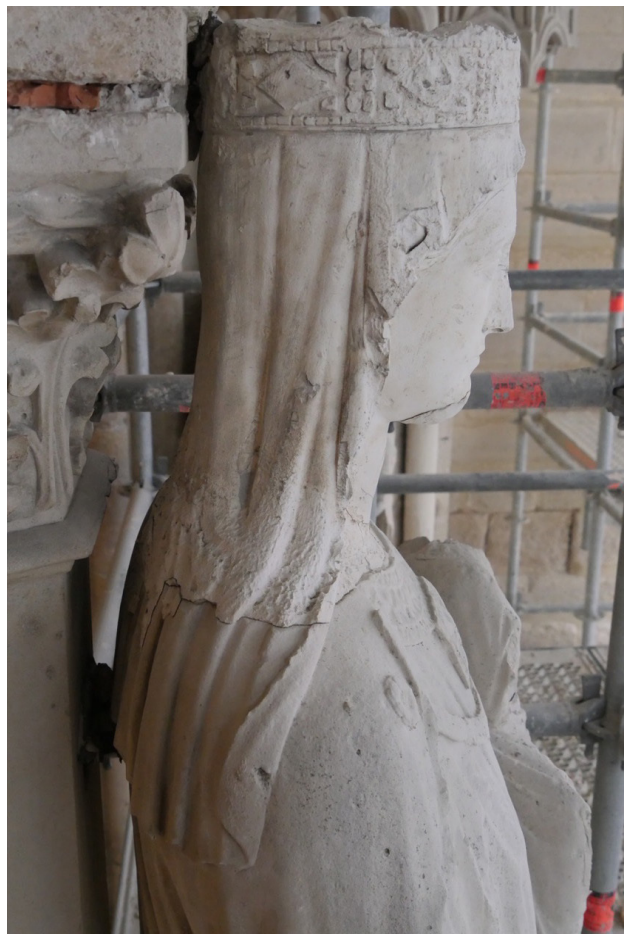
Fig. 6 Longpont, portail, trumeau, agrafe derrière la statue de la Vierge