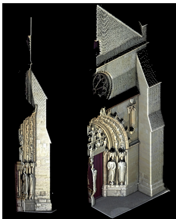
Fig. 8 Longpont, portail, coupe et vue axonométrique

œuvre ou d'une importante réparation d'édifice marquent leur présence par l'inclusion de leurs effigies dans cette œuvre. Nous avons proposé d'expliquer les changements de courbure des arcs des voussures et de l'épaisseur du mur par l'installation des niches avec statues en l'honneur du couple royal mentionné. Ceci n'exclut pas de penser qu'ils étaient sollicités par les moines, comme Philippe le Bel l'a été, à soutenir financièrement la réparation nécessaire de la façade et que logiquement, ils ont « signé » cette réparation en y plaçant leurs statues. L'opération du remontage partiel montre l'intérêt que l'on a accordé aux sculptures du XIII e siècle. Le tympan représentant le Couronnement de la Vierge et les voussures des paraboles se trouvent magnifiés et « encadrés » par les aménagements du XV e siècle.