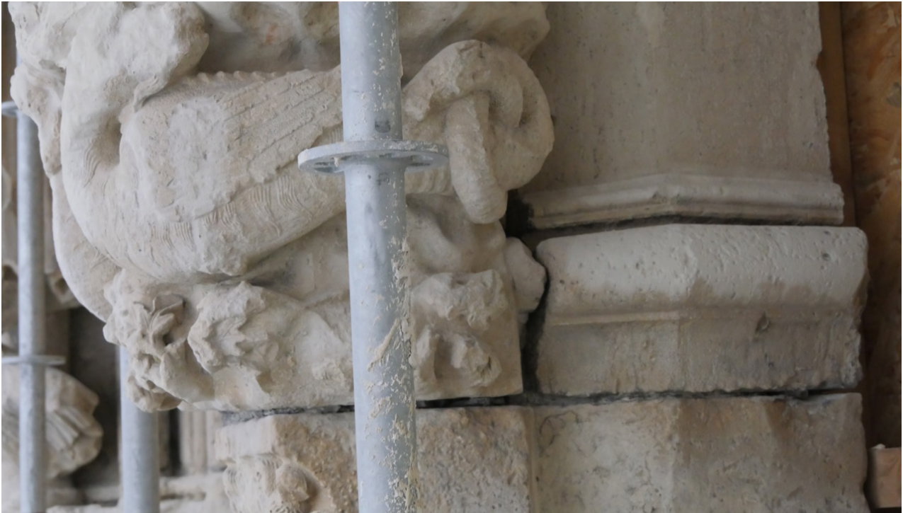
Fig. 5 Longpont, portail, base du trumeau