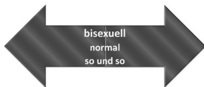
Bisexualität des Menschen als alternatives Deutungsmuster („so und so“)

Andere Konzepte gleichgeschlechtlichen Begehrens, etwa die Vorstellung einer grundlegenden Bisexualität aller Menschen, konnten sich kaum neben dem Modell der zu einem positiven Selbstbild umgedeuteten ‚homosexuellen Persönlichkeit‘ etablieren. Sowohl Sigmund Freuds (1856–1939) Inversionstheorie von 1905 als auch andere Vorstellungen von Bisexualität wurden in den Zeitschriften kaum dargestellt.