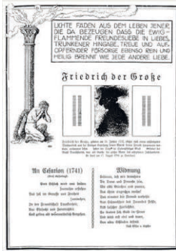
Die Freundschaft Nr. 4 (1922)