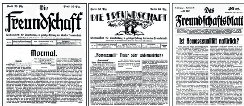
Die Freundschaft Nr. 13 (1919)

Die Freundschaftsverbände und ihre Zeitschriften wollten Männer begehrenden Männern ein positives Selbstbild geben oder dieses verstärken. Immer wieder wurde der Gedanke, dass das eigene Begehren etwas Positives und nicht etwa etwas Pathologisches sei, direkt formuliert oder schimmerte aus Aussagen hervor. So hieß es etwa 1919 in einem programmatischen Beitrag: „Betrachte deine Veranlagung nie als etwas Unrechtes, Krankhaftes, denn was du tust, ist deine Natur. Die Nichterfüllung Deines Naturgesetzes kann nur ein Mensch von Dir verlangen, der unserer Sache aus Mangel an naturwissenschaftlichen Kenntnissen und falschem Moralgefühl verständnislos gegenübersteht.“ 22 Beiträge, die über gleichgeschlechtliches Begehren aufklären sollten, erschienen während der ganzen Weimarer Republik in den Zeitschriften. In ihnen wurde Homosexualität als „normales“ Begehren wie Heterosexualität dargestellt, aber eben als „anders“.