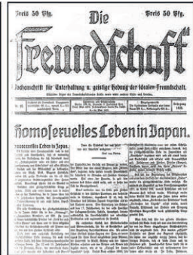
Die Freundschaft Nr. 18 (1920)

Mittels einer ‚Ahnengalerie‘ berühmter historischer Persönlichkeiten, wie Herrschern, Künstlern, Schriftstellern und Feldherren, aber auch von ‚Menschen aus dem Volk‘, die als homosexuell dargestellt wurden, und durch die Betrachtung gleichgeschlechtlichen Begehrens in nicht-europäischen Kulturen wurde die Idee der ‚Anderen‘ als einer ‚Gruppe über Raum und Zeit‘ geschaffen. Zuweilen gab es auch Blicke auf Homosexualität im Tierreich. Die seit dem 19. Jahrhundert bestehende Tradition, „homosexuelle Ahnen“ in der Geschichte zu suchen und zu finden, wurde insbesondere von dem Biologen und Kulturforscher Ferdinand Karsch-Haack (1853–1936) aufgegriffen und durch seine zahlreichen Artikel in verschiedenen Zeitschriften zum Wissensbestand gleichgeschlechtlich begehrender Menschen. Andere folgten ihm, zeitweise gab es in den Zeitschriften dafür auch eigene Rubriken. 25