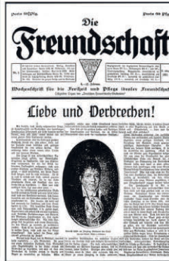
Die Freundschaft Nr. 5 (1921)