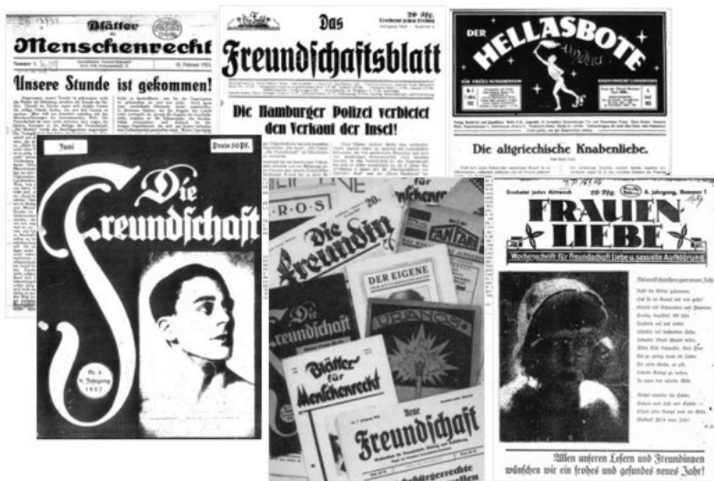
Bandbreite der Zeitschriften für gleichgeschlechtlich begehrende Menschen in der Weimarer Republik

von Heike Schader 12 maßgeblich, auch wenn oft englischsprachige Titel angeführt werden, und für Männer begehrende Männer meine eigenen. 13