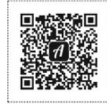
Abb. 2 QR-Code zur VR-Kirchen(raum)erschließung St. Heinrich

die 3D-Kirchenmodelle sowohl für sich betrachtet als auch in Kombination mit der App Actionbound gezielt erschlossen werden.