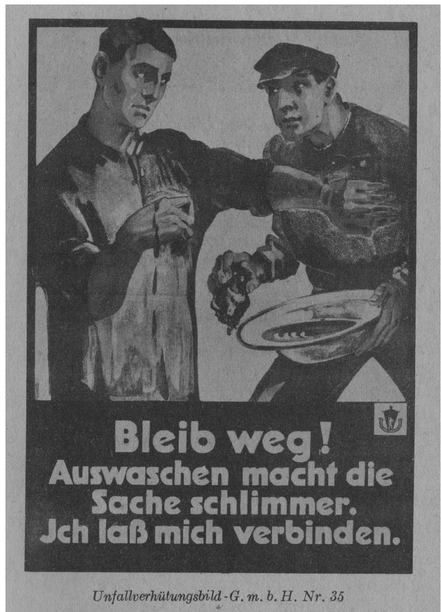
Quelle: Reichsarbeitsverwaltung: Das Arbeiterschutzbüchlein der Reichsarbeitsverwaltung, Berlin 1926, S. 27

Auch wenn so zunächst nur wenige spezielle Symptome abgedeckt waren, stellte die Ausdehnung der Unfallversicherung auf gewerbliche Berufskrankheiten eine wichtige Zäsur dar. Eine stetige Ausweitung erfolgte: zuerst 1929 mit einer Ausdehnung