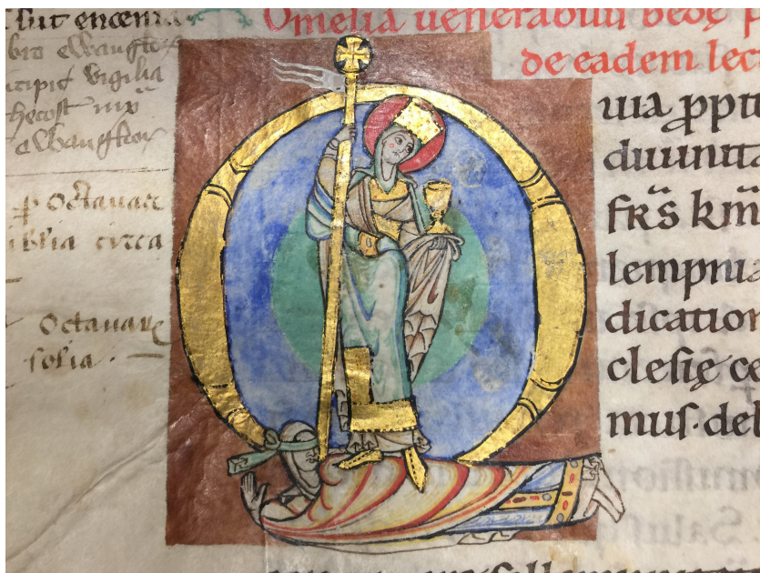
Abb. 2: Petrus Lombardus, Sentenzen IV , Ms 121 f273v Verdun BM, Initiale V

Aus der kleinformatischen Buchkunst entwickelt sich das Motiv weiter über Kirchenfensterzyklen, bis es im öffentlichen Raum, an den Portalen – speziell Gerichtsportalen – großer mittelalterlicher Kathedralen, seine monumentale Form erreichte 35 . In Paris, Reims, Straßburg, Bamberg entstanden neue ikonografische Programme, die die bisherigen Bedeutungsebenen deutlich weiterentwickelten im Sinne komplexer theologischer oder heilsgeschichtlicher Programme. 36 Zentrale Themen waren das im Sinne der Substitutionstheologie gedeutete Hohelied oder das Weltgericht, in dessen Kontext Synagoga und Ecclesia als Zeuginnen der Heilsgeschichte auftraten.