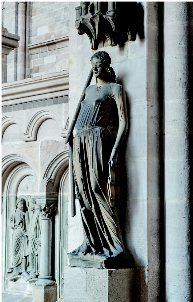
Abb. 7: Bamberger Dom Südschiff, Synagoga mit Gesetzestafeln, Erzbistum Bamberg, Foto: Ludmila Kvapilová-Klüsener

1920er Jahren »Jungfrauenpforte« als festen Begriff 65 , auch Weese verweist auf die Jungfrauen-Sage.