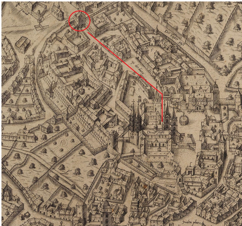
Abb. 6: Zweidler-Plan von 1602, Ausschnitt Domburg

zu. 58 Die heutige direkte Verbindung zur Stadt über die Karolinenstraße datiert erst aus der Abtragung des Terrains im Zuge der barocken Umgestaltung des Domplatzes nach dem Bau der Neuen Residenz Ende des 18. Jahrhunderts. Im Mittelalter erfolgte der Hauptzugang zur Domburg über das obere Tor bei St. Jakob. 59