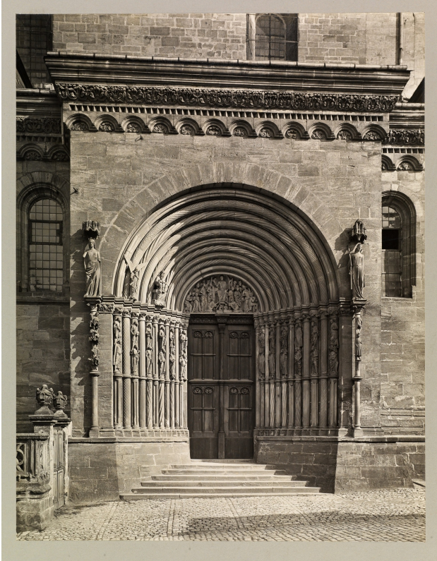
Abb. 4: Bamberger Dom, Fürstenportal, Zustand um 1920, Staatsbibliothek Bamberg, VG Meßbildanstalt, Repro: Gerald Raab.

insbesondere des von der sog. Jüngerer Bauhütte 43 ergänzten »Rahmenprogramms« mit Ecclesia und Synagoga, funktioniert vertikal, von unten nach oben, von Vision zu Erfüllung, von Ursache zur Wirkung: Aus Betrachter:innenperspektive leitet in der linken unteren Ebene der mit einer Schriftrolle unter der Ecclesia sitzende alttestamentliche Prophet, der mehrheitlich als Ezechiel gedeutet wird, die Szene ein, zeigt auf seine Vi-