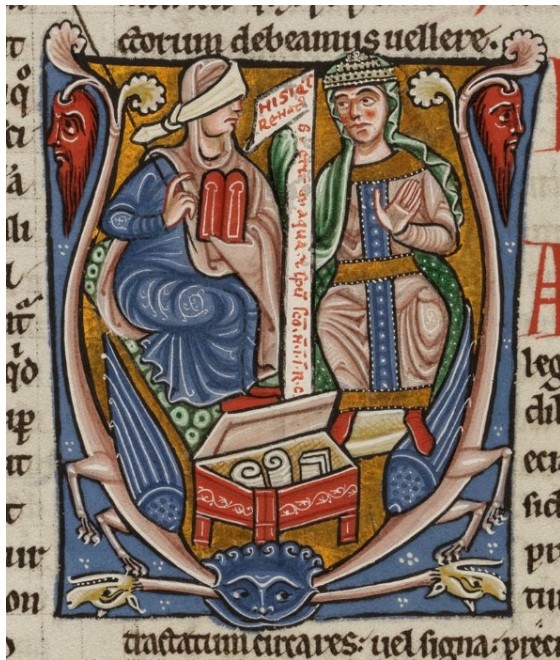
Abb. 1: Petrus Lombardus, Sentenzen IV , Staatsbibliothek Bamberg, Msc. Patr. 120 f. 4v.

bis ins 13. Jahrhundert vielfach kopierten Sentenzen des Petrus Lombardus. Die Illuminationen im Vierten Buch, im Kapitel zur Konkordanz des Alten und Neuen Testaments, 32 bieten einen reichen Bildfundus von Ecclesia und Synagoga im sitzenden oder stehenden Dialog oder Disput 33 . Die Handschrift war zu Beginn des 13. Jahrhunderts weit verbreitet und auch in der Bamberger Dombibliothek vorhanden. 34