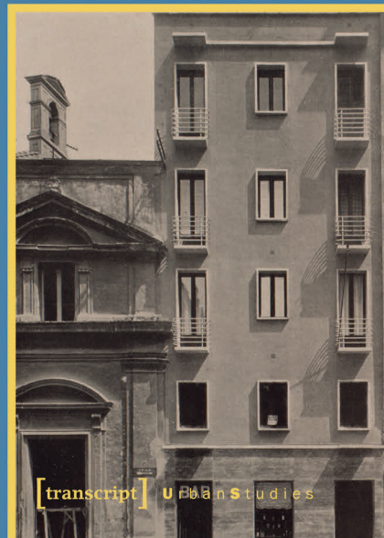
Abb. 2: Townscapes in Transition [Buchcover transcript Verlag 2019]

Transformation and Reorganization of Italian Cities and Their Architecture in the Interwar Period