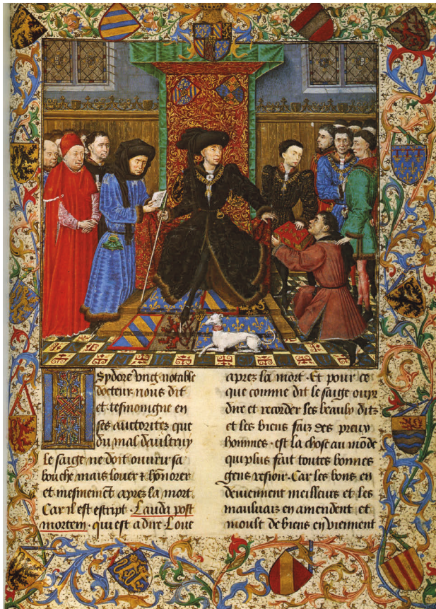
2 Meister des Girart von Roussillon: Die Taten des Girart von Roussillon, Übergabe der Prachthandschrift an Philipp den Guten, 1447–1450. Wien, Österreichische Nationalbibliothek – Cod. 2549, fol 6r.