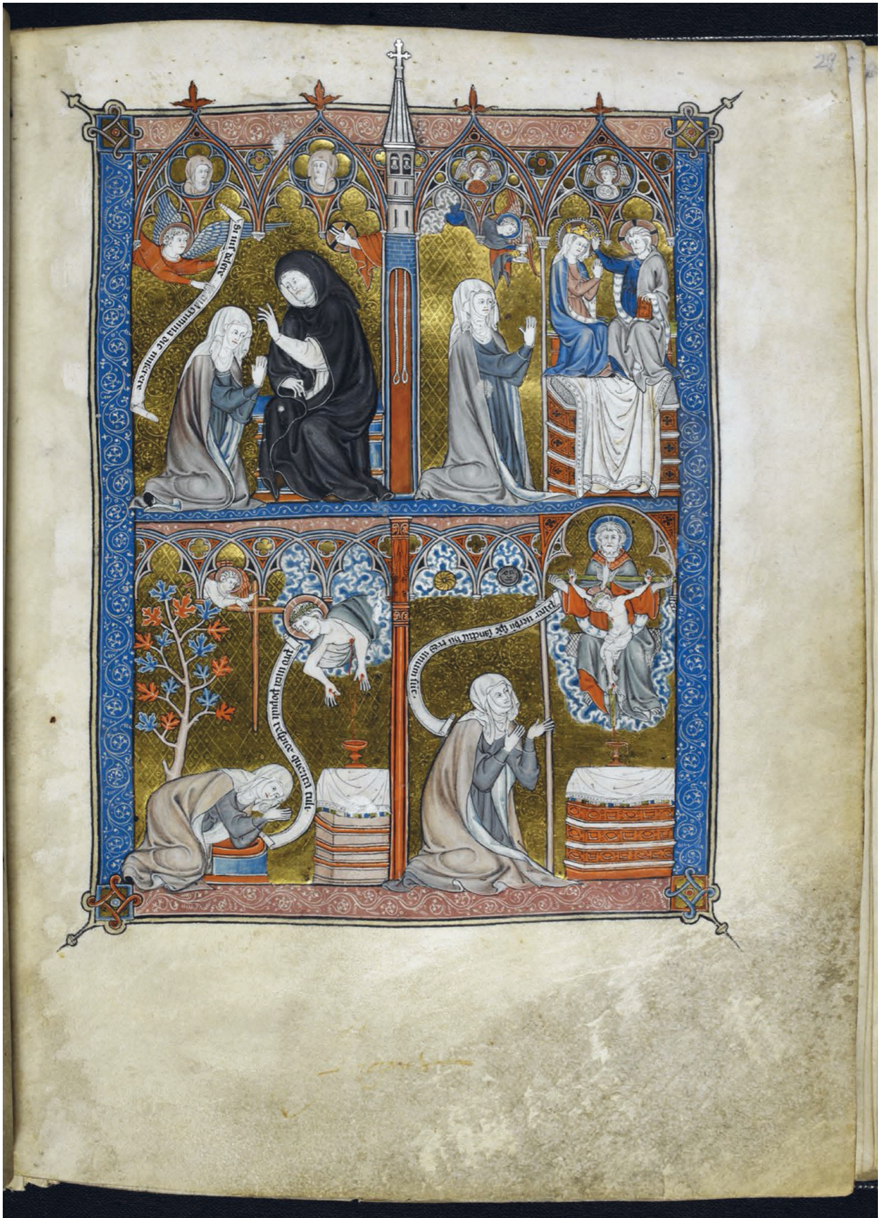
9 Pierre de Blois (u. A.): Livres de l'estat de l'ame (fol. 28v–51v), um 1290. London, British Library, Yates Thompson 11 (Add. MS 39843), fol. 29r.