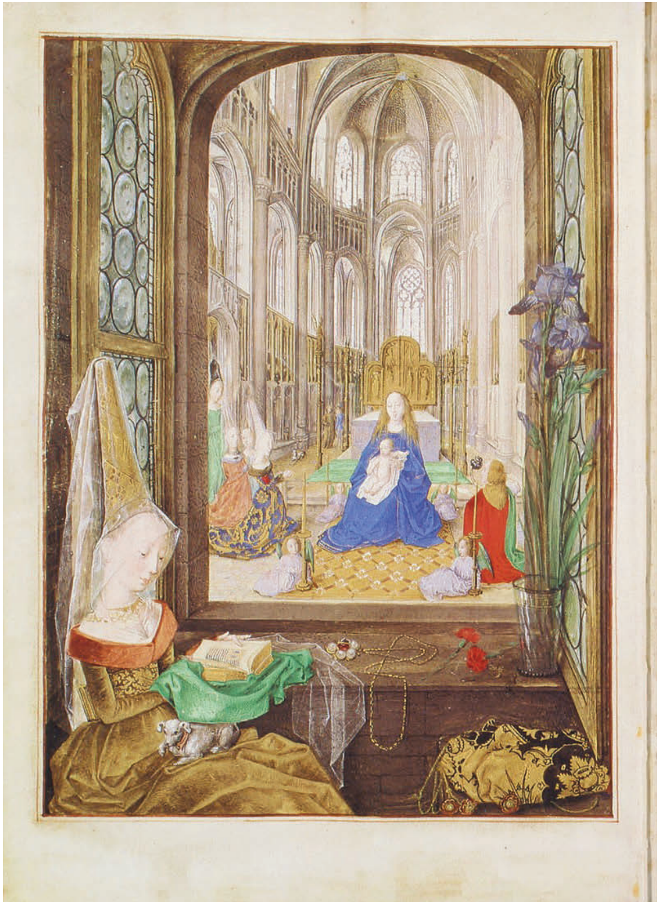
7 Meister der Maria von Burgund: Stundenbuch der Maria von Burgund, um 1477. Wien, Österreichische Nationalbibliothek, Cod. 1857, fol. 14v–15r.