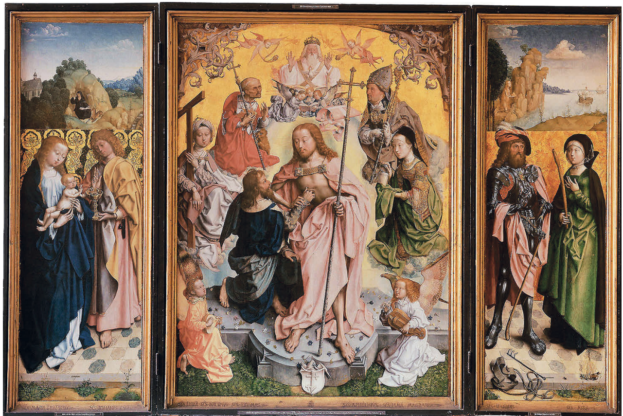
10 Meister des Bartholomäus: Thomas-Retabel, 1481. Köln, Wallraf-Richartz-Museum – WRM 179.

physische Bild ersetzt hat. Entscheidend ist hier, dass die Bilderfahrung, so wie im Stundenbuch die Texterfahrung, der Visionserfahrung vorausgeht. Während die Etaz Ausgangspunkt und Ziel veranschaulichen, zeigt das Thomas-Retabel (um 1481) 43 vom Meister des Bartholomäus, einem in Arnheim und Utrecht nachweisbaren Maler, 44 hingegen eine Art stufengenaue Anleitung zum ‚richtigen‘ Bildgebrauch (Abb. 10): Auf der Haupttafel reihen sich eine Gruppe von Heiligen in einer Art Mandorla um eine gemalte polychrome Skulptur des Thomas-Wunders. 45 Dächte man die schräg angelegte, in den Bildraum gekippte Struktur der Heiligen-Mandorla weiter, so würde sich diese erst vor dem Gemälde im Betrachterraum – im Sinne Baxandalls „Arc of Address“ 46 mit den Betrachtenden zusammen – schließen. Die Heiligen der Mandorla verbildlichen dabei einen vierstufigen, auf Thomas von Aquin zurückgehenden Erkenntnisprozess. 47 Dieser beginnt mit der Figur der Maria Magdalena rechts unten, der als einziger Zeitzeugin der einfachen Sehsinn ( sensus proprius et communis ) zukommt. Das erblickte, physisch greifbare Primär-Bild 48 wird durch ihren direkten Blick in ein Metaphysisches, Inneres gewandelt und in das Gedächtnis als inneren Bildraum gespiegelt. Gegen den Uhrzeigersinn wird die