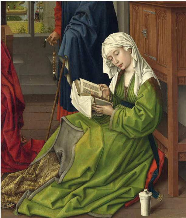
5 Rogier van der Weyden: Fragment mit der lesenden Maria Magdalena, vor 1438. London, National Gallery – NG654.