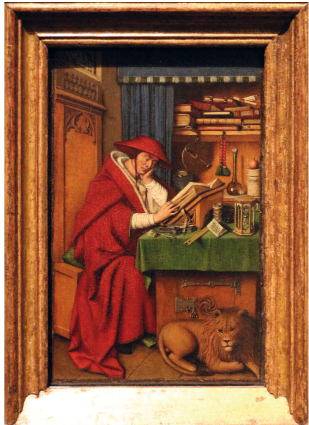
3 Jan van Eyck: Der heilige Hieronymus in seiner Studierstube, 1442. Detroit, Institute of Arts – Inv. Nr. 25.4.

Opera a ben vivere , einer didaktischen volkssprachlichen Anleitung zu einem ‚guten Leben‘, Lesen und Gebet seien wie „two wings that keep the devout soul suspended aloft, never letting it come to earth, that is, to earthly things, through affection and desire“. 6