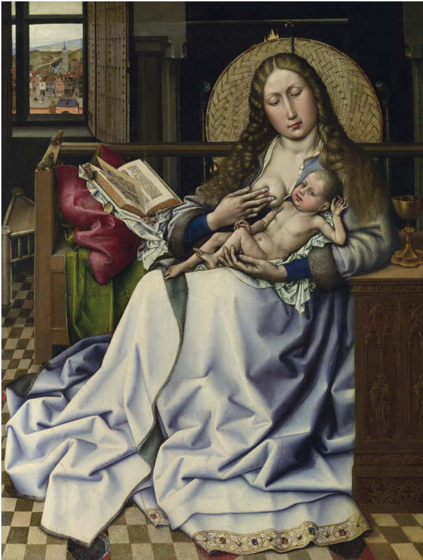
6 Robert Campin (Umkreis): Maria lactans , vor 1430. London, National Gallery – NG2609.

Marielenleben, aus dem gesteigerten Bedürfnis des Wissens heraus, zu „überlegen, was biographisch möglich, historisch wahrscheinlich und theologisch vertretbar war“. 13 Schreiner zufolge kam es dabei zu „interpretatorischen Eingriffen [...] des biblischen Berichts. Dessen zeitgebundene Aktualisierung erschließt Denkweisen, Interessen und Rechtfertigungsbedürfnisse einer sich wandelnden Kirche und Gesellschaft.“ 14 Vor allem im 14. und 15. Jahrhundert scheint der Streit der Gelehrten klar zugunsten einer Lesekultur entschieden worden zu sein, denn Maria liest nicht nur bei der Verkündigung. So legt sie selbst beim Stillen das Buch nur kurz zur Seite, wie es in van der Weydens Maria lactans zu sehen ist (Abb. 6). Mit der lesenden Muttergottes ist aber auch die höchste Autorität Lesender und vor allem lesender Frauen in Erscheinung getreten. Judith Bryce weist – vielleicht etwas zu vereinfacht – darauf hin, dass Heilige wie Maria oder auch Maria Magdalena von Männern als Symbole (wie hier beispielsweise einer Lesetätigkeit per se beziehungsweise der uneingeschränkten Unterwerfung Mariens gegenüber den heiligen Schriften) gesehen wurden, für Frauen waren sie aber in erster Linie (lesende) Frauen. 15 Klaus Schreiner schlussfolgert in seiner Analyse der Marienexegese, dass die soziale Erhöhung der Jungfrau von