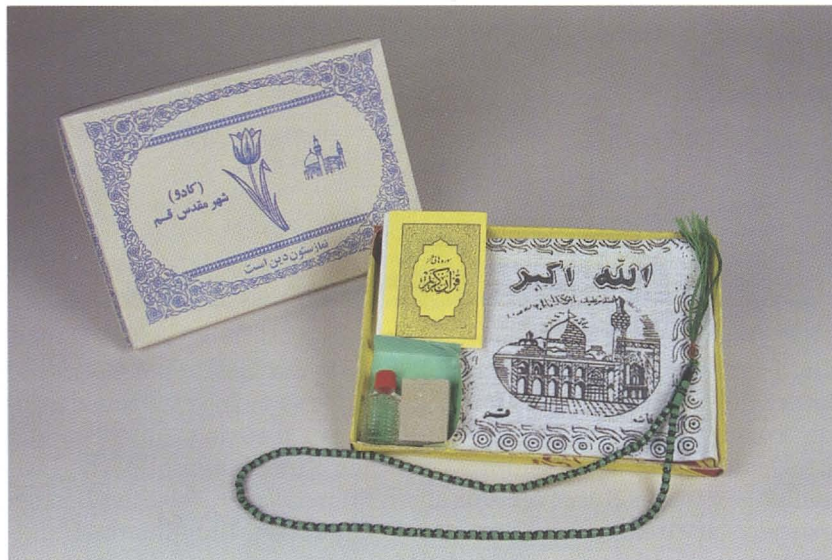
Abb. 33: Pilger-Set aus Qom / Iran.

iranischer Pilger auf den Weg zu diesen Stätten. Innerhalb Irans sind es vor allem der Schrein des achten Imams Reza in Maschhad, der im Nordosten des Landes liegt und der Schrein seiner Schwester Fatemeh Ma'sumeh in Qom. Mit prächtigen goldenen Kuppeln, ineinander verschachtelten Moscheen und enormen Innenhöfen ausgestattet bieten sie Pilgern ein beeindruckendes Erlebnis. Der Besuch des eigentlichen Grabes, das durch kostbar verzierte Gitter abgetrennt ist, wird durch andere Rituale begleitet und ergänzt.