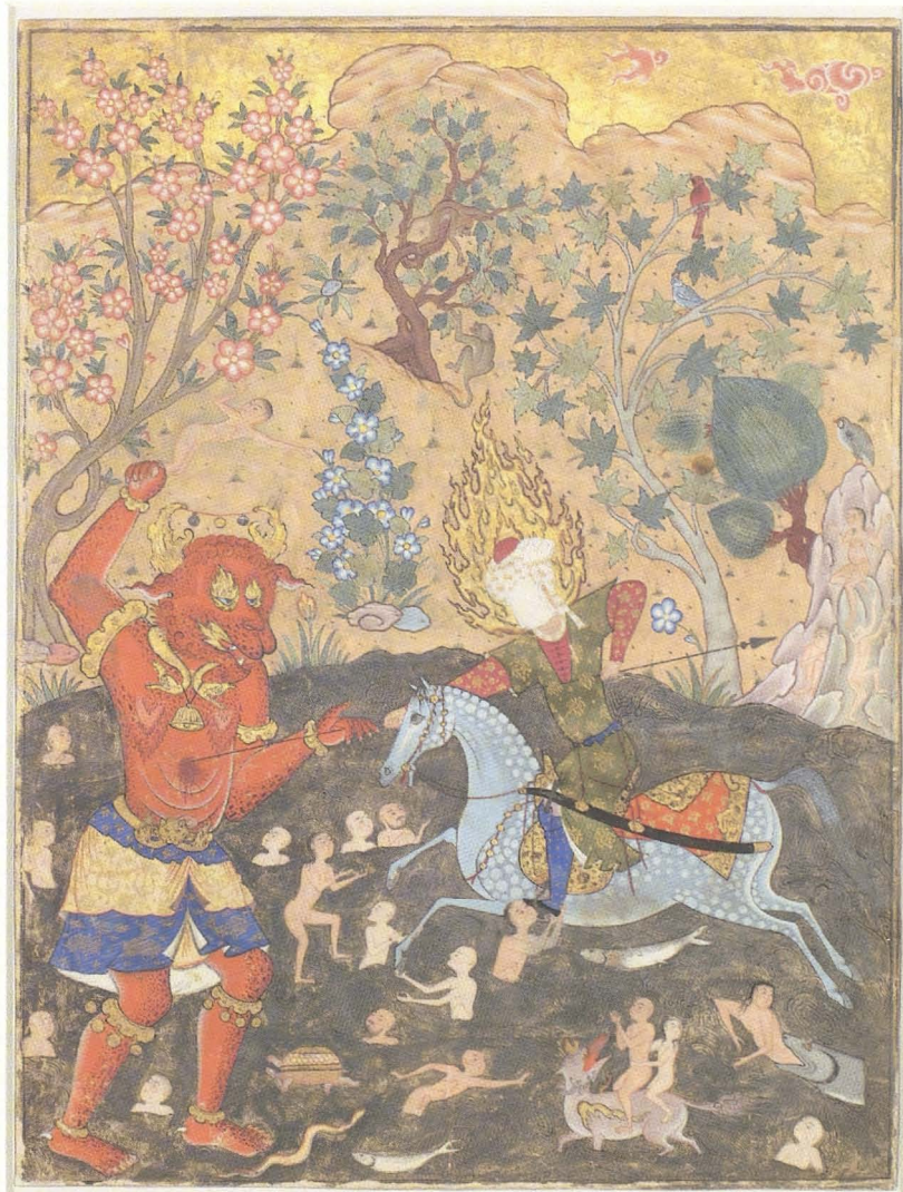
Abb. 35: Imam Reza bekämpft einen Dämon (Miniatur aus dem Fāṭnameh, Paris: Louvre).