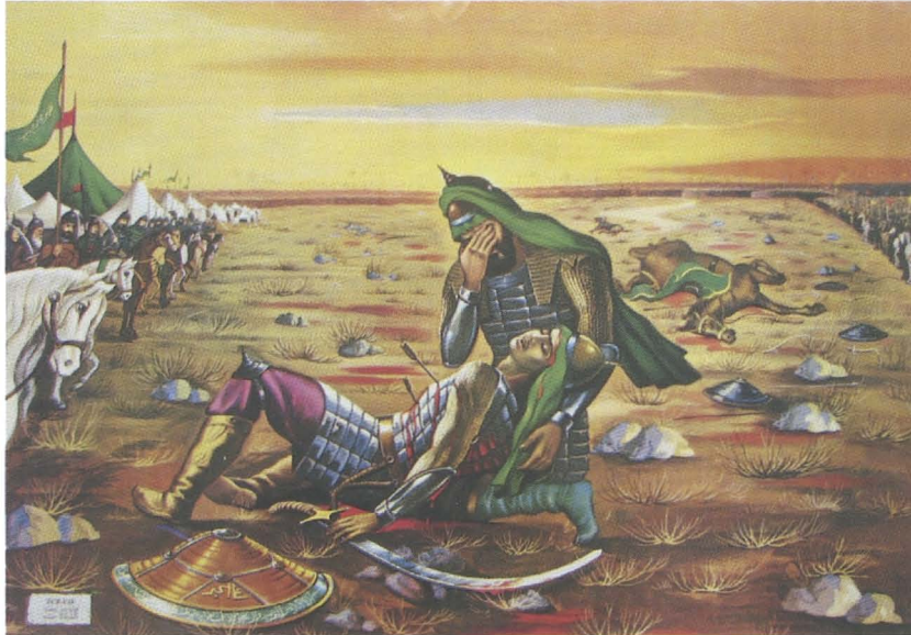
Abb. 34: Plakat zur Schlacht von Kerbela, auf dem Hoseyn seinen gefallen Sohn Ali al-Akbar betrauert.

Analogien zu den Helden des vorislamischen Iran, wie Rostam und anderen Figuren des Shahnameh sind dabei nicht zufällig. Ein Bild aus einem „Wahrsagebuch“ des 16. Jahrhunderts, das für den Herrscher Schah Tahmasp illustriert wurde, zeigt diese Doppelung deutlich. Zu sehen ist die Szene eines Zweikampfes. Auf der Seite des Guten steht eine Figur, die durch ihren flammenden „Heiligenschein“ und ihr verborgenes, verhülltes Gesicht zeigt, dass es sich um einen Propheten, einen Imam oder ein Mitglied der Familie des Propheten handelt. Dargestellt ist der achte Imam der Schia, Imam Reza, dessen Mausoleum in Maschhad wir bereits kennengelernt haben. Er reitet auf einem über dem Meer schwebenden Pferd und durchstößt mit einer Lanze eine scheußliche Gestalt, mit Hörnern, die entfernt an einen Troll erinnert. Haartig, mit Macht und Kraft verleihenden Armreifen ausgestattet, scheußlich anzusehen. Der Dämon hat die im Meer treibenden Menschen und Seelen in seiner Gewalt, sie treiben nackt und verzweifelt in einer Art Hölle und werden durch die Heldentat des Imams befreit.