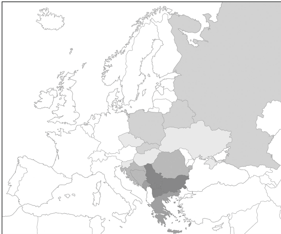
Fig. 2: Anteile der Patronymika in der Slavia und auf dem Balkan

Republik. Etwas stärker wiederum ist sie in der nördlichen Zone vertreten, die Rußland, Belarus, Polen und die Slowakei umfaßt. Dies also, um es noch einmal deutlich zu konstatieren, ist der neue (onomastische) Balkanismus, der hier vorgestellt werden sollte: eine klare oder überwältigende Dominanz der Patronymika unter den 10 bzw. 20 häufigsten Familiennamen , die, wie oben gezeigt, leicht 50% aller Vorkommen ausmachen. Die Areale der verschiedenen Intensitäten dieser Erscheinung fällt dabei weitgehend mit den Bereichen zusammen, die man auch aus anderen sprachlichen Erscheinungen kennt, und die natürlich mit der Dauer und Intensität der osmanischen Herrschaft auf dem Balkan korrelieren. Wenn die genannte Erscheinung typisch für den Balkan ist, so bedeutet das natürlich im Umkehrschluß nicht, daß sie anderswo nicht vorhanden sein könnte bzw. dürfte. So fällt z.B. auf, daß die Angaben zu St. Petersburg oben von den Angaben für ganz Rußland deutlich abweichen: in St. Petersburg haben wir ebenfalls schon unter den häufigsten 10 Familiennamen viele Patronymika (nämlich 7).