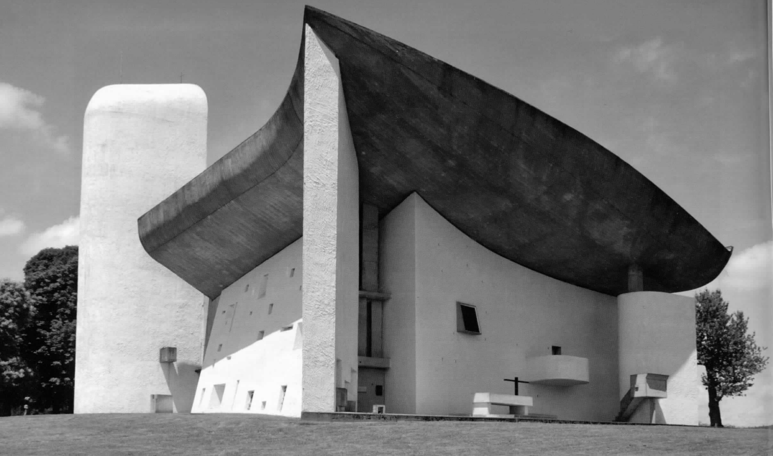
Notre Dame du Haut in Ronchamp

Een tweede voorbeeld is de Kerk van het Licht, een christelijke kapel van een Japans kerkgenootschap in Ibaraki (Japan). Het is in 1989 gebouwd door Tadao Ando . Een gebouw, weliswaar in de modernistische traditie (beton, eenvoudige muren, vierkante vormen), maar van een dichterlijke schoonheid. De architect zorgt voor wat we een sprekende leegte zouden kunnen noemen, een leegte die gevuld wordt met een kruis van licht. Ando maakt de kracht van dit licht tastbaar door de radicaliteit waarmee de horizontale en verticale lijnen elkaar door de hele zaal kruisen en zich uitstrekken naar het eind van de muur. De zaal nodigt je uit om je hart lichamelijk open te stellen voor een andere werkelijkheid. Het staat buiten kijf dat dit een heel eenvoudig gebouw is en het heeft ongetwijfeld weinig gekost. En toch heeft het een superieure kwaliteit door de uitgebalanceerde proporties. De schoonheid ervan schept een spirituele ruimte.