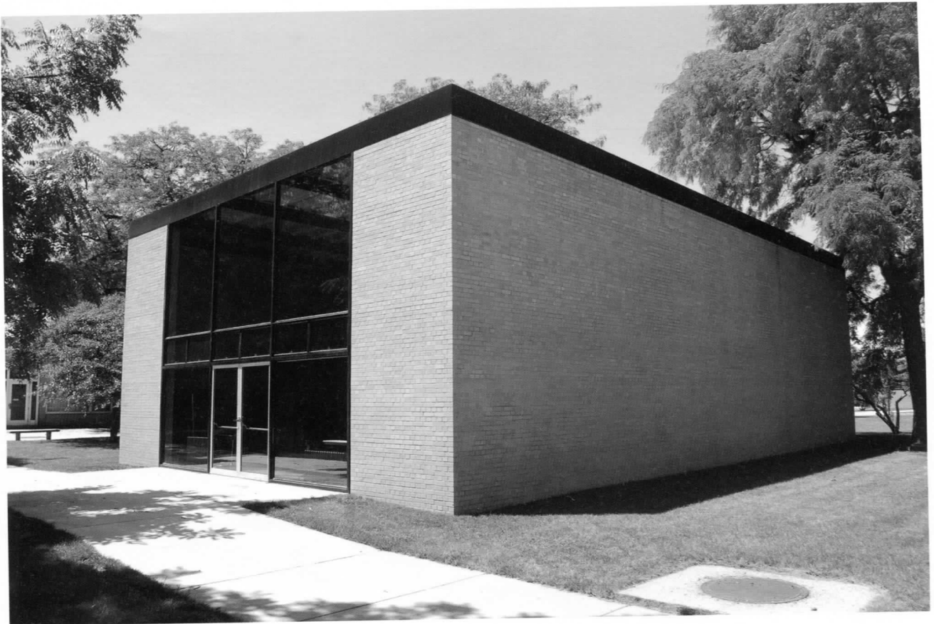
Mies van der Rohe de Chapel of St. Savior at the Illinois Institute of Technology .