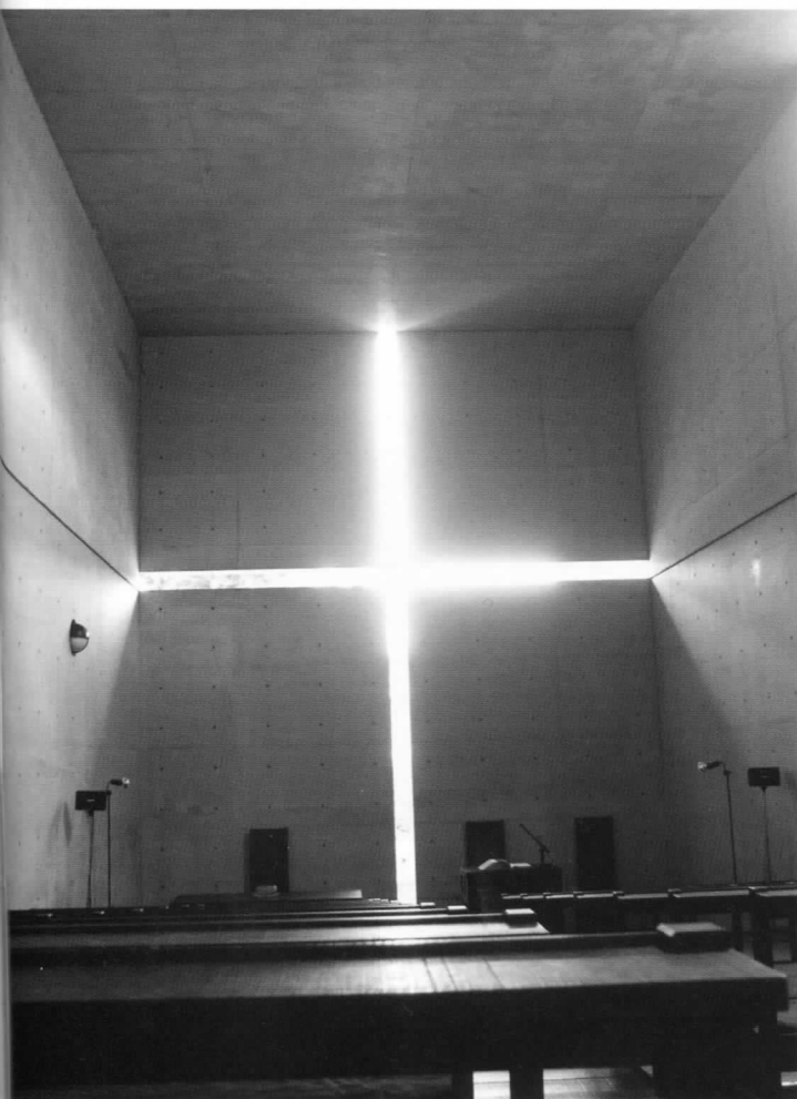
Church of Light Foto by Bergmann (Wikicommons)

Het inzetten op schoonheid is daarom in mijn ogen een ideale manier om een spirituele ruimte te creëren. Uiteraard moet schoonheid door mensen worden opgemerkt. Een goede architect die een kerk ontwerpt creëert niet een soort elitaire schoonheid die slechts door een handjevol gemeenteleden wordt begrepen. Een kerk behoort afgestemd te zijn op haar 'gebruikers', ook in de schoonheid die door het ontwerp wordt beoogd. Het gaat erom dat ze transparantie creëert, transparantie tot op God, de Transcendente.