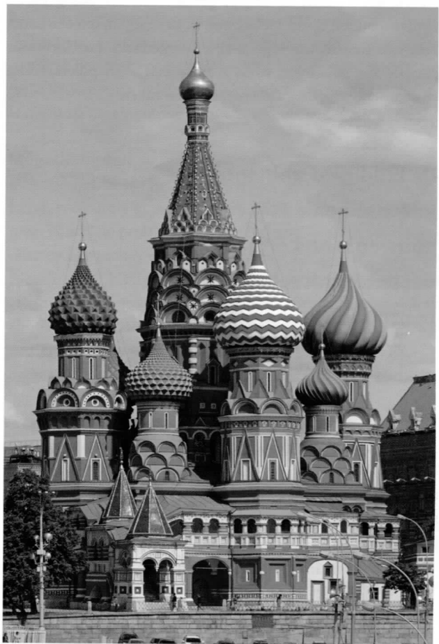
Basiliuskathedraal op het Rode Plein in Moskou

Een ander voorbeeld is de Basiliuskathedraal op het Rode Plein in Moskou.