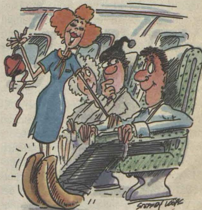
Und begrüße ich an Bord: 150 Deutsche und einen fliegenden Holländer.

Wenn einer eine Reise tut, dann kann er was erleben: Treffen deutsche Pauschalreisende auf Rhodos oder Ibiza Touristen aus den Niederlanden, Belgien oder Großbritannien, dann erleben sie manchmal ihr blaues Wunder. Denn: Für die gleiche Reise müssen Bundesbürger oft viel tiefer in die Tasche greifen. Das Büro der Europäischen Verbraucherverbände (BEUC) untersuchte in acht EG-Staaten die Pauschalangebote nach 46 Mittelmeer-Urlaubszielen. Ihr Fazit: Deutsche Reiseveranstalter sind insgesamt die teuersten; die günstigsten Angebote gibt es in Great Britain und den Niederlanden. So kann es passieren, daß ein deutscher Urlauber, der für zwei Wochen ein Apartment an der portugiesischen Algarve-Küste zum Preis von 1648 Mark gebucht hat, dort auf holländische Touristen stößt, die beim niederländischen Tochterunternehmen desselben Veranstalters weniger als 1000 Mark gezahlt haben.