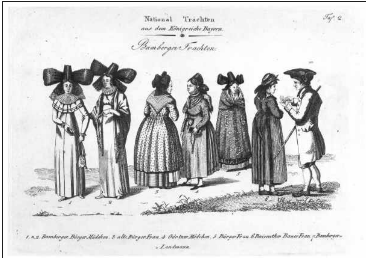
1.5 Anonym, National Tracht aus dem Königreiche Bayern. Bamberger Trachten. 6. Baireuther Bauer Frau (Detail), um 1820.