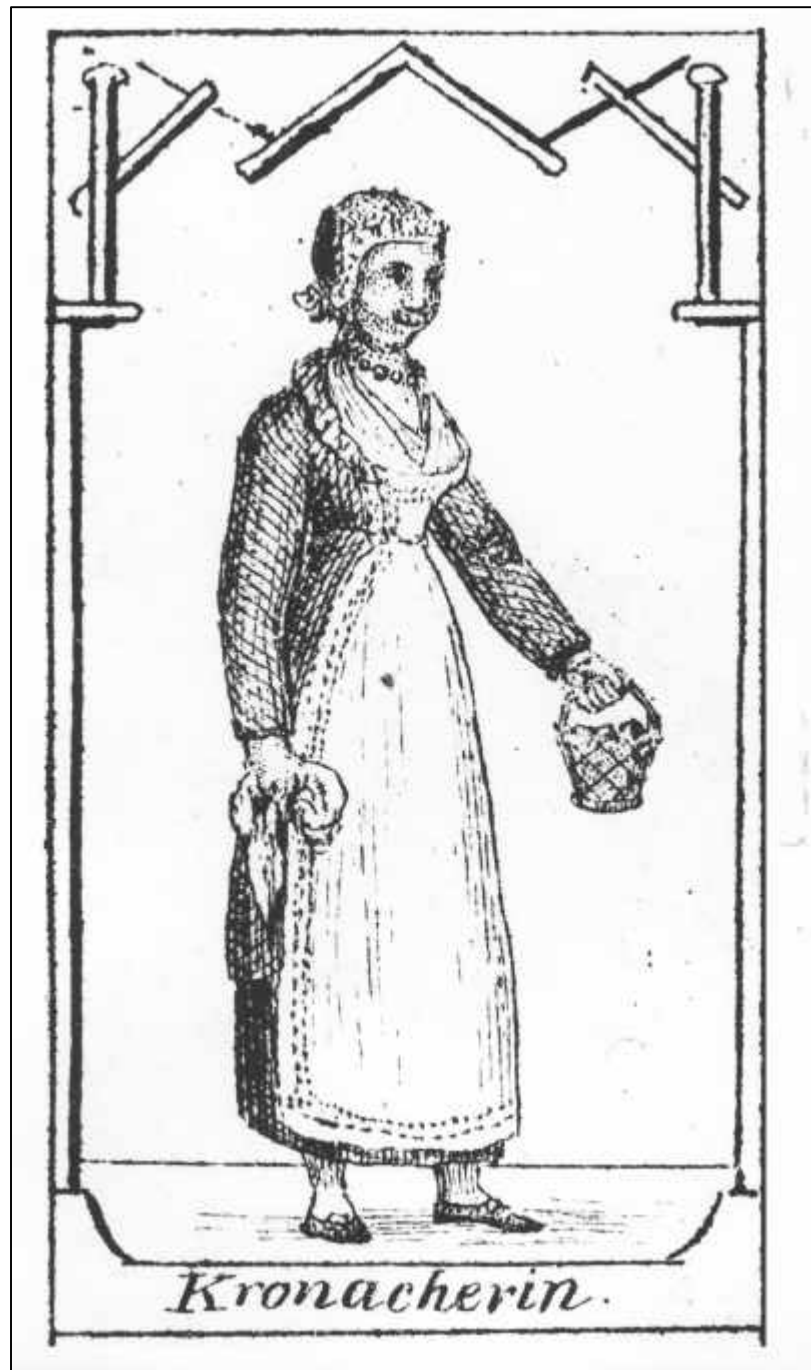
6.1 Anton Falger, Koenigreich Bayern. Kronacherin (Detail), 1826.