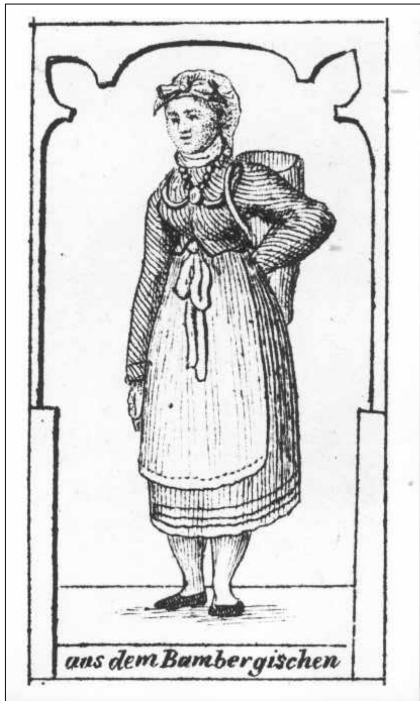
3.25 Anton Falger, Koenigreich Bayern. Aus dem Bambergischen (Detail), 1826.