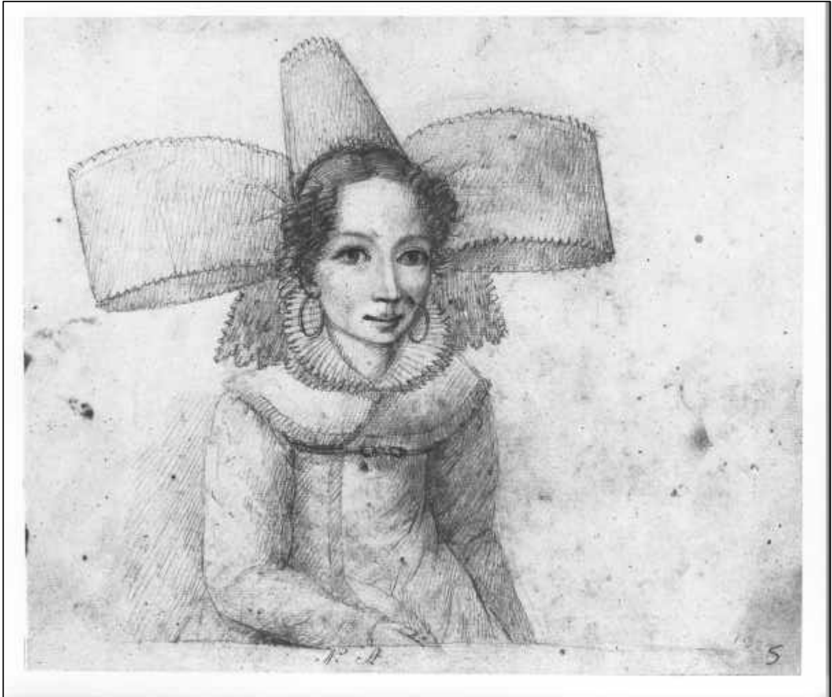
3.21 Anonym, N.A. Büste eines Mädchens in Bamberger Tracht, um 1823-1825.