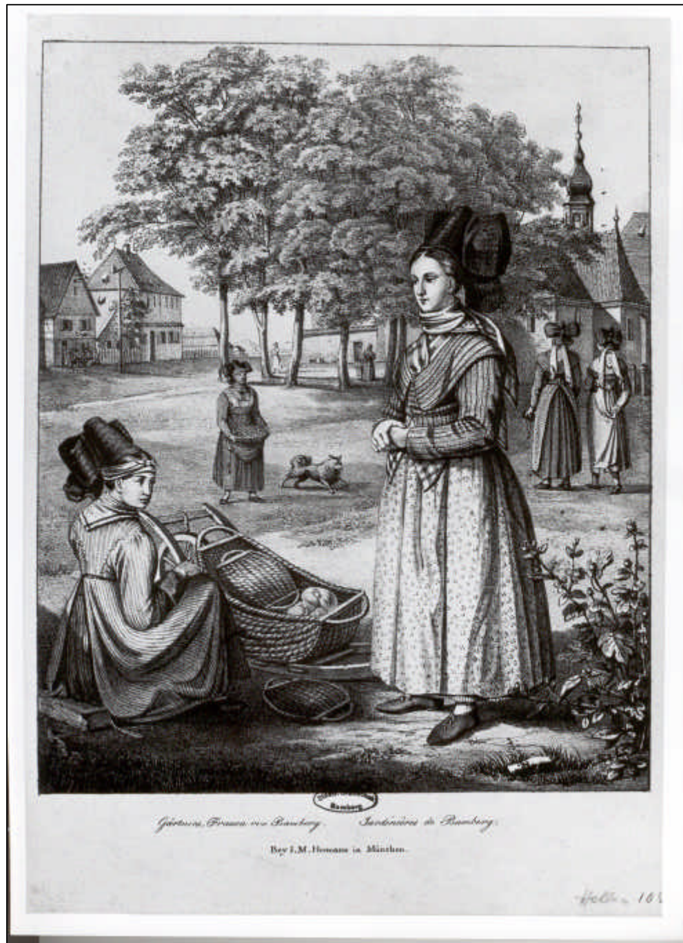
3.24 Anonym, Gärtnerinnen-Frauen von Bamberg. Jardinieres de Bamberg, um 1825-30.