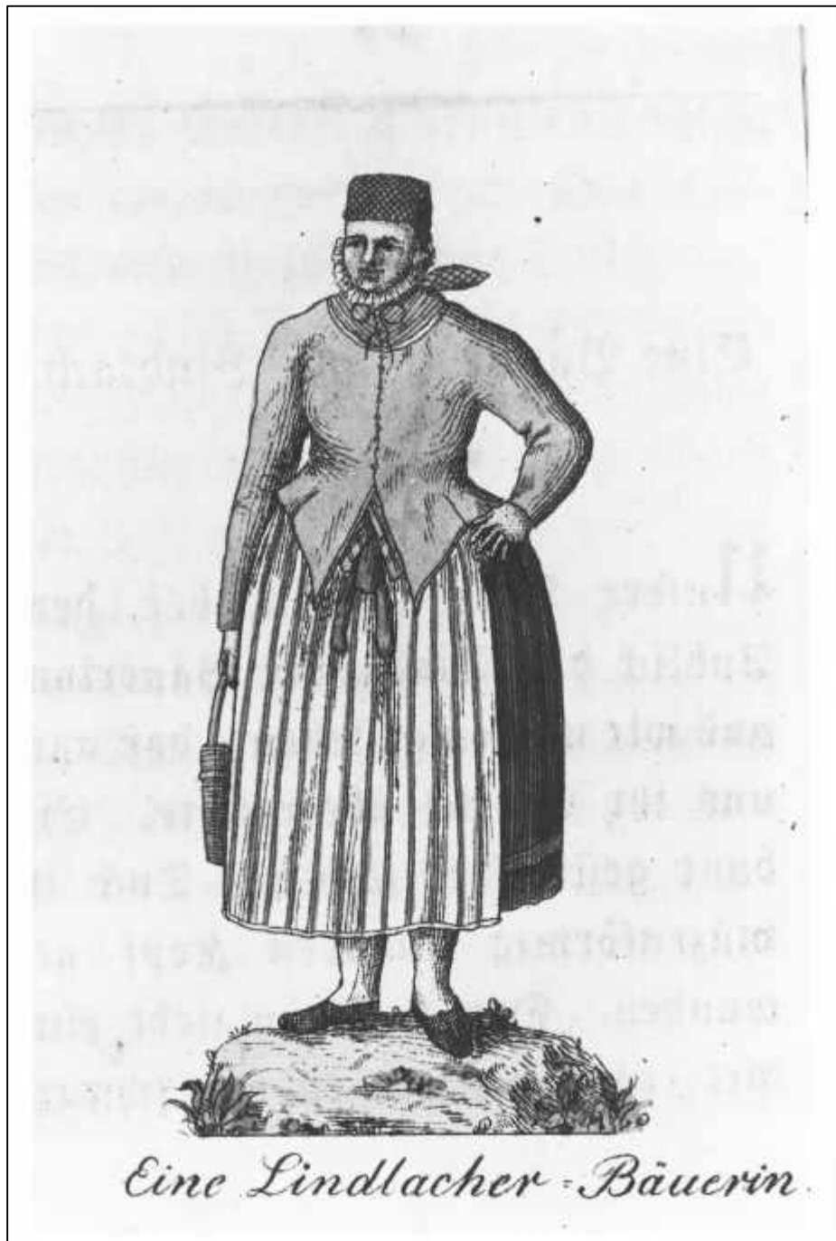
1.2 Anonym, Eine Lindlacher Bäuerin, um 1810-1818.