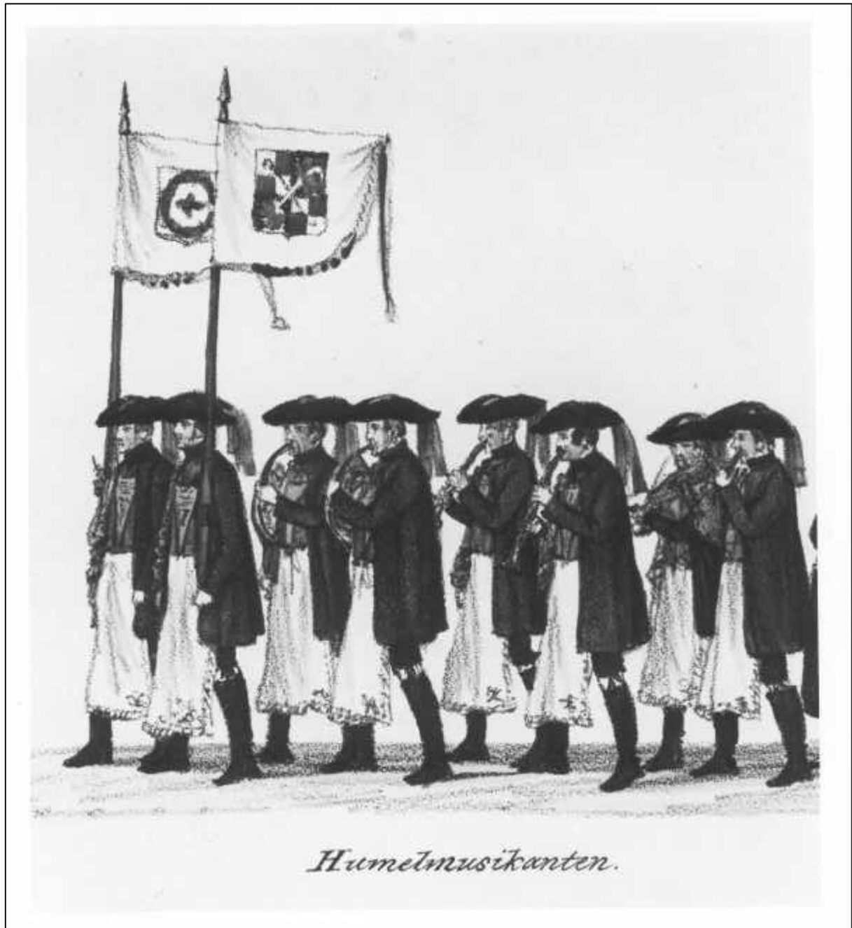
2.12 Gustav Kraus, Festzug der 35 Brautpaare zur Vermählungsfeier Sr. Königlichen Hoheit des Kronprinzen Maximilian von Bayern, u. Ir. Königlichen Hoheit der Kronprinzeß Marie von Bayern, im Vorbeiziehen vor dem Königszelt bey dem Oktoberfeste in München den 16ten Okt. 1842. Blatt III. Hummelmusikanten (Detail), 1842.