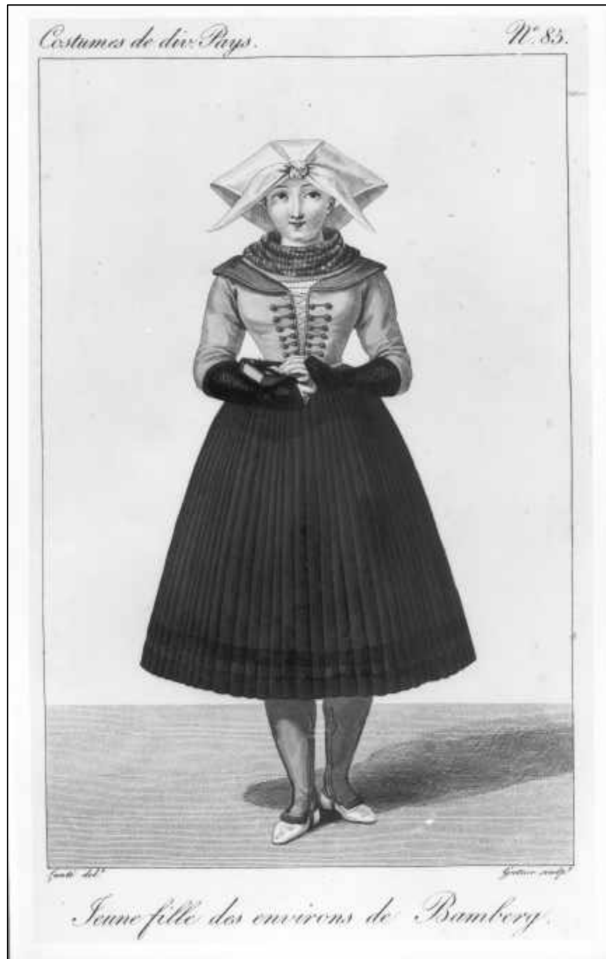
3.26 Louis Marie Lanté/ Georges Jacques Gatine, Costumes de div. Pays. Jeune fille des environs de Bamberg, um 1827.