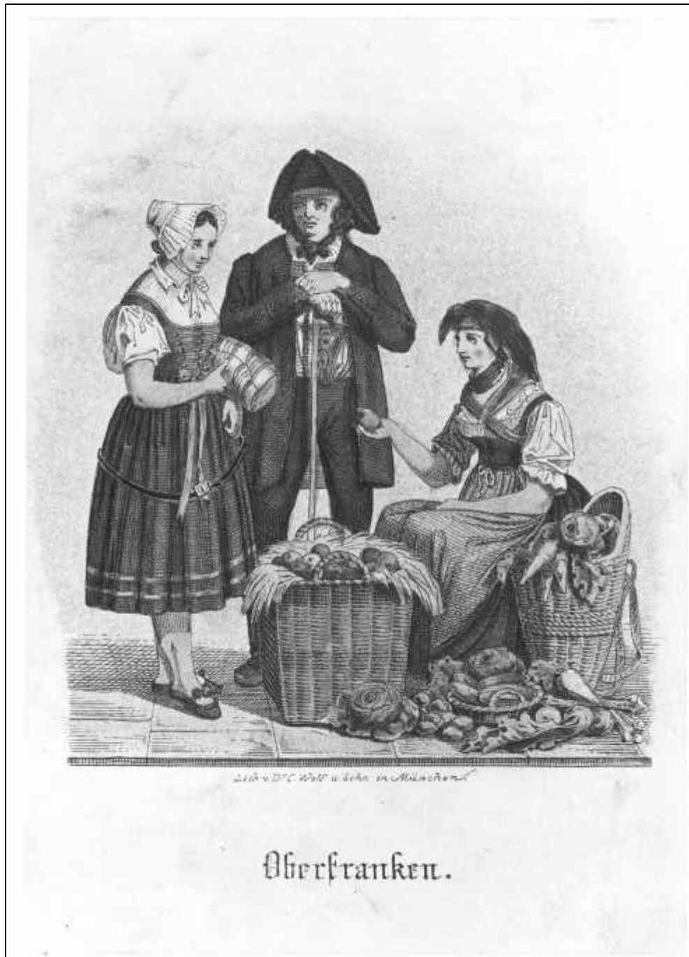
2.10 Anonym, Oberfranken. Mistelgauer Paar (Detail), um 1836.