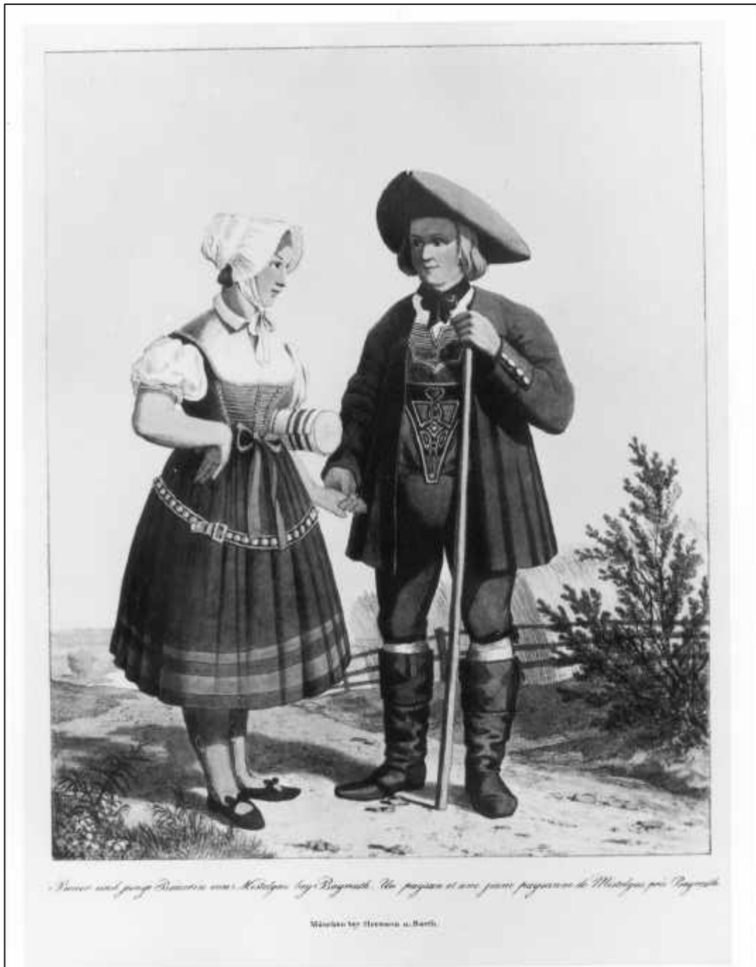
2.6 Anonym, Bauer und junge Bäuerin von Mistelgau bey Bayreuth. Un paysan et une jeune paysanne de Mistelgau pres Bayreuth, um 1822-1830.