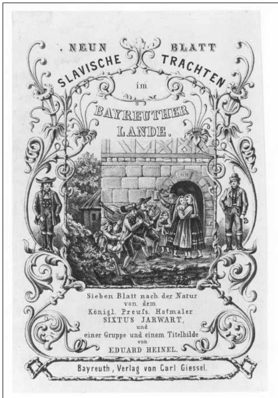
2.16 Eduard Heinel, Neun Blatt Slavische Trachten im Bayreuther Lande. Titelblatt, 1857/ 58.