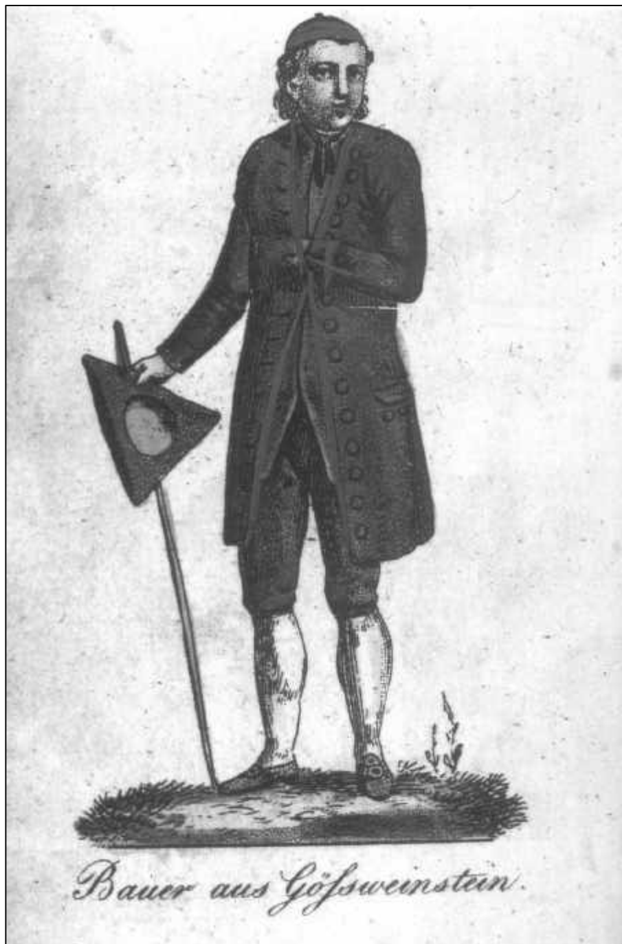
4.1 Anonym, Bauer aus Gößweinstein, um 1810-1815.