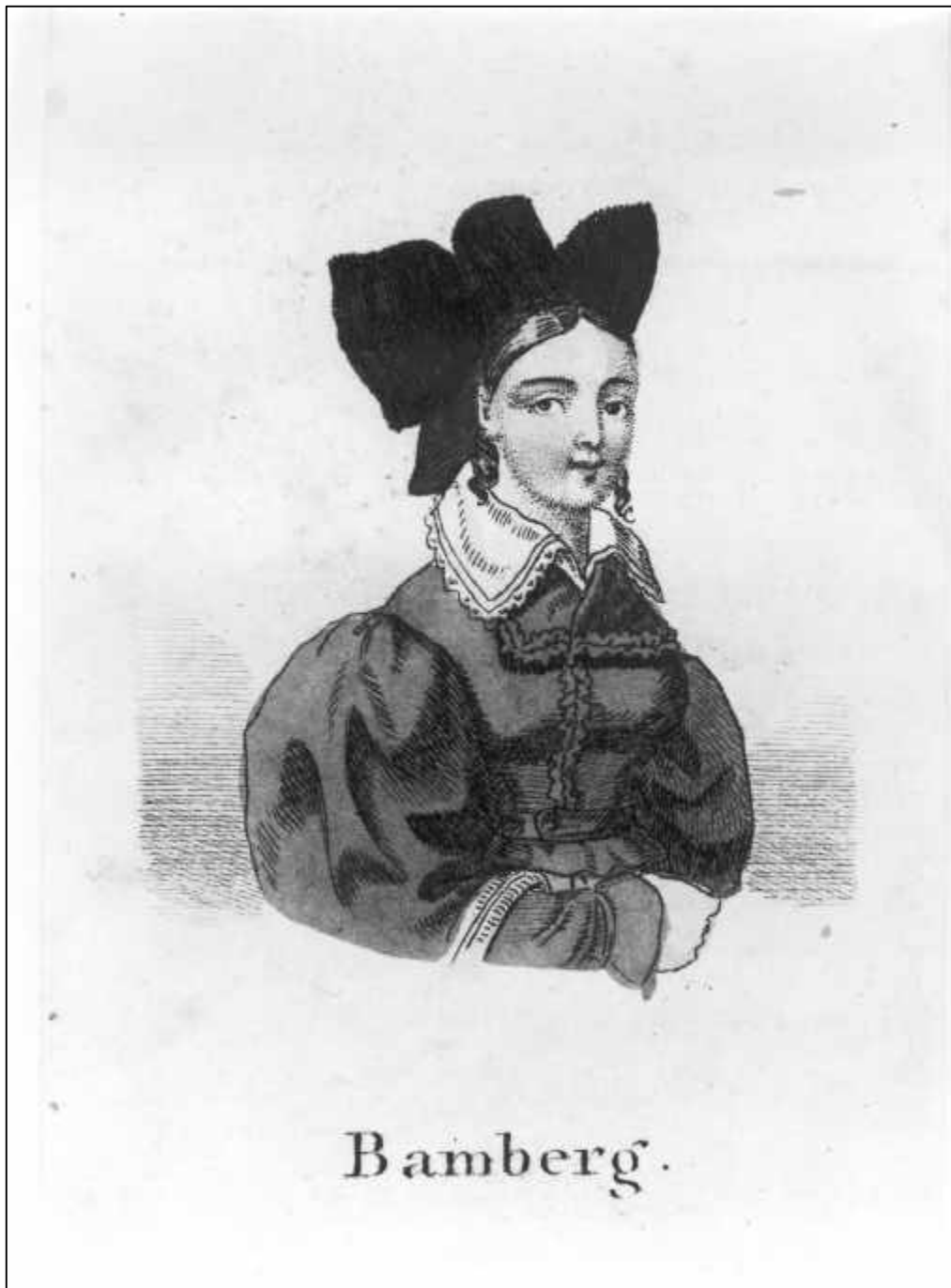
3.36 J. Voltz, Zwölf Frauenbüsten. Bamberg (Detail), um 1880.