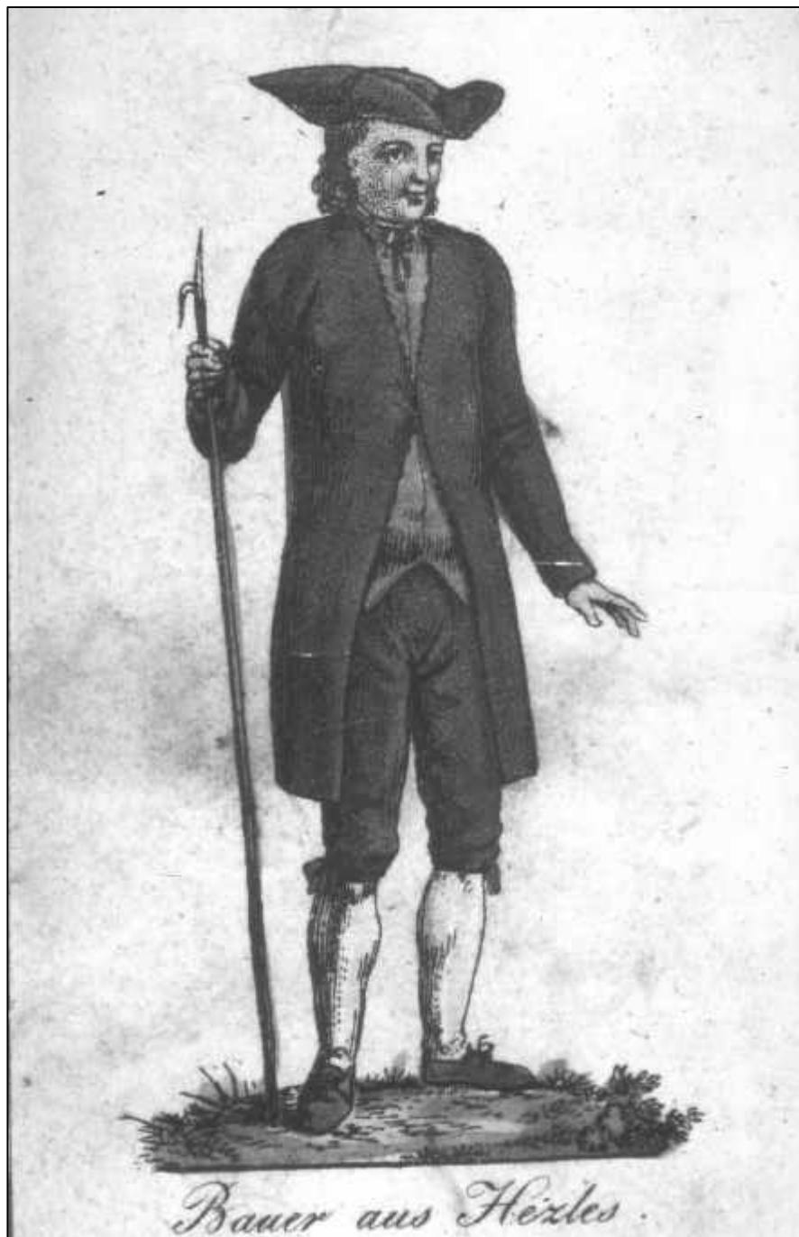
4.3 Anonym, Bauer aus Hetzles, um 1810-1815.