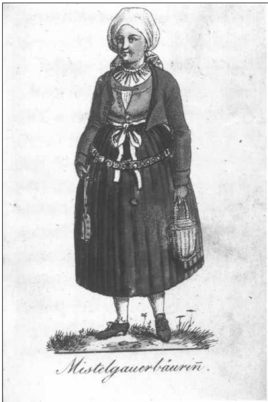
2.3 Anonym, Mistelgauerbäurin, um 1810-1815.