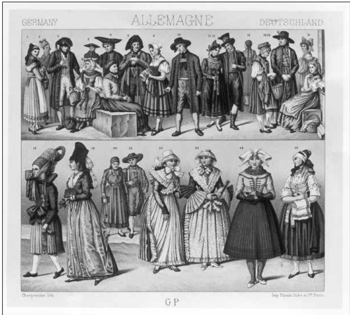
2.25 Charpentier, Le costume historique. Germany - Allemagne - Deutschland (Detail Nr. 8/9, Bauer und junge Bäuerin von Mistelgau bey Bayreuth. Un paysan et une jeune paysanne de Mistelgau pres Bayreuth), 1888.