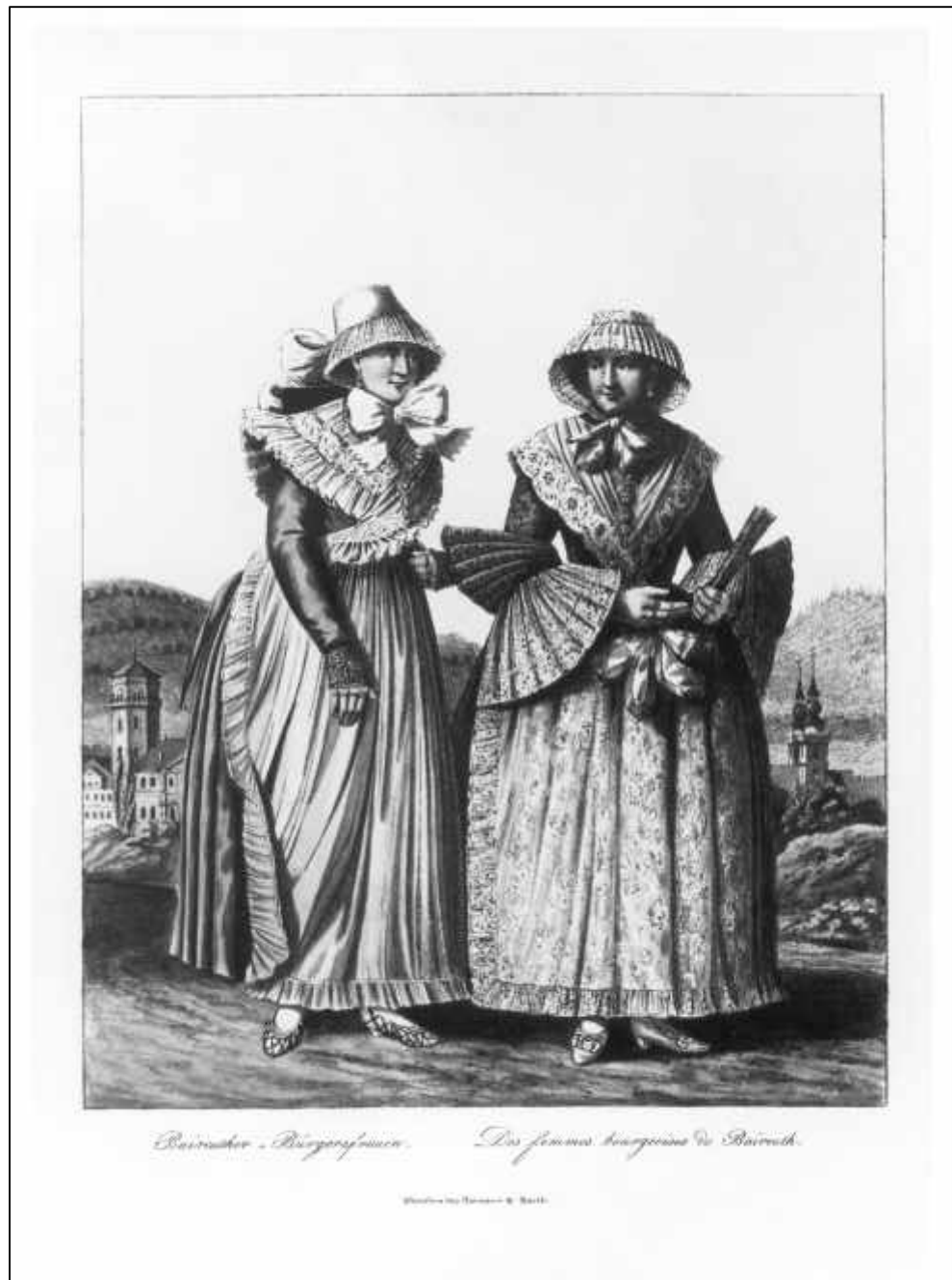
1.6 Anonym, Baireuther-Bürgerfrauen. Des femmes bourgeoises de Baireuth, um 1822-1830.