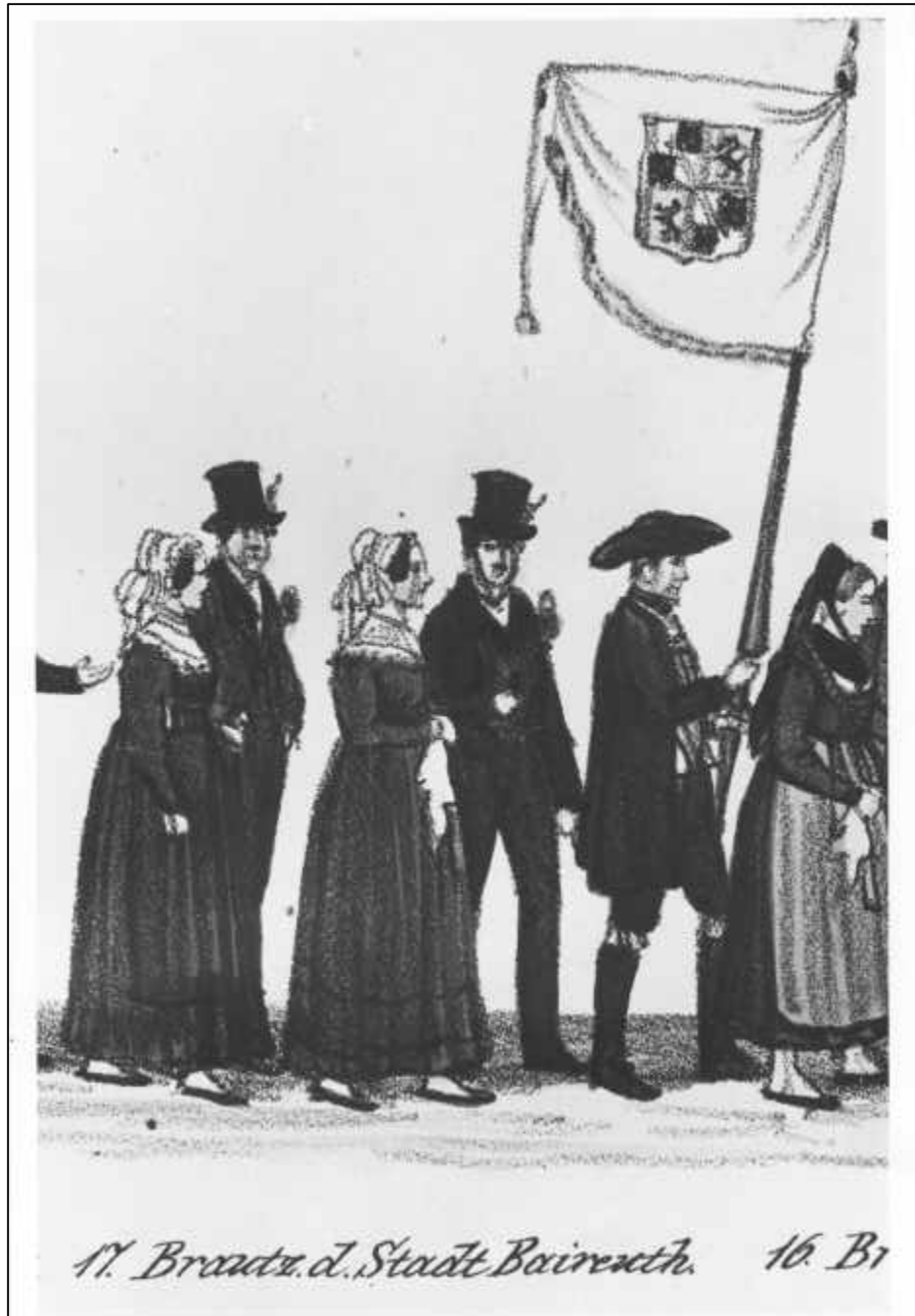
1.8 Gustav Kraus, Festzug der 35 Brautpaare zur Vermählungsfeier Sr. Königlichen Hoheit des Kronprinzen Maximilian von Bayern, u. Ir. Königlichen Hoheit der Kronprinzeß Marie von Bayern, im Vorbeiziehen vor dem Königszelt bey dem Oktoberfeste in München den 16ten Okt. 1842, Blatt II.

17. Brautz. d. Stadt Baireuth (Detail), 1842.