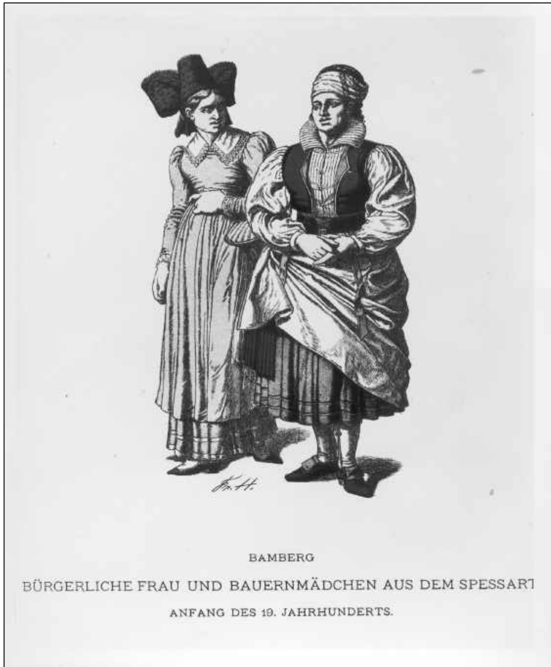
3.38 Friedrich Hottenroth, Bamberg. Bürgerliche Frau und Bauernmädchen aus dem Spessart, um 1898.