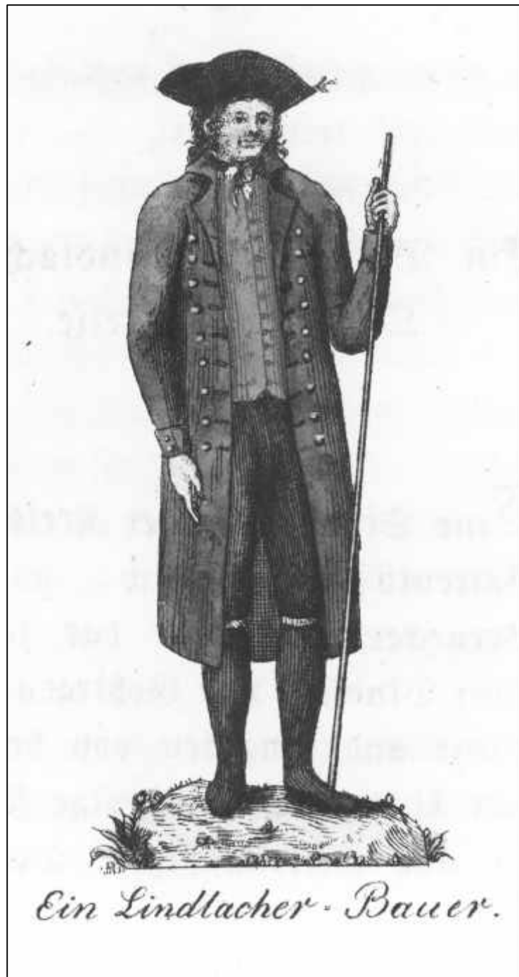
1.1 Anonym, Ein Lindlacher Bauer, um 1810-1818.