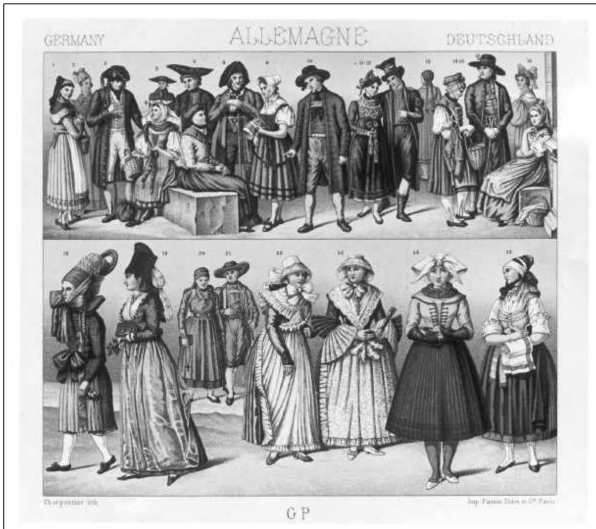
1.9 Charpentier, Le costume historique. Germany - Allemagne - Deutschland (Detail Nr. 22/ 23, Baireuther-Bürgersfrauen. Des femmes bourgeoises de Baireuth), 1888.