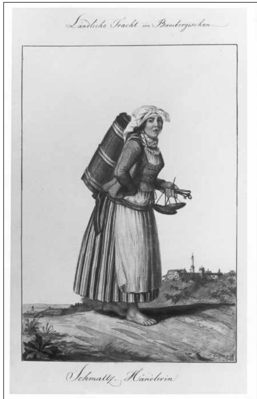
3.5 Margarethe Geiger, Ländliche Tracht im Bambergischen. Schmaltz-Händlerin, um 1806.