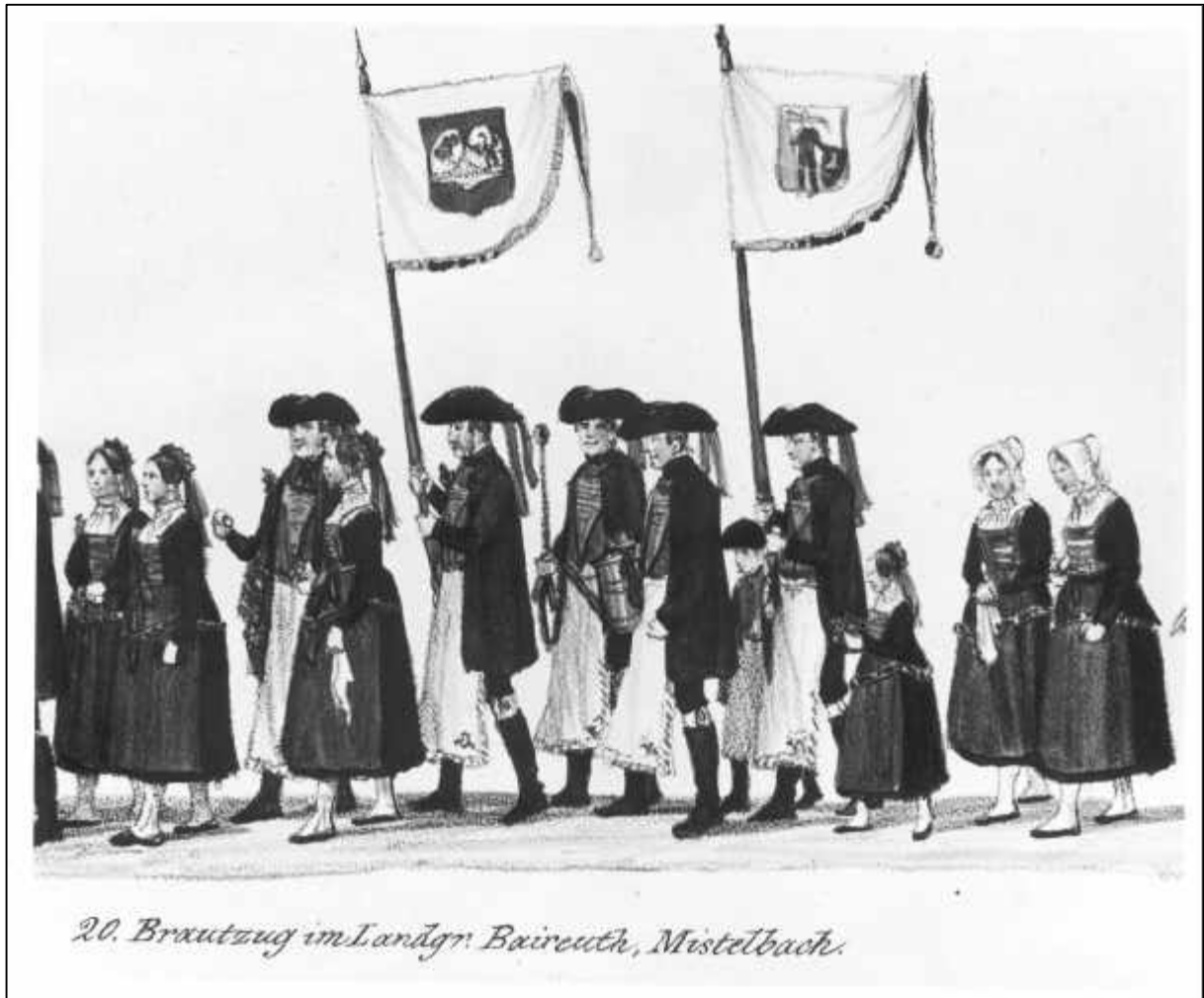
2.13 Gustav Kraus, Festzug der 35 Brautpaare zur Vermählungsfeier Sr. Königlichen Hoheit des Kronprinzen Maximilian von Bayern, u. Ir. Königlichen Hoheit der Kronprinzeß Marie von Bayern, im Vorbeiziehen vor dem Königszelt bey dem Oktoberfeste in München den 16ten Okt. 1842. Blatt III.

20. Brautzug im Landgr. Baireuth, Mistelbach (Detail), 1842.