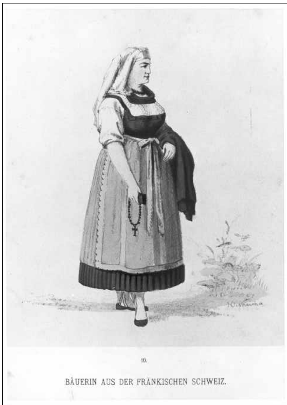
4.16 Heinrich Oestreicher, 10. Kostüm-Bilder. Bäuerin aus der Fränkischen Schweiz, um 1888.