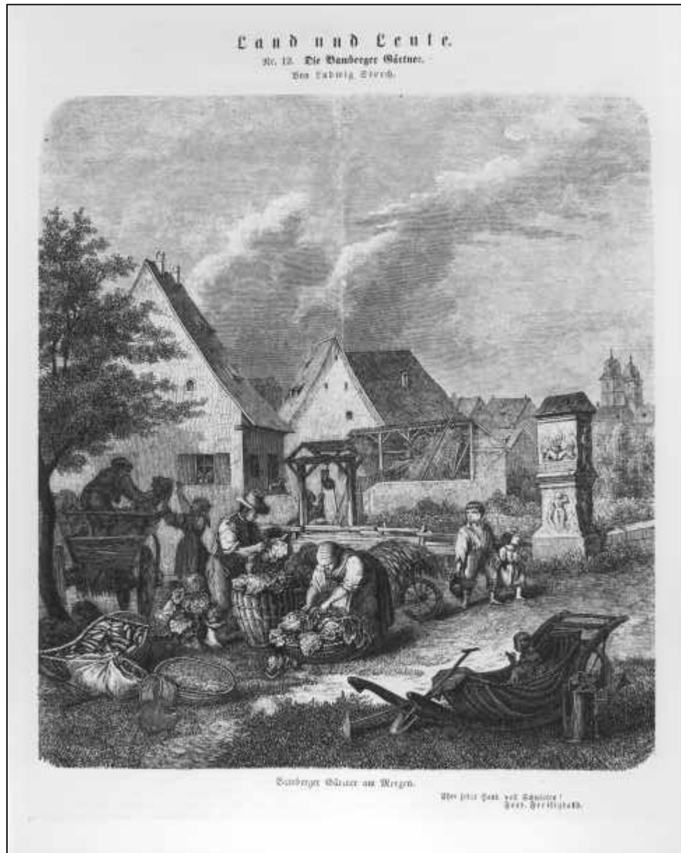
3.34 Eduard Schade, Die Bamberger Gärtner. Bamberger Gärtner am Morgen, um 1850.