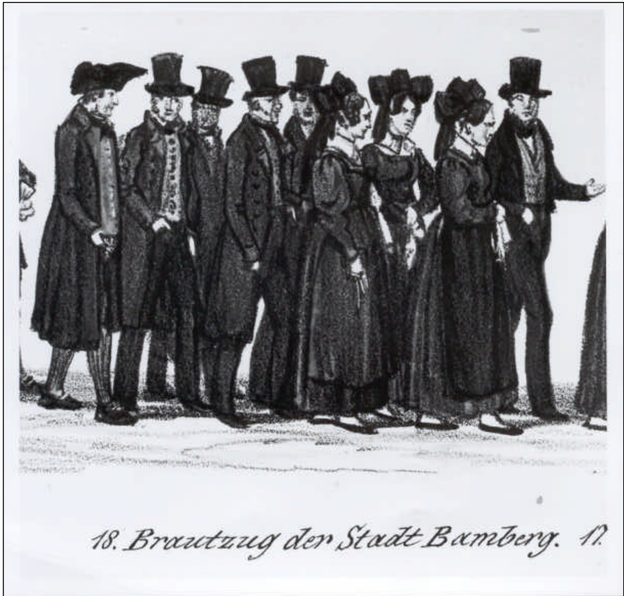
3.31 Gustav Kraus, Festzug der 35 Brautpaare zur Vermählungsfeier Sr. Königlichen Hoheit des Kronprinzen Maximilian von Bayern, u. Ir. Königlichen Hoheit der Kronprinzeß Marie von Bayern, im Vorbeiziehen vor dem Königszelt bey dem Oktoberfeste in München den 16ten Okt. 1842, Blatt II. 18. Brautzug der Stadt Bamberg (Detail), 1842.