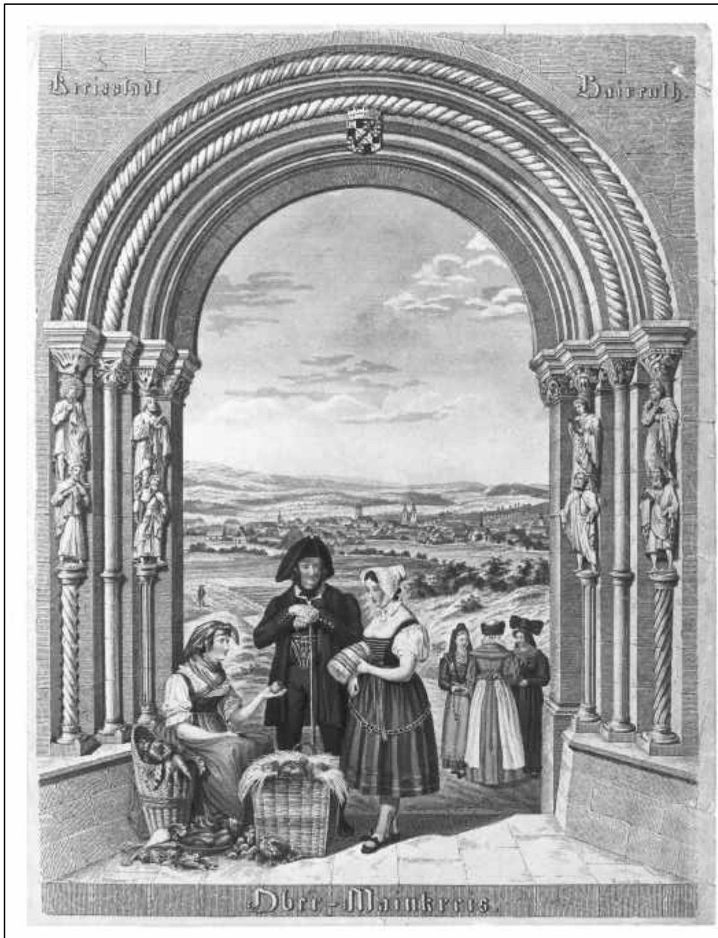
6.2 Wagner/ Carl Kreul, Kreisstadt Baireuth. Ober-Mainkreis. Zwei Frauen aus Redwitz (Detail), 1836.