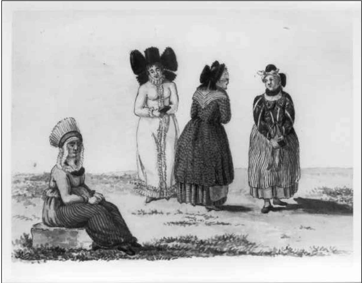
3.11 Stephan von Stengel, Vier Frauen in Tracht. Drei Bambergerinnen (Detail), um 1810-20.