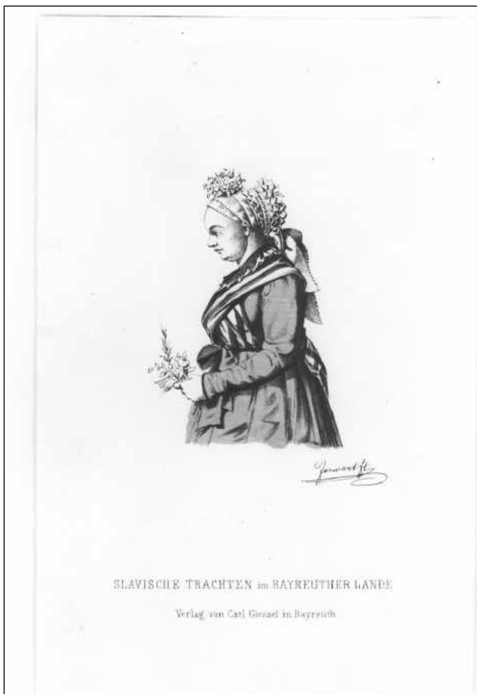
2.23 Sixtus Jarwart, Slavische Trachten im Bayreuther Lande. Büste einer Mistelgauer Braut, 1857/ 58.