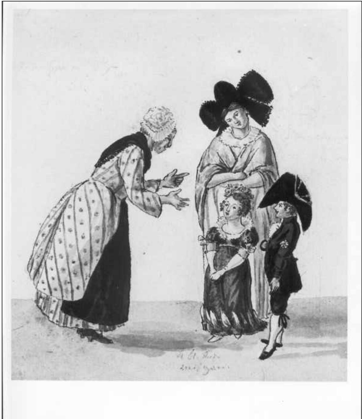
3.10 Stephan von Stengel, Bürgerliche Kleidungsweise je zweier Frauen und Kinder, um 1810-20.