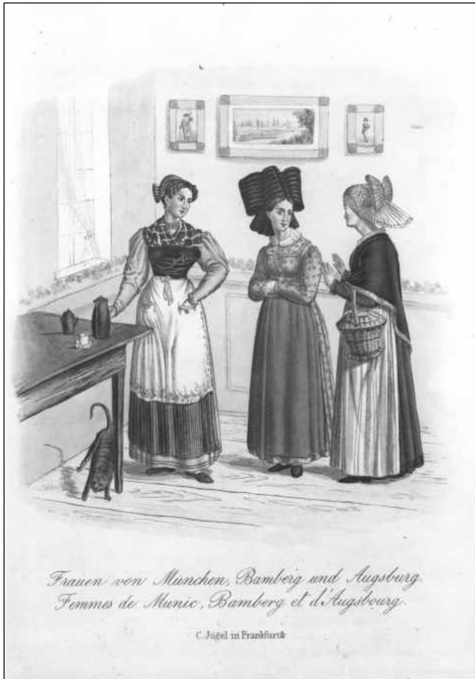
3.33 Anonym, Frauen von München, Bamberg und Augsburg. Femmes de Munich, Bamberg et d'Augsbourg, um 1845.