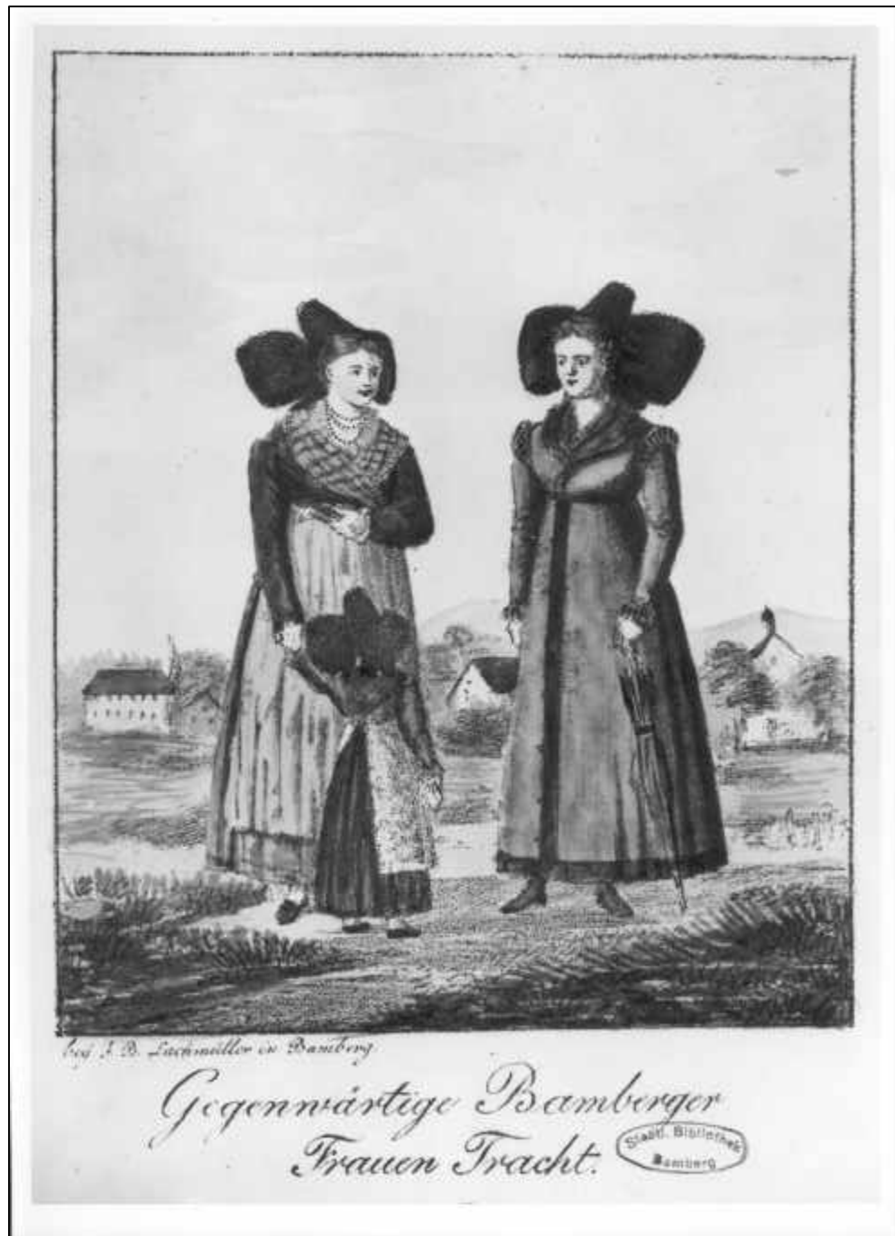
3.17 Franz Sebastian Scharnagel, Gegenwärtige Bamberger Frauen Tracht, um 1815-22.