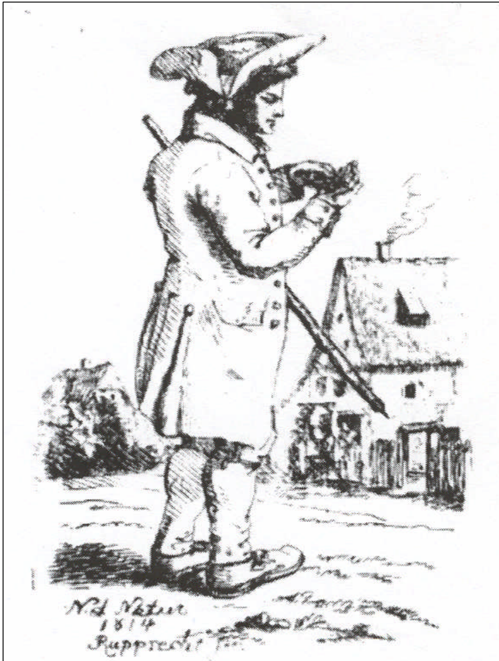
3.14 Friedrich Karl Rupprecht, Geldzählender Bauer, 1815.