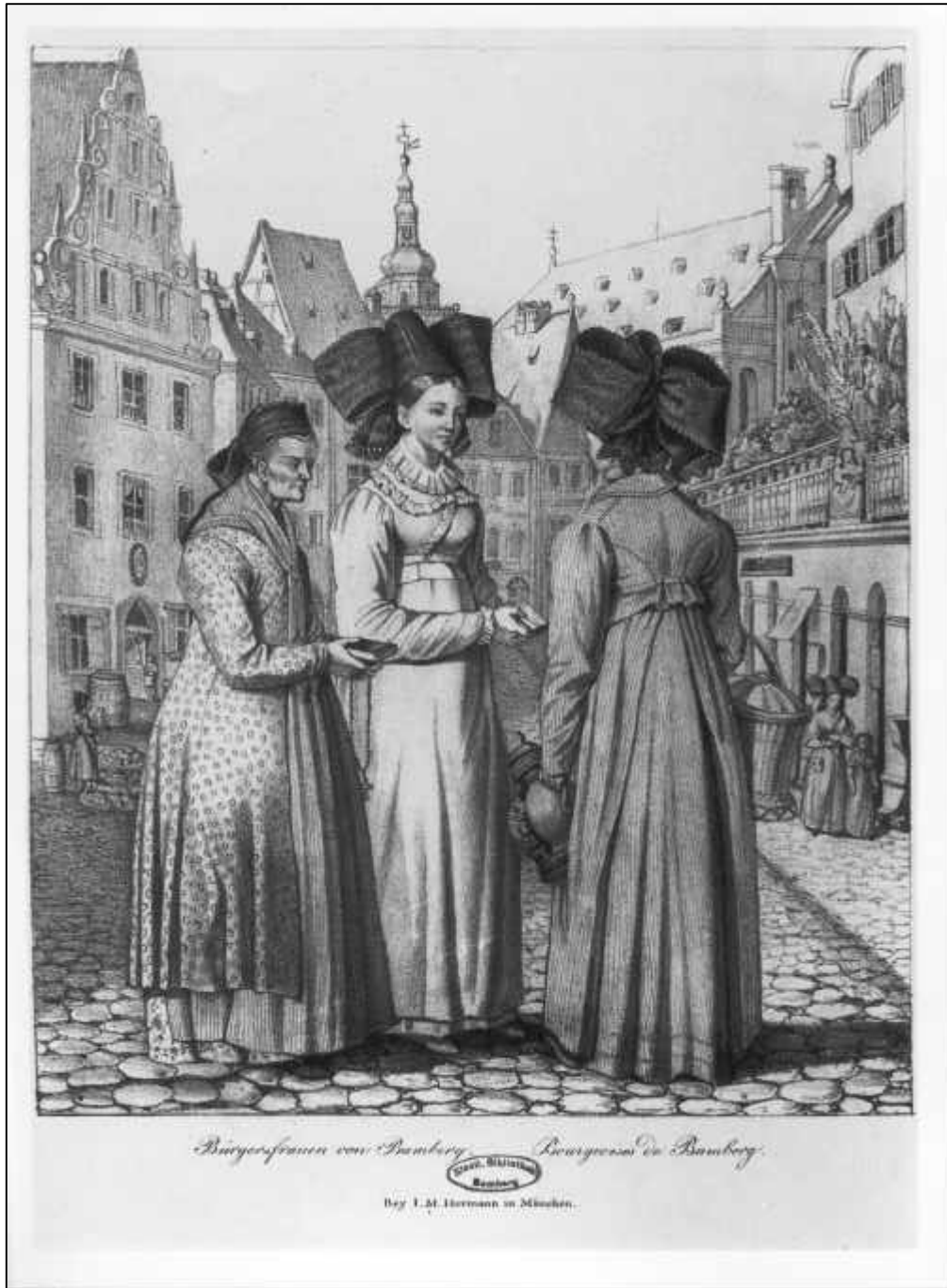
3.23 Anonym, Bürgerfrauen von Bamberg. Bougeoises de Bamberg, um 1825-30.