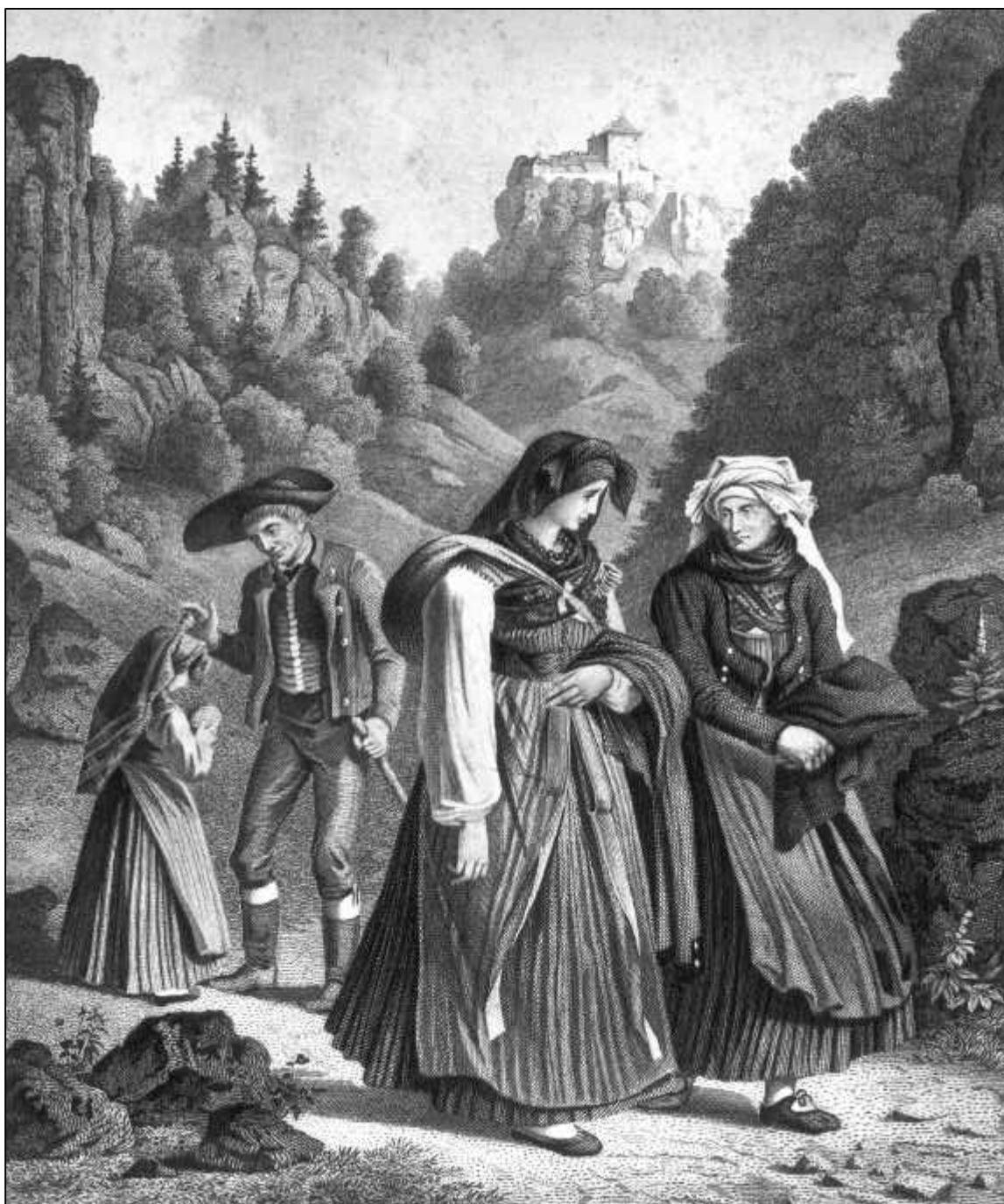
4.8 R.Geißler/ W.Schroll, In der fränkischen Schweiz. Tracht im Wiesentthal bei Rabeneck, um 1850.