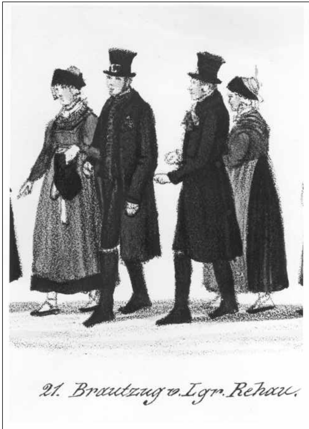
5.2 Gustav Kraus, Festzug der 35 Brautpaare zur Vermählungsfeier Sr. Königlichen Hoheit des Kronprinzen Maximilian von Bayern, u. Ir. Königlichen Hoheit der Kronprinzeß Marie von Bayern, im Vorbeiziehen vor dem Königszelt bey dem Oktoberfeste in München den 16ten Okt. 1842. Blatt II.

21. Brautzug v. Lgr. Rehau (Detail), 1842.