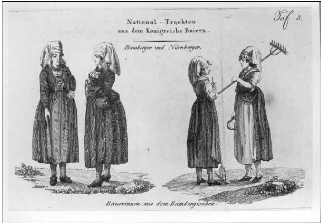
3.13 G.W. Kraus, National - Trachten aus dem Königreiche Bayern. Bamberger und Nürnberger. Bäuerinnen aus dem Bambergischen (Detail), 1813.