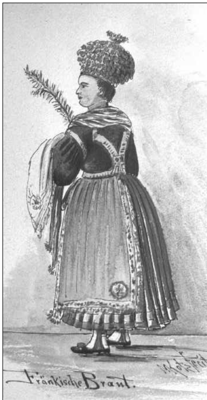
4.12 Michael Kotz, Fränkische Braut, um 1880-85.