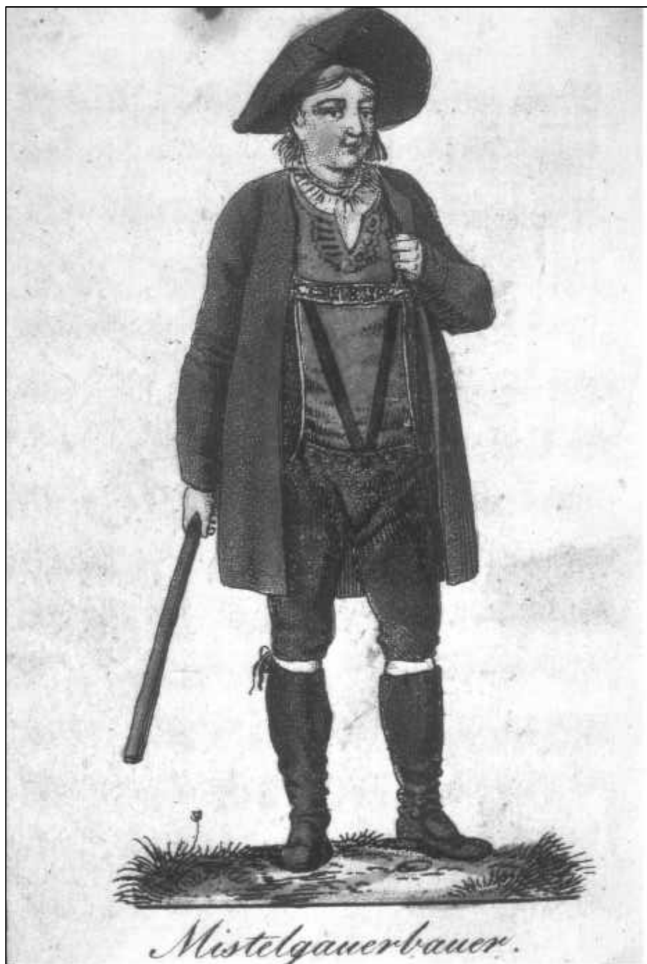
2.2 Anonym, Mistelgauerbauer, um 1810-1815.