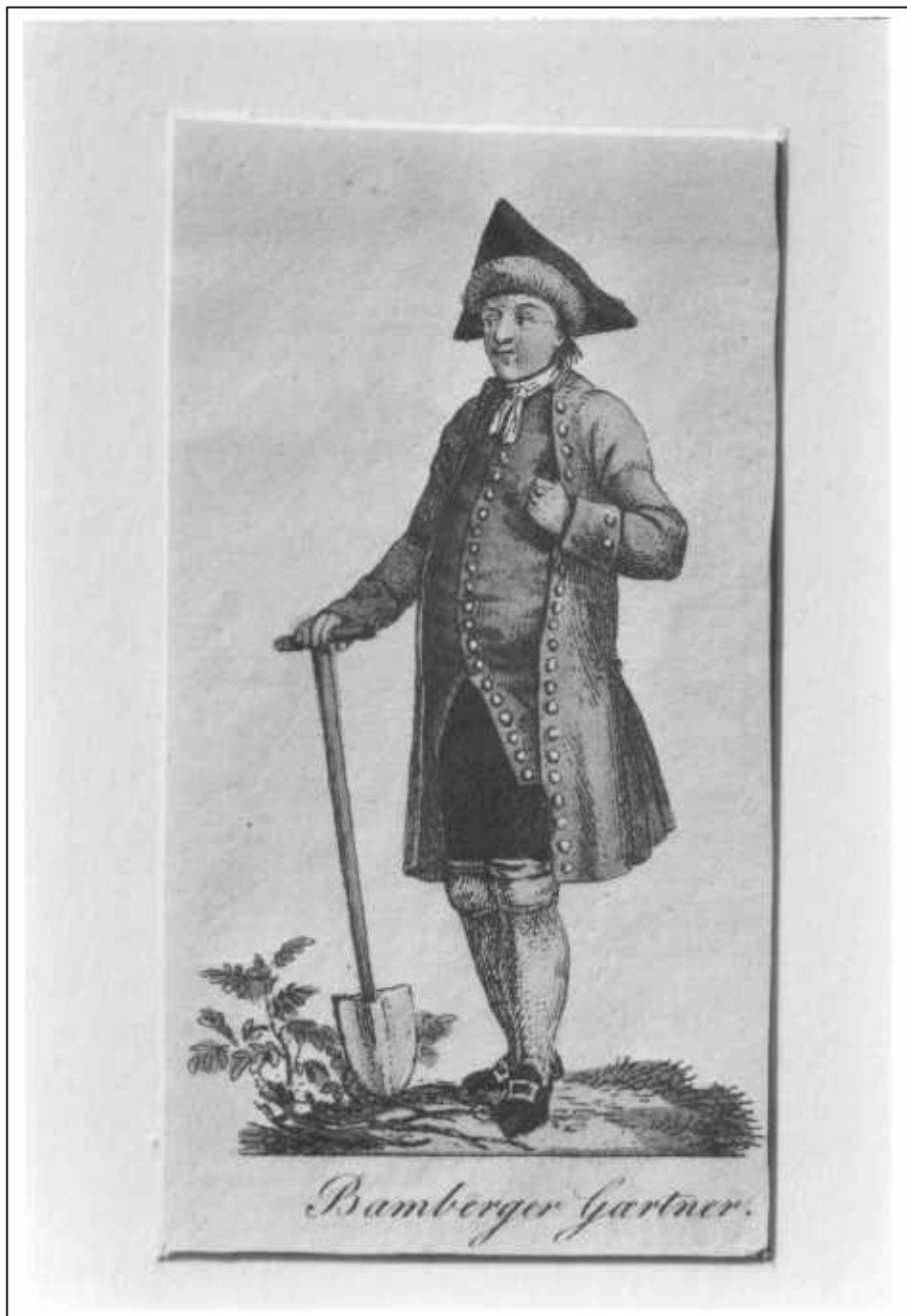
3.1 Anonym, Bamberger Gärtner, um 1790.