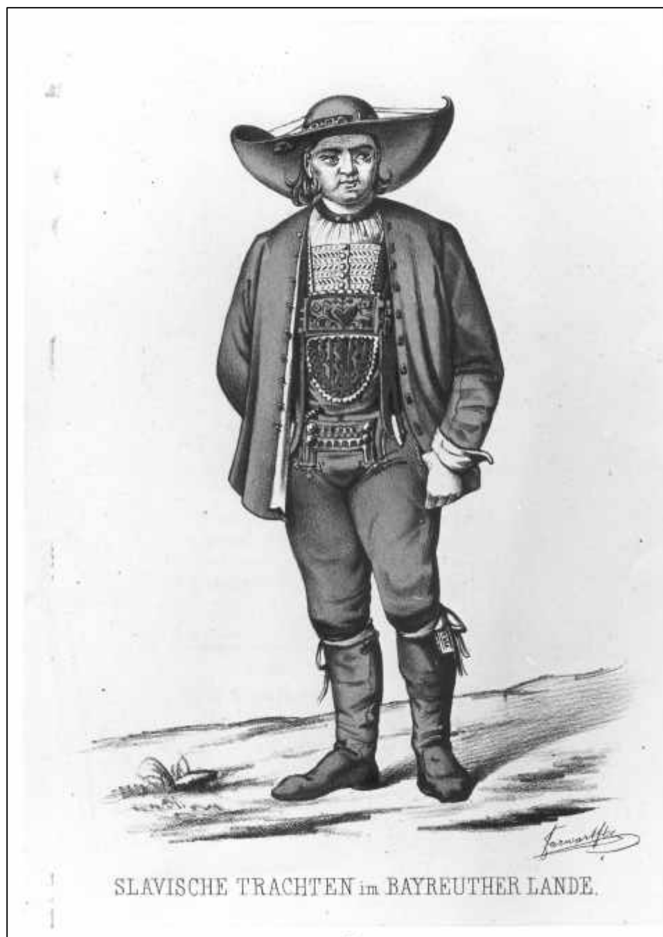
2.19 Sixtus Jarwart, Slavische Trachten im Bayreuther Lande. Mistelgauer Bauer mit Schaufelhut, 1857/ 58.