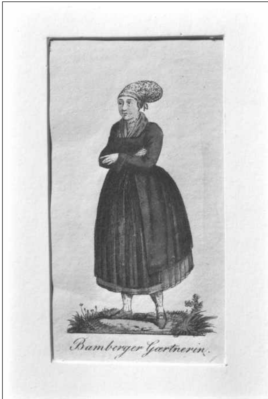
3.2 Anonym, Bamberger Gärtnerin, um 1790.