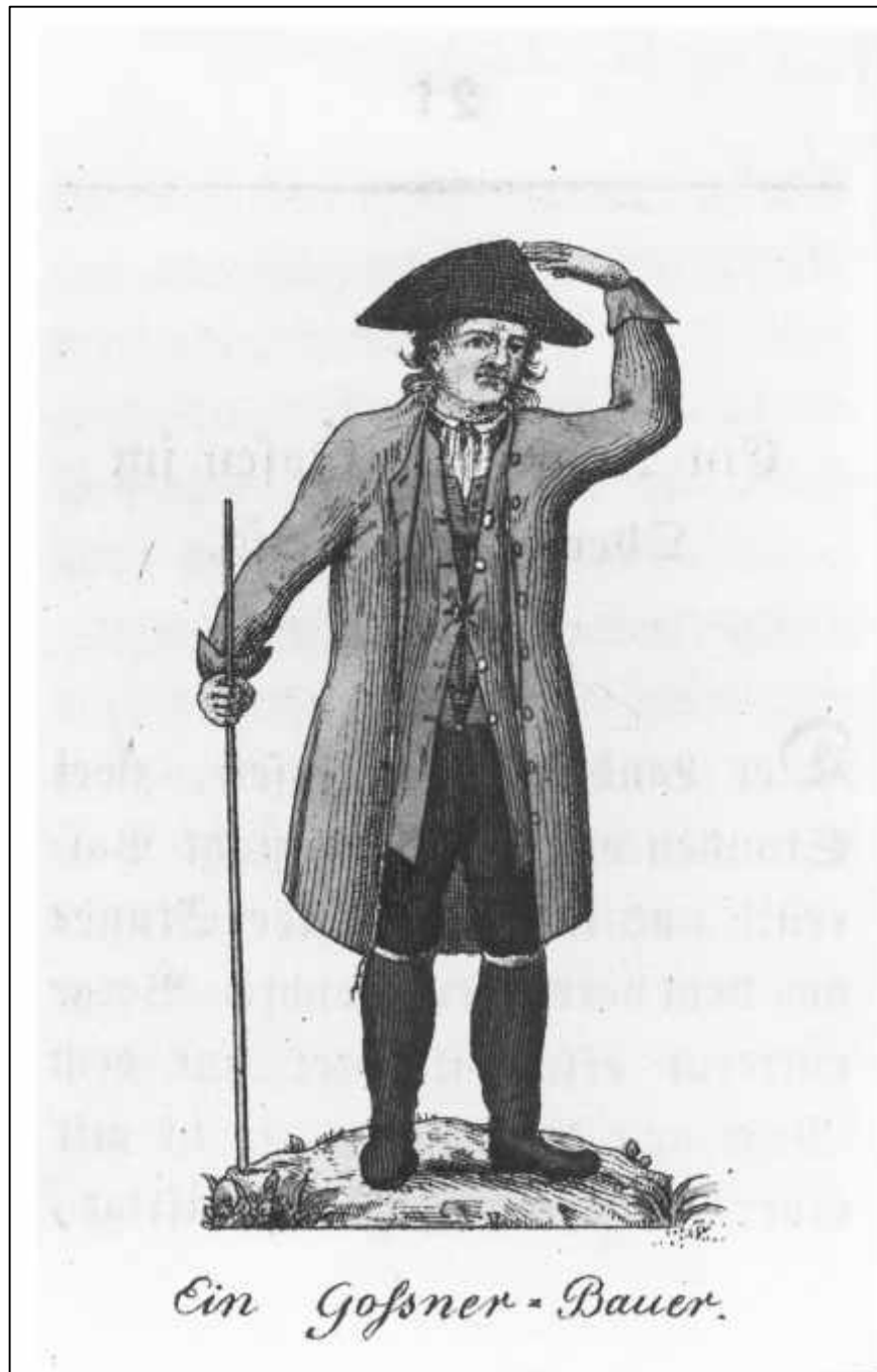
1.3 Anonym, Ein Gohsener Bauer, um 1810-1818.