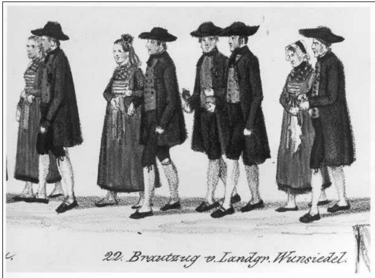
5.1 Gustav Kraus, Festzug der 35 Brautpaare zur Vermählungsfeier Sr. Königlichen Hoheit des Kronprinzen Maximilian von Bayern, u. Ir. Königlichen Hoheit der Kronprinzeß Marie von Bayern, im Vorbeiziehen vor dem Königszelt bey dem Oktoberfeste in München den 16ten Okt. 1842, Blatt III.