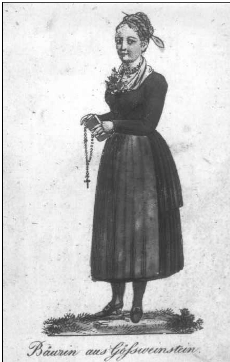
4.2 Anonym, Bäuerin aus Gößweinstein, um 1810-1815.