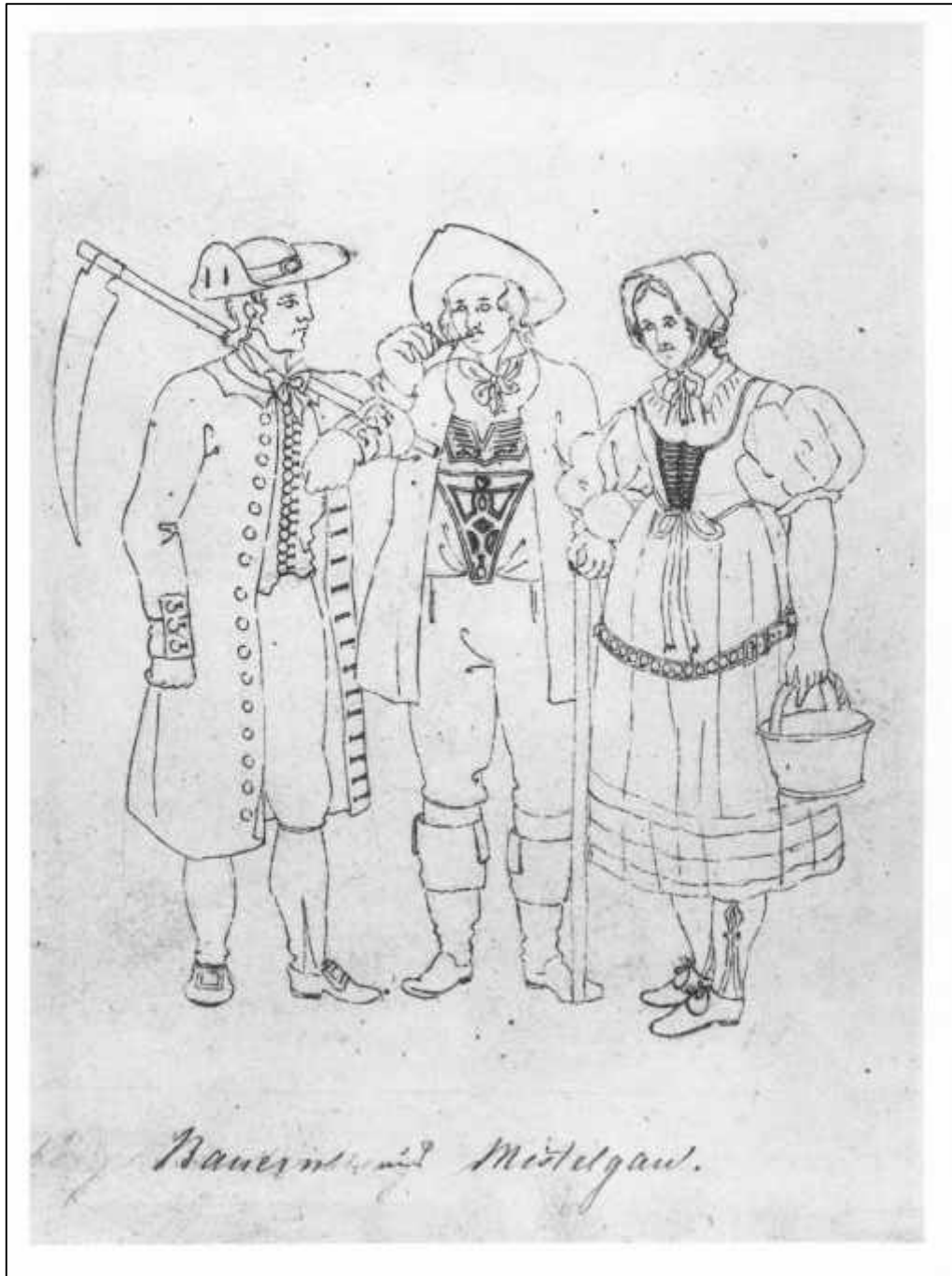
2.8 Carl Theodor von Buseck, Bauern aus Mistelgau, um 1830.