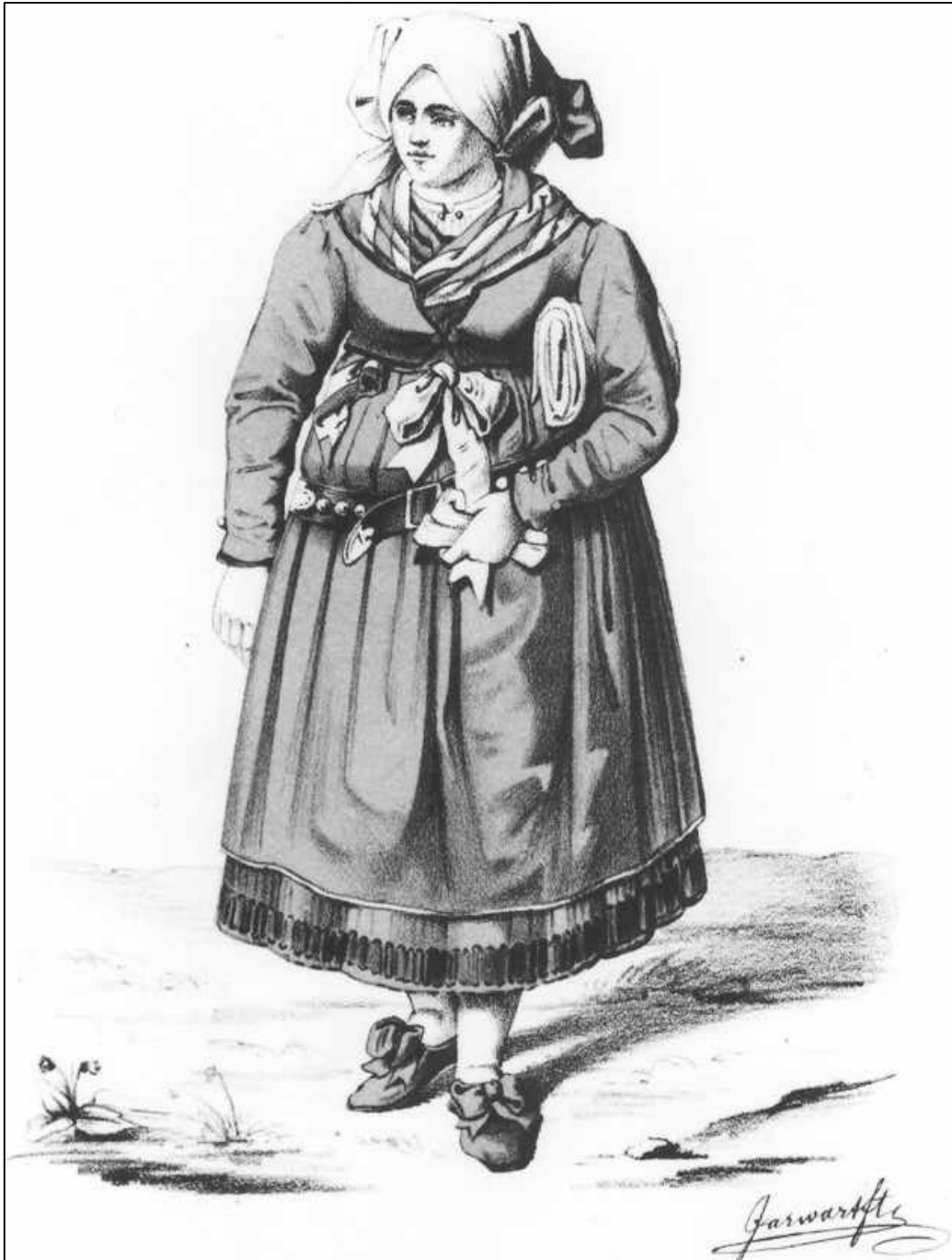
2.22 Sixtus Jarwart, Slavische Trachten im Bayreuther Lande. Junge Mistelgauer Bäuerin, 1857/ 58.