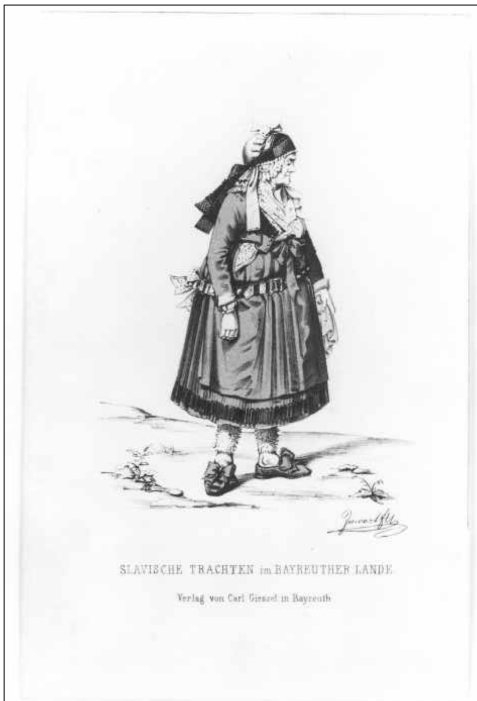
2.24 Sixtus Jarwart, Slavische Trachten im Bayreuther Lande. Alte Mistelgauer Bäuerin, 1857/ 58.