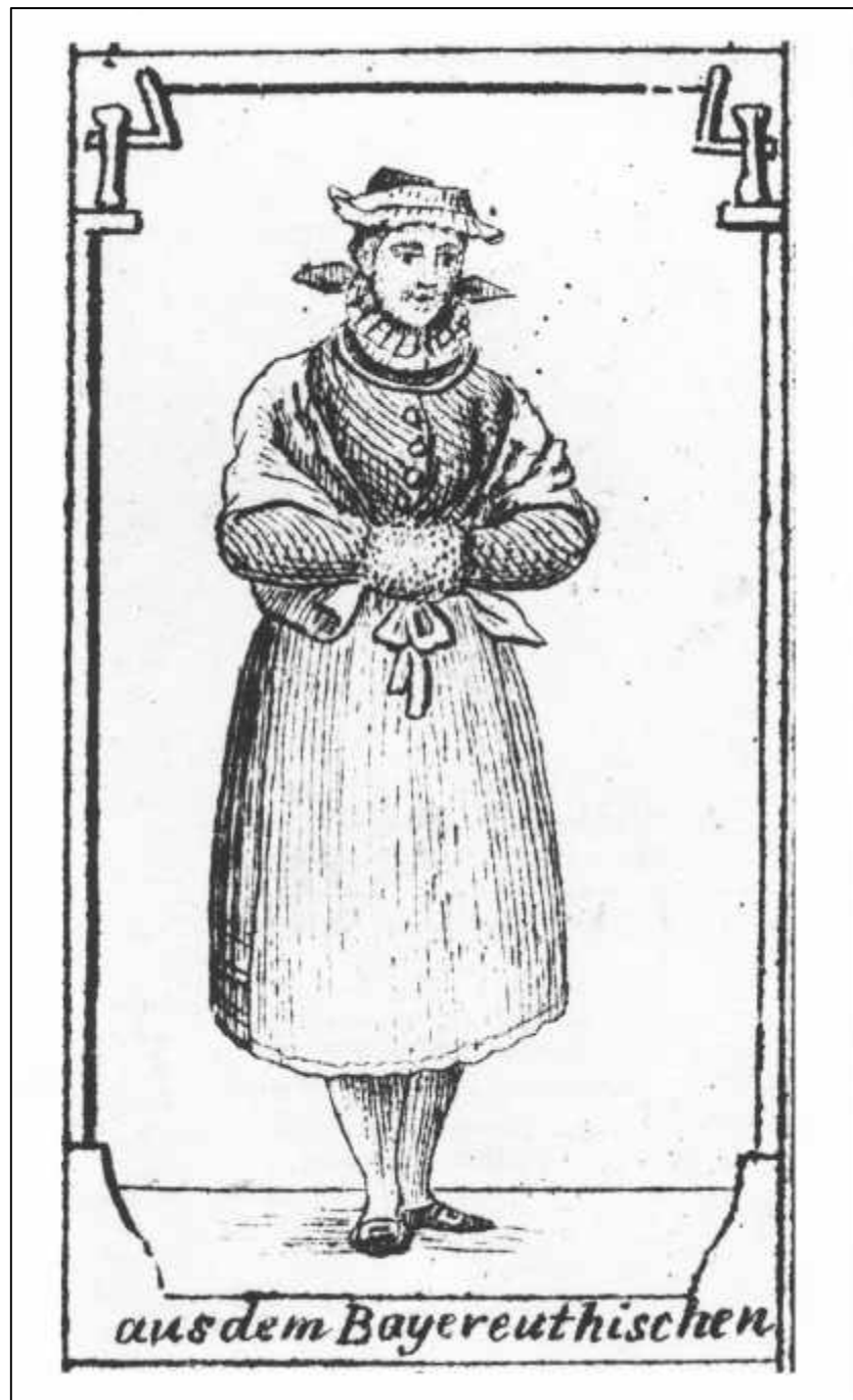
1.7 Anton Falger, Koenigreich Bayern. Aus dem Bayereuthischen (Detail), 1826.