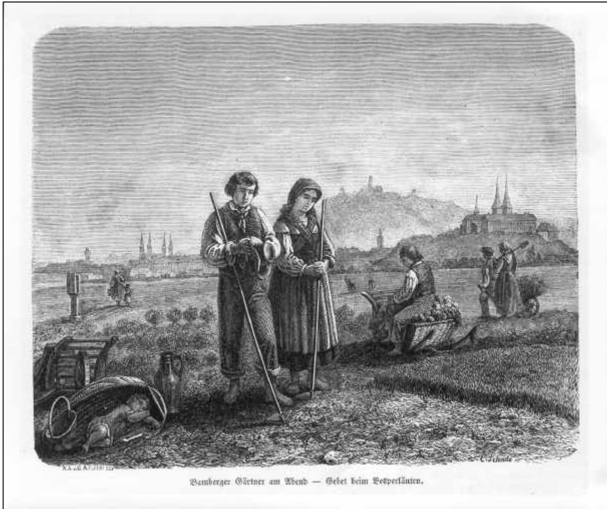
3.35 Eduard Schade, Bamberger Gärtner am Abend - Gebet beim Vesperläuten, um 1850.