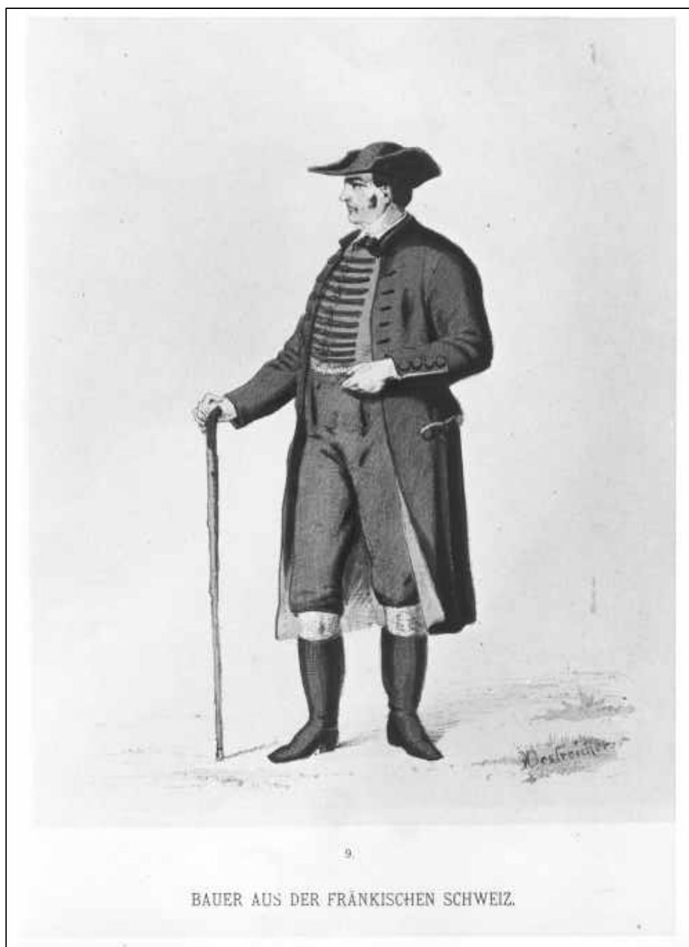
4.15 Heinrich Oestreicher, 9. Kostüm-Bilder. Bauer aus der Fränkischen Schweiz, um 1888.