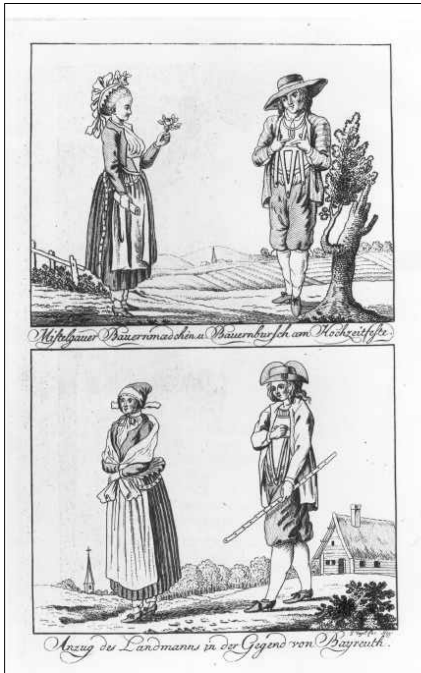
2.1 G.Vogel, Mistelgauer Bauernmädchen und Bauernbursch am Hochzeitsfeste.