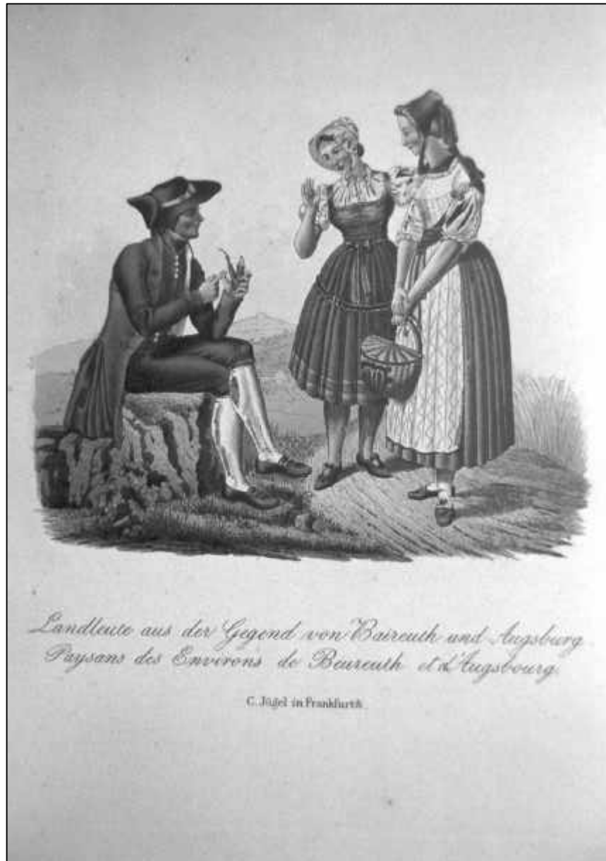
2.7 Anonym, Landleute aus der Gegend von Bairceuth und Augsburg. Paysans des Environs de Beureuth et D'Augsbourg, um 1822-1830.