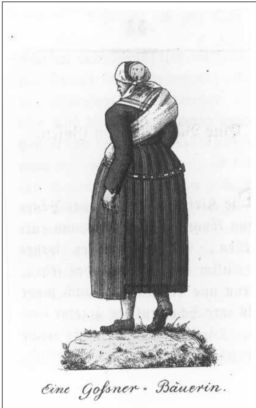
1.4 Anonym, Eine Gohsener Bäuerin, um 1810-1818.