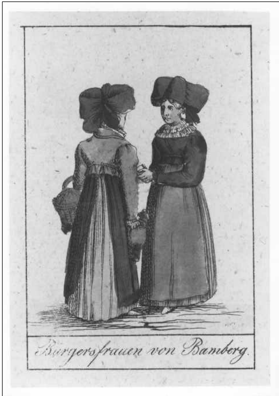
3.27 Anonym, Bayerische National-Trachten. Bürgersfrauen von Bamberg (Detail), um 1830.