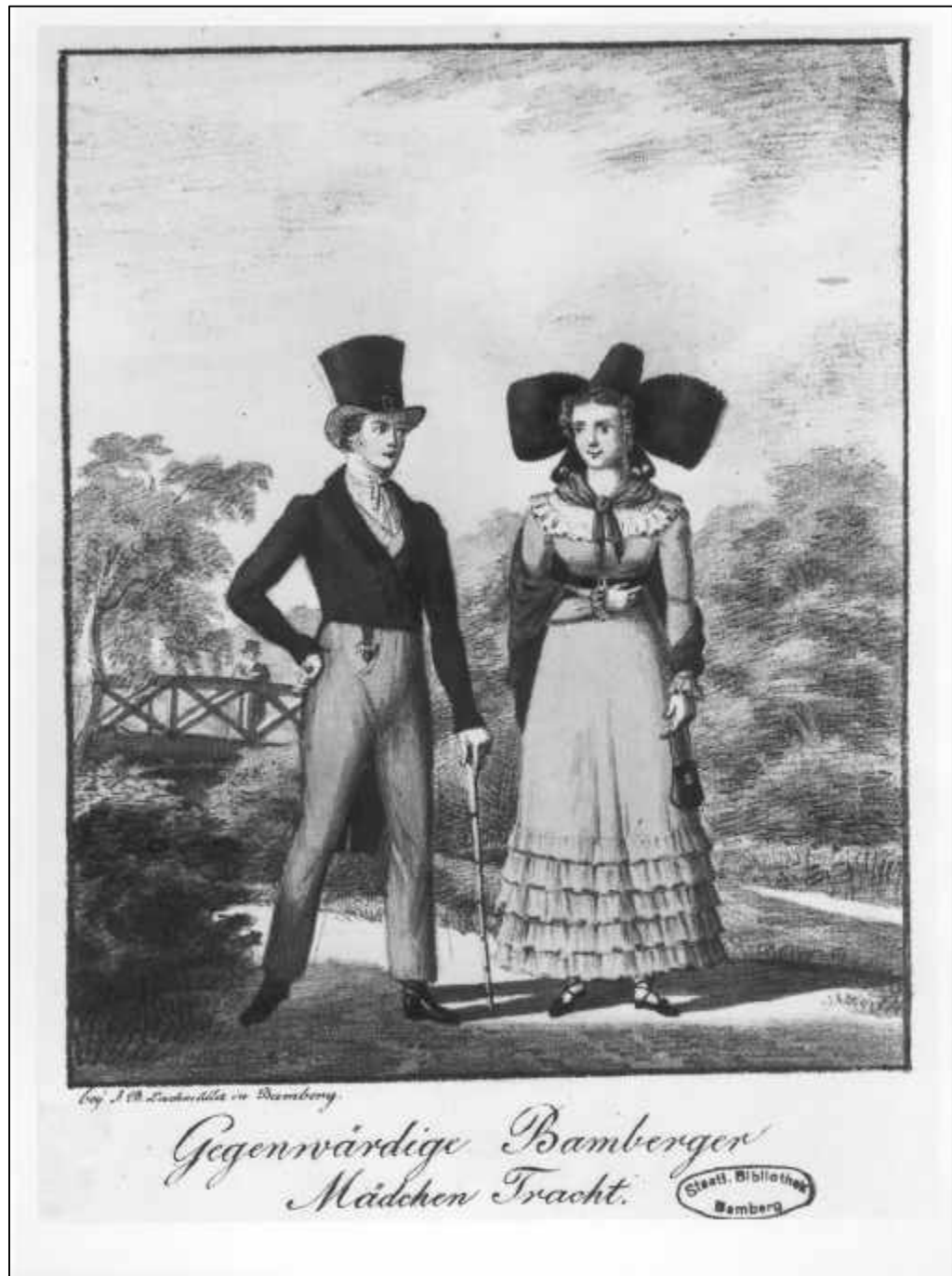
3.19 Franz Sebastian Scharnagel, Gegenwärtige Bamberger Mädchen Tracht, um 1820-22.