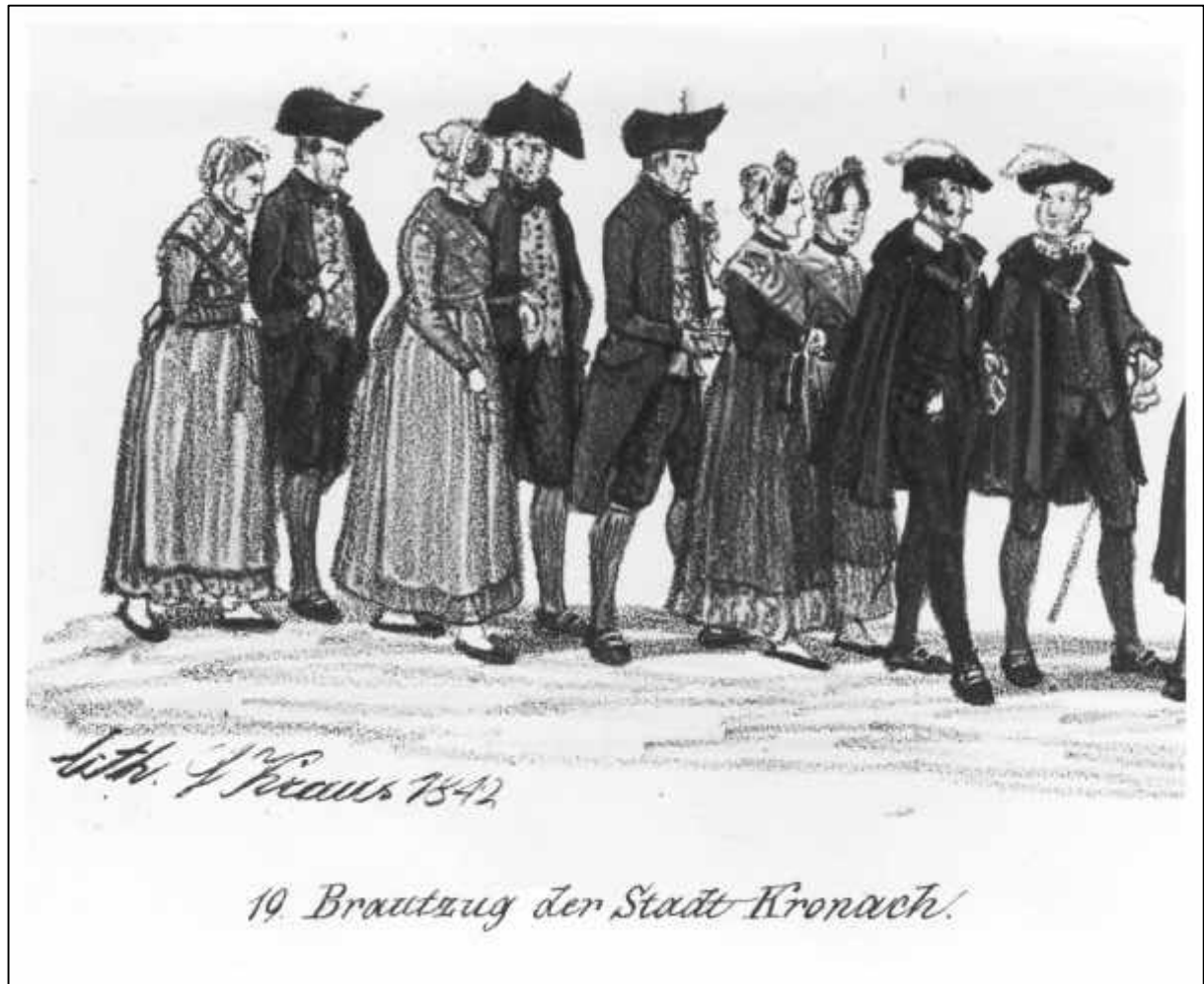
6.3 Gustav Kraus, Festzug der 35 Brautpaare zur Vermählungs-feier Sr. Königlichen Hoheit des Kronprinzen Maximilian von Bayern, u. Ir. Königlichen Hoheit der Kronprinzeß Marie von Bayern im Vorbeiziehen vor dem Königszelt bey dem Oktoberfeste in München den 16ten Okt. 1842, Blatt II.

19. Brautzug der Stadt Kronach (Detail), 1842.